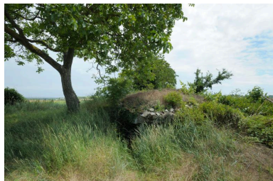
Vue générale. IVR52_20124901311NUCA