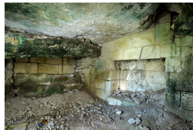
Aménagements du XIXe siècle (cheminée, murs) sous les dalles effondrées du dolmen. IVR52_20124901312NUCA