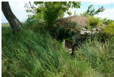
Vue d'ensemble, avec entrée sous le dolmen effondré. IVR52_20124901313NUCA