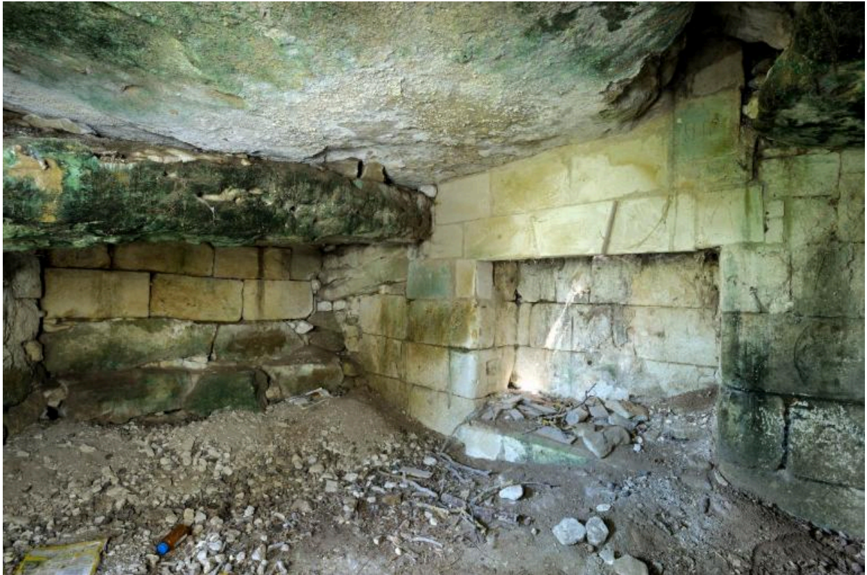
Aménagements du XIXe siècle (cheminée, murs) sous les dalles effondrées du dolmen.