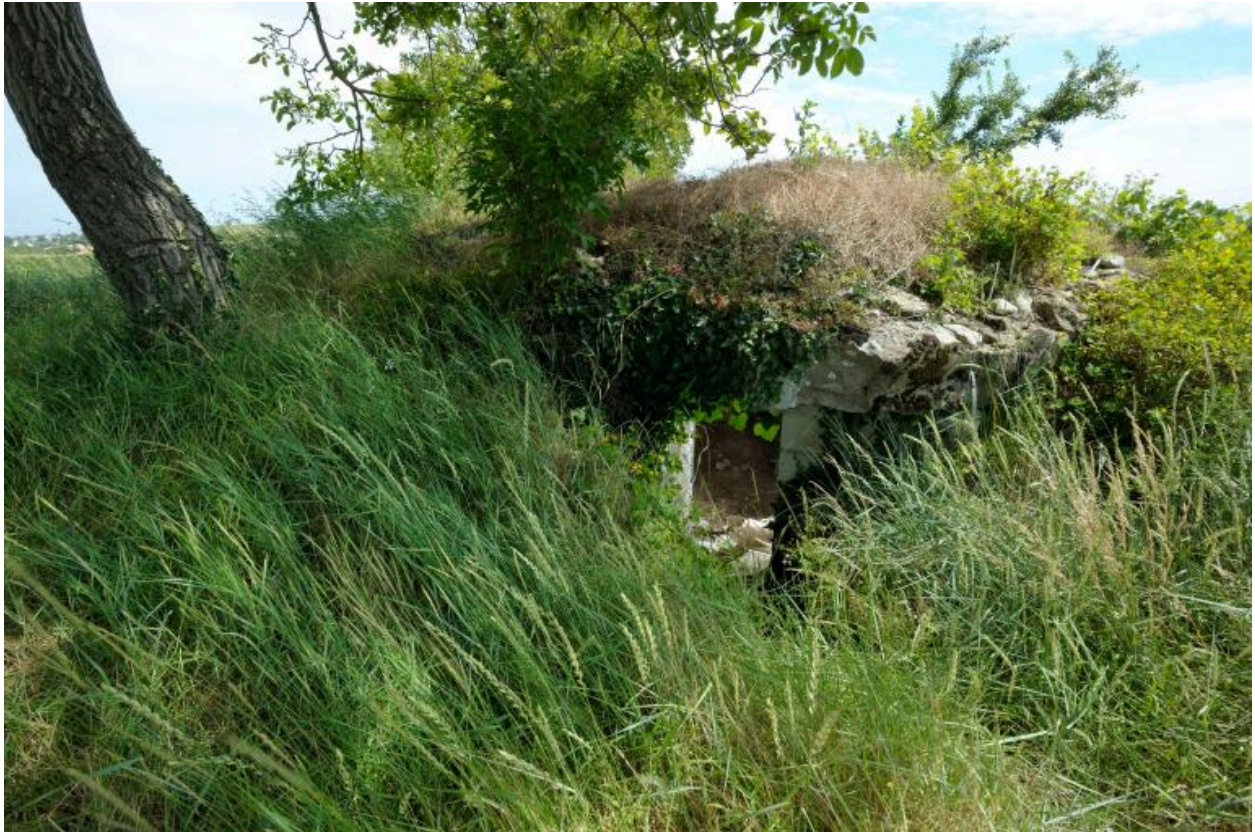
Vue d'ensemble, avec entrée sous le dolmen effondré.