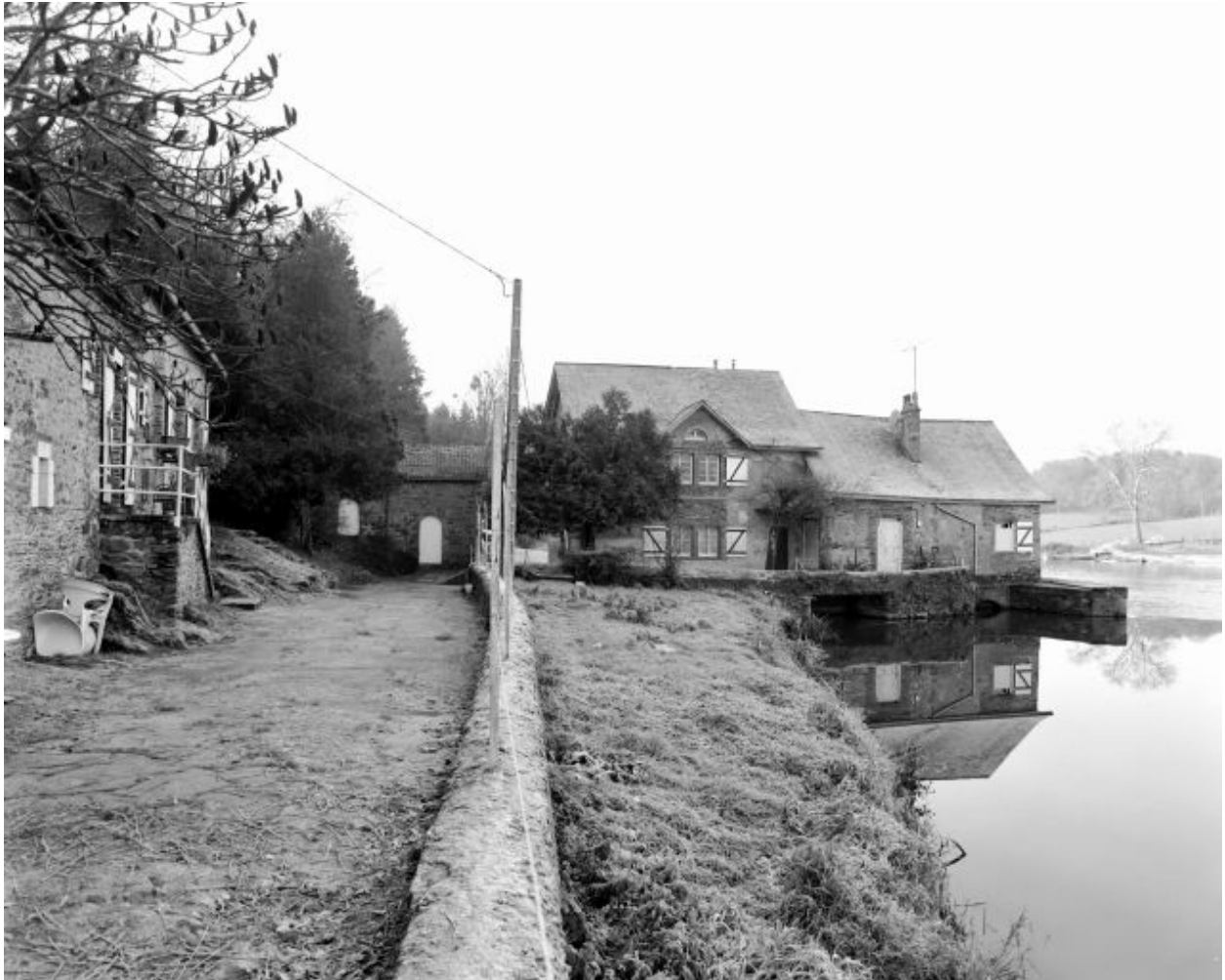
Façades nord de l'ancienne étable à vaches, du moulin à tan et du moulin à farine. A gauche au premier plan, l'ancien logis.