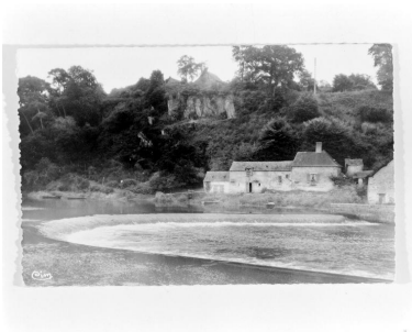
Vue depuis la rive droite des dépendances situées au nord du moulin, en 1951 : toit à porcs, étable à chevaux, logis, fournil, poulailler.