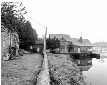
Façades nord de l'ancienne étable à vaches, du moulin à tan et du moulin à farine. A gauche au premier plan, l'ancien logis.