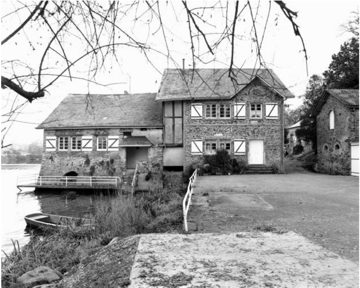
Façades sud (aval) des moulins à farine et à tan. A droite, pignon ouest de l'ancienne étable à vache. Au fond, l'ancien logis.