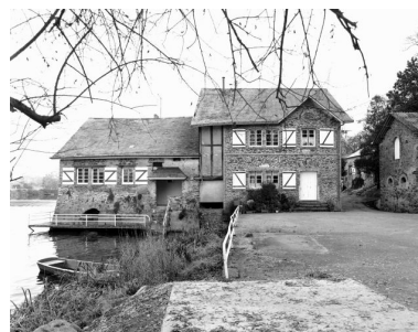
Façades sud (aval) des moulins à farine et à tan. A droite, pignon ouest de l'ancienne étable à vache. Au fond, l'ancien logis.