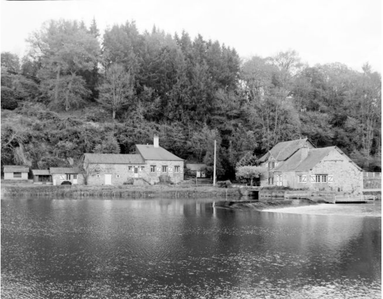
Vue d'ensemble du site du moulin depuis la rive droite en amont : ancien toit à porcs (transformé), ancienne étable à chevaux, ancien logis, anciens moulins à tan et à farine.