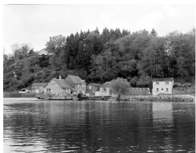
Vue d'ensemble du site du moulin depuis la rive droite en aval : ancien toit à porcs (transformé), ancienne étable à chevaux, anciens moulins à farine et à tan, ancienne étable à vaches, ancienne grange (défigurée).