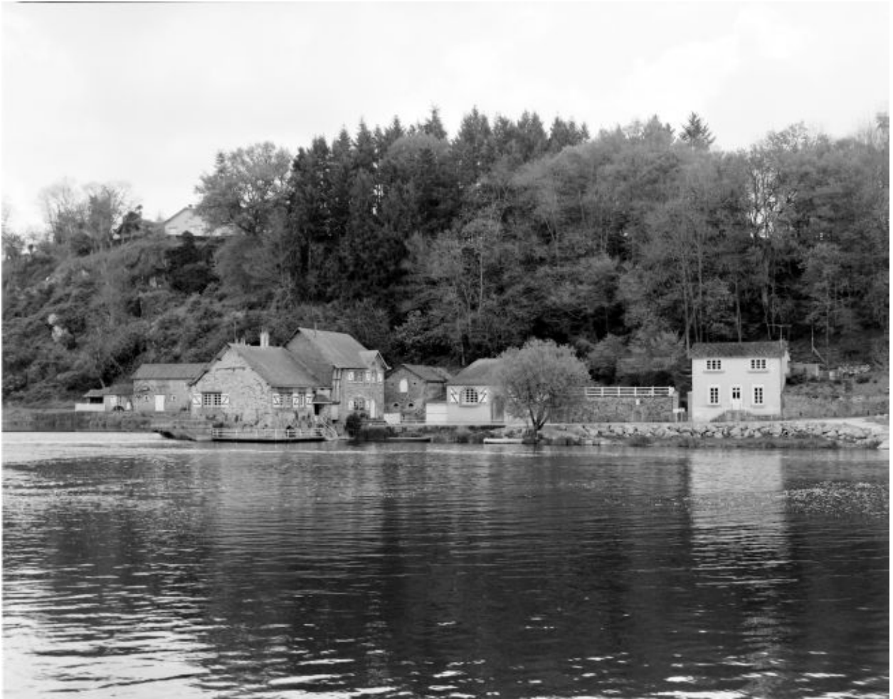
Vue d'ensemble du site du moulin depuis la rive droite en aval : ancien toit à porcs (transformé), ancienne étable à chevaux, anciens moulins à farine et à tan, ancienne étable à vaches, ancienne grange (défigurée).