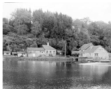
Vue d'ensemble du site du moulin depuis la rive droite en amont : ancien toit à porcs (transformé), ancienne étable à chevaux, anciens logis, anciens moulins à tan et à farine.