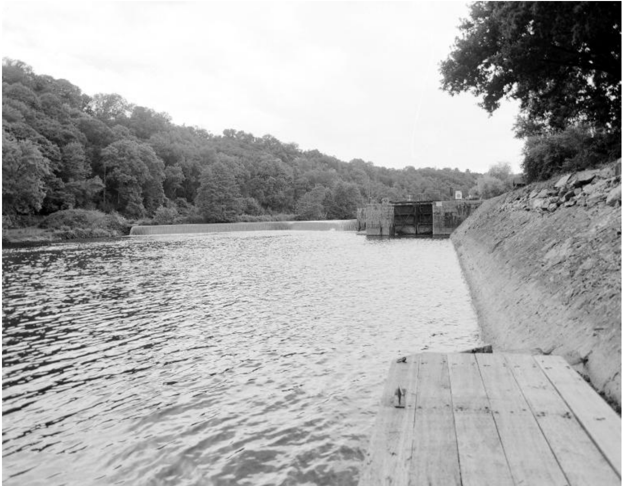
Vue d'ensemble du site depuis la rive gauche en aval : barrage, centrale micro-électrique, écluse.