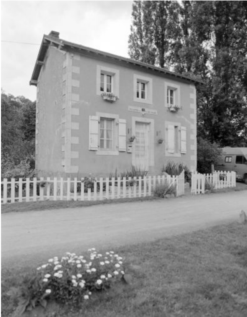
La maison éclusière.