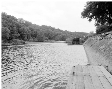
Vue d'ensemble du site depuis la rive gauche en aval : barrage, centrale micro-électrique, écluse.

Autr. Charles Dupuy, Phot. François Lasa IVR52_20025300269X