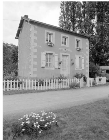
La maison éclusière. IVR52_20025301007X