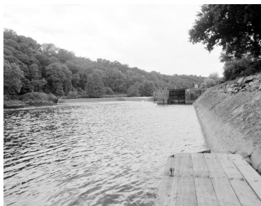
Vue d'ensemble du site depuis la rive gauche en aval : barrage, centrale micro-électrique, écluse.