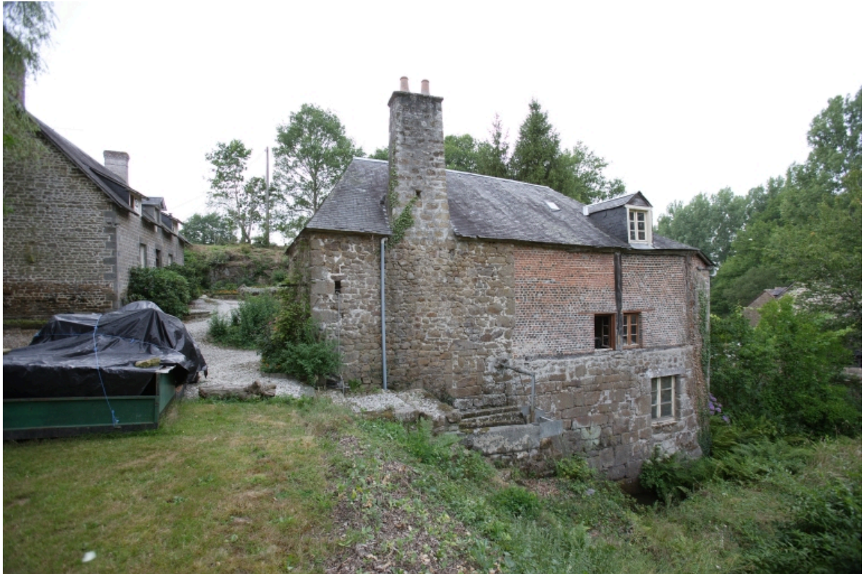
Le moulin à farine sur le ruisseau : élévation est avec la chute d'eau. A gauche, la maison.