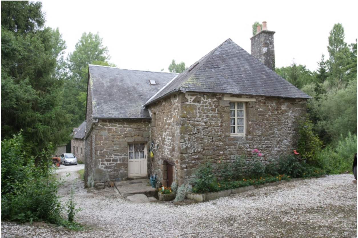
Le moulin à farine sur le ruisseau : élévations ouest et sud. Au fond, l'étable.