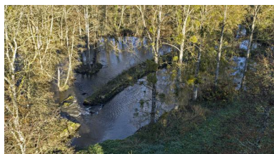
Etang du Boulay.