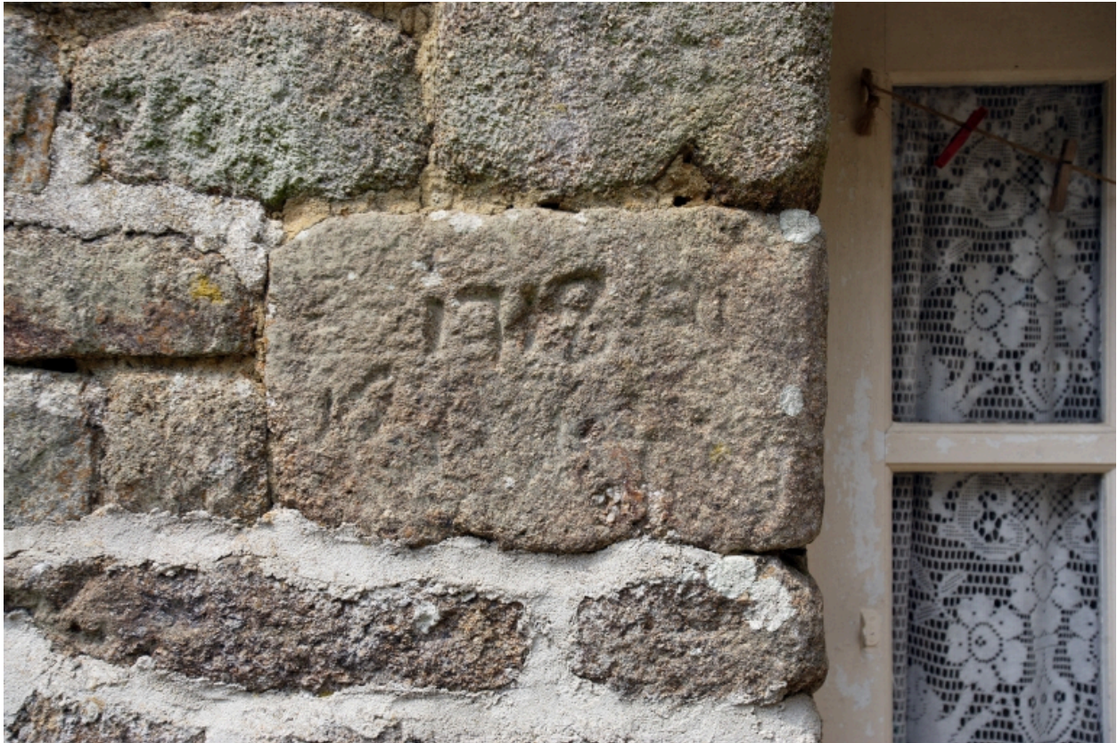
Le moulin à farine sur le ruisseau, élévation sud de la partie moulin : date portée sur le jambage de la porte d'entrée.