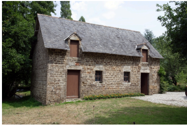
L'étable.