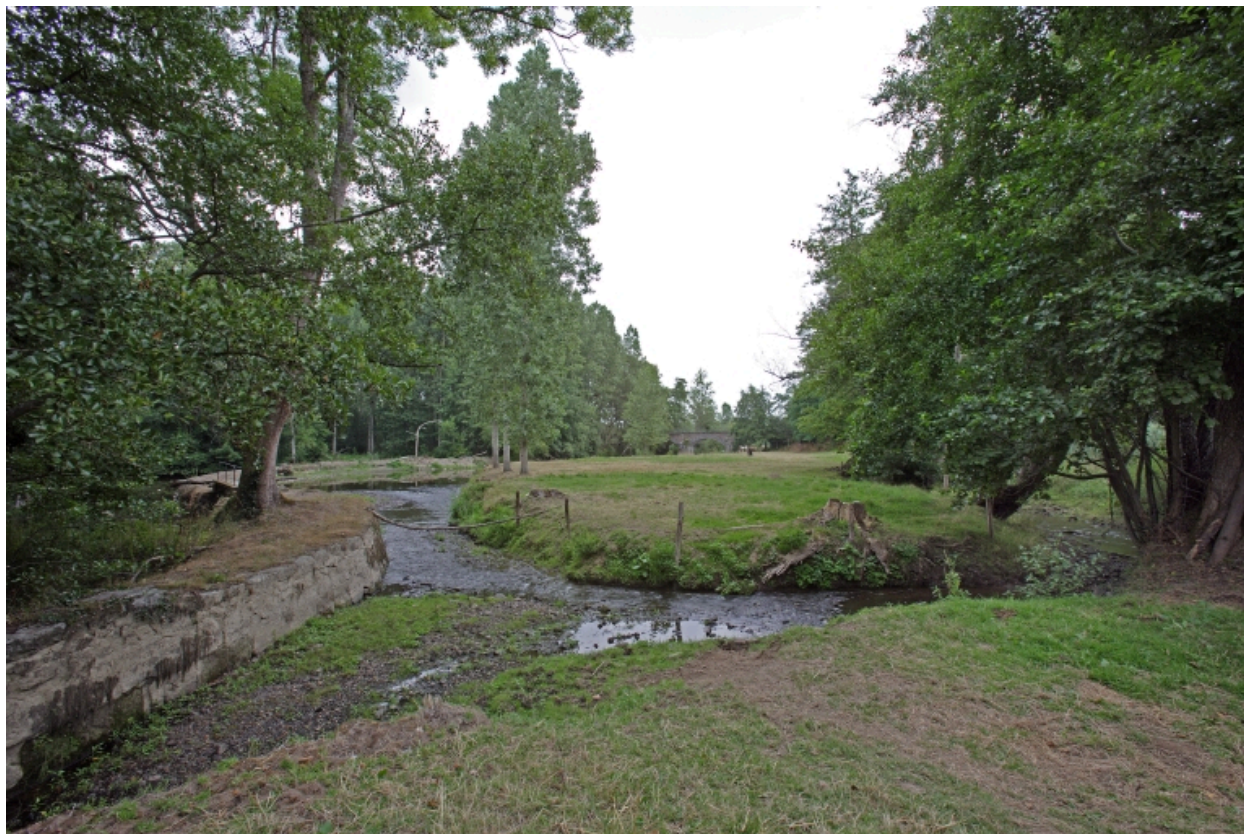
Le barrage sur la Mayenne, le canal d'alimentation du moulin et l'embouchure du ruisseau de Lassay vus depuis le moulin au sud-ouest.