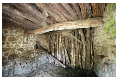
La buanderie ou logement, actuellement bergerie : vue intérieure depuis l'entrée au sud.