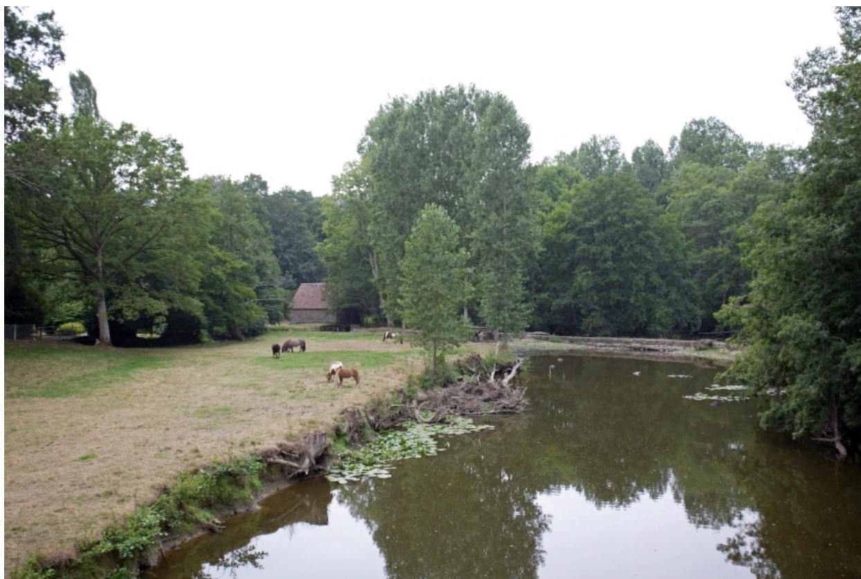
Le moulin à farine sur la Mayenne et le barrage vus depuis le pont du Boulay en amont à l'est.