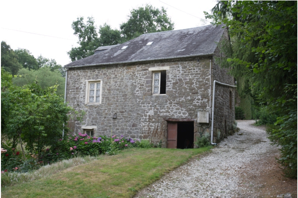
Le moulin à farine sur le ruisseau : élévation nord.