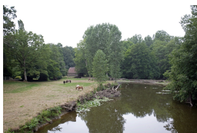
Le moulin à farine sur la Mayenne et le barrage vus depuis le pont du Boulay en amont à l'est.