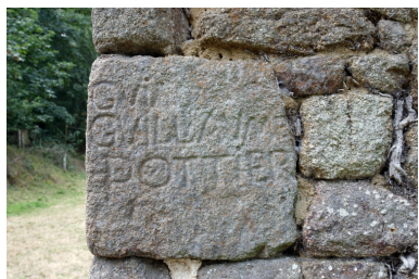
Le moulin à farine sur la Mayenne, angle nord-est : inscription.