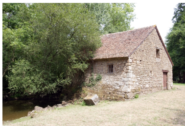
Le moulin à farine sur la Mayenne : élévations ouest et sud. IVR52_20065300726NUCA