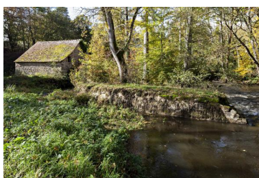
Etang.