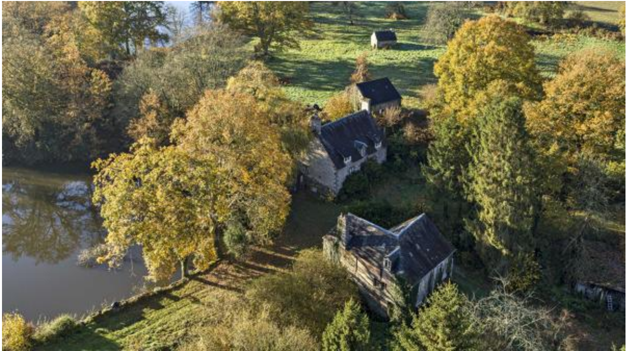
Moulin et étang du Boulay.