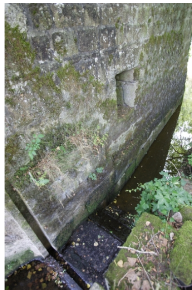
Le moulin à farine sur la Mayenne : emplacement de la roue.