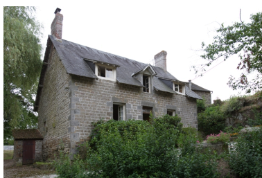
La maison : élévations est et sud. IVR52_20065300743NUCA