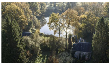
Moulin et étang du Boulay. IVR52_20205300585NUCA