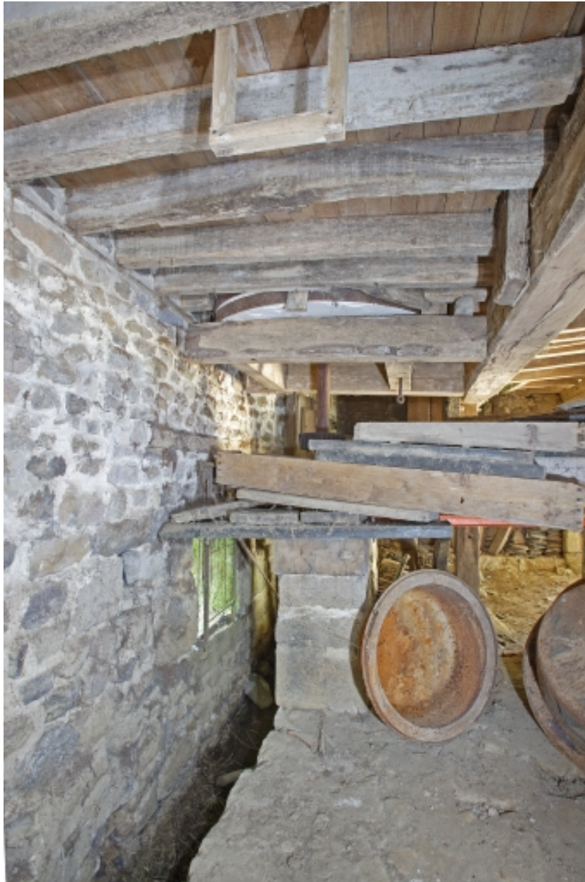
Le moulin à farine sur la Mayenne, rez-de-chaussée : emplacement du rouet de fosse (disparu), pignon de renvoi et meules.