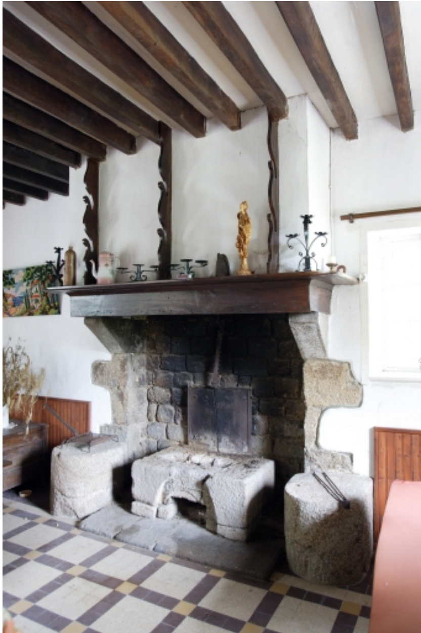
La maison : cheminée.