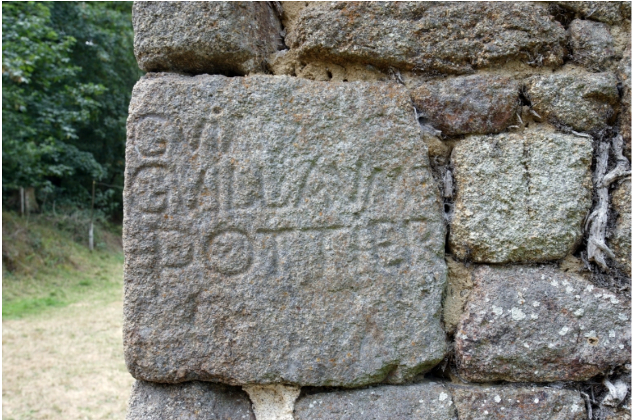
Le moulin à farine sur la Mayenne, angle nord-est : inscription.