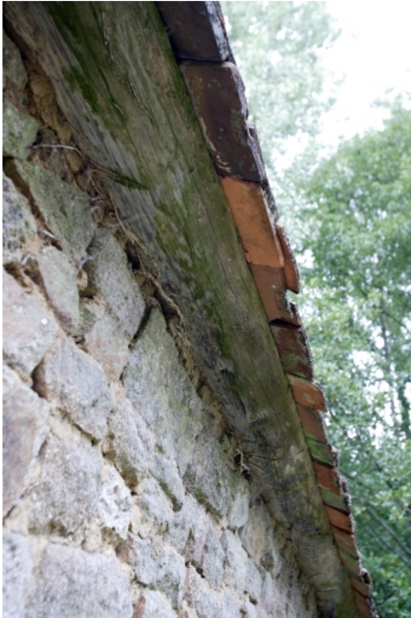
Le moulin à farine sur la Mayenne, élévation est : détail de la sablière.