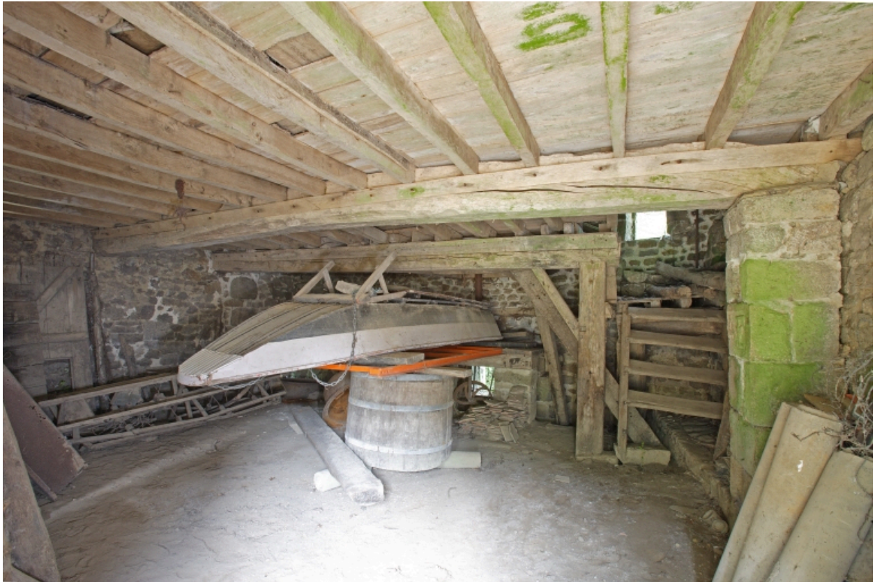
Le moulin à farine sur la Mayenne : vue d'ensemble du rez-de-chaussée depuis l'entrée au sud-est.