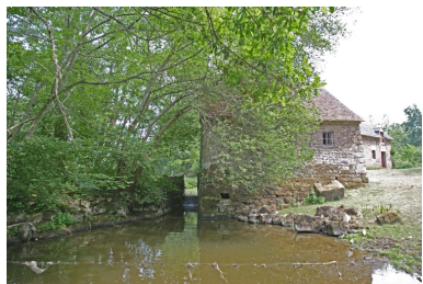
Le moulin à farine sur la Mayenne : élévation ouest. A droite, l'étable.