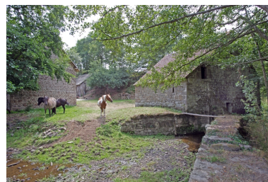
Le moulin à farine sur la Mayenne : élévations est et nord et canal d'alimentation vus depuis le barrage. A gauche, l'étable.