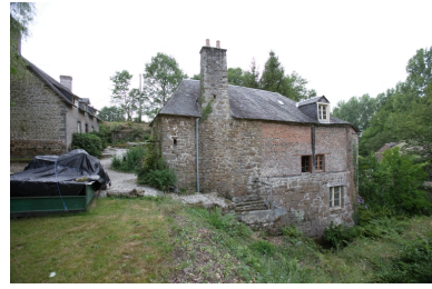
Le moulin à farine sur le ruisseau : élévation est avec la chute d'eau. A gauche, la maison. IVR52_20065300744NUCA