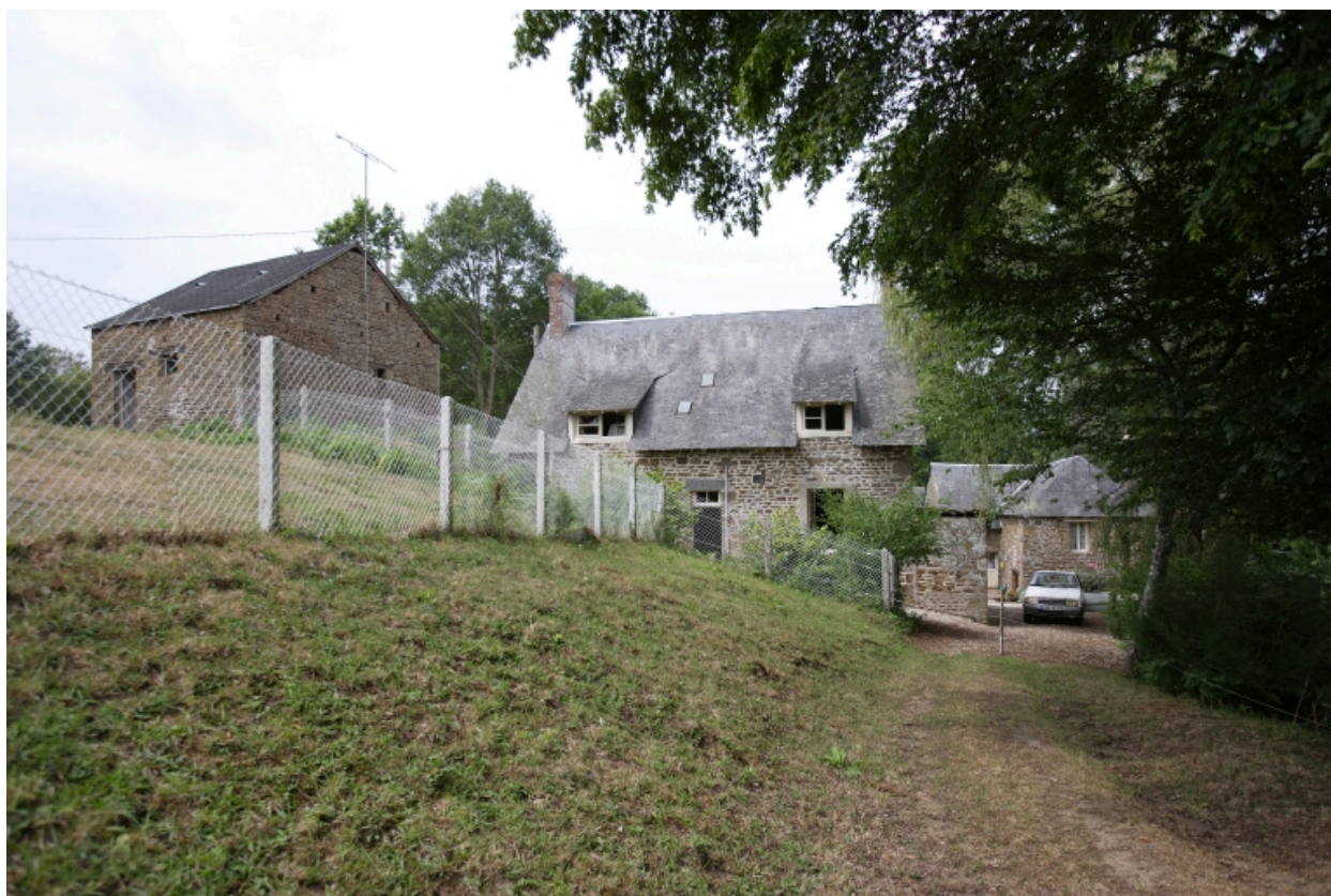
Le logis transformé en étable, la maison et le moulin à farine sur le ruisseau vus depuis le nord.