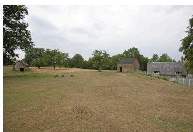
La partie haute du hameau vue depuis le sud-est : la buanderie ou logement, le logis transformé en étable, la maison.