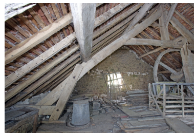
Le moulin à farine sur la Mayenne : le comble vu depuis le nord. IVR52_20065300736NUCA