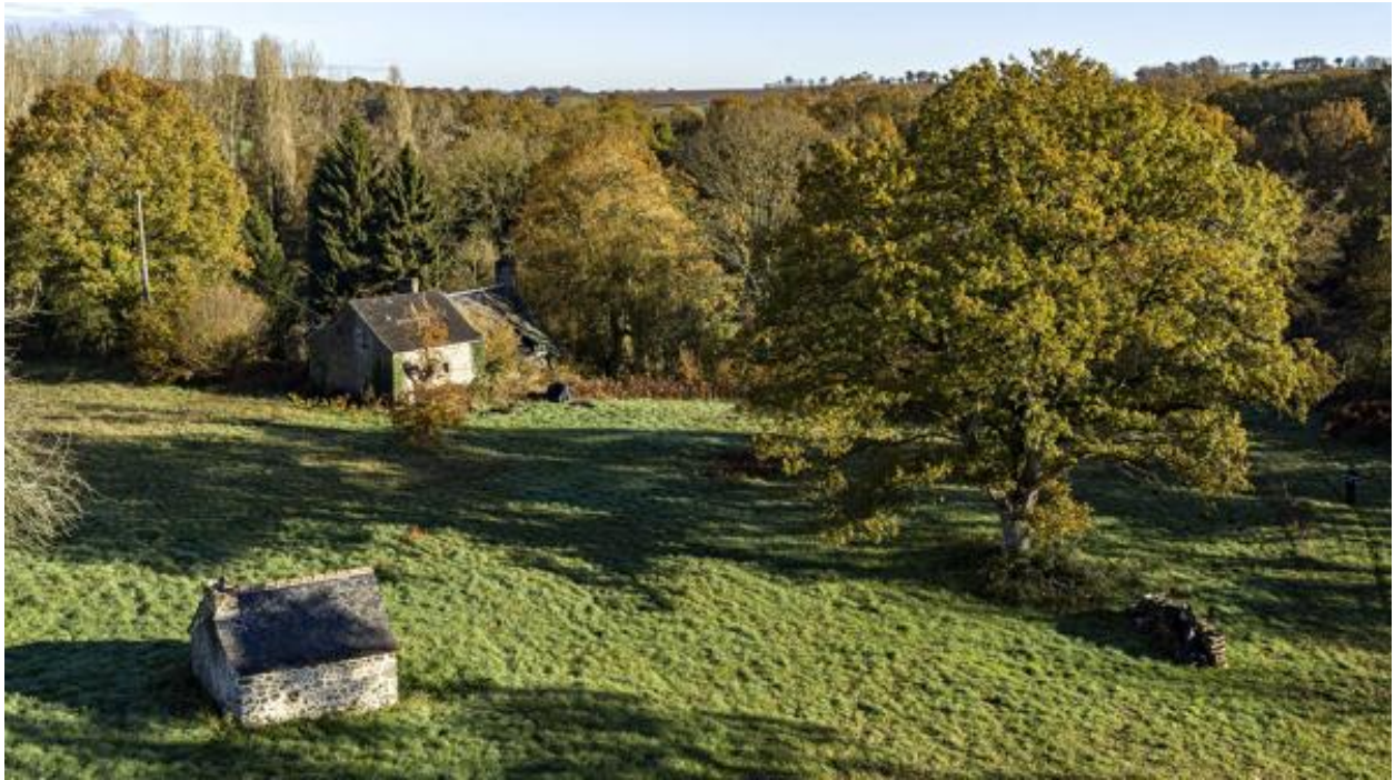
Hameau du Boulay.