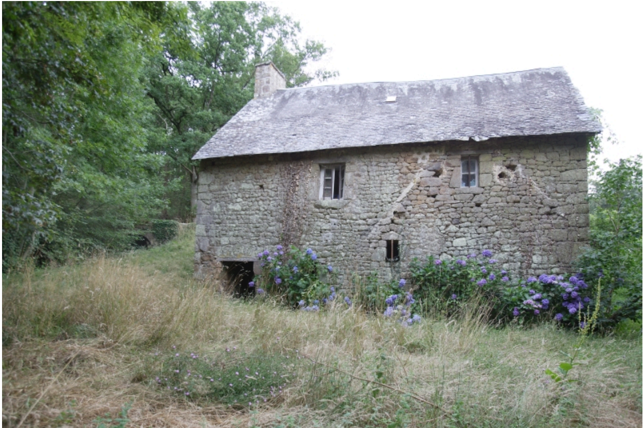
Le moulin à foulon : élévation nord.