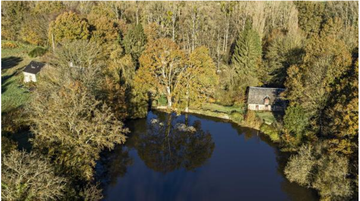
Grande digue et étang du Boulay.