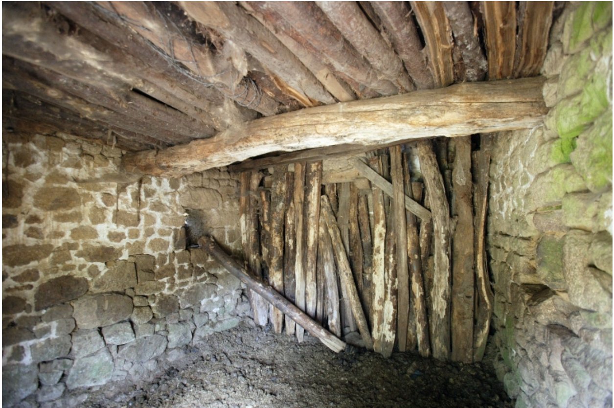
La buanderie ou logement, actuellement bergerie : vue intérieure depuis l'entrée au sud.