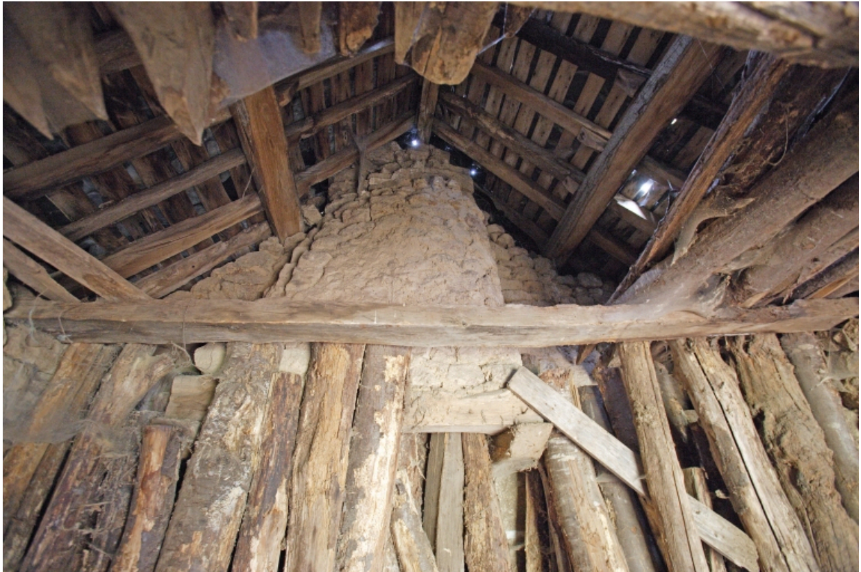
La buanderie ou logement, actuellement bergerie : la cloison et le conduit de cheminée vus depuis le sud.