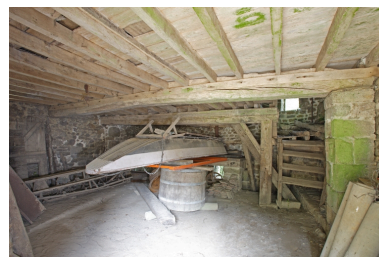
Le moulin à farine sur la Mayenne : vue d'ensemble du rez-de- chaussée depuis l'entrée au sud-est.