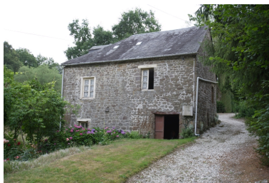
Le moulin à farine sur le ruisseau : élévation nord.