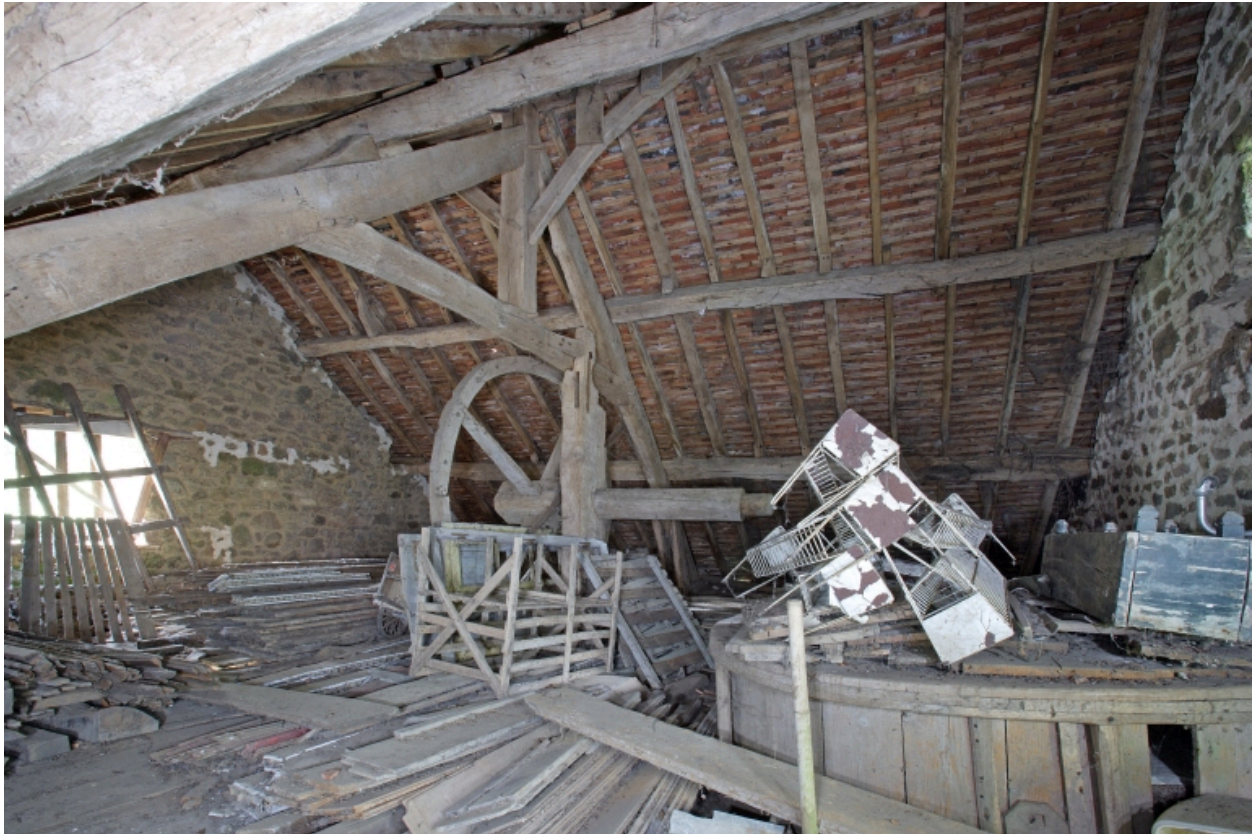
Le moulin à farine sur la Mayenne : le comble vu depuis le nord-est. Au premier plan, les meules dans leurs archures.