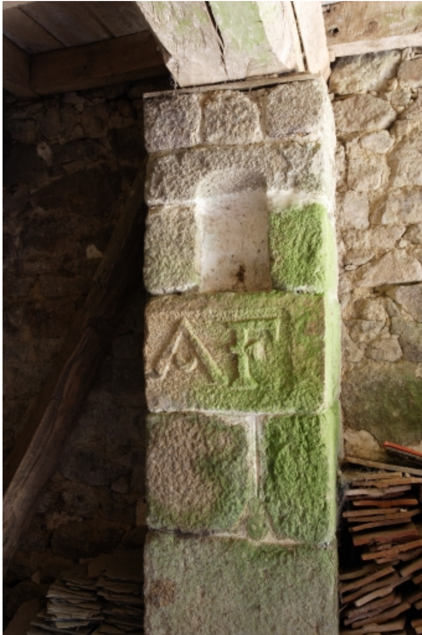
Le moulin à farine sur la Mayenne, rez-de-chaussée : inscription sur le poteau est.