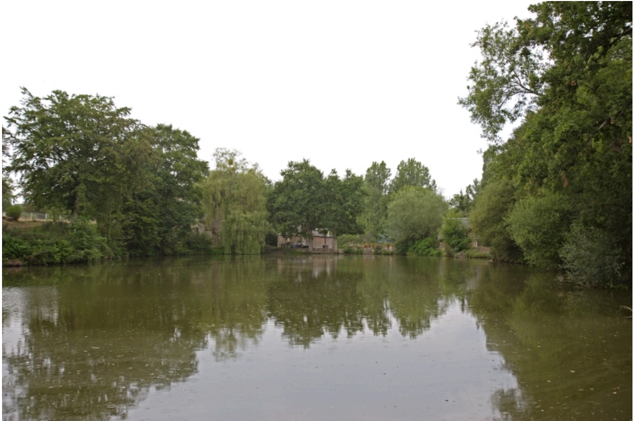
L'étang de retenue vu depuis le sud. Au fond, le moulin à farine et le moulin à foulon.