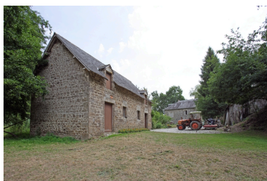
L'étable et le moulin à farine sur le ruisseau vus depuis le nord-ouest.