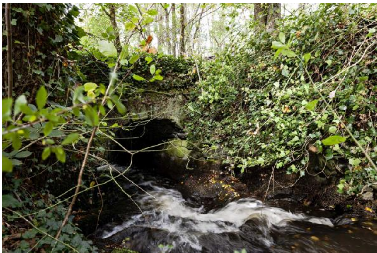
Bonde de l'étang.