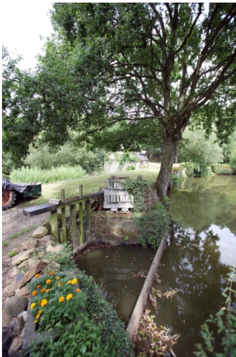
Vanne d'alimentation du moulin à farine sur la chaussée de l'étang de retenue.