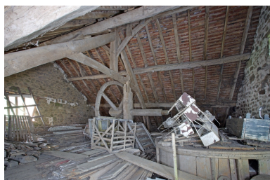
Le moulin à farine sur la Mayenne : le comble vu depuis le nord-est. Au premier plan, les meules dans leurs archures.