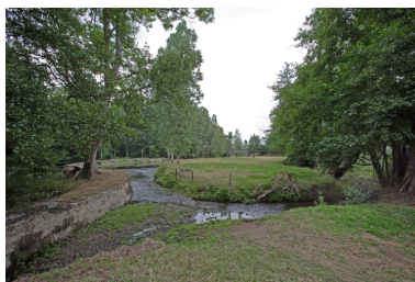
Le barrage sur la Mayenne, le canal d'alimentation du moulin et l'embouchure du ruisseau de Lassay vus depuis le moulin au sud-ouest.