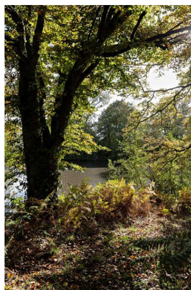
Etang. IVR52_20205300393NUCA