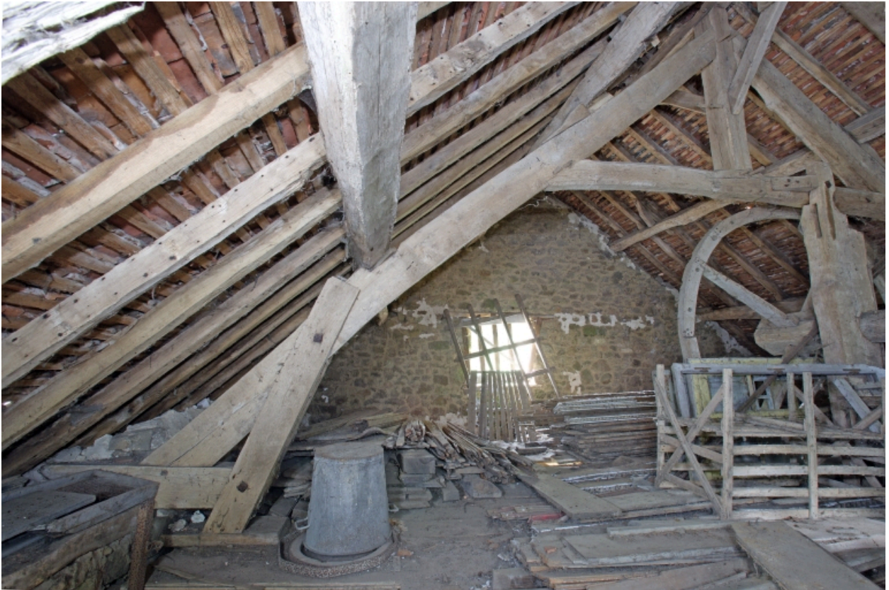
Le moulin à farine sur la Mayenne : le comble vu depuis le nord.