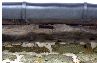
Le moulin à farine sur le ruisseau, élévation sud de la partie moulin : date portée sur la sablière.