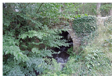
Le pont sur le ruisseau de Lassay, vu depuis le nord.