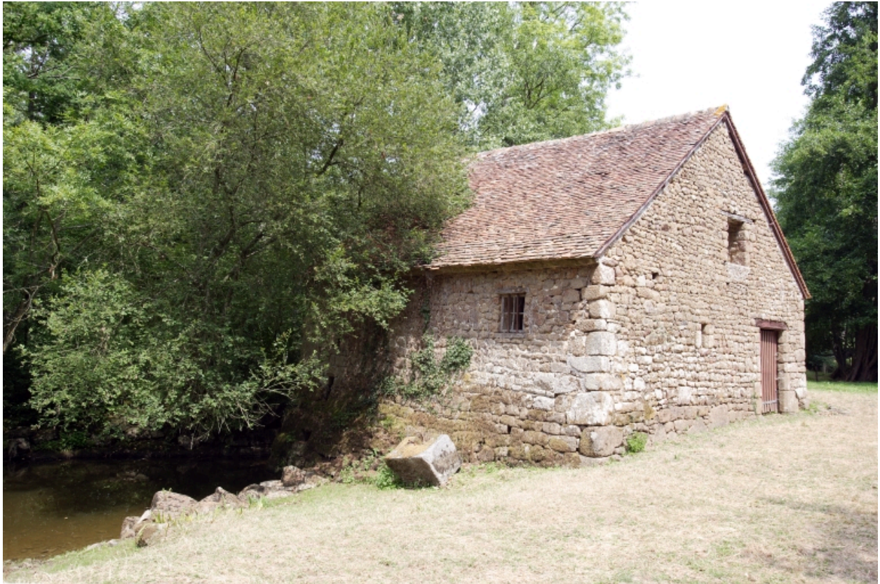
Le moulin à farine sur la Mayenne : élévations ouest et sud.