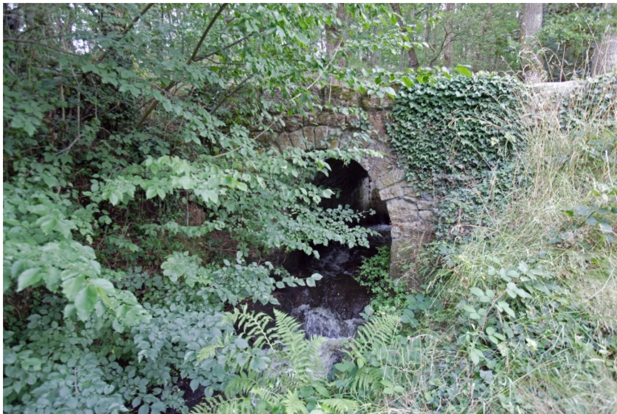
Le pont sur le ruisseau de Lassay, vu depuis le nord.