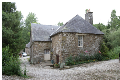
Le moulin à farine sur le ruisseau : élévations ouest et sud. Au fond, l'étable. IVR52_20065300741NUCA