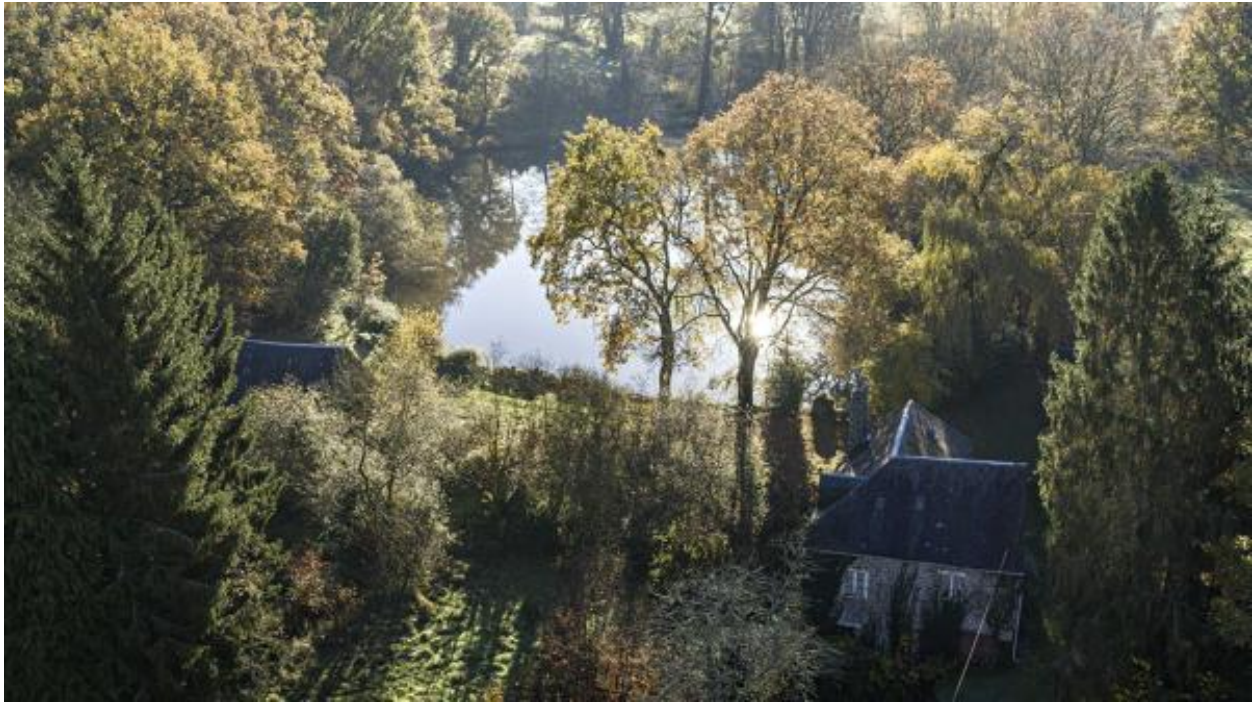
Moulin et étang du Boulay.