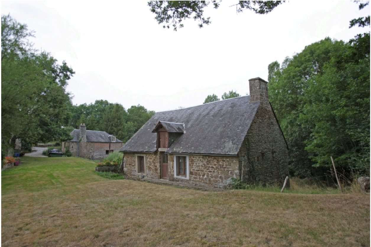
Le moulin à foulon et le moulin à farine (au fond) vus depuis la chaussée de l'étang de retenue au sud-est.