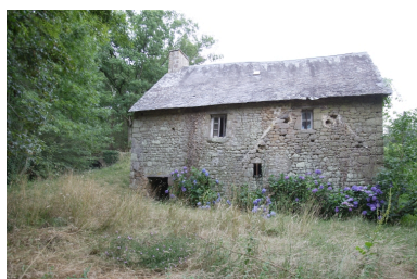
Le moulin à foulon : élévation nord.