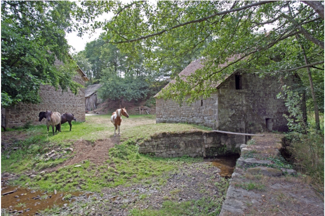
Le moulin à farine sur la Mayenne : élévations est et nord et canal d'alimentation vus depuis le barrage. A gauche, l'étable.