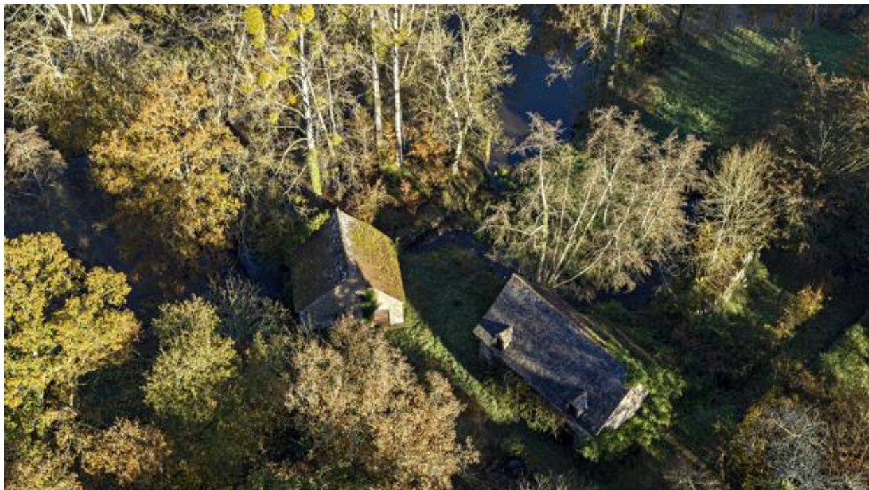
Hameau et étang.