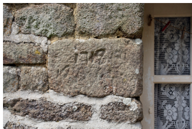
Le moulin à farine sur le ruisseau, élévation sud de la partie moulin : date portée sur le jambage de la porte d'entrée. IVR52_20065300748NUCA