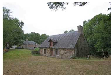
Le moulin à foulon et le moulin à farine (au fond) vus depuis la chaussée de l'étang de retenue au sud-est.