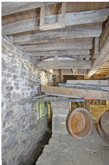
Le moulin à farine sur la Mayenne, rez-de-chaussée : emplacement du rouet de fosse (disparu), pignon de renvoi et meules.