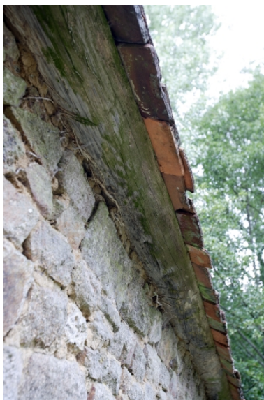
Le moulin à farine sur la Mayenne, élévation est : détail de la sablière.