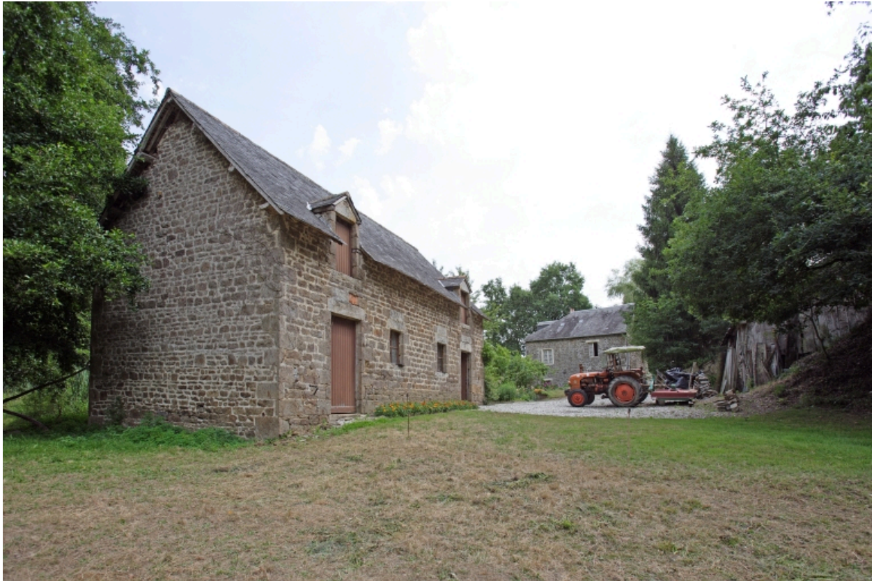
L'étable et le moulin à farine sur le ruisseau vus depuis le nord-ouest.