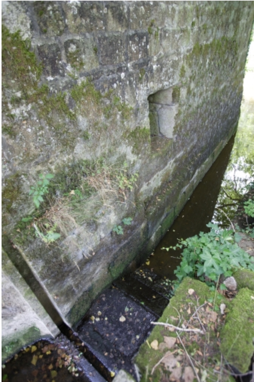
Le moulin à farine sur la Mayenne : emplacement de la roue.