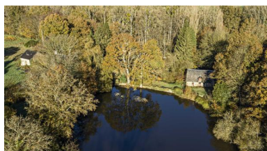
Grande digue et étang du Boulay.