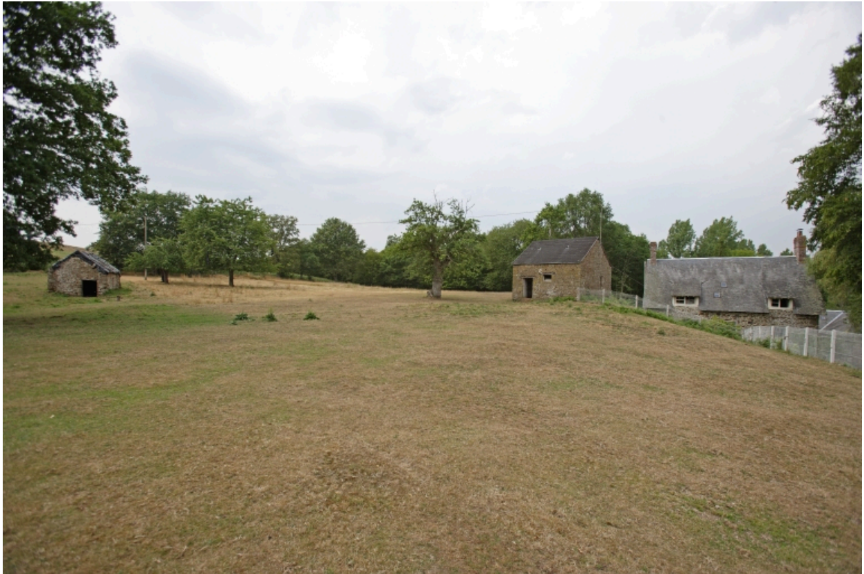
La partie haute du hameau vue depuis le sud-est : la buanderie ou logement, le logis transformé en étable, la maison.