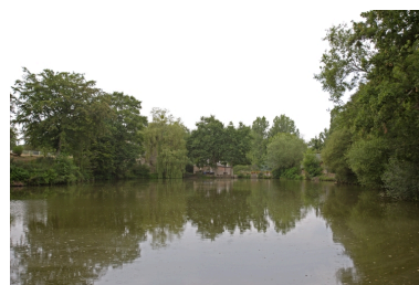
L'étang de retenue vu depuis le sud. Au fond, le moulin à farine et le moulin à foulon.