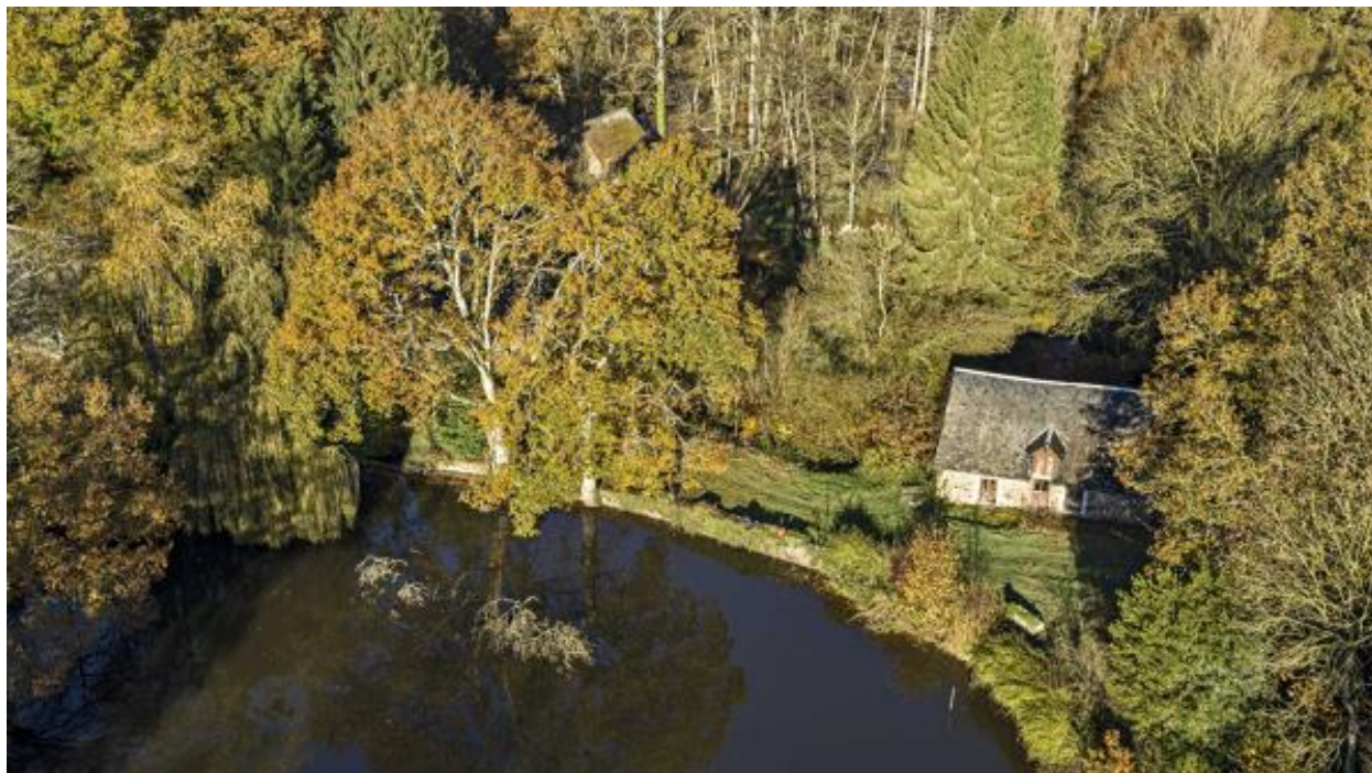
Grande digue et étang du Boulay.