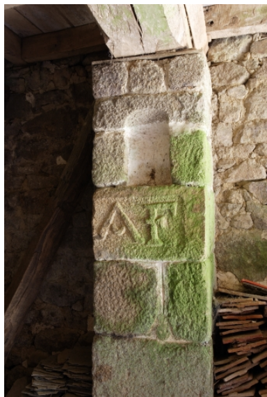
Le moulin à farine sur la Mayenne, rez-de-chaussée : inscription sur le poteau est. IVR52_20065300733NUCA