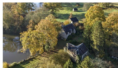
Moulin et étang du Boulay.