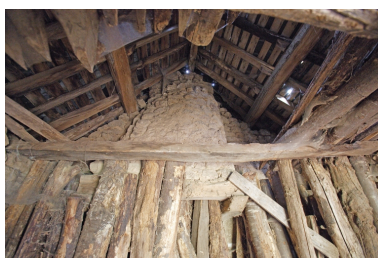
La buanderie ou logement, actuellement bergerie : la cloison et le conduit de cheminée vus depuis le sud. IVR52_20065300752NUCA