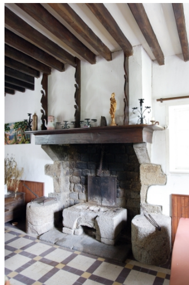
La maison : cheminée. IVR52_20065300753NUCA