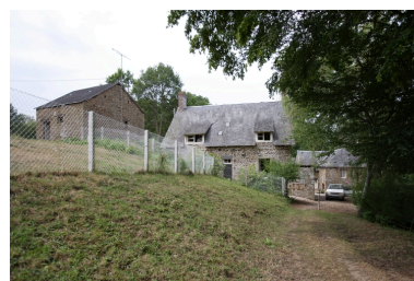
Le logis transformé en étable, la maison et le moulin à farine sur le ruisseau vus depuis le nord. IVR52_20065300749NUCA