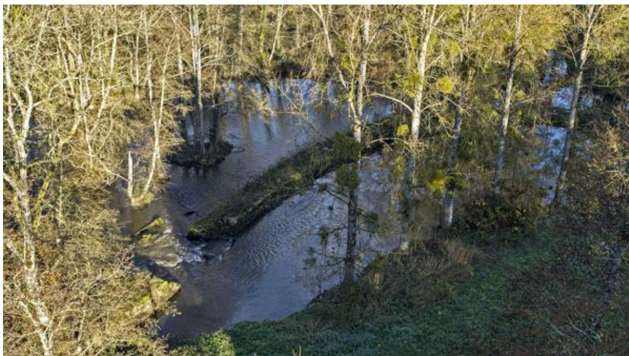
Etang du Boulay.