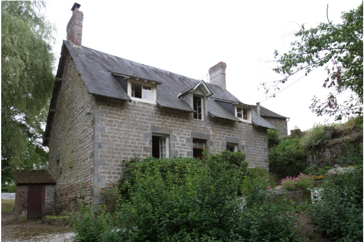
La maison : élévations est et sud.