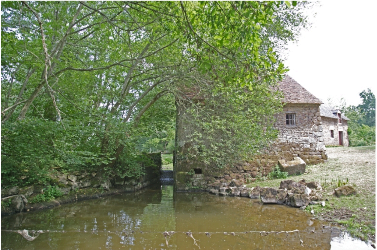
Le moulin à farine sur la Mayenne : élévation ouest. A droite, l'étable.