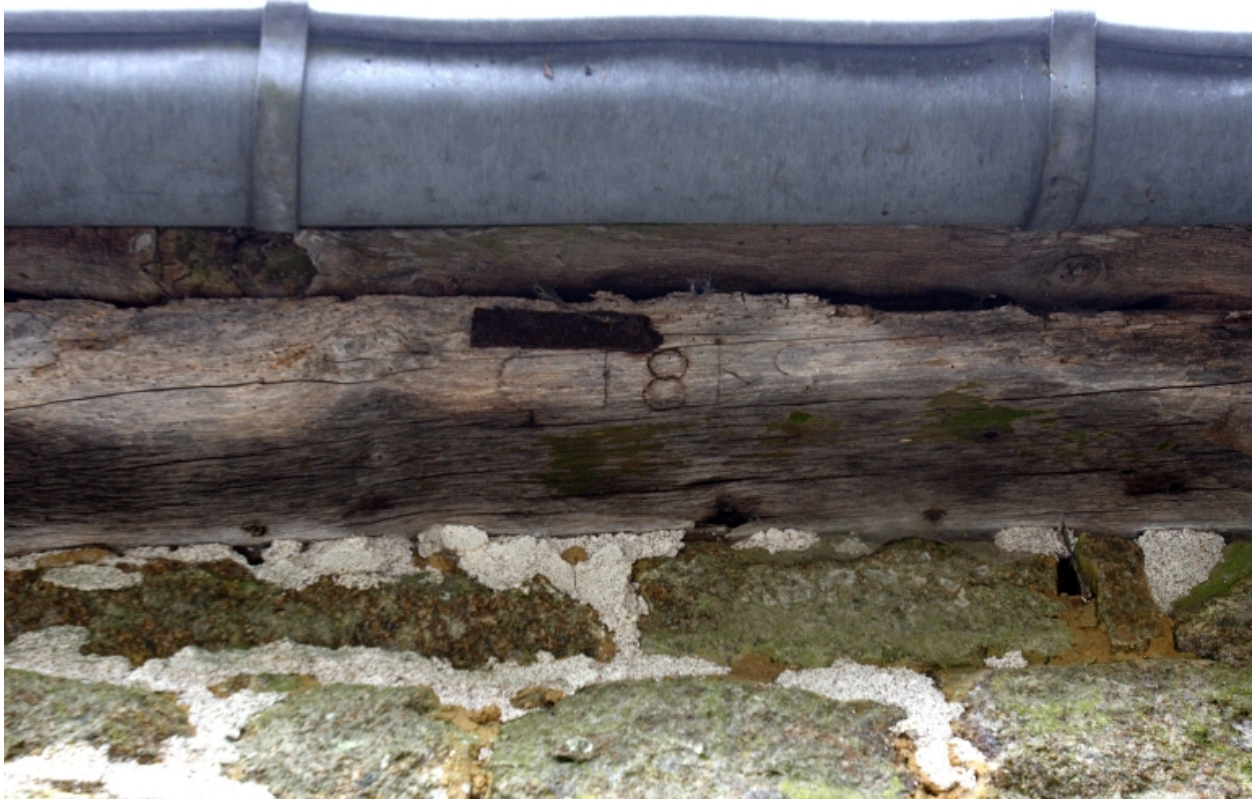
Le moulin à farine sur le ruisseau, élévation sud de la partie moulin : date portée sur la sablière.