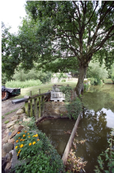
Vanne d'alimentation du moulin à farine sur la chaussée de l'étang de retenue.