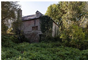
Moulin.