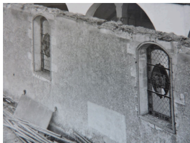
Verrières encore en place sur le mur sud lors de la démolition de l'église, janvier 1974.