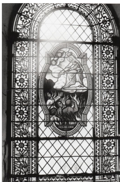
La verrière qui ornait la baie centrale de la façade occidentale de l'église, vers 1970. IVR52_20198503887NUCA