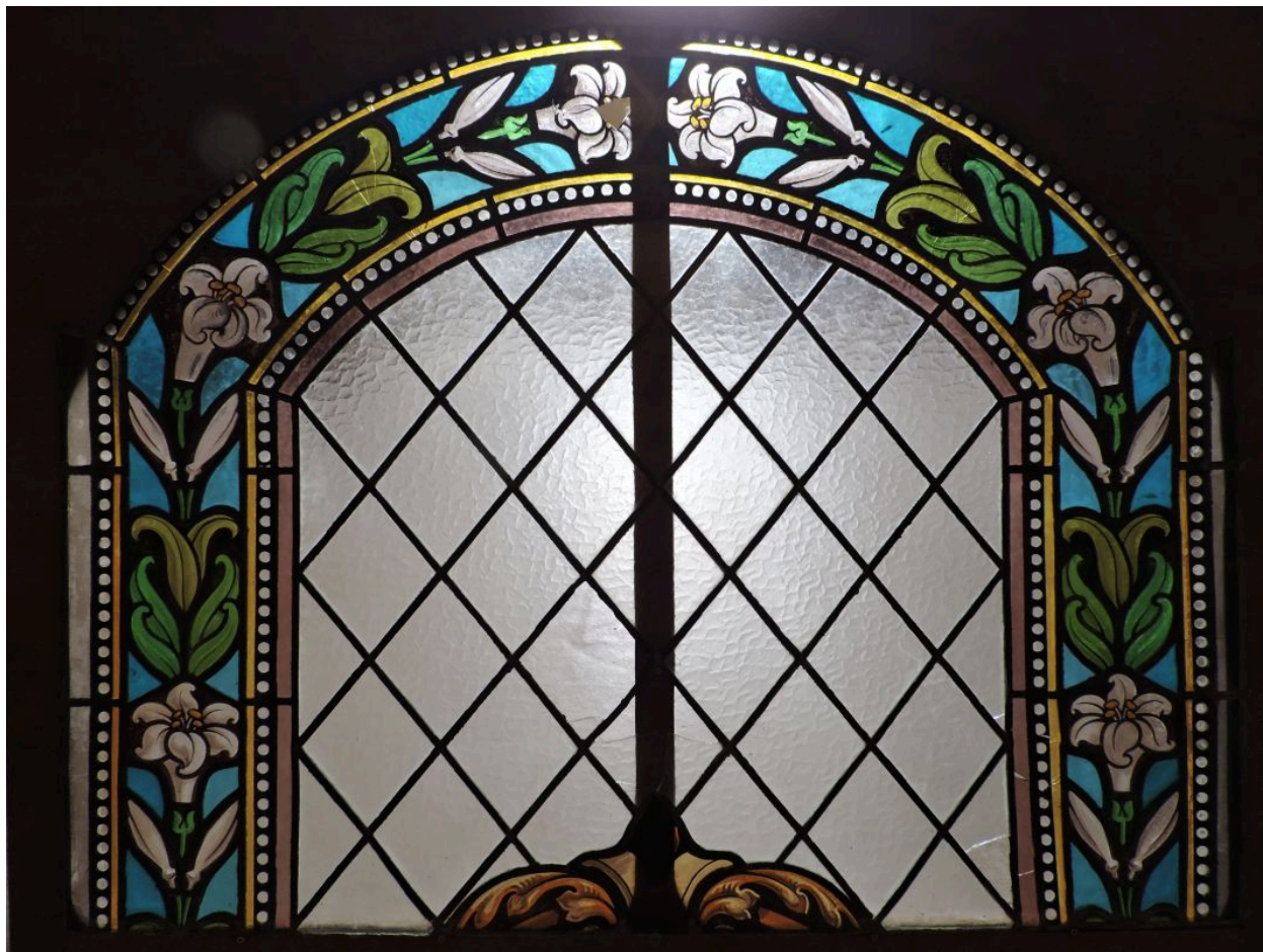
Élément d'une des verrières des baies sud de l'église.