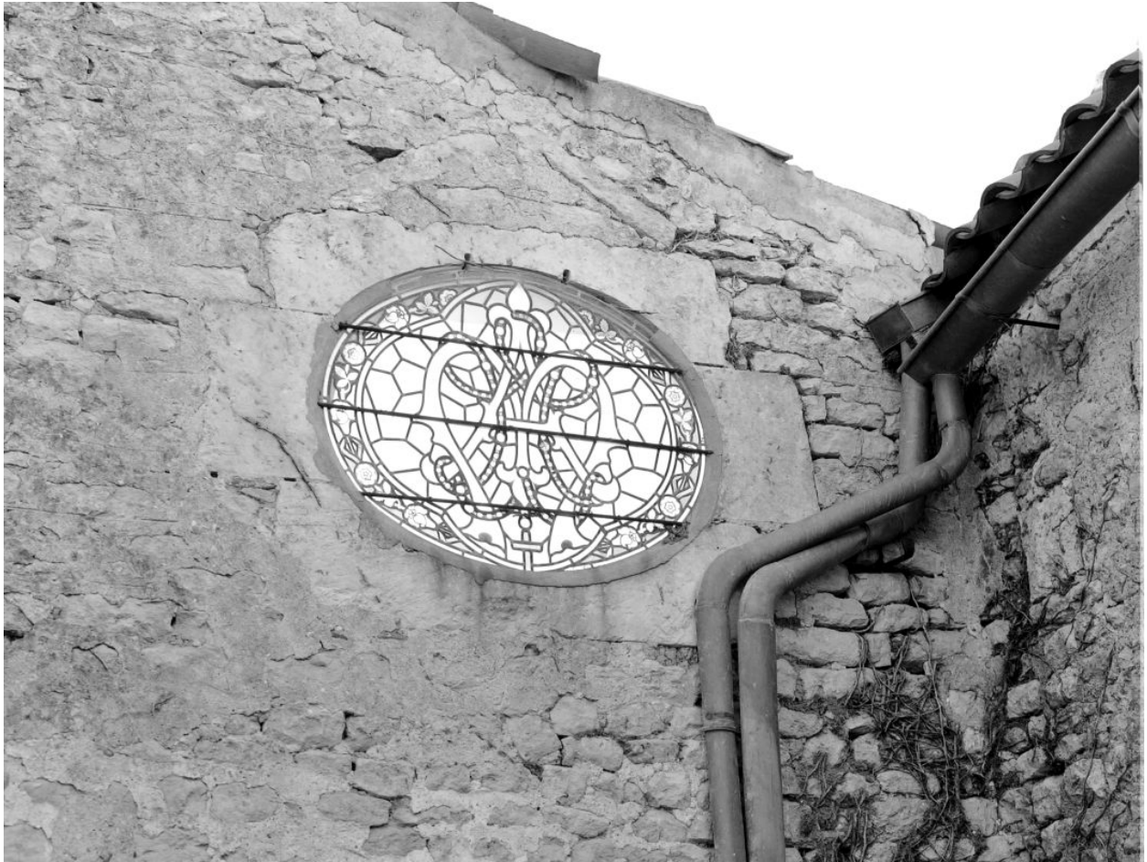
Verrière de l'oculus qui éclairait le bas-côté nord, vue depuis l'est au printemps 1974.