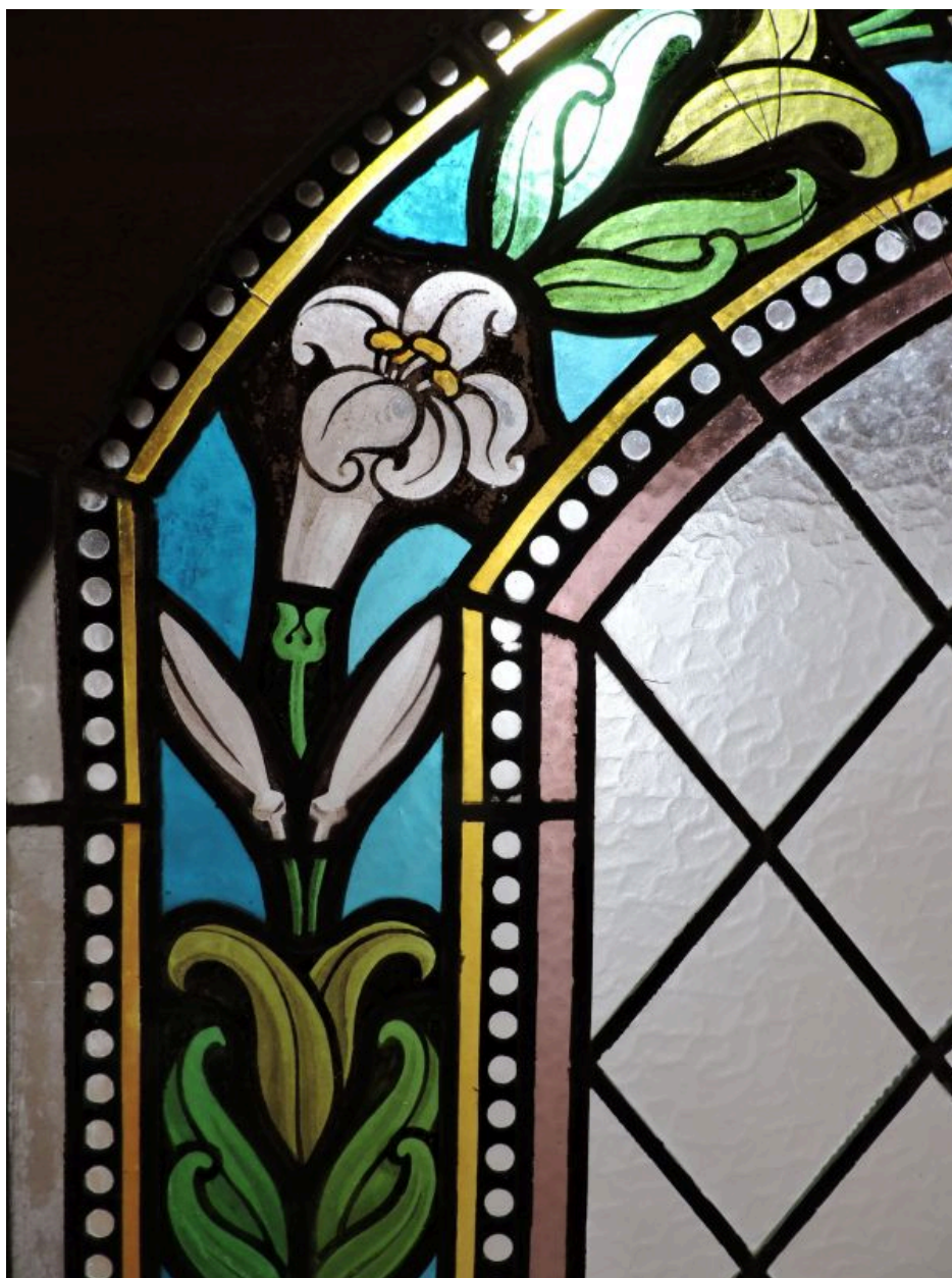
Elément d'une des verrières des baies sud de l'église : détail, fleur de lys.