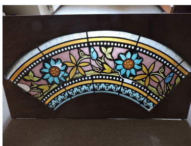
Élément de verrière en quart de cercle, vestige de la verrière de la baie centrale de la façade occidentale de l'église. IVR52_20208500104NUCA