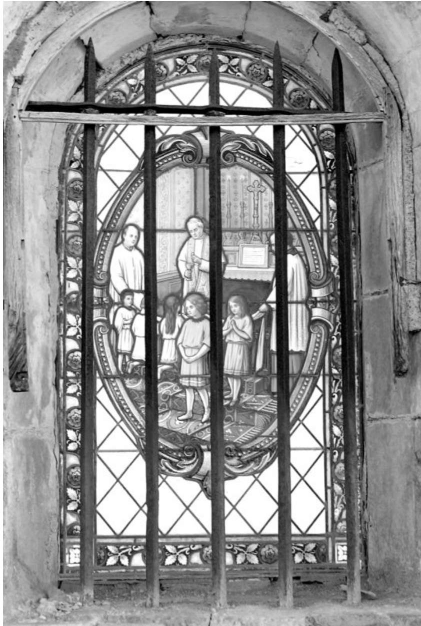
Verrière de la baie sud de l'abside, printemps 1974 : la Communion solennelle.