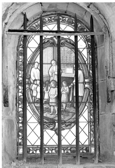
Verrière de la baie sud de l'abside, printemps 1974 : la Communion solennelle.