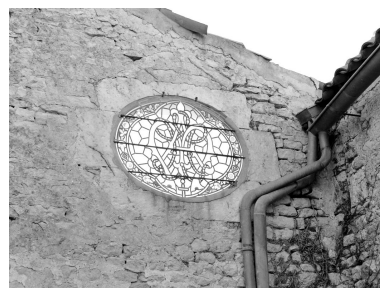
Verrière de l'oculus qui éclairait le bas-côté nord, vue depuis l'est au printemps 1974.