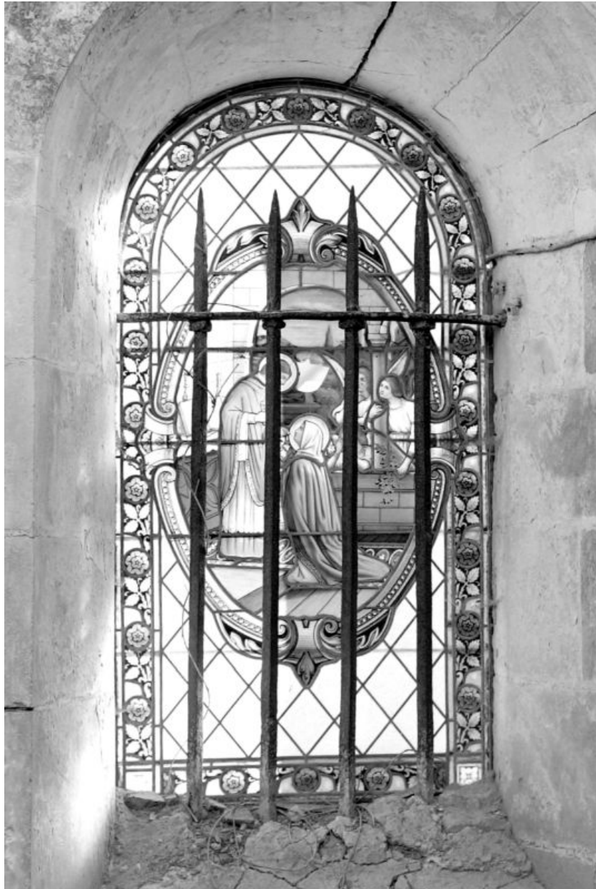
Verrière de la baie nord de l'abside, printemps 1974 : Communion de la Vierge.