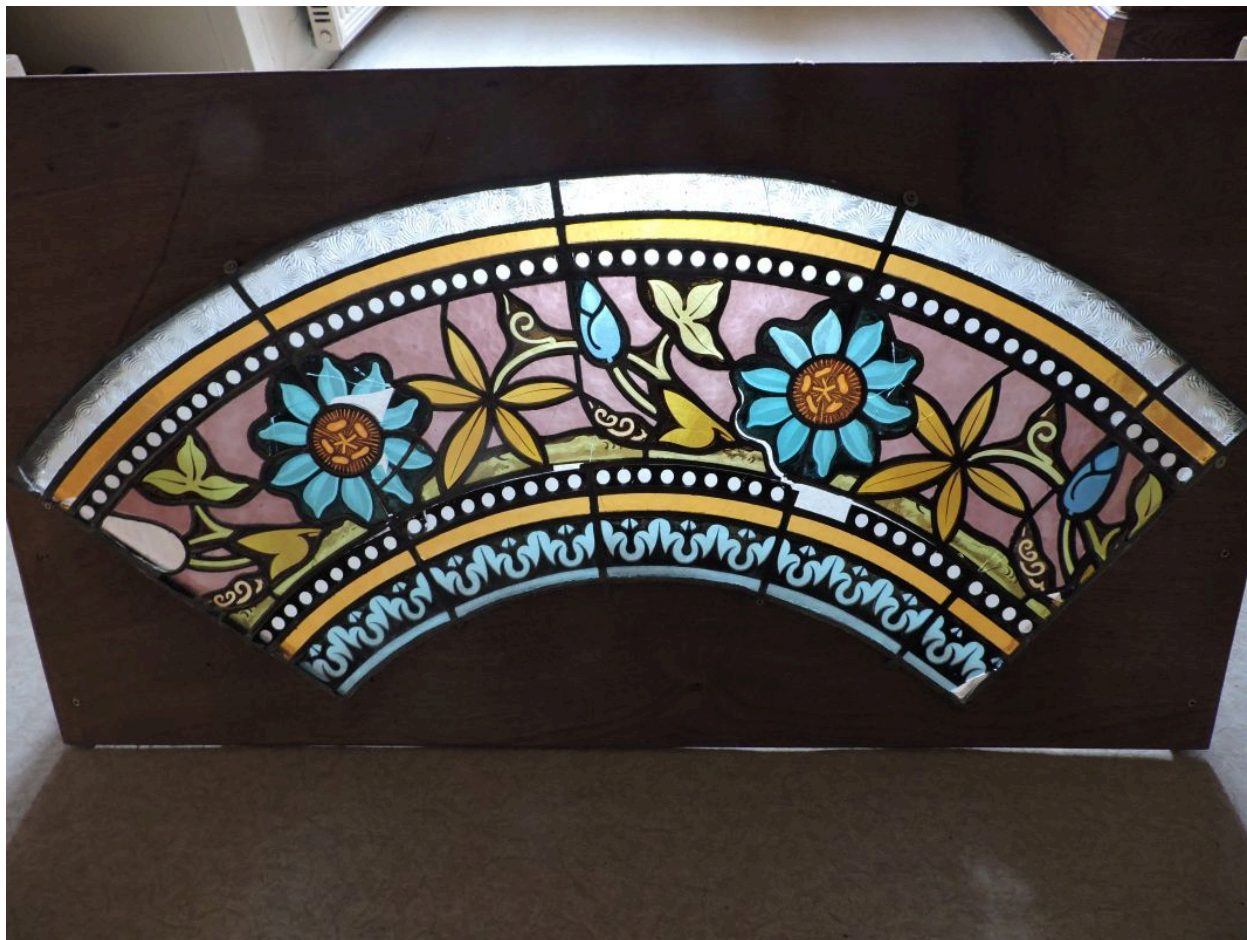
Elément de verrière en quart de cercle, vestige de la verrière de la baie centrale de la façade occidentale de l'église.