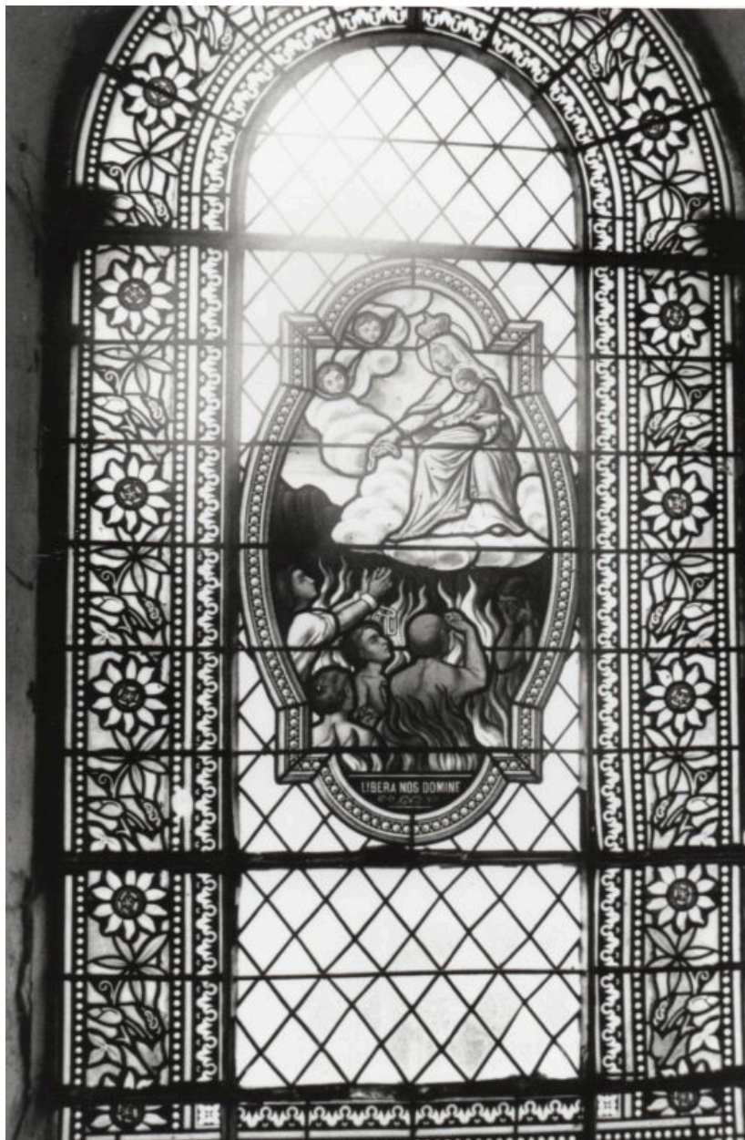
La verrière qui ornait la baie centrale de la façade occidentale de l'église, vers 1970.