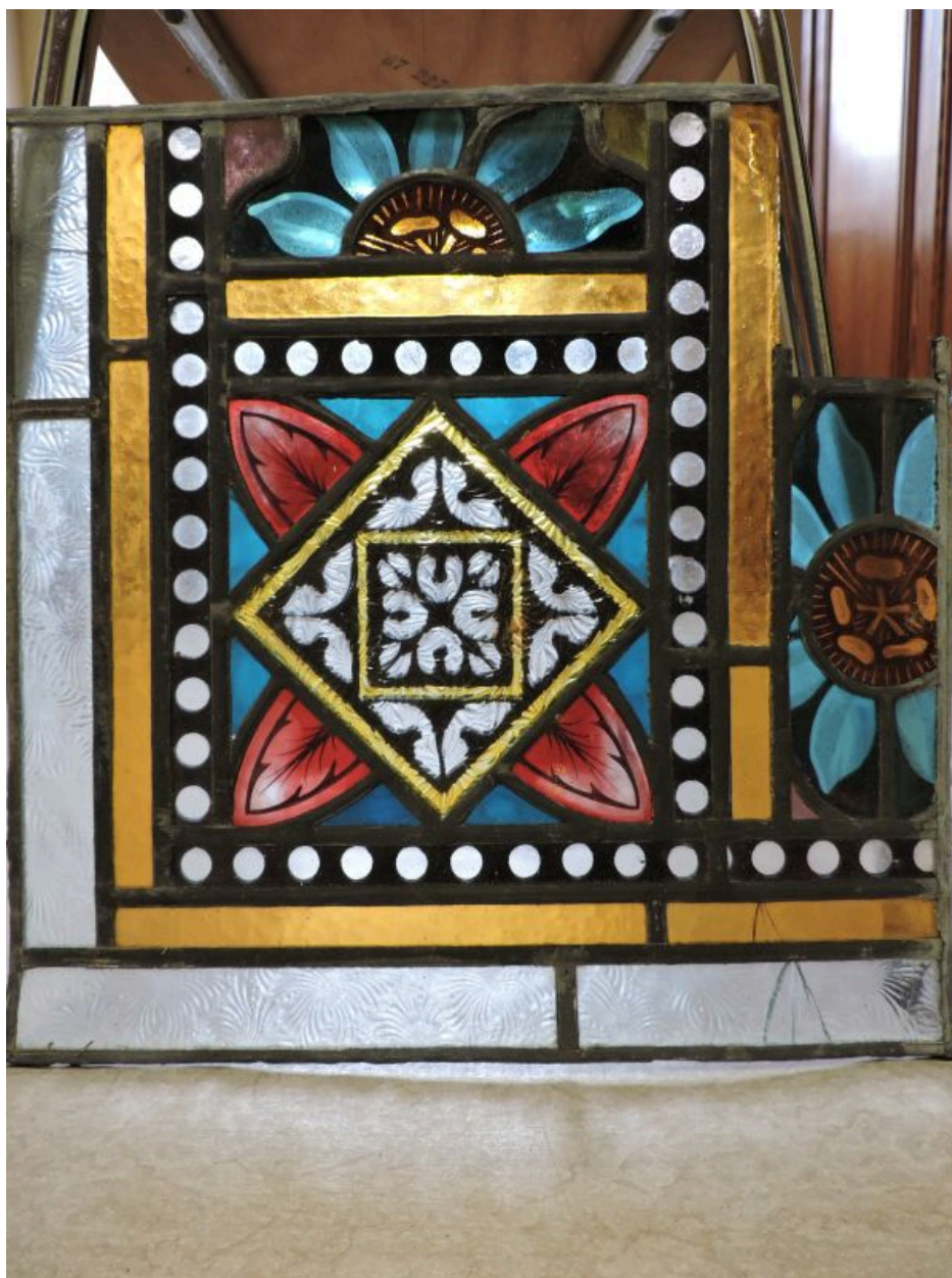
Angle inférieur de la verrière de la baie centrale de la façade occidentale de l'église.