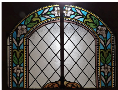
Elément d'une des verrières des baies sud de l'église.