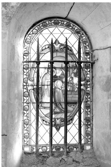
Verrière de la baie nord de l'abside, printemps 1974 : Communion de la Vierge.