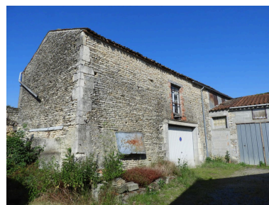
Ancienne dépendance à l'arrière du café, dans l'angle formé par la rue du Bourg, vue depuis le nord-est.