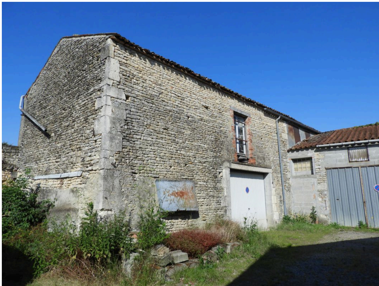
Ancienne dépendance à l'arrière du café, dans l'angle formé par la rue du Bourg, vue depuis le nord-est.