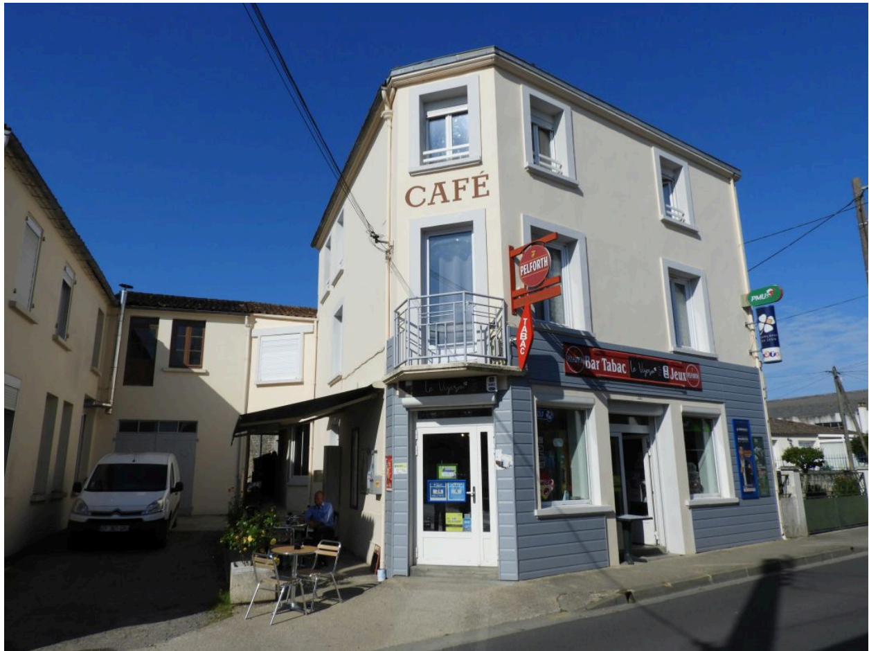
Le café vu depuis le nord-est.