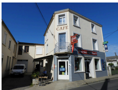
Le café vu depuis le nord-est.