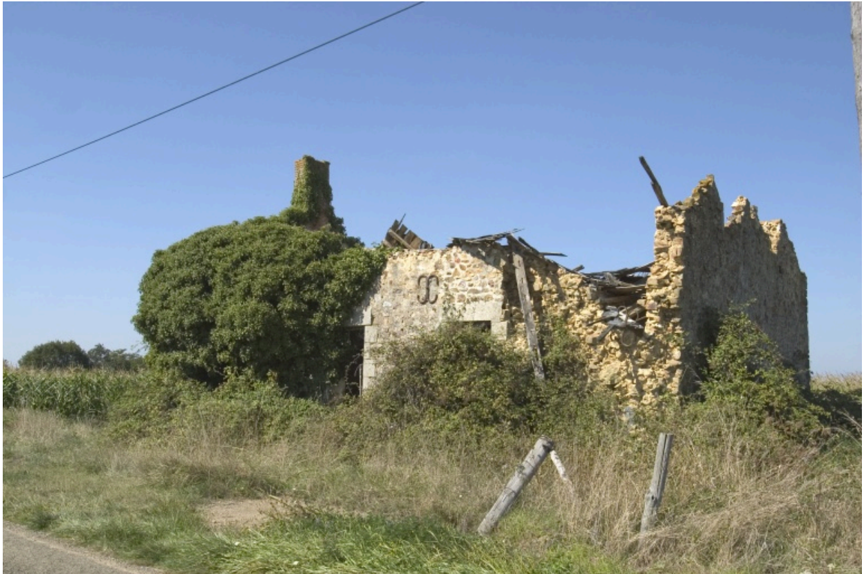
La façade principale du logis.