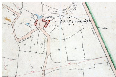
Extrait du plan cadastral de 1842, section A1.