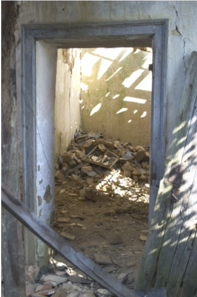
La porte reliant la pièce à cheminée à la pièce froide.