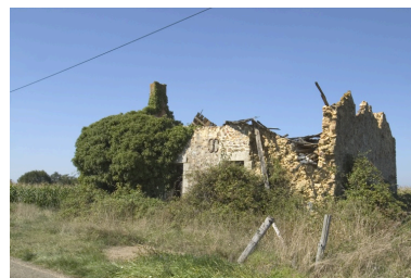
La façade principale du logis.