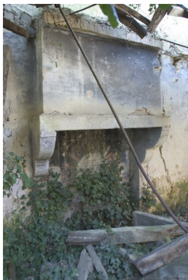
La cheminée.