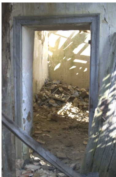
La porte reliant la pièce à cheminée à la pièce froide.