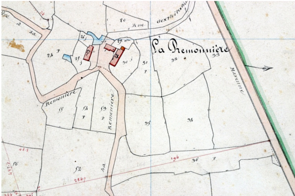
Extrait du plan cadastral de 1842, section A1.