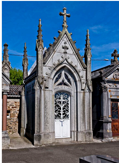
Vue d'ensemble de la chapelle. IVR52_20155300058NUCA