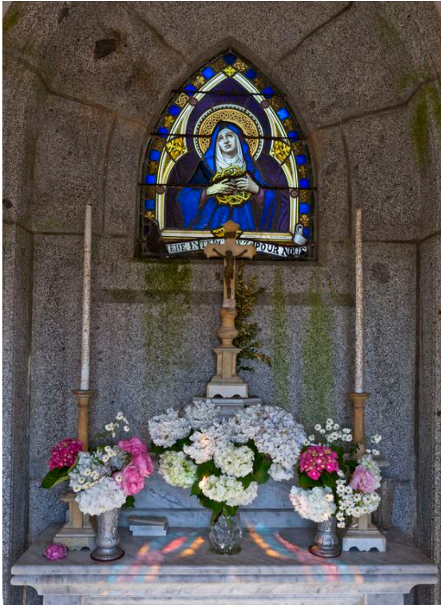
L'autel et la verrière.