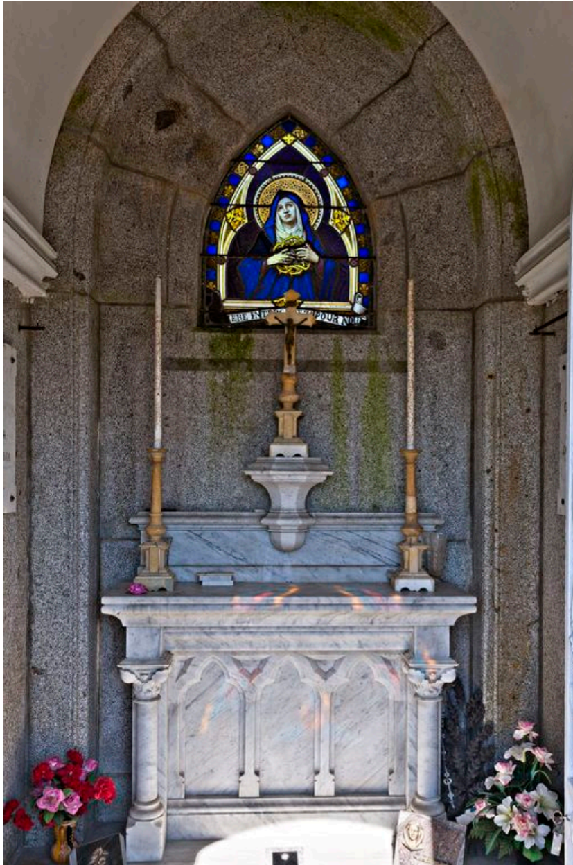
Vue intérieure de la chapelle.