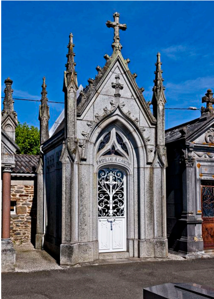
Vue d'ensemble de la chapelle.