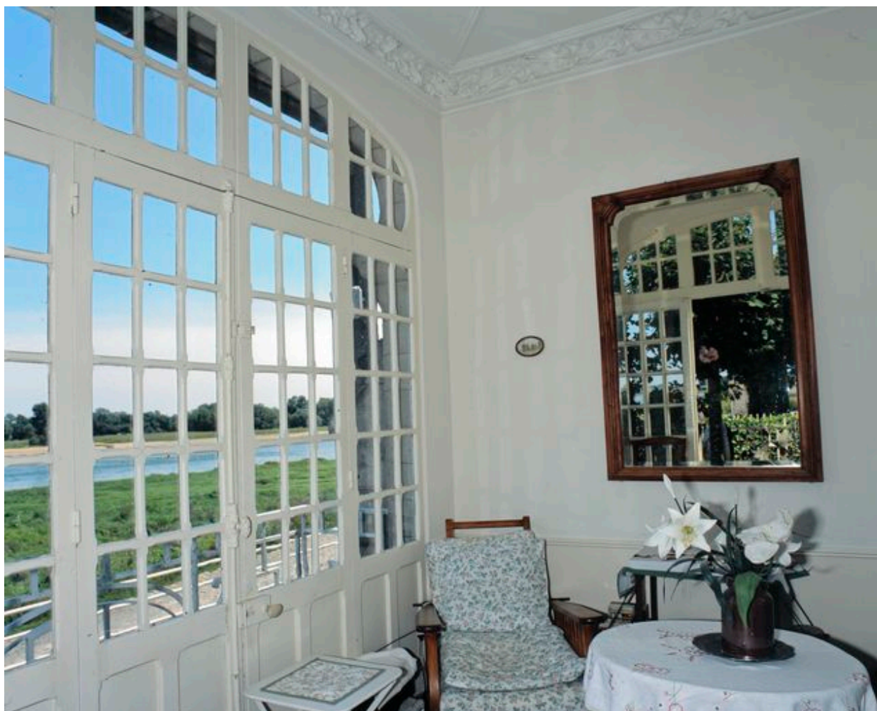
Vue depuis l'intérieur du pavillon.