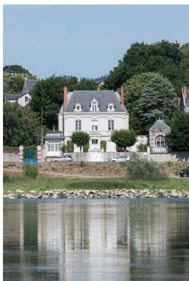
Vue de la maison et de son pavillon depuis la rive gauche.