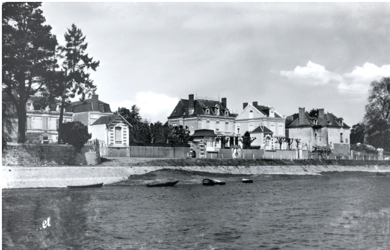
Vue du quai du Port-Boulet. Carte postale. Milieu du 20e siècle. (Archives départementales de Maine-et-Loire, 19 Fi).