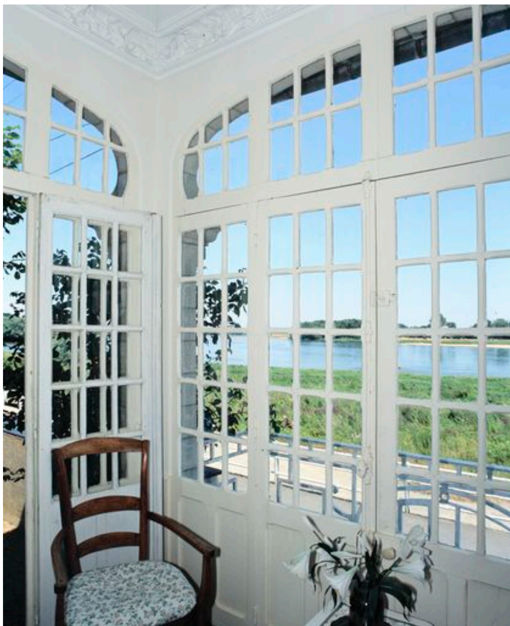
Vue depuis l'intérieur du pavillon.