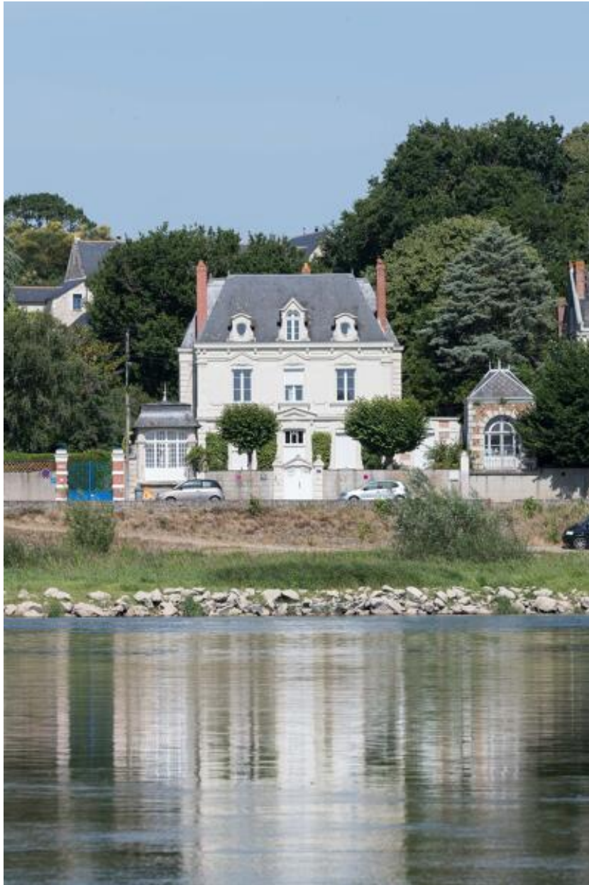
Vue de la maison et de son pavillon depuis la rive gauche.