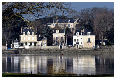
Les Sablons (à gauche). Vue d'ensemble depuis la rive gauche. IVR52_20164900166NUCA