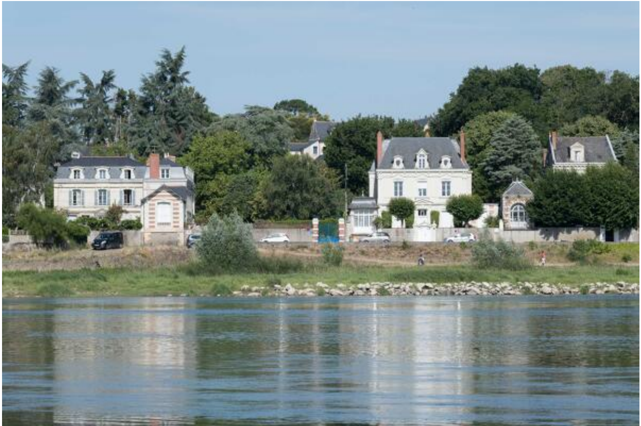
Vue de la maison les Sablons (à droite) depuis la rive gauche.