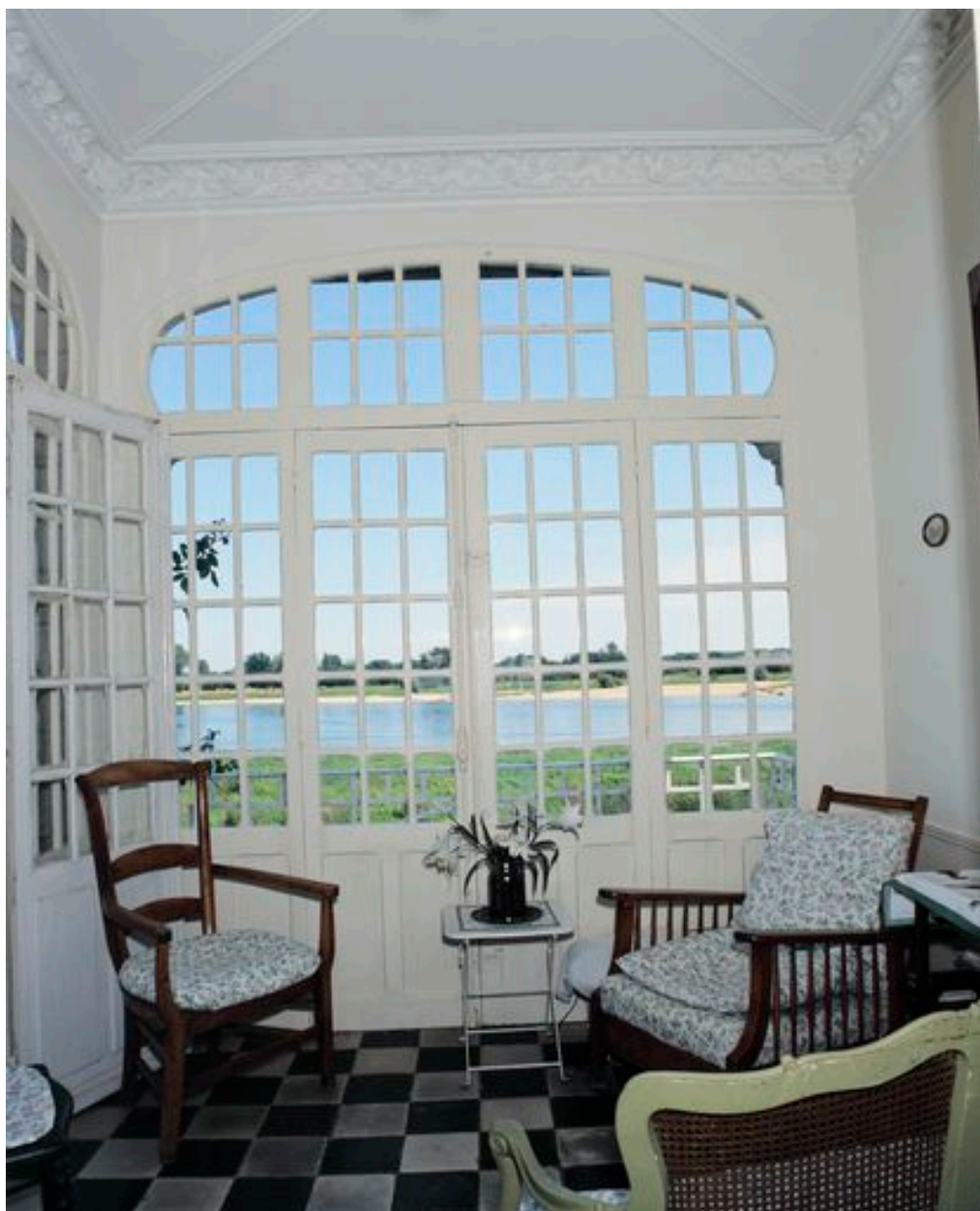
Vue depuis l'intérieur du pavillon.