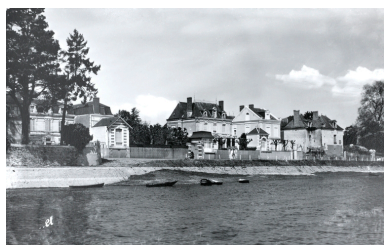
Vue du quai du Port-Boulet. Carte postale. Milieu du 20e siècle. IVR52_20134900382NUCA