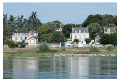
Vue de la maison les Sablons (à droite) depuis la rive gauche. IVR52_20204900250NUCA