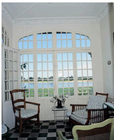
Vue depuis l'intérieur du pavillon.