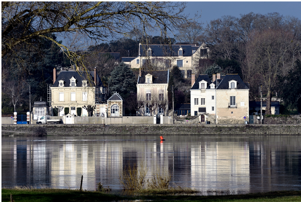
Les Sablons (à gauche). Vue d'ensemble depuis la rive gauche.