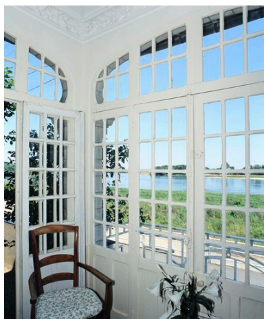
Vue depuis l'intérieur du pavillon. IVR52_20024910347XA