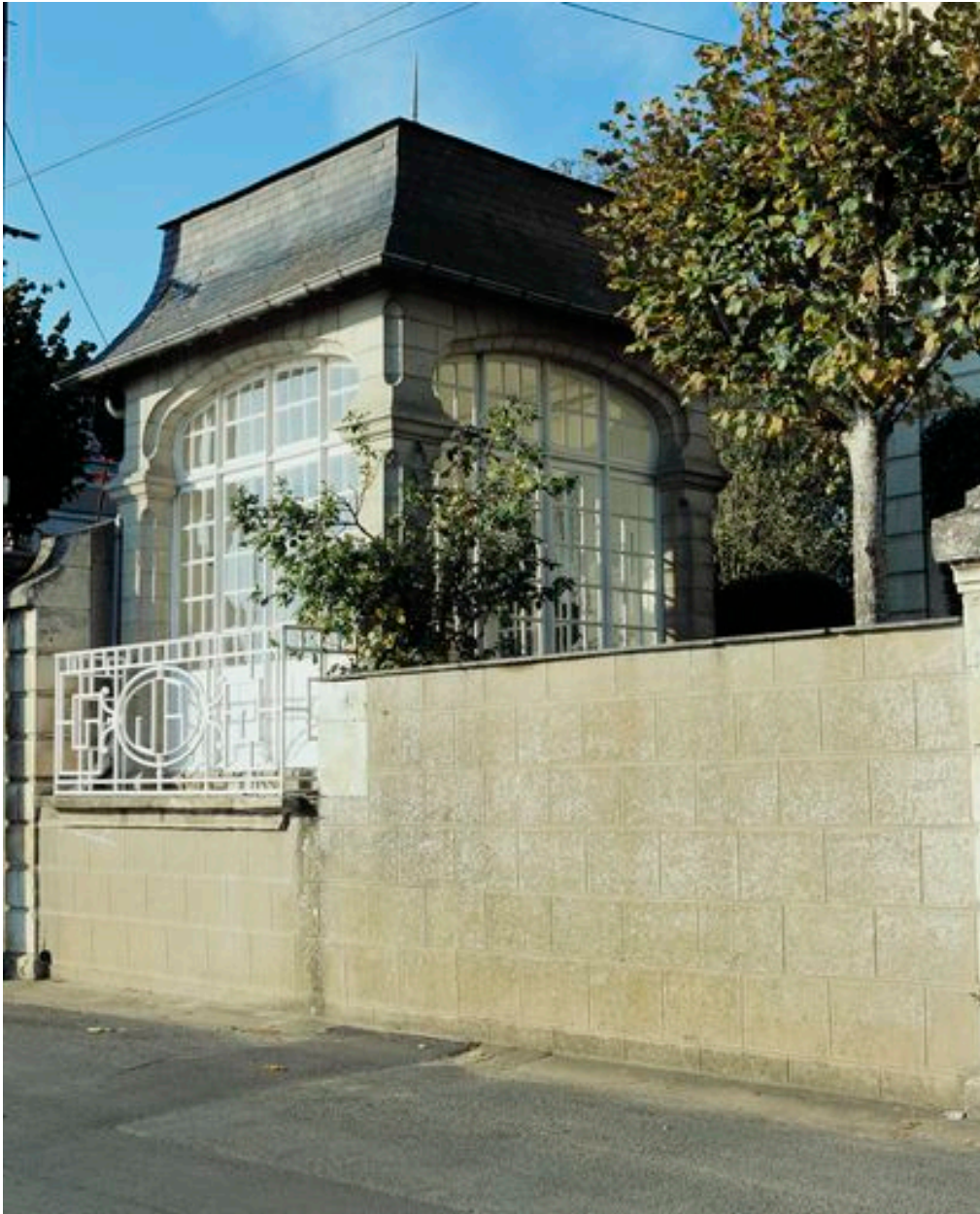
Vue du pavillon.