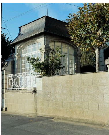
Vue du pavillon.