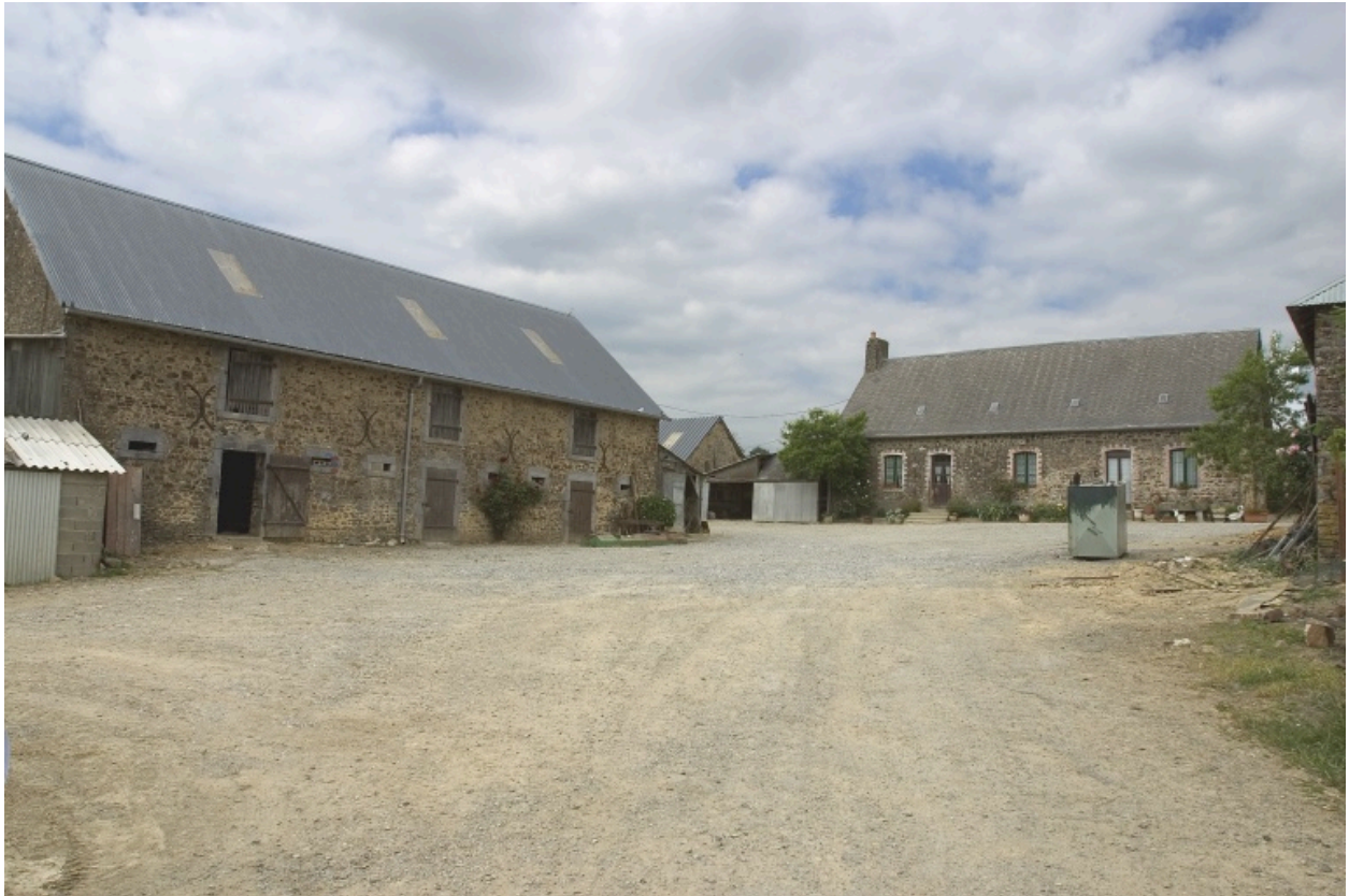
Vue d'ensemble depuis le sud : l'étable-grange et le logis.