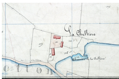
Extrait du plan cadastral de 1842, section D1. IVR52_20045301105NUCA