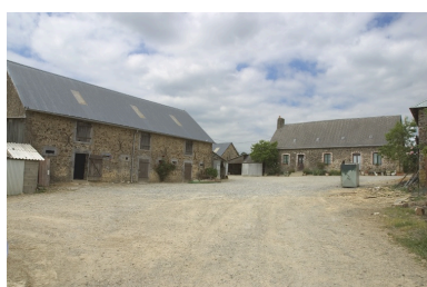
Vue d'ensemble depuis le sud : l'étable-grange et le logis.