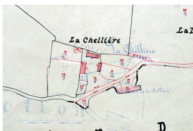
Extrait du plan cadastral de 1936, section D1. IVR52_20045301274NUCA