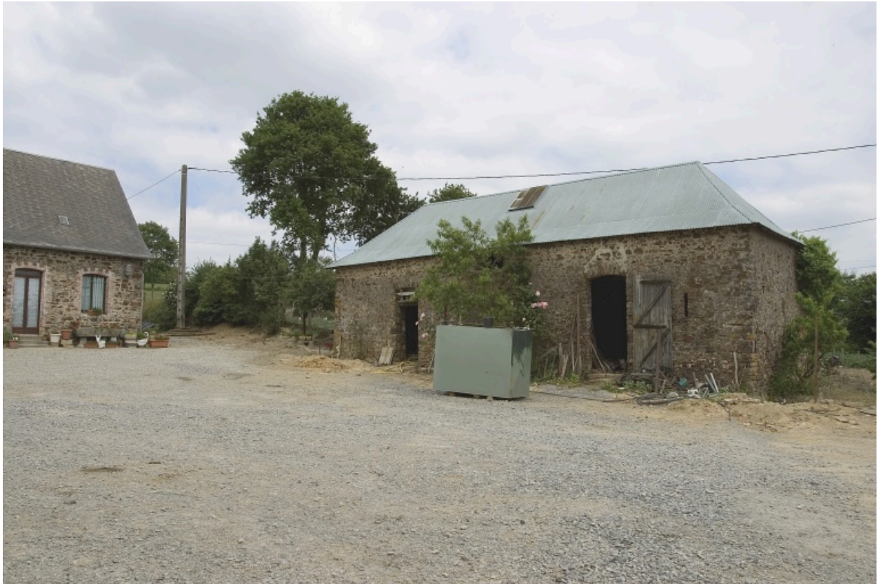
La petite étable.