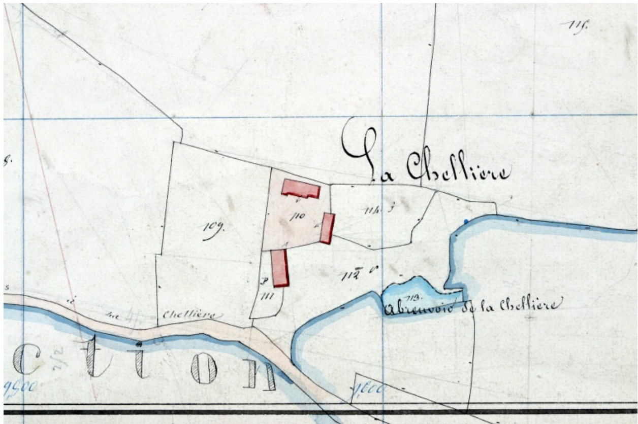
Extrait du plan cadastral de 1842, section D1.