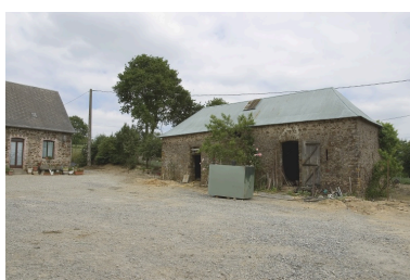
La petite étable. IVR52_20045302053NUCA