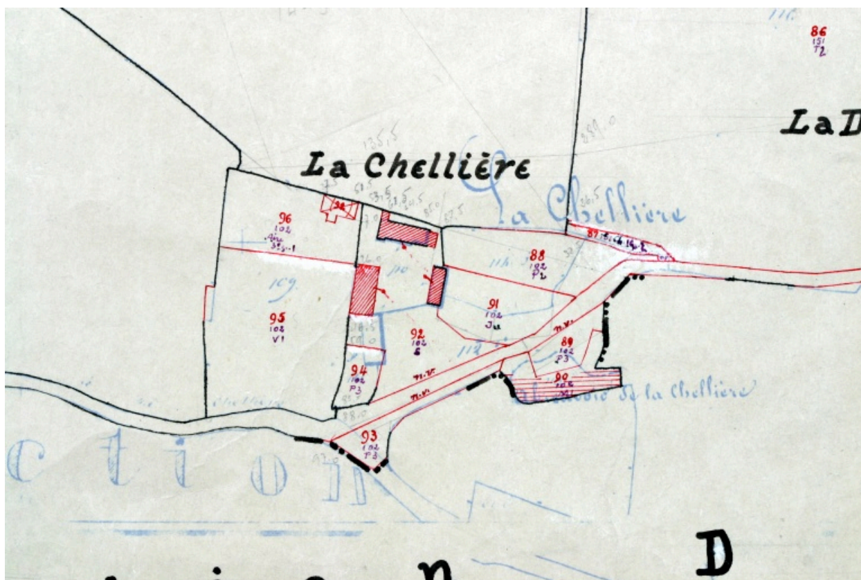
Extrait du plan cadastral de 1936, section D1.