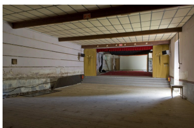
Vue de la salle de théâtre et de cinéma, dans le bâtiment principal. IVR52_20108500362NUCA