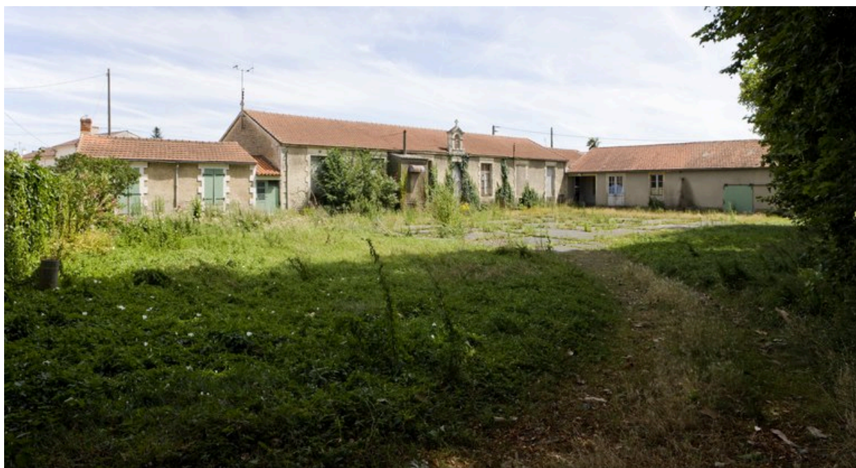
Vue d'ensemble prise du nord-ouest.