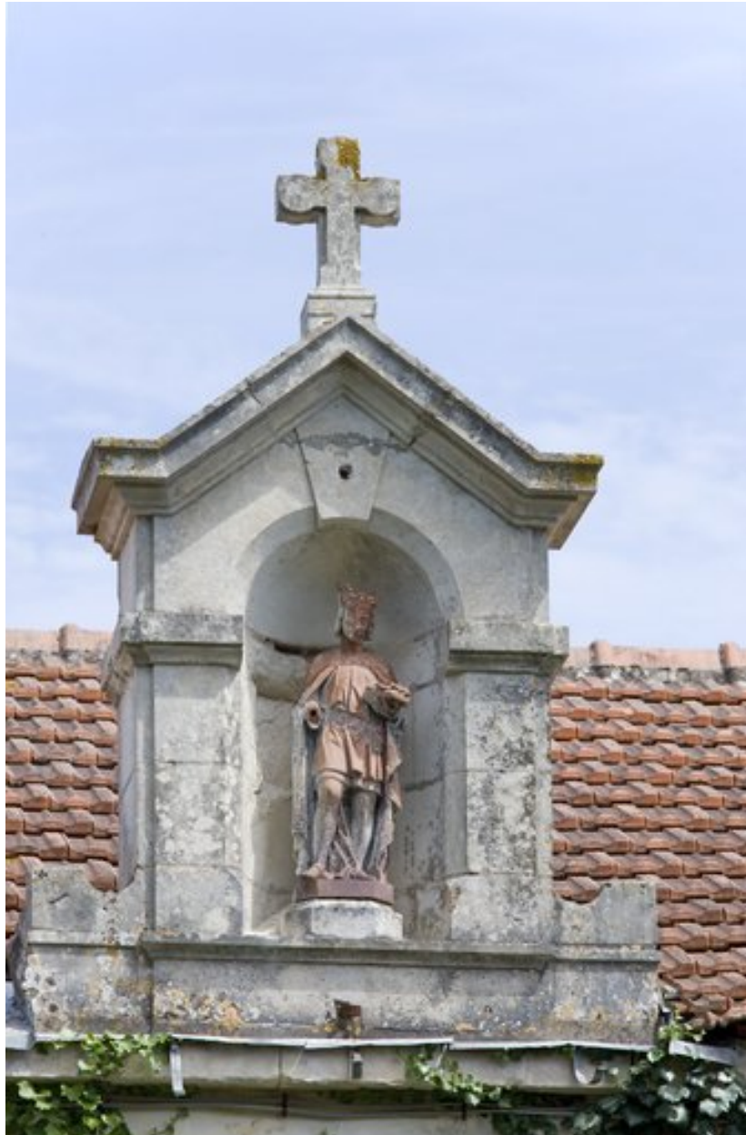
Niche contenant la statue de saint Louis, sur le bâtiment principal.