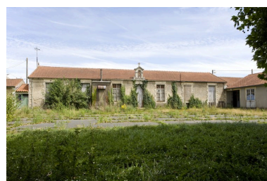
Vue du bâtiment principal, prise de l'ouest.