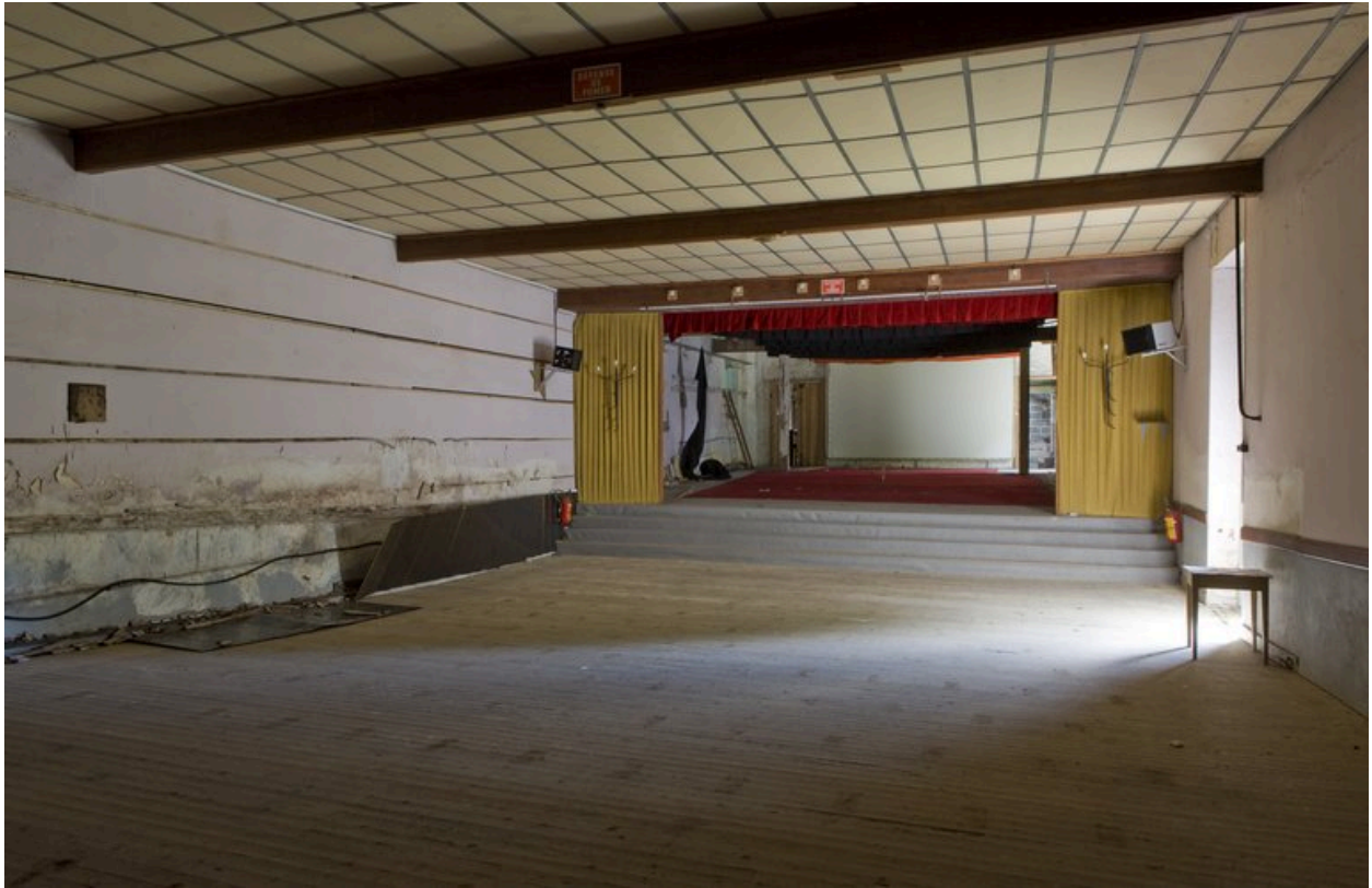
Vue de la salle de théâtre et de cinéma, dans le bâtiment principal.