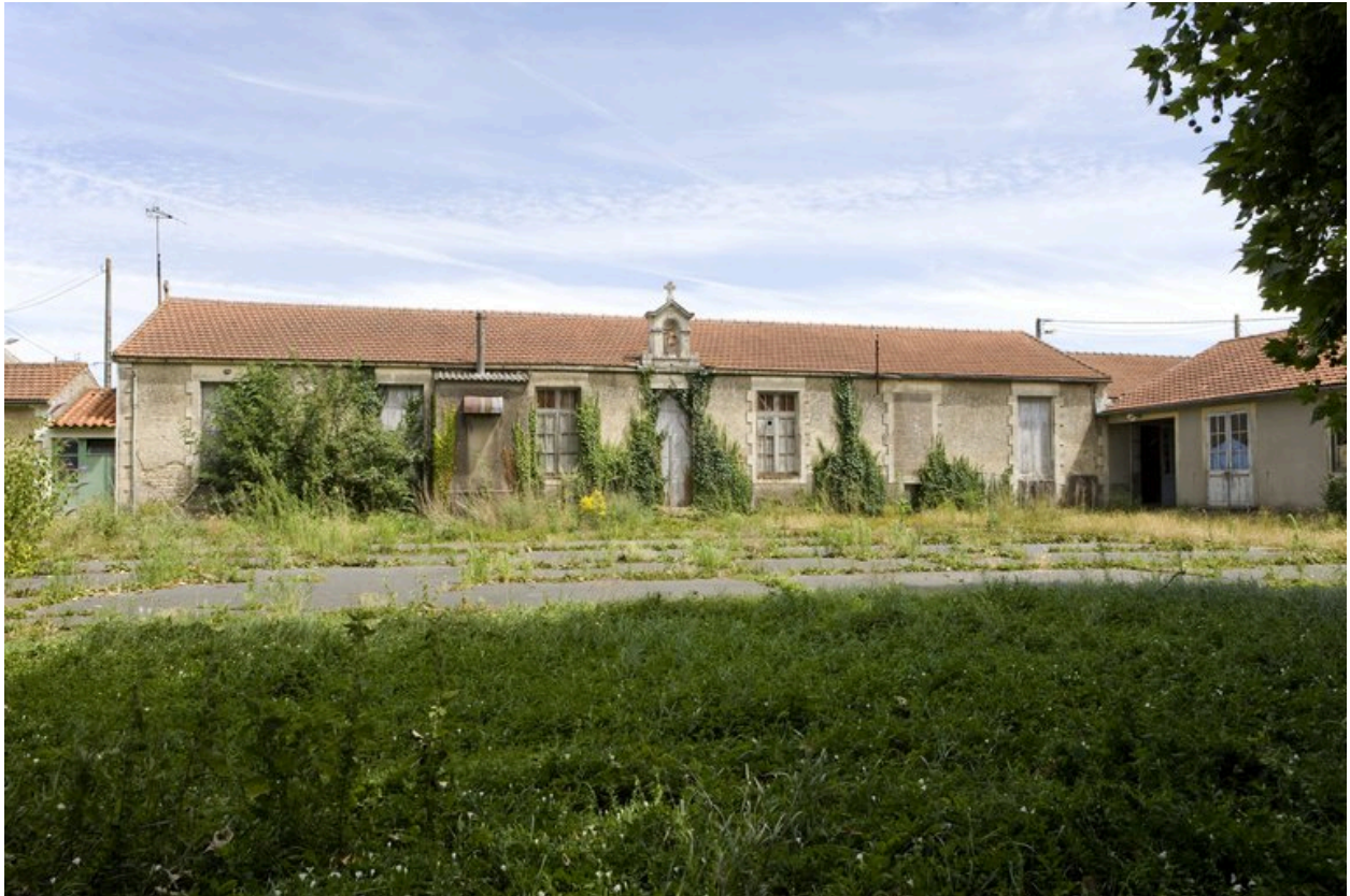
Vue du bâtiment principal, prise de l'ouest.