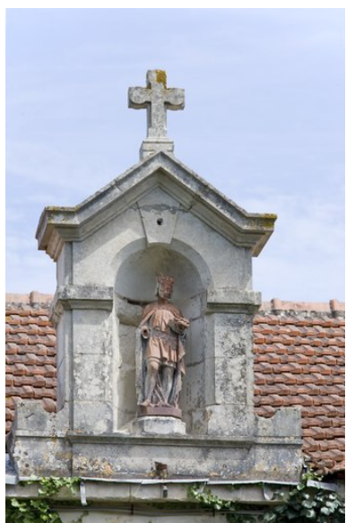
Niche contenant la statue de saint Louis, sur le bâtiment principal.