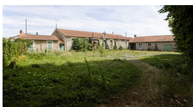
Vue d'ensemble prise du nord-ouest. IVR52_20108500365NUCA