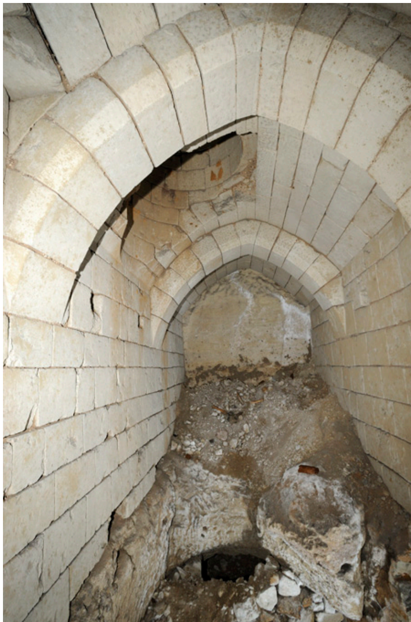
Voûte du palier du second sous-sol : voûte en berceau brisé et doubleaux chanfreinés à clef.