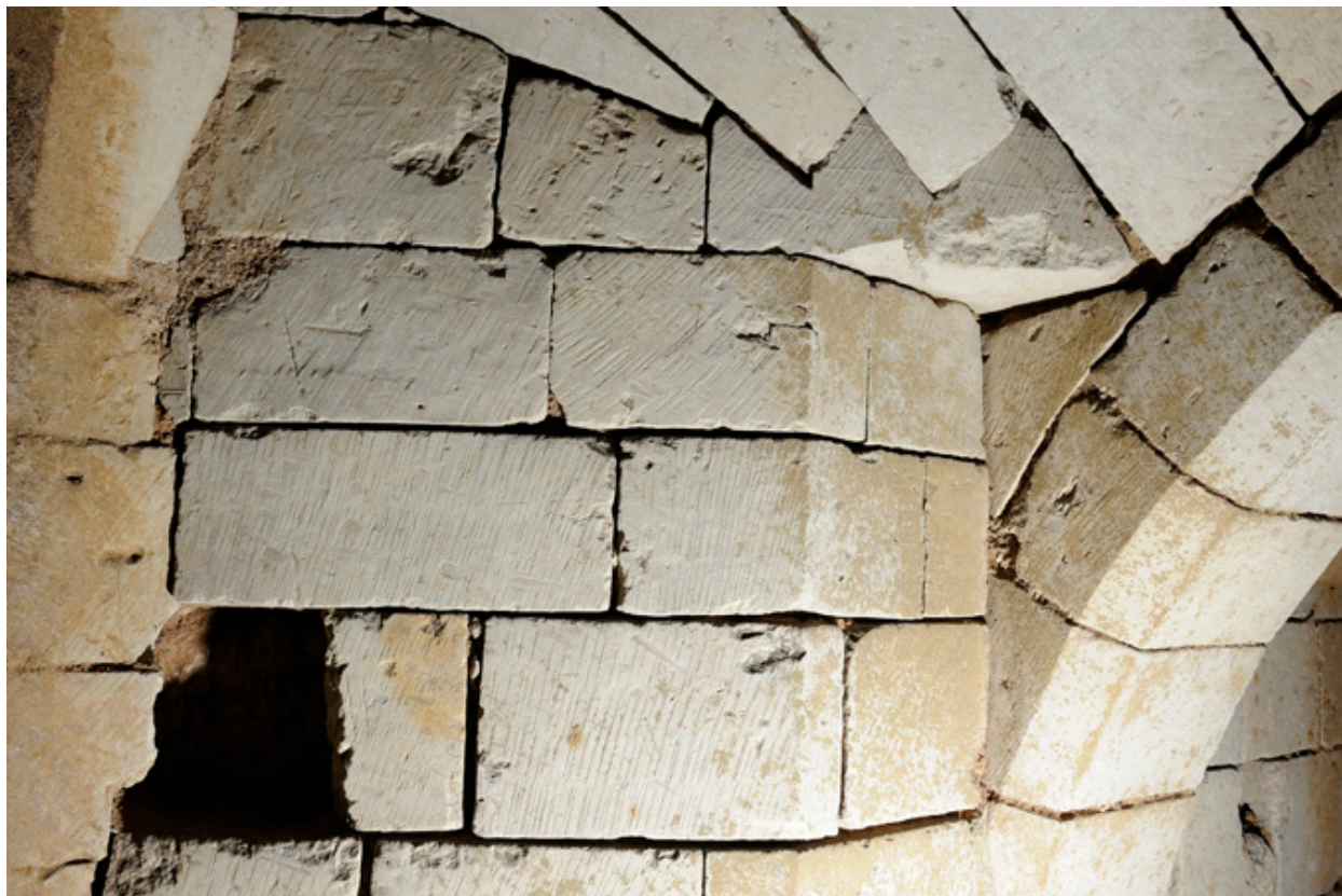
Articulation entre les voûtes de la descente et du palier du second sous-sol : détail de la stéréotomie et du layage.