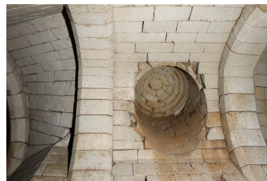
Voûte du palier du second sous-sol : détail du conduit circulaire, obturé. IVR52_20114902212NUCA