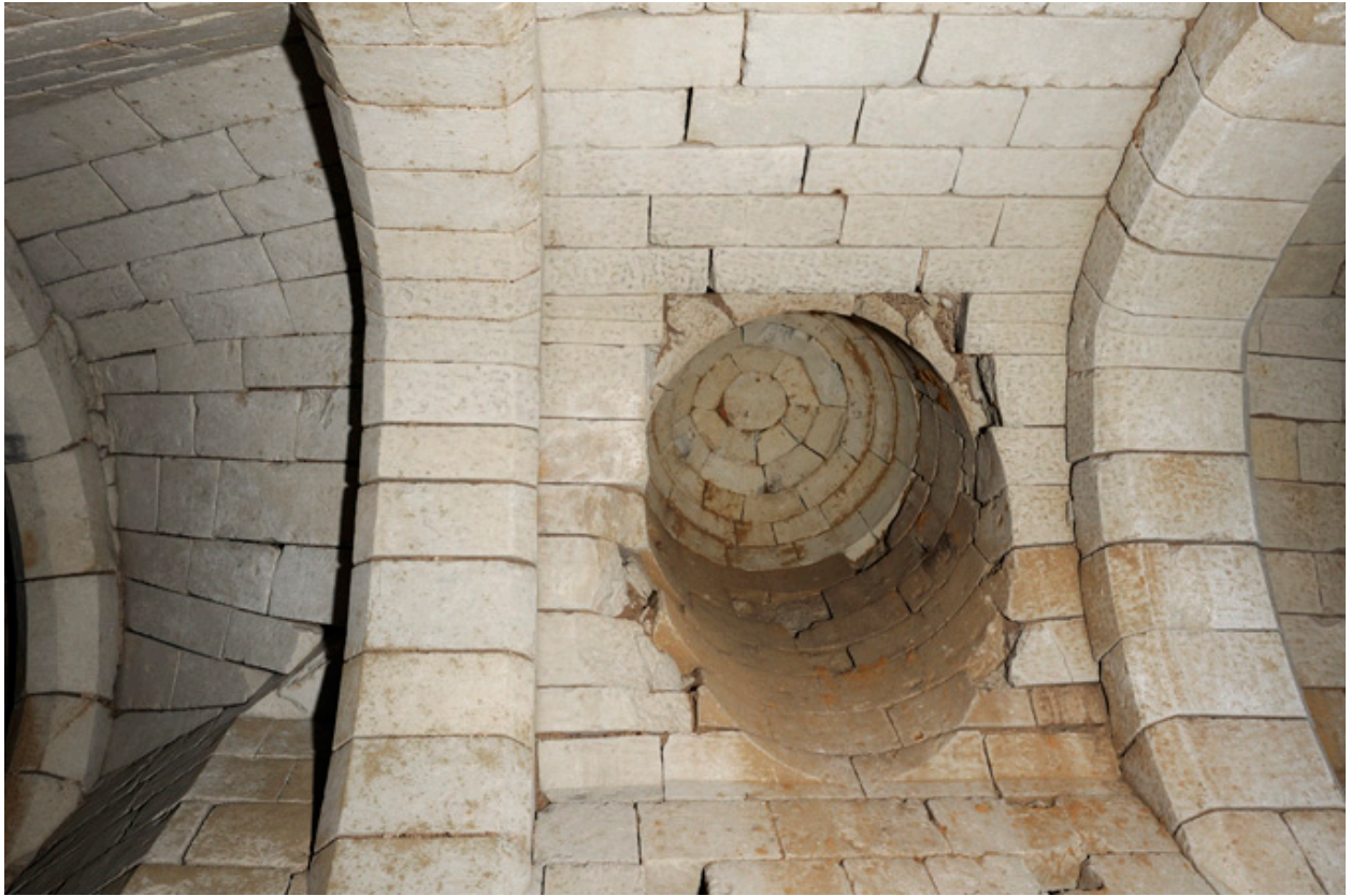
Voûte du palier du second sous-sol : détail du conduit circulaire, obturé.