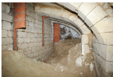
Second sous-sol, cave latérale est : voûte en demi-berceau en anse de panier à doubleaux chanfreinés (consolidée par des doubleaux XIXe siècle en alternance). IVR52_20114902189NUCA