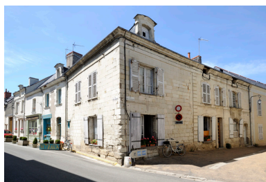
Vue générale, IVR52_20114902198NUCA