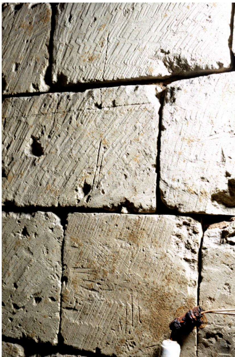
Détail de la paroi de la descente au second sous-sol : marques de gabarit des pierres (I, II, III).