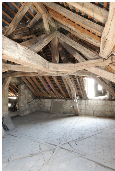
Charpente et comble du corps à l'angle des rues des Masques et Robert d'Arbrissel : enrayures des entrails et faux-entrails, en regard. IVR52_20114902195NUCA