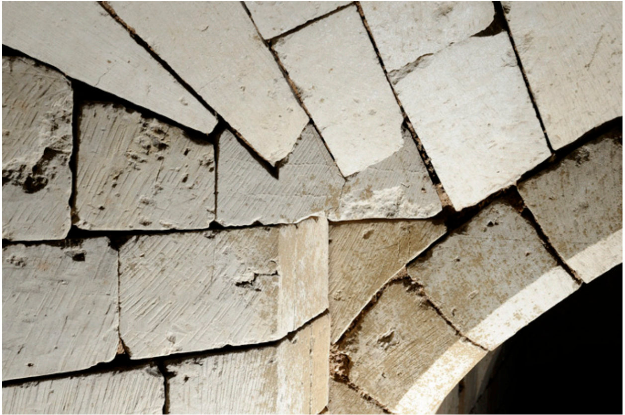
Articulation entre les voûtes de la descente et du palier du second sous-sol : détail (2).