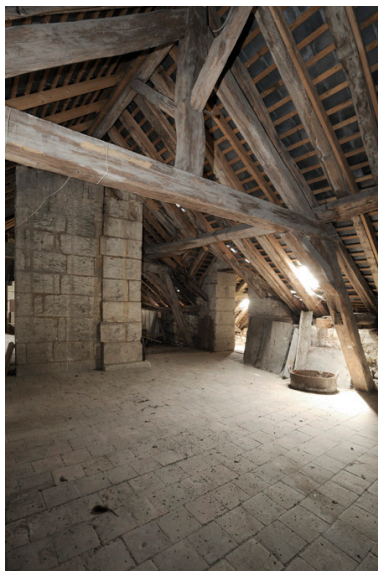
Charpente et comble du corps sur la rue des Masques. IVR52_20114902196NUCA