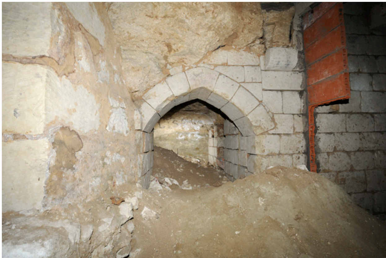
Second sous-sol, entrée de la cave latérale nord : arc brisé à clef, non chanfreiné.