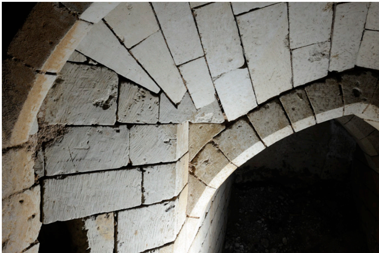
Articulation entre les voûtes de la descente et du palier du second sous-sol.