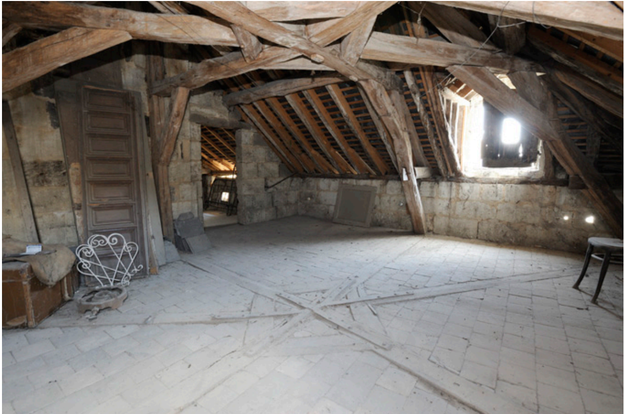
Charpente et comble du corps à l'angle des rues des Masques et Robert d'Arbrissel : enrayures des entrails et faux-entrails, en regard.