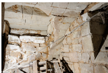
Premier sous-sol : ancien accès depuis la rue des Masques (à gauche, obturé), soupirail ouvrant sur la rue Robert d'Arbrissel (à droite).