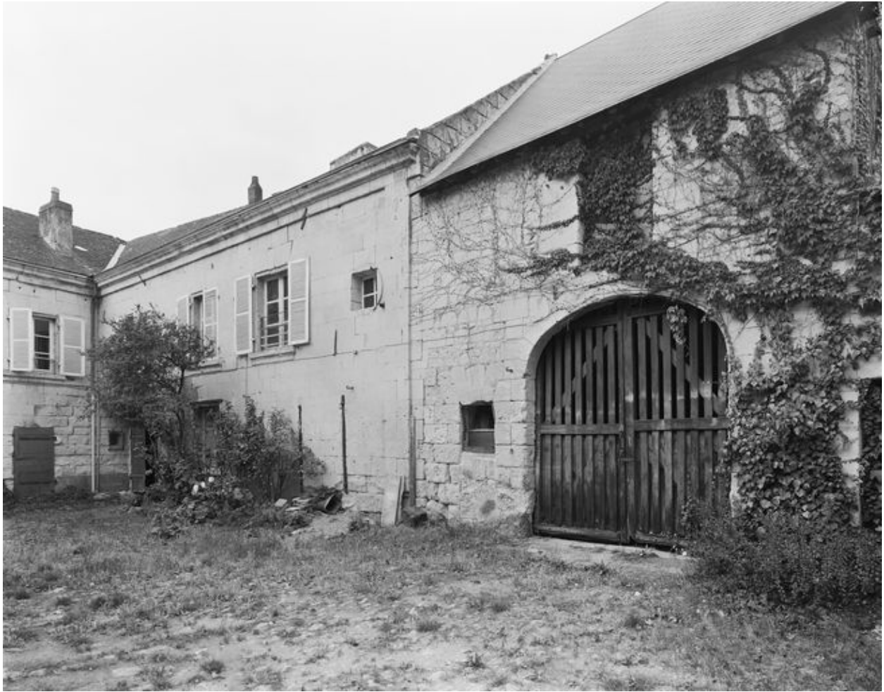
Cour intérieure de la maison, angle sud-ouest (en 1996).