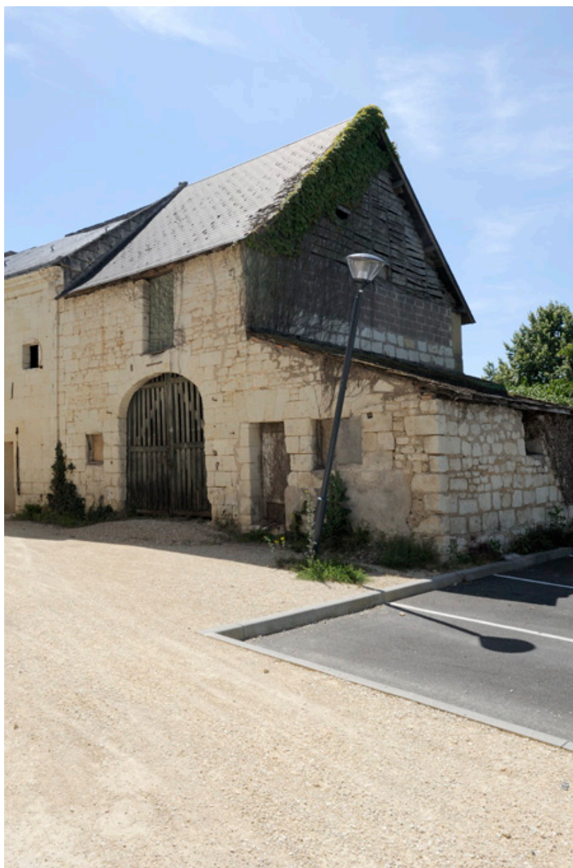
Cour intérieure : grange (XVIIe ou XVIIIe siècle).