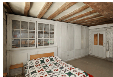
Chambre de l'étage du corps de la rue des masques : boiseries et placards muraux.