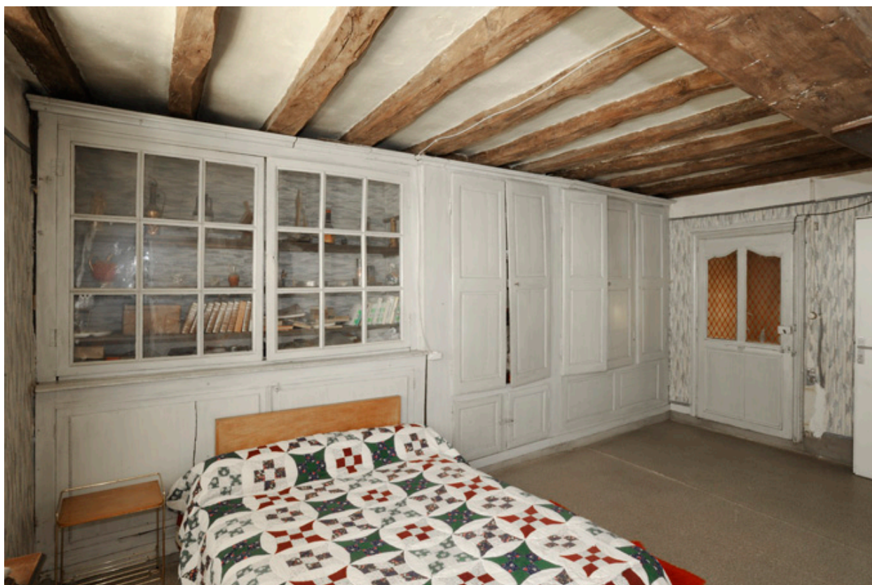
Chambre de l'étage du corps de la rue des masques : boiseries et placards muraux.