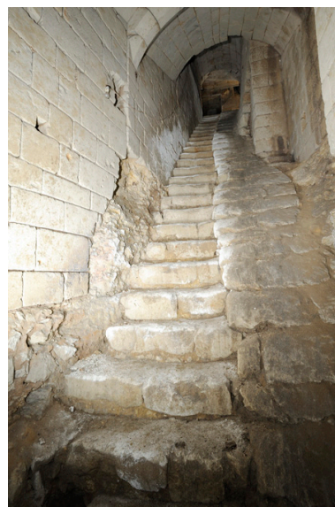
Descente du premier au second sous-sol : escalier droit et rampe. IVR52_20114902191NUCA