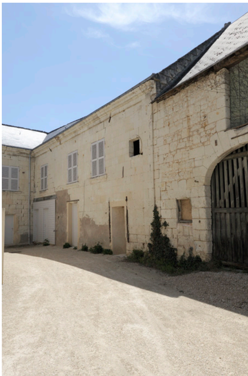
Cour intérieure : ailes postérieures (XIXe) et grange (XVIIe-XVIIIe).