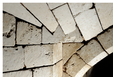
Articulation entre les voûtes de la descente et du palier du second sous-sol : détail (2). IVR52_20114902216NUCA