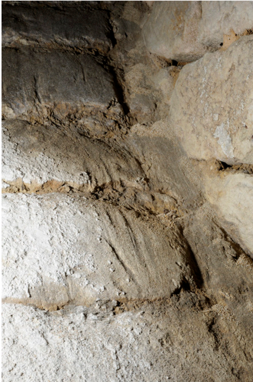
Détail de la rampe descendant au second sous-sol : traces d'usure par frottement (2).