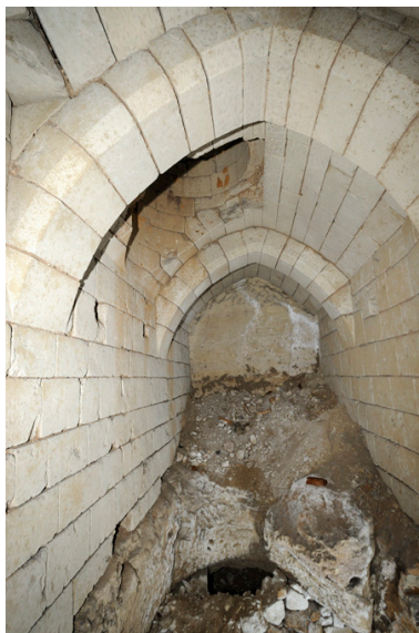
Voûte du palier du second sous-sol : voûte en berceau brisé et doubleaux chanfreinés à clef. IVR52_20114902192NUCA