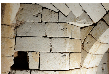
Articulation entre les voûtes de la descente et du palier du second sous-sol : détail de la stéréotomie et du layage. IVR52_20114902214NUCA