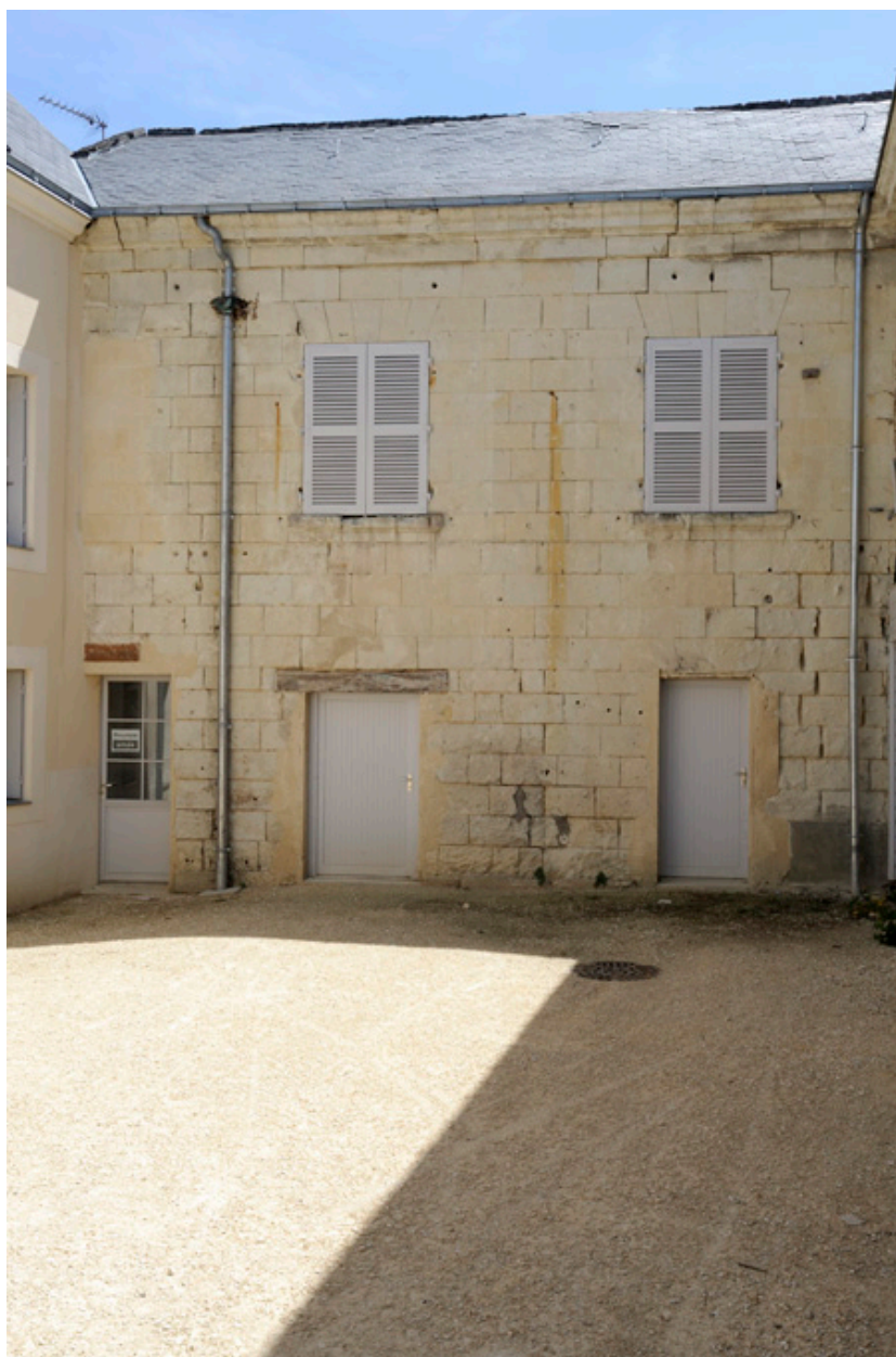
Cour intérieure : ailes postérieures, construites vers 1850.