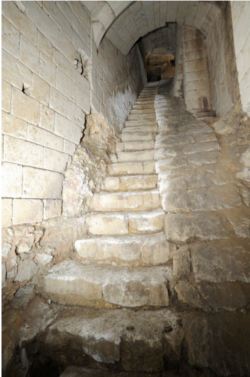
Descente du premier au second sous-sol : escalier droit et rampe.