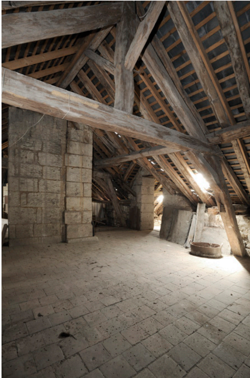
Charpente et comble du corps sur la rue des Masques.