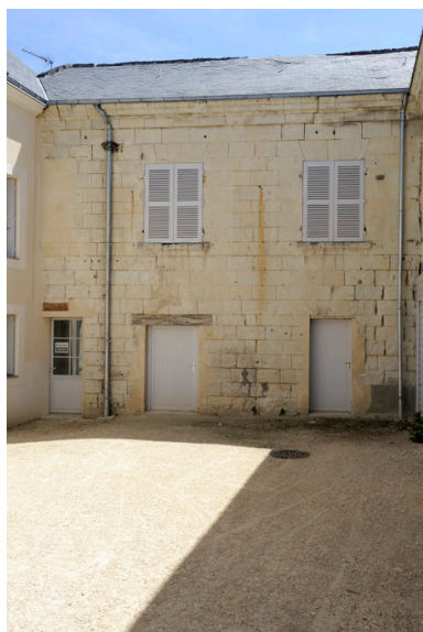
Cour intérieure : ailes postérieures, construites vers 1850. IVR52_20114902199NUCA