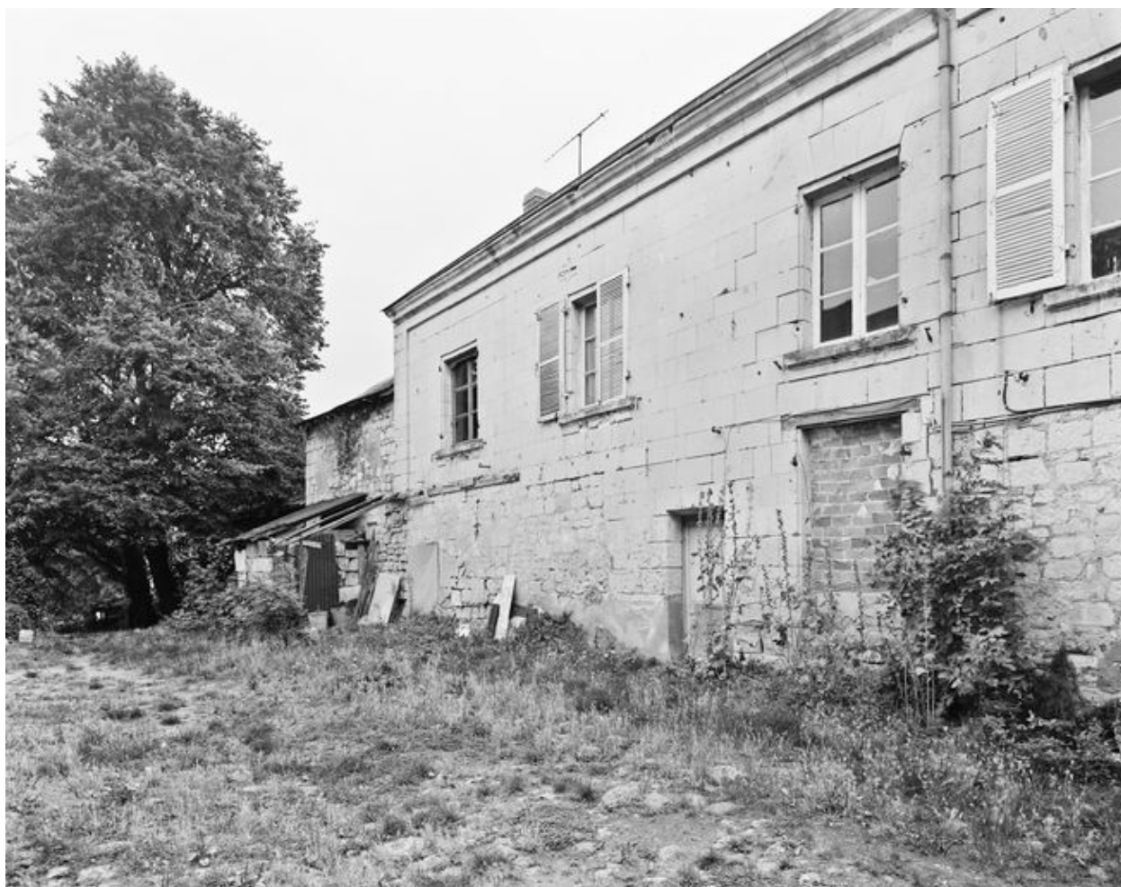
Cour intérieure de la maison, angle nord-est (en 1996).