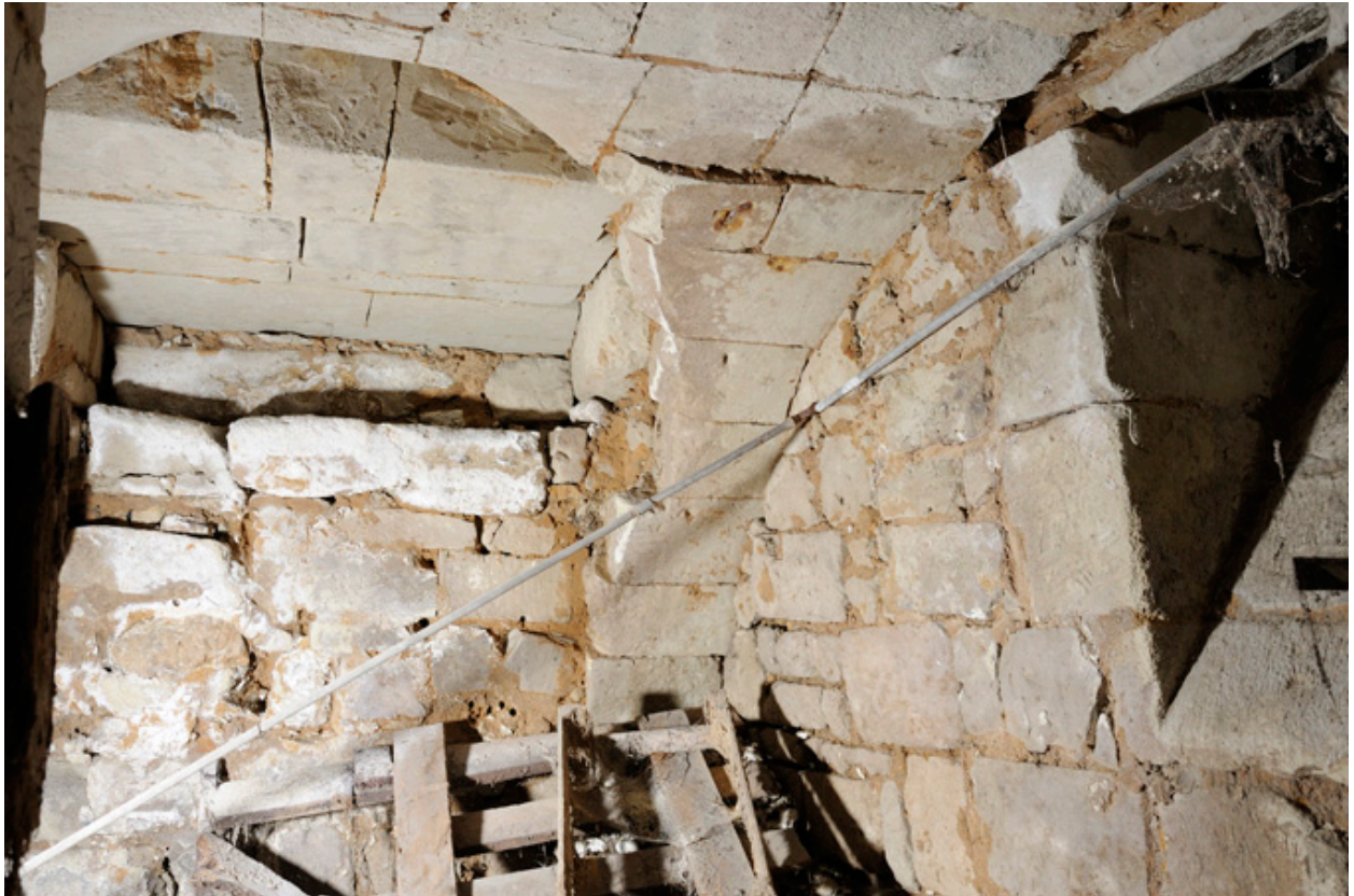
Premier sous-sol : ancien accès depuis la rue des Masques (à gauche, obturé), soupirail ouvrant sur la rue Robert d'Arbrissel (à droite).