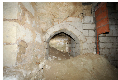
Second sous-sol, entrée de la cave latérale nord : arc brisé à clef, non chanfreiné. IVR52_20114902188NUCA