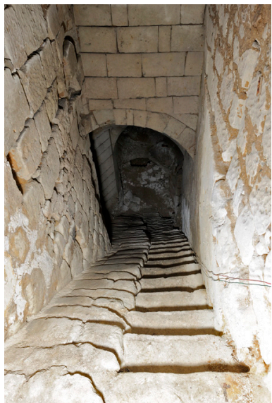
Descente du premier au second sous-sol : partie haute. IVR52_20114902220NUCA