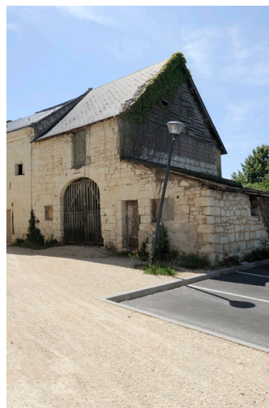
Cour intérieure : grange (XVIIe ou XVIIIe siècle). IVR52_20114902201NUCA