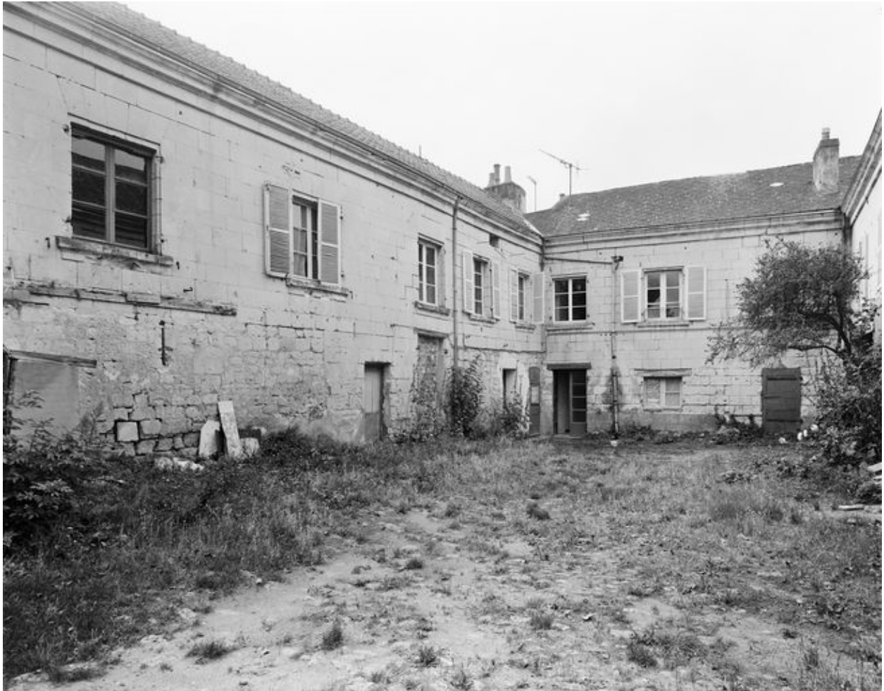
Cour intérieure de la maison, angle sud-est (en 1996).