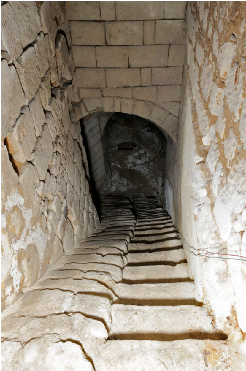
Descente du premier au second sous-sol : partie haute.