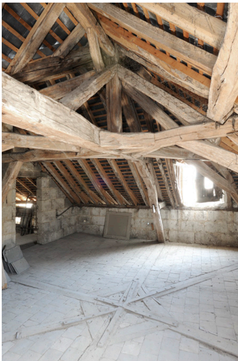
Charpente et comble du corps à l'angle des rues des Masques et Robert d'Arbrissel : enrayures des entrails et faux-entrails, en regard.