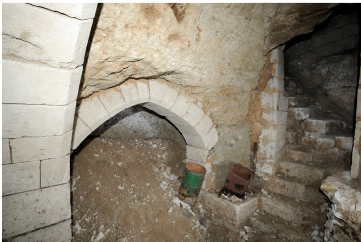
Second sous-sol, entrée de la cave latérale sud (à gauche) : arc brisé chanfreiné.