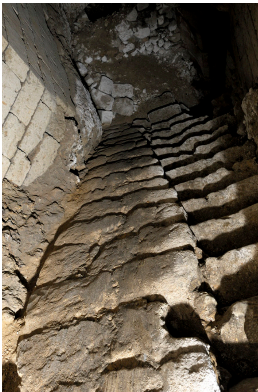
Détail de la rampe descendant au second sous-sol : traces d'usure par frottement.