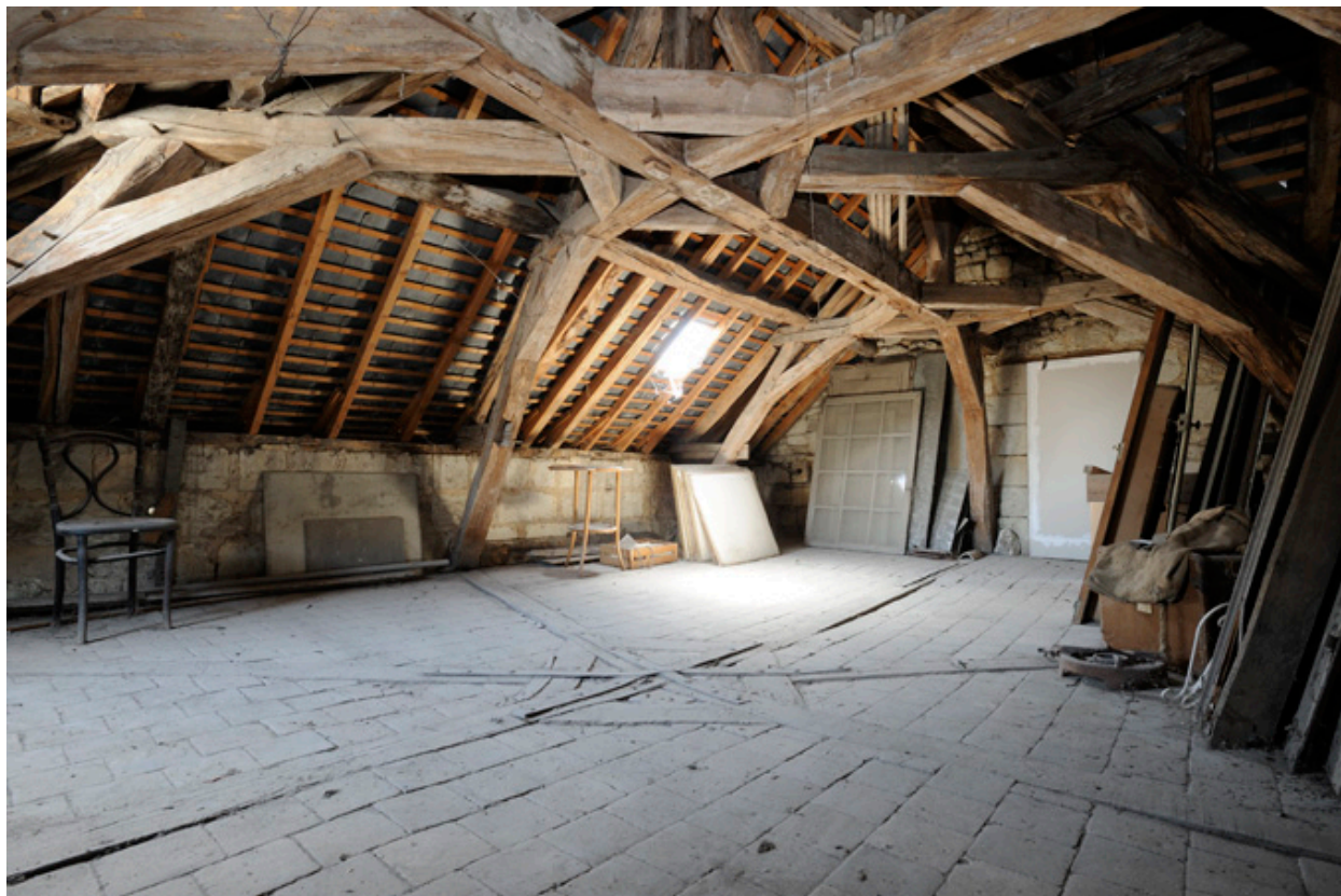
Charpente et comble du corps à l'angle des rues des Masques et Robert d'Arbrissel : enrayures des entrails et faux-entrails, en regard.