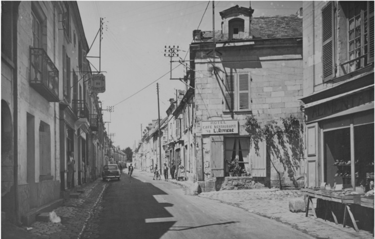
Vue de l'angle de la maison, devenue hôtel-café-restaurant L. Rivière, vers 1950-1960.