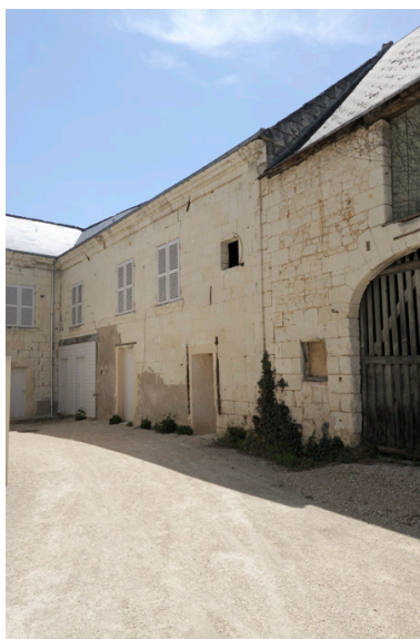
Cour intérieure : ailes postérieures (XIXe) et grange (XVIIe-XVIIIe). IVR52_20114902200NUCA