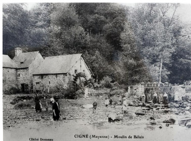
Le moulin et le logis vus depuis l'aval.