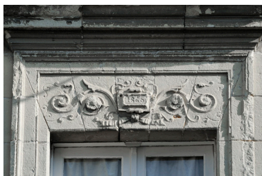
Dessus de fenêtre à décor de rinceaux et cartouche portant la date (1865) IVR52_20114900667NUCA