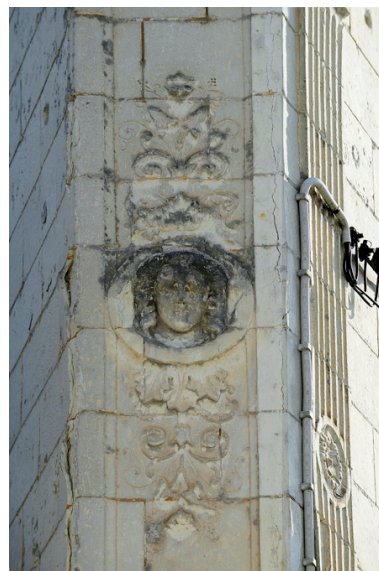
Décor : mascarons et rinceaux IVR52_20114900665NUCA