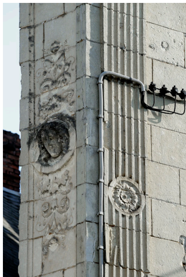
Décor : pilastre cannelé, mascaron, fleuron, rinceaux IVR52_20114900666NUCA