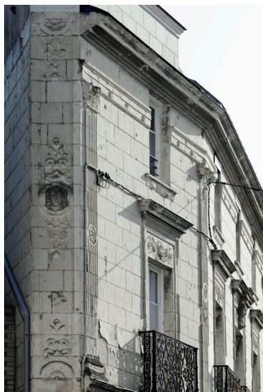
Détail de la façade (2), IVR52_20114900664NUCA