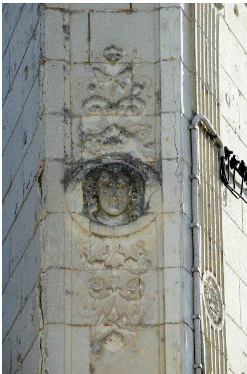
Décor : mascaron et rincaux