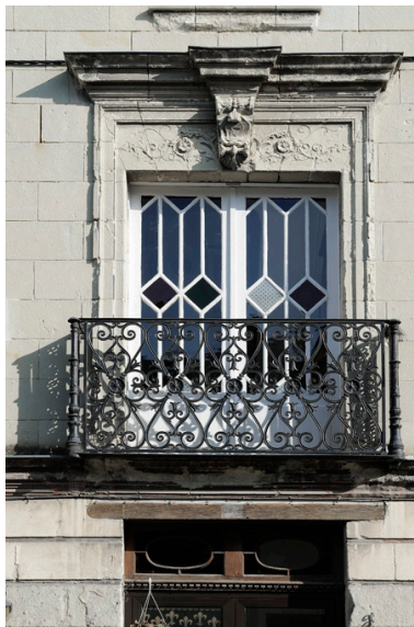
Baie centrale IVR52_20114900668NUCA