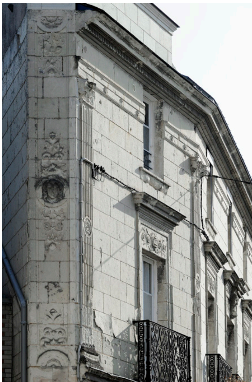
Détail de la façade (2)