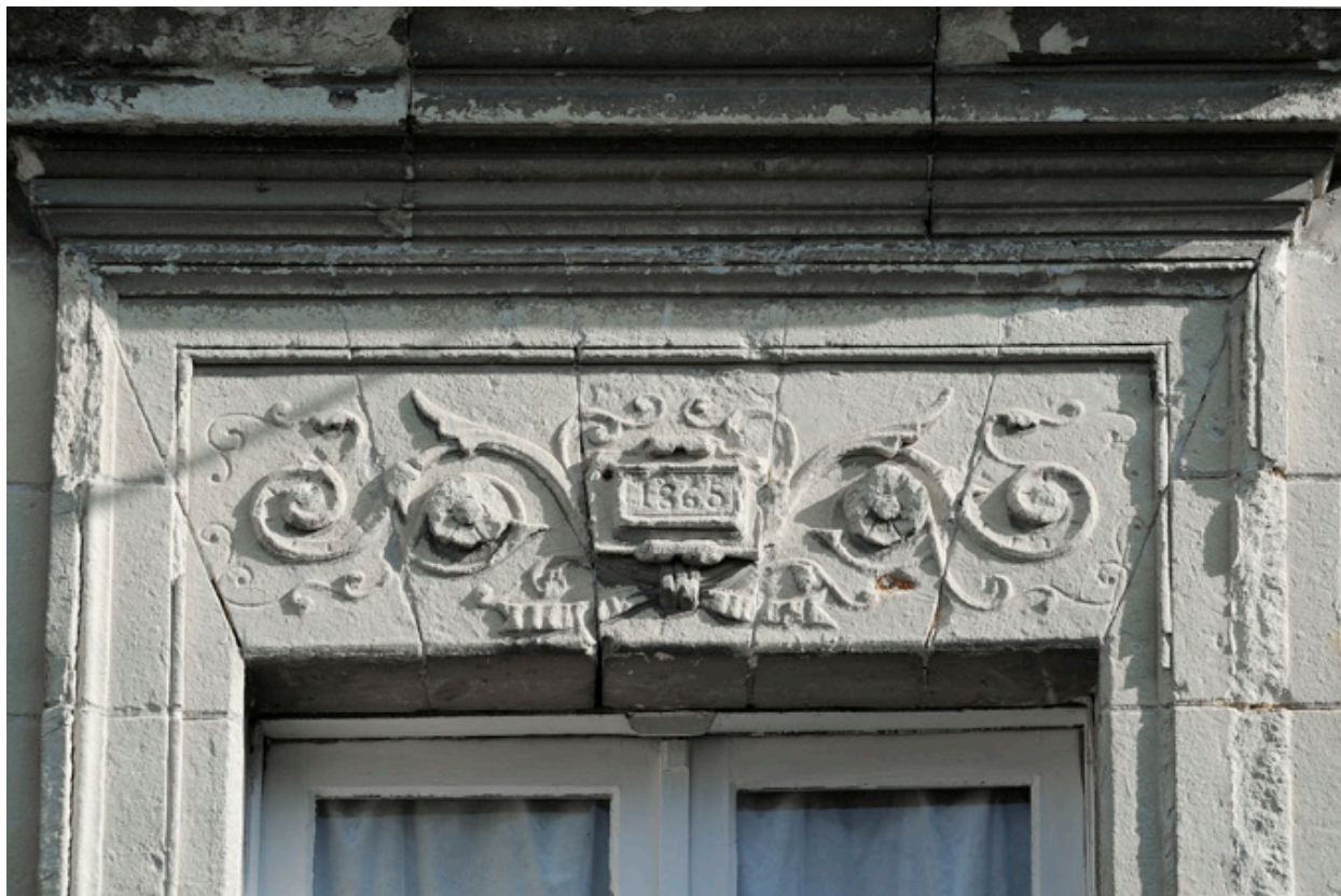
Dessus de fenêtre à décor de rinceaux et cartouche portant la date (1865)