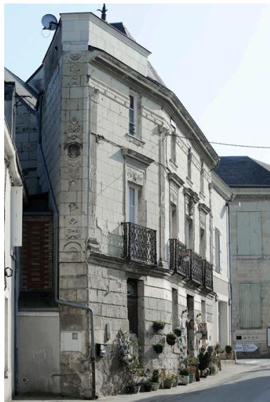
Vue générale IVR52_20114900662NUCA