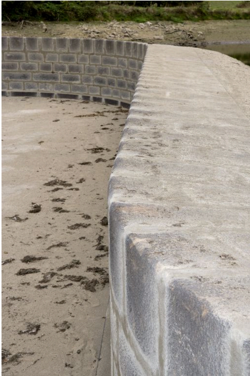
Détail du barrage vu depuis l'est pendant les écourues de 2009.