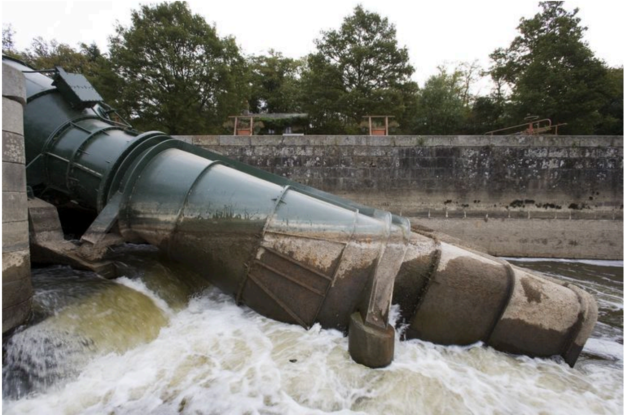
La micro-centrale hydroélectrique vue de côté, pendant les écourues de 2009.