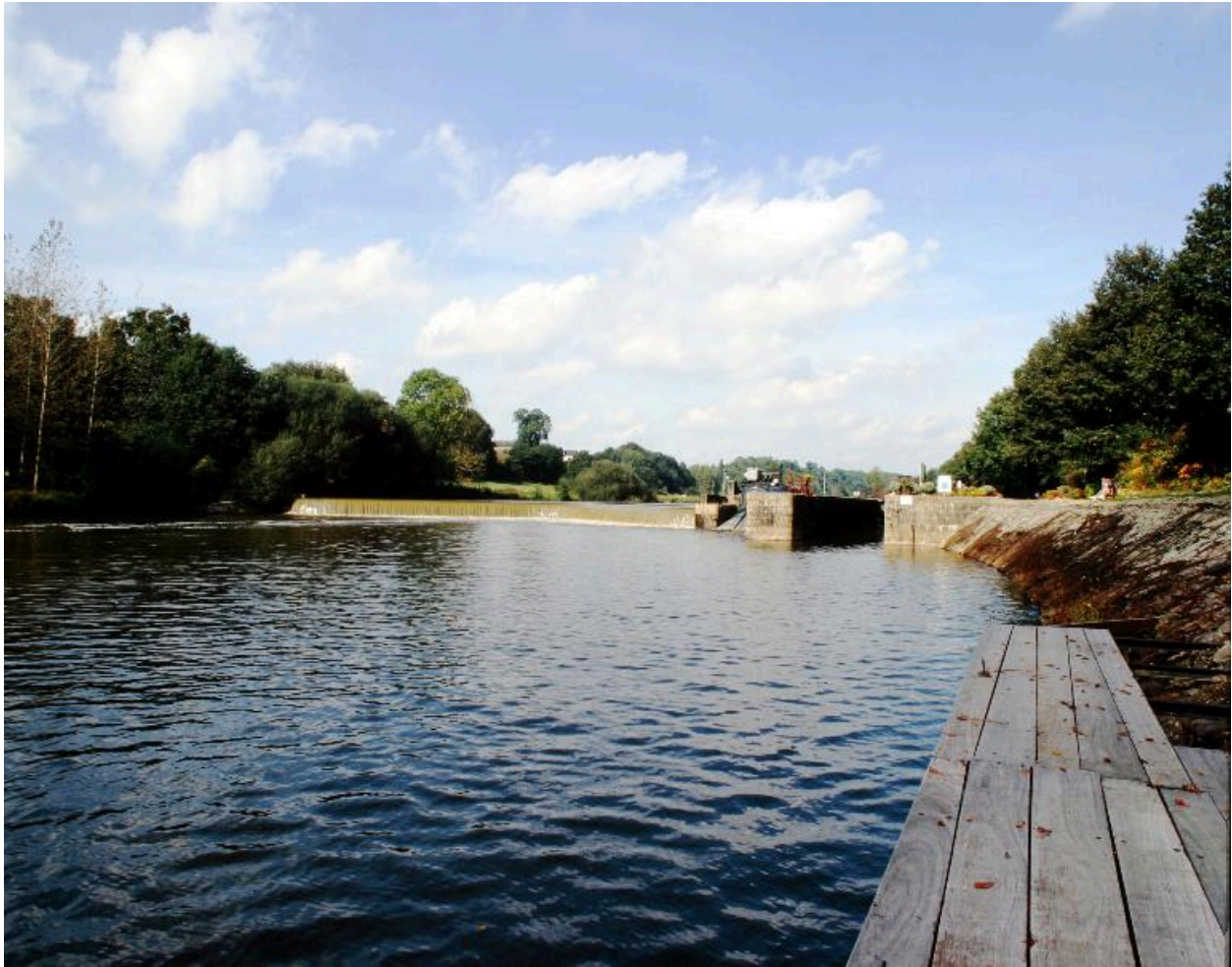
Vue d'ensemble du site d'écluse depuis le ponton situé rive gauche en aval : barrage, centrale hydroélectrique, écluse.