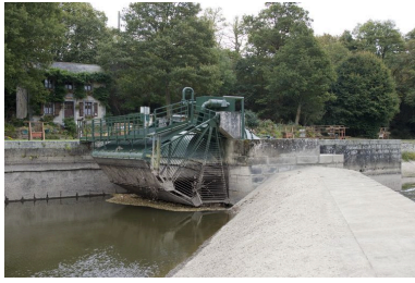
Le pertuis, l'extrémité nord de la micro-centrale hydroélectrique et la maison éclusière vus depuis l'amont, au nord-ouest, pendant les écourues de 2009.

IVR52_20095300455NUCA