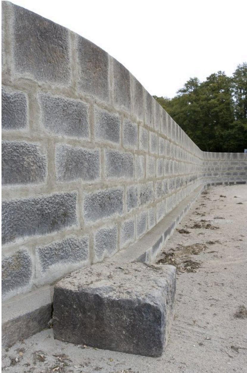
Détail de l'appareil de pierre de taille de granite du barrage, du côté aval, pendant les écourues de 2009.