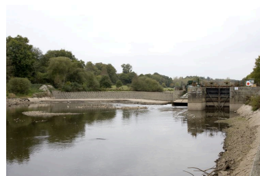
Vue d'ensemble du site d'écluse depuis la rive gauche en aval pendant les écoures de 2009 : barrage, centrale hydroélectrique, écluse.