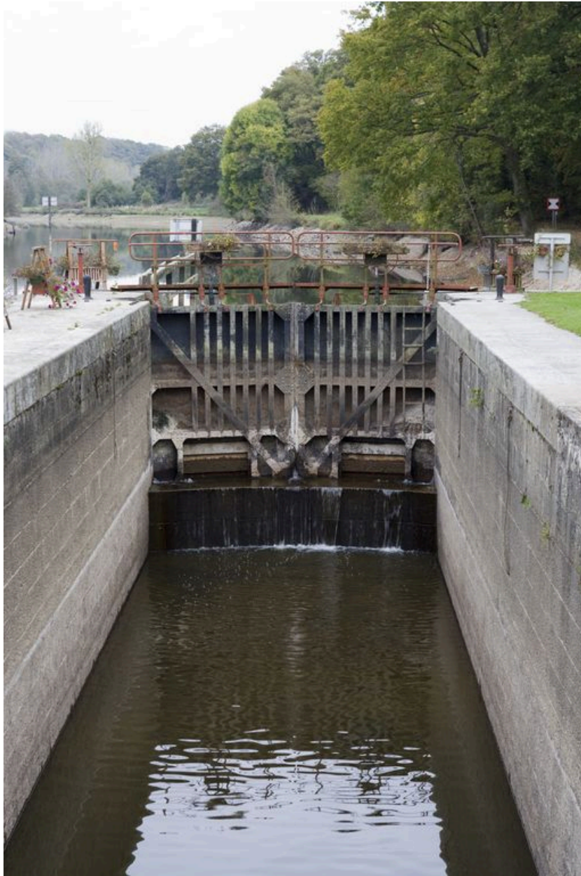
Le sas de l'écluse et la porte amont vus depuis le sud, pendant les écourues de 2009.