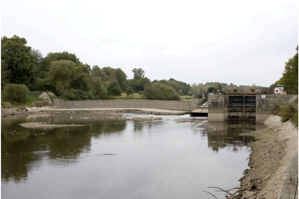
Vue d'ensemble du site d'écluse depuis la rive gauche en aval pendant les écoures de 2009 : barrage, centrale hydroélectrique, écluse.