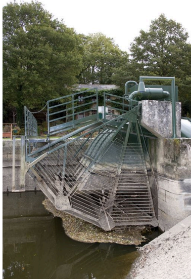
L'extrémité nord de la micro-centrale hydroélectrique vue de côté, depuis l'amont, pendant les écourues de 2009.

IVR52_20095300455NUCA