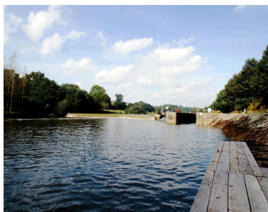
Vue d'ensemble du site d'écluse depuis le ponton situé rive gauche en aval : barrage, centrale hydroélectrique, écluse.