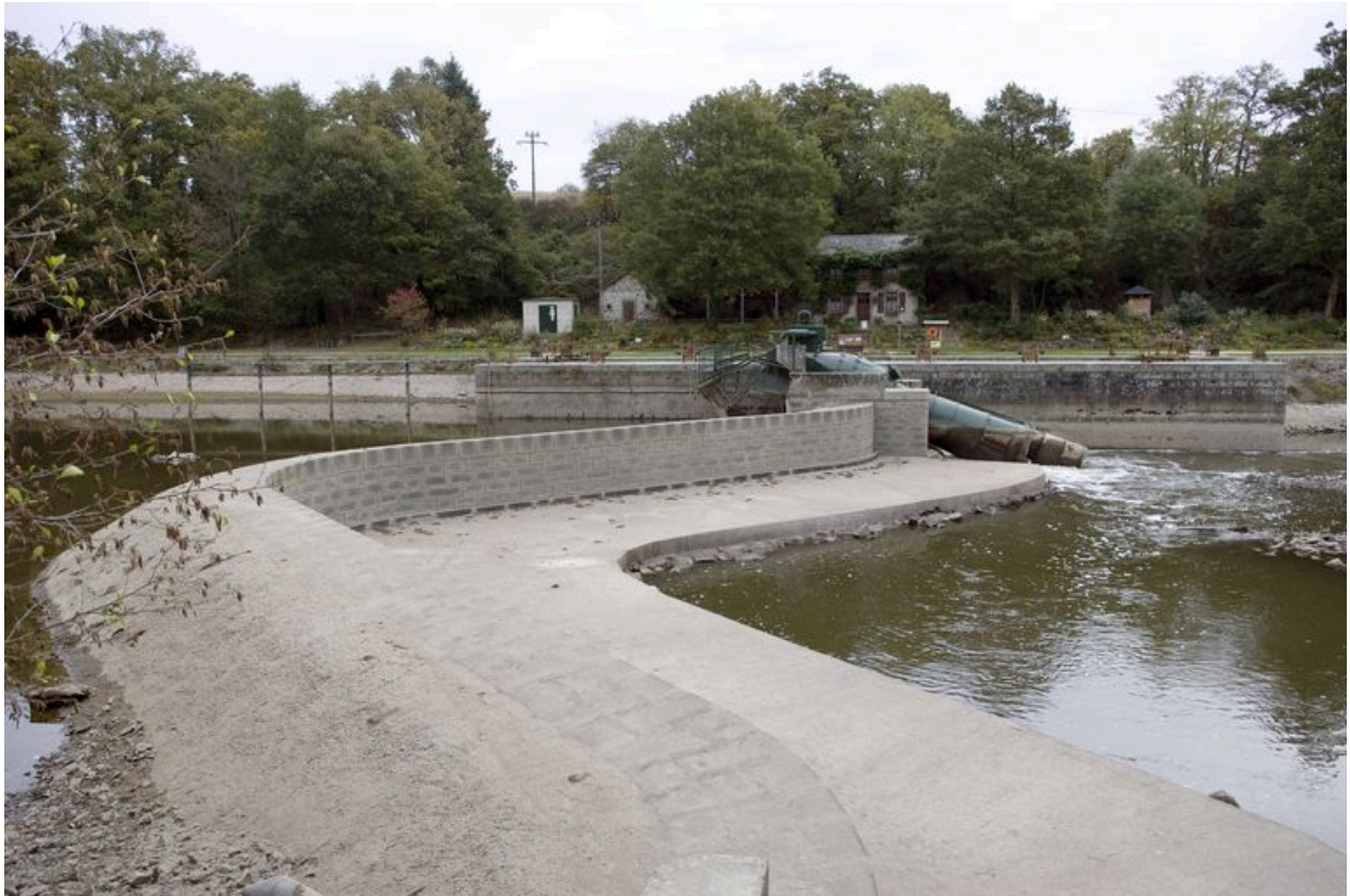
Vue d'ensemble du site d'écluse depuis la rive droite pendant les écourues de 2009 : barrage, centre hydroélectrique, maison éclusière, encadrée à gauche par le transformateur électrique et le fournil et à droite par les latrines.