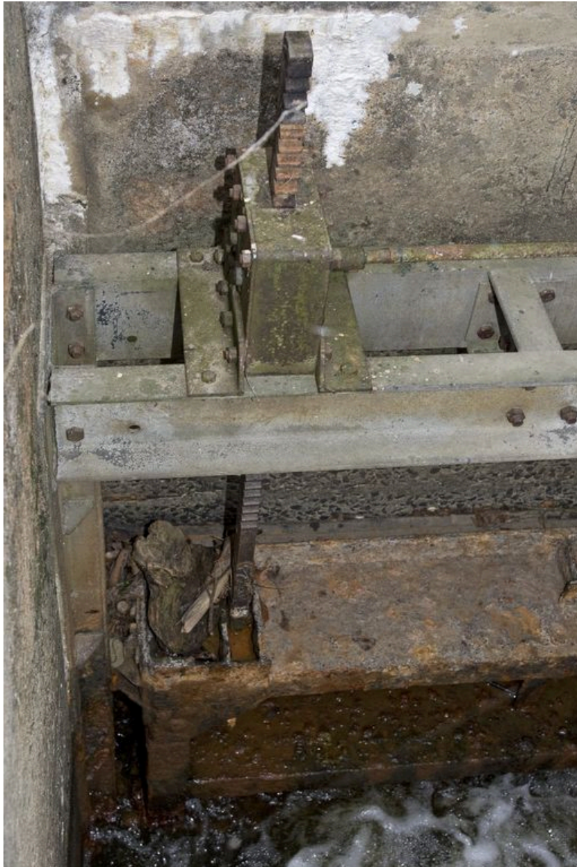
Détail de la vanne et des crémaillères d'une des portes de l'écluse pendant les écourées de 2009.