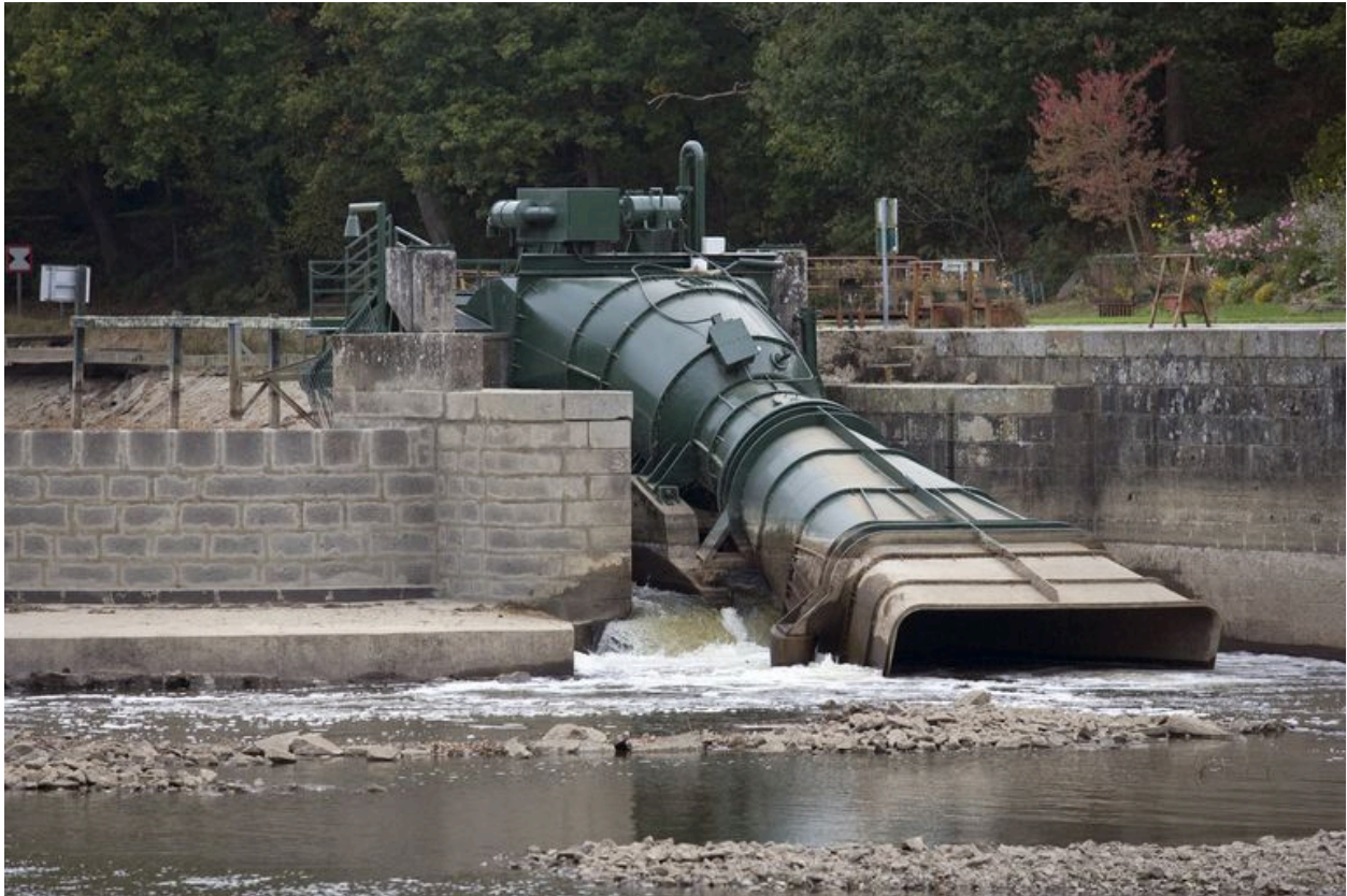
La micro-centrale hydroélectrique vue de trois-quarts depuis l'aval, pendant les écourues de 2009.