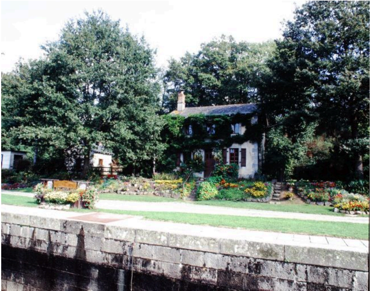
La maison éclusière. A gauche, le transformateur électrique et le fournil.