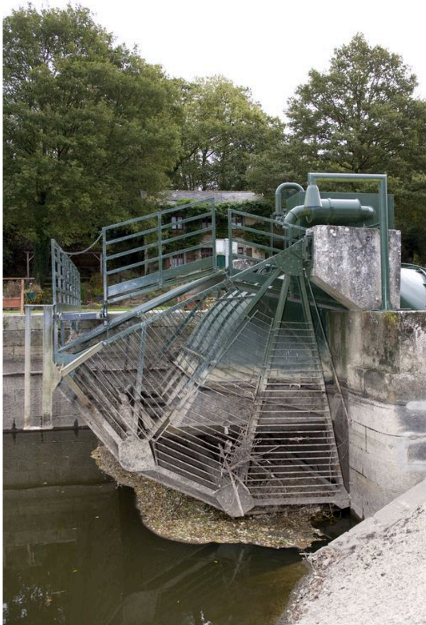
L'extrémité nord de la micro-centrale hydroélectrique vue de côté, depuis l'amont, pendant les écourues de 2009.