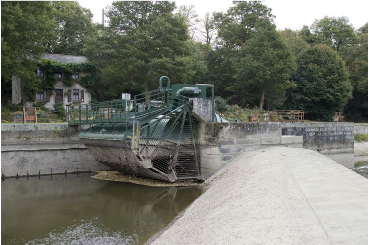
Le pertuis, l'extrémité nord de la micro-centrale hydroélectrique et la maison éclusière vus depuis l'amont, au nord-ouest, pendant les écoures de 2009.