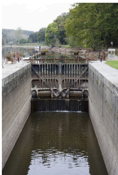
Le sas de l'écluse et la porte amont vus depuis le sud, pendant les écoures de 2009.