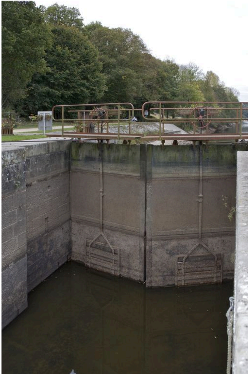
Le sas de l'écluse et la porte aval vus depuis le nord, pendant les écourues de 2009.