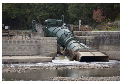
La micro-centrale hydroélectrique vue de trois-quarts depuis l'aval, pendant les écoures de 2009. IVR52_20095300454NUCA