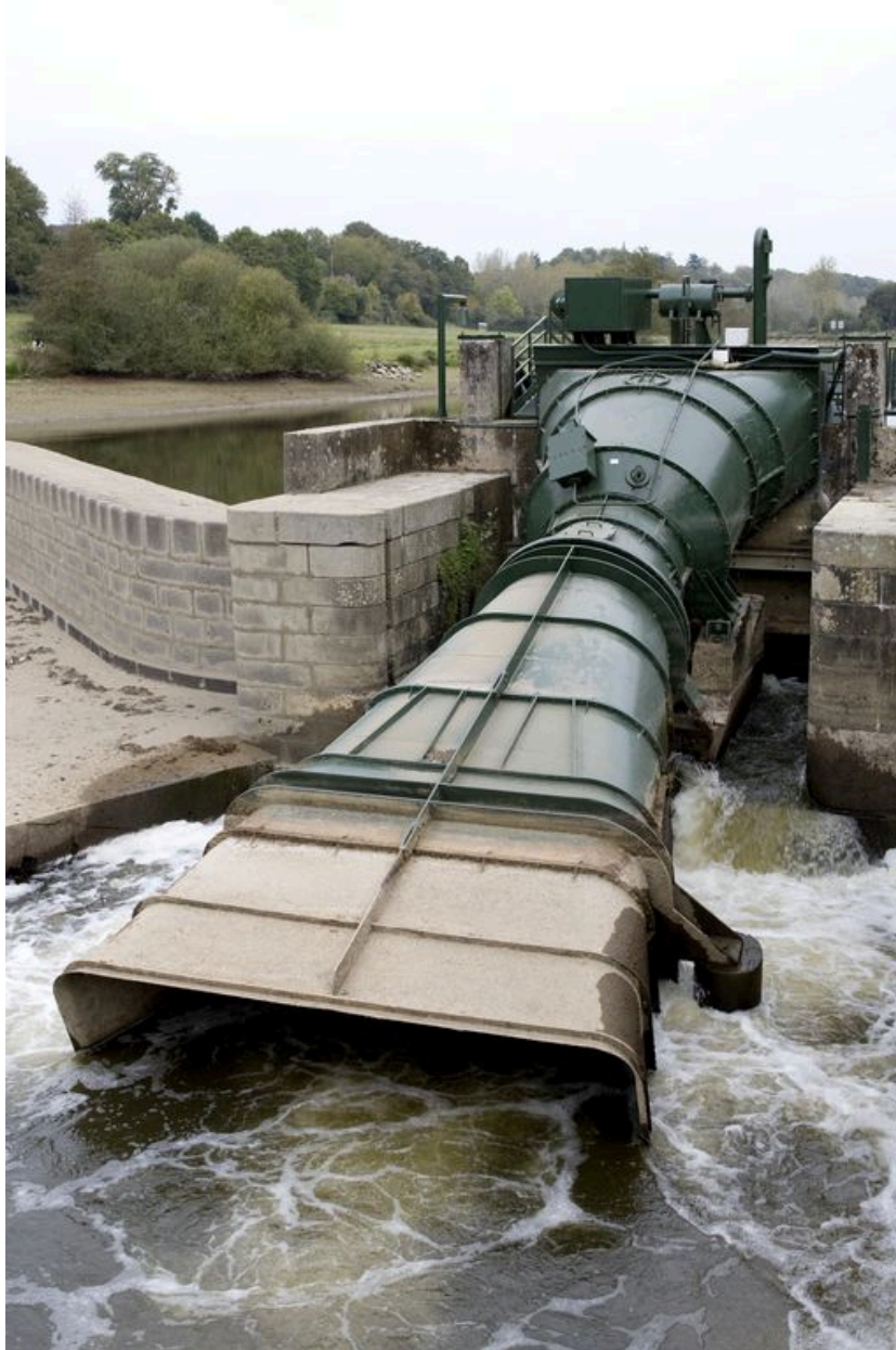
La micro-centrale hydroélectrique vue de face depuis l'aval, pendant les écourues de 2009.