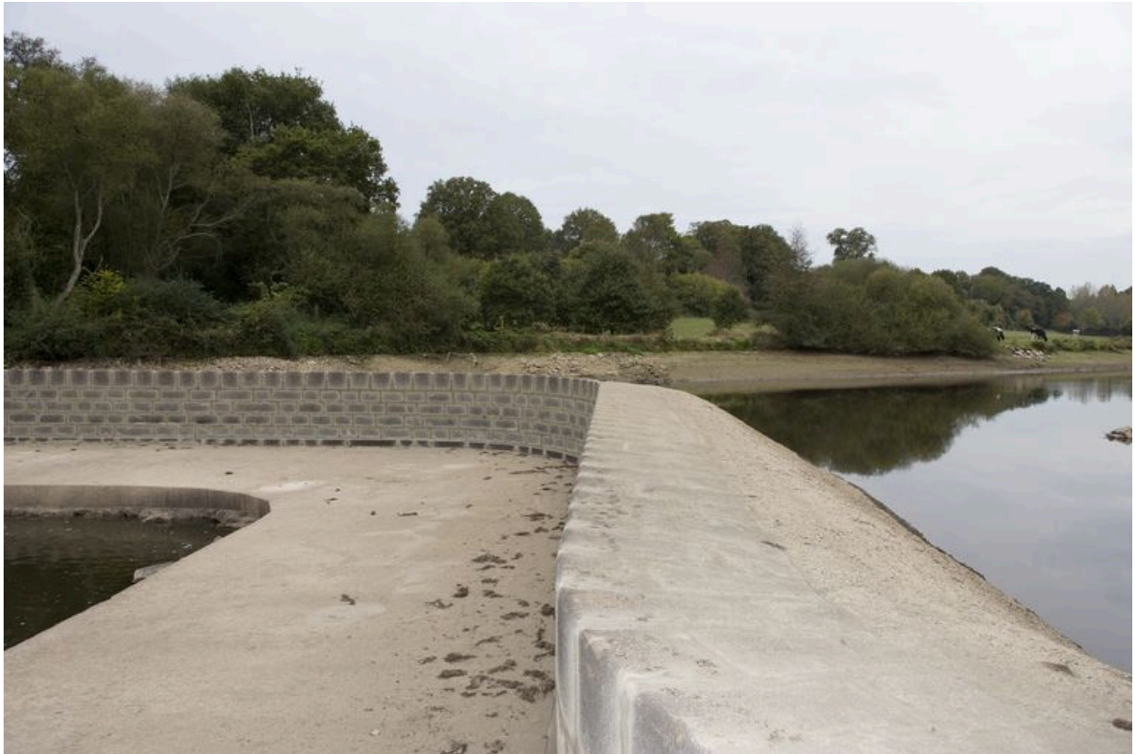
Le barrage vue depuis l'est pendant les écourues de 2009.