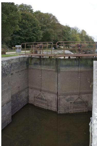
Le sas de l'écluse et la porte aval vus depuis le nord, pendant les écoures de 2009. IVR52_20095300457NUCA