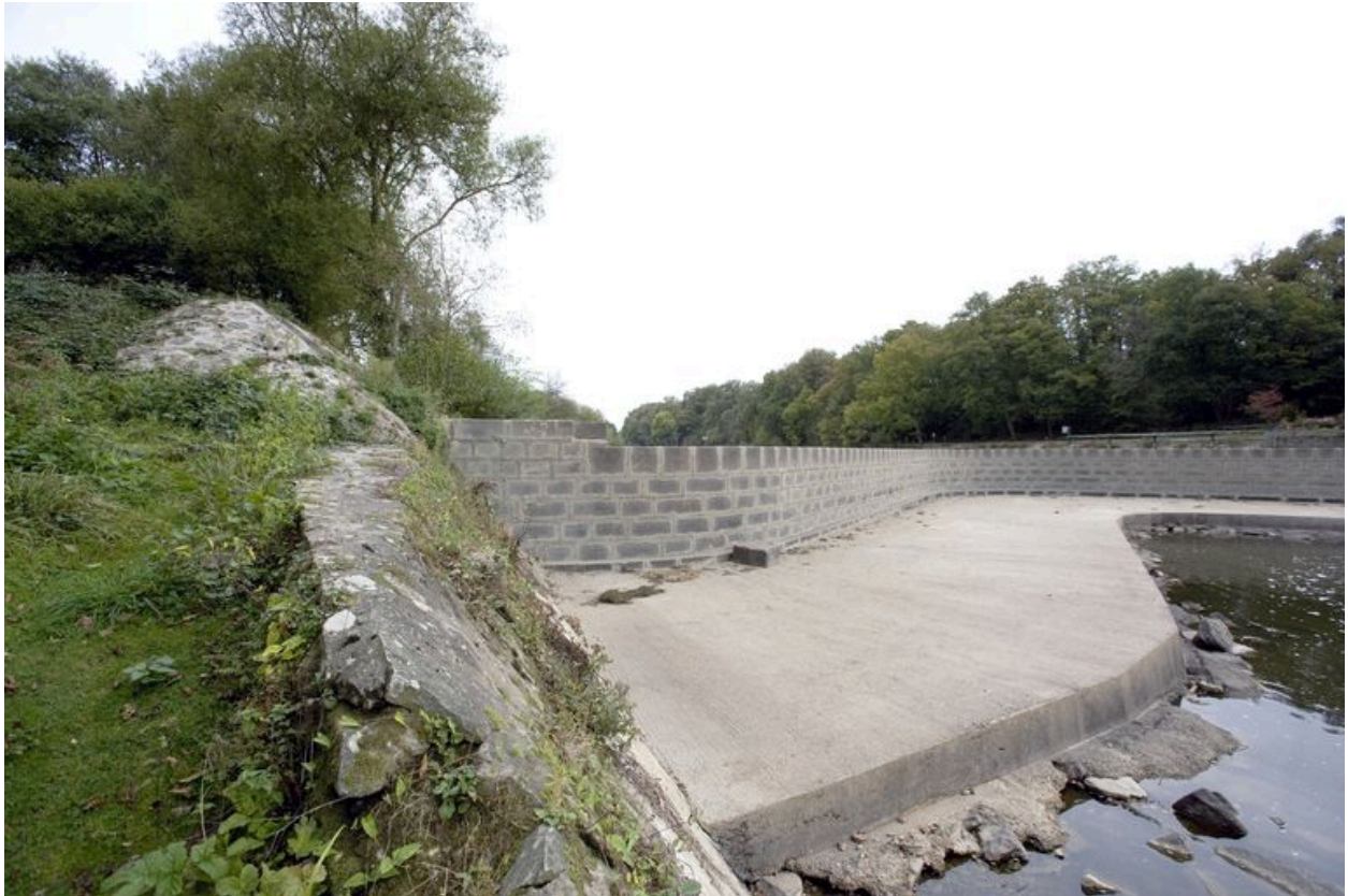
Le barrage vu depuis la rive droite en aval, au sud-ouest, pendant les écourues de 2009.