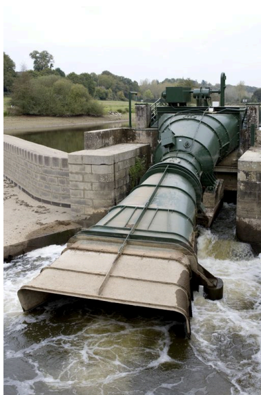
La micro-centrale hydroélectrique vue de face depuis l'aval, pendant les écoures de 2009.