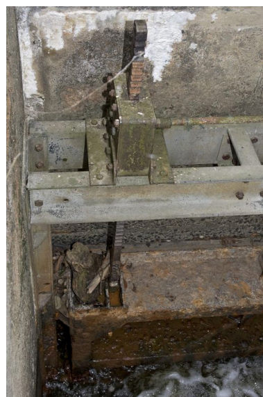
Détail de la vanne et des crémaillère d'une des portes de l'écluse pendant les écoures de 2009.