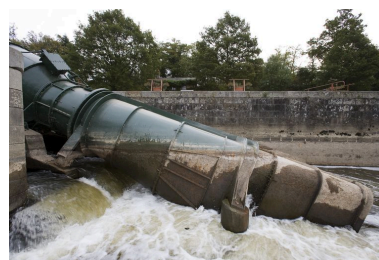
La micro-centrale hydroélectrique vue de côté, pendant les écoures de 2009.