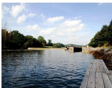
Vue d'ensemble du site d'écluse depuis le ponton situé rive gauche en aval : barrage, centrale hydroélectrique, écluse.