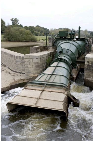
La micro-centrale hydroélectrique vue de face depuis l'aval, pendant les écourues de 2009. IVR52_20095300446NUCA