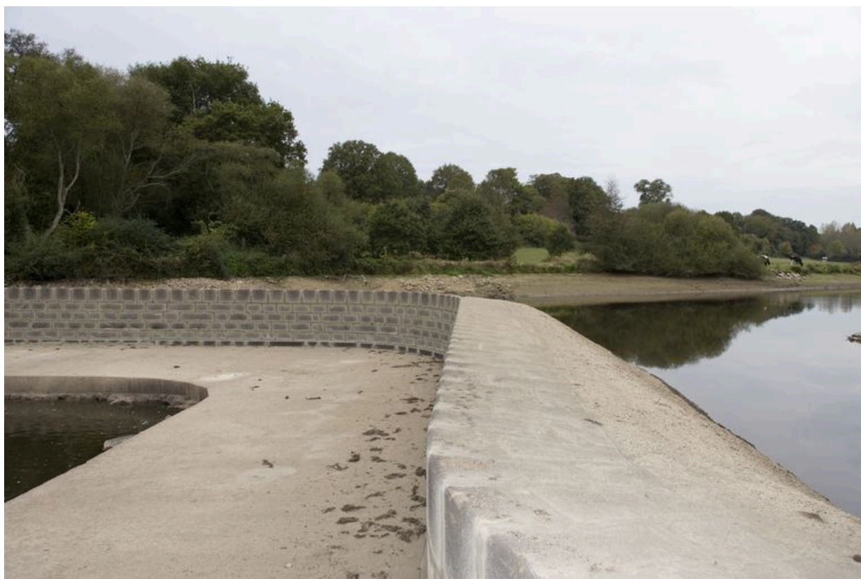
Le barrage vue depuis l'est pendant les écourues de 2009.