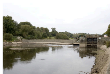
Vue d'ensemble du site d'écluse depuis la rive gauche en aval pendant les écoures de 2009 : barrage, centrale hydroélectrique, écluse. IVR52_20095300444NUCA