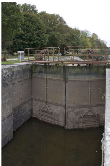
Le sas de l'écluse et la porte aval vus depuis le nord, pendant les écourues de 2009.