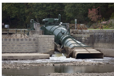
La micro-centrale hydroélectrique vue de trois-quarts depuis l'aval, pendant les écourues de 2009. IVR52_20095300454NUCA