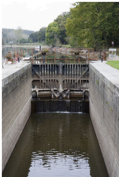
Le sas de l'écluse et la porte amont vus depuis le sud, pendant les écourues de 2009.