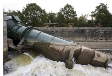
La micro-centrale hydroélectrique vue de côté, pendant les écourues de 2009.