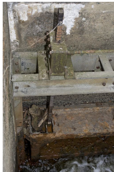
Détail de la vanne et des crémaillères d'une des portes de l'écluse pendant les écourues de 2009.