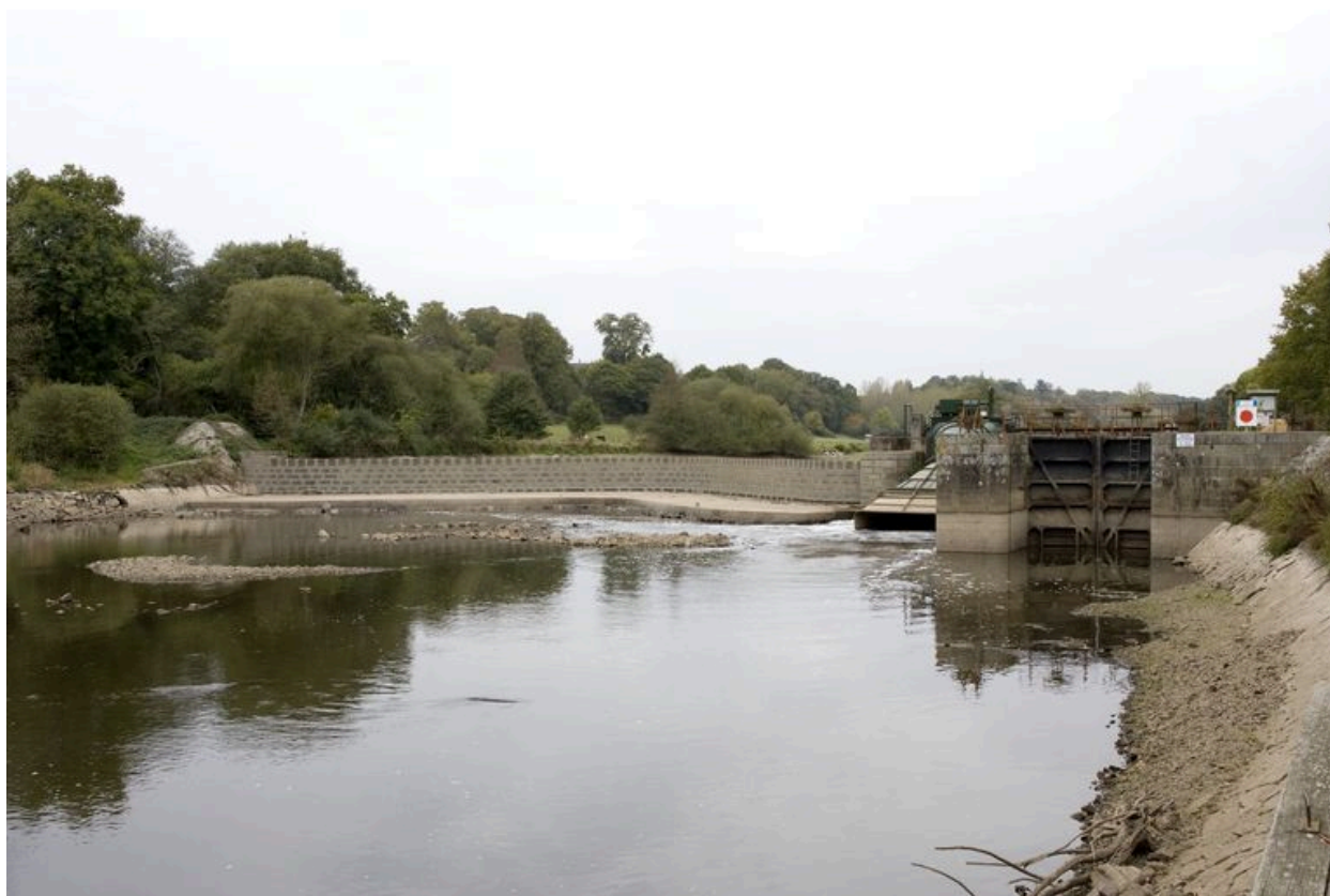
Vue d'ensemble du site d'écluse depuis la rive gauche en aval pendant les écourues de 2009 : barrage, centrale hydroélectrique, écluse.