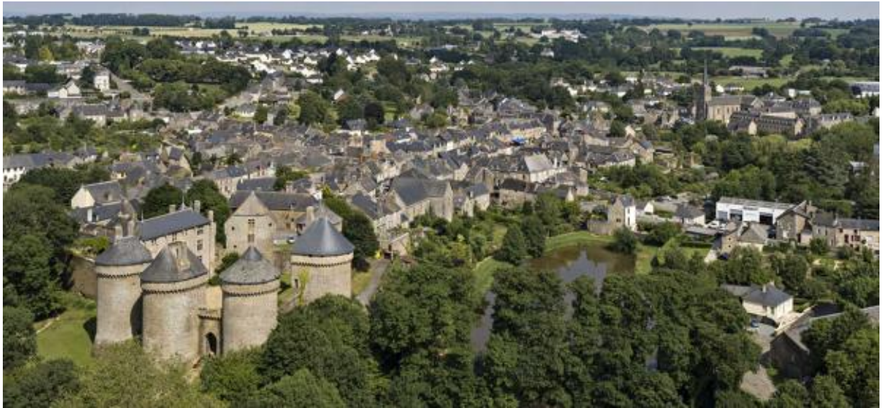
Le château et la ville de Lassay.