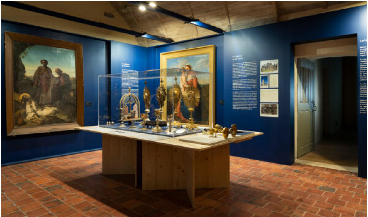
Exposition "De châteaux en pressoirs. Le patrimoine révélé du pays de Lassay", (24/06/22-31/03/23 ; CIAP de Sainte-Suzanne).