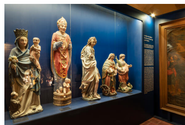
Exposition "De châteaux en pressoirs. Le patrimoine révélé du pays de Lassay", (24/06/22-31/03/23 ; CIAP de Sainte-Suzanne). IVR52_20235300154NUCA