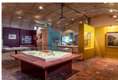
Exposition "De châteaux en pressoirs. Le patrimoine révélé du pays de Lassay", (24/06/22-31/03/23 ; CIAP de Sainte-Suzanne).