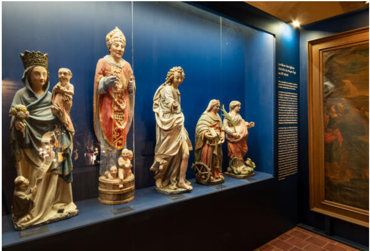
Exposition "De châteaux en pressoirs. Le patrimoine révélé du pays de Lassay", (24/06/22-31/03/23 ; CIAP de Sainte-Suzanne).