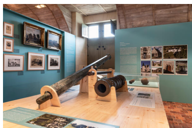
Exposition "De châteaux en pressoirs. Le patrimoine révélé du pays de Lassay", (24/06/22-31/03/23 ; CIAP de Sainte-Suzanne).