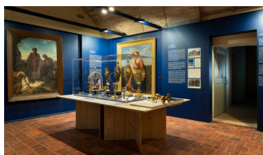
Exposition "De châteaux en pressoirs. Le patrimoine révélé du pays de Lassay", (24/06/22-31/03/23 ; CIAP de Sainte-Suzanne). IVR52_20235300156NUCA