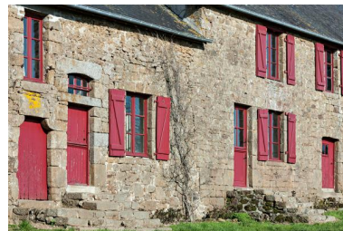
Maisons contiguës du hameau de Remieu.