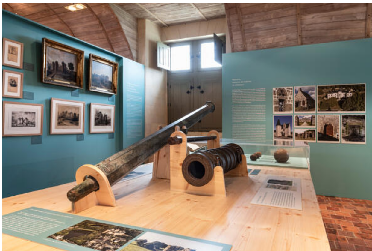
Exposition "De châteaux en pressoirs. Le patrimoine révélé du pays de Lassay", (24/06/22-31/03/23 ; CIAP de Sainte-Suzanne).