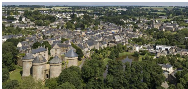
Le château et la ville de Lassay.