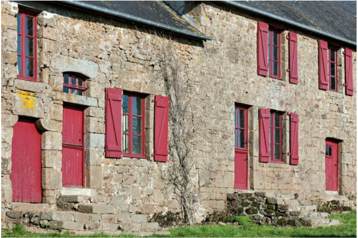
Maisons contiguës du hameau de Remieu.