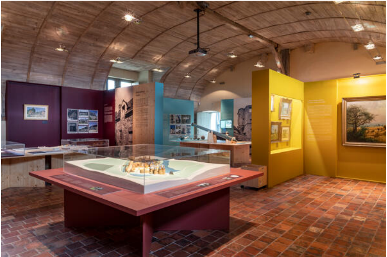
Exposition "De châteaux en pressoirs. Le patrimoine révélé du pays de Lassay", (24/06/22-31/03/23 ; CIAP de Sainte-Suzanne).