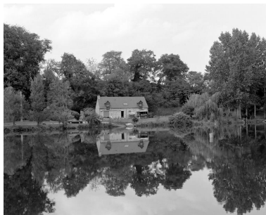
Maison du Port, anciens logis et dépendances du moulin d'Hambert.

Autr. Binse IVR52_20025300266X