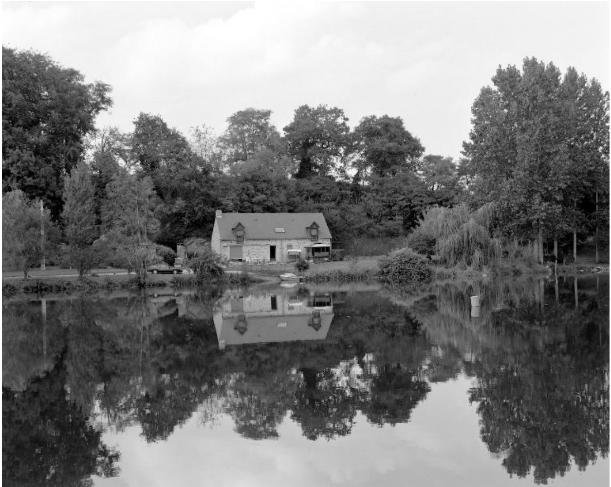
Maison du Port, anciens logis et dépendances du moulin d'Hambert.