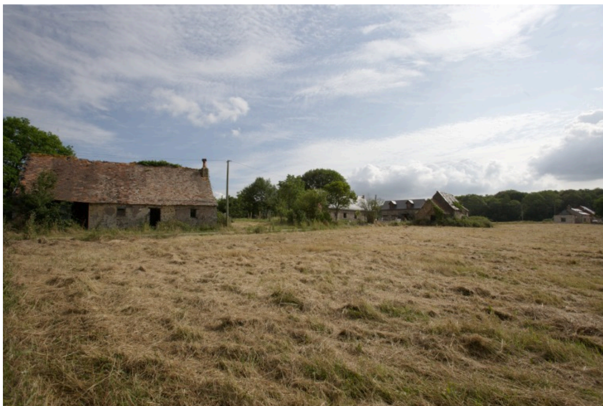
Vue d'ensemble des écarts de Chanteloup et des Maisons-Neuves.