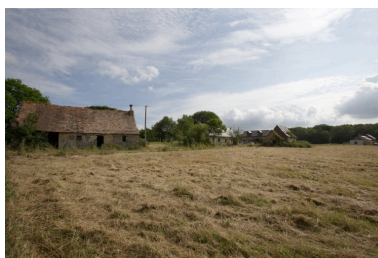
Vue d'ensemble des écarts de Chanteloup et des Maisons-Neuves.