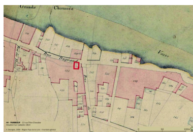
Situation sur cadastre 1810. IVR52_20094400565NUDA