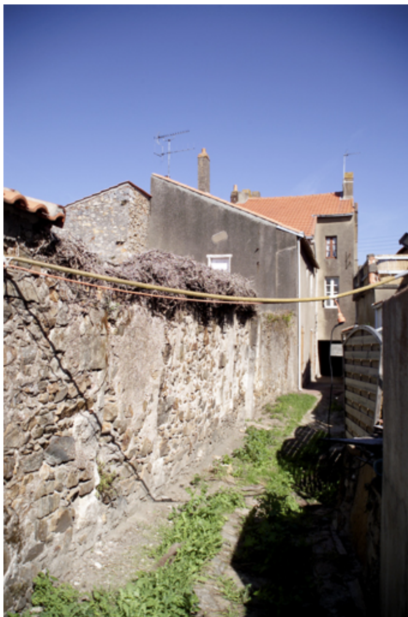
La façade postérieure, vue prise de la ruelle.