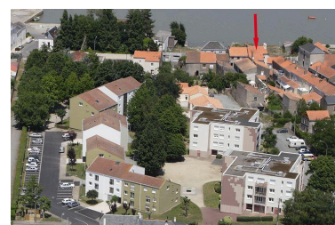
Situation sur la vue aérienne, 2010.