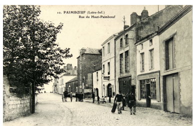
La rue Pitre-Chevalier au début du XXe siècle, depuis la maison n° 17 vers l'amont.