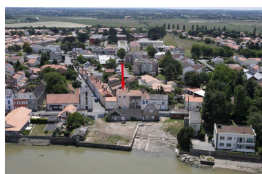
Situation sur la vue aérienne, 2010. IVR52_20104402795NUDA