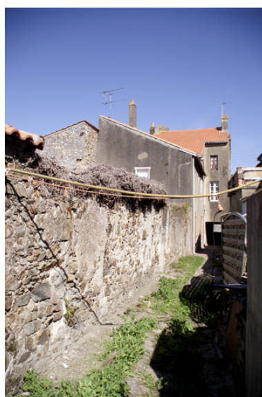
La façade postérieure, vue prise de la ruelle.