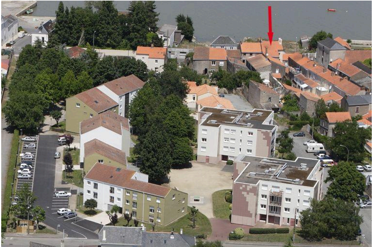
Situation sur la vue aérienne, 2010.