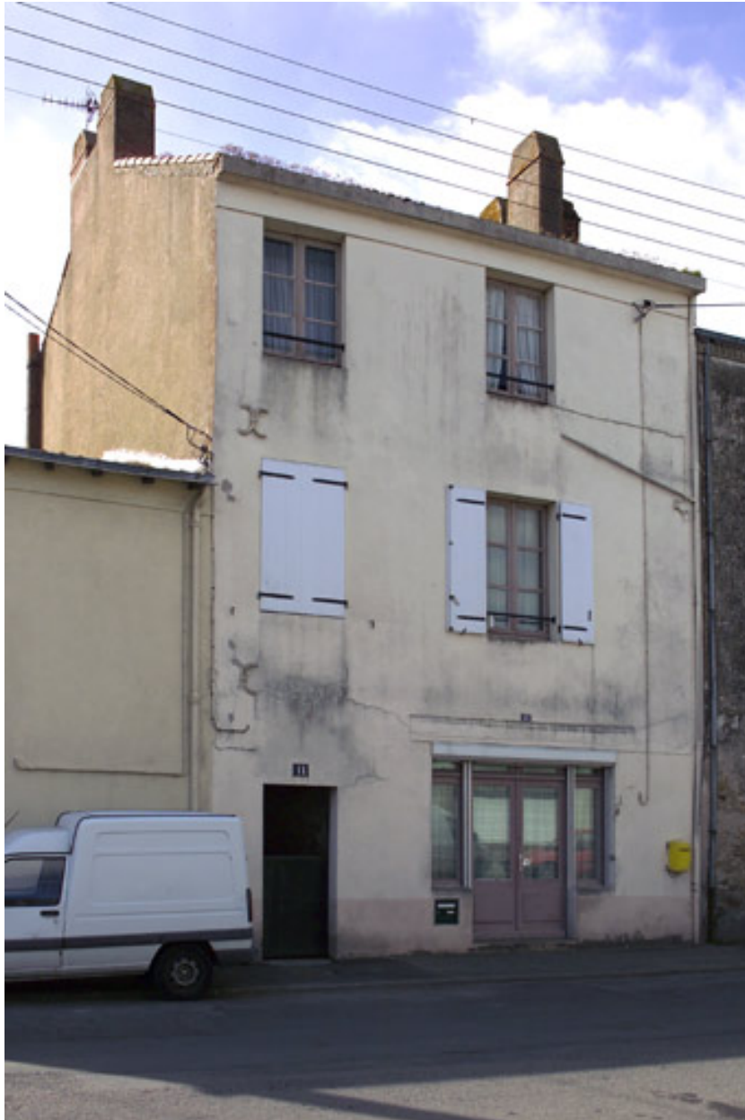
Vue de la façade antérieure depuis la rue Pitre-Chevalier.