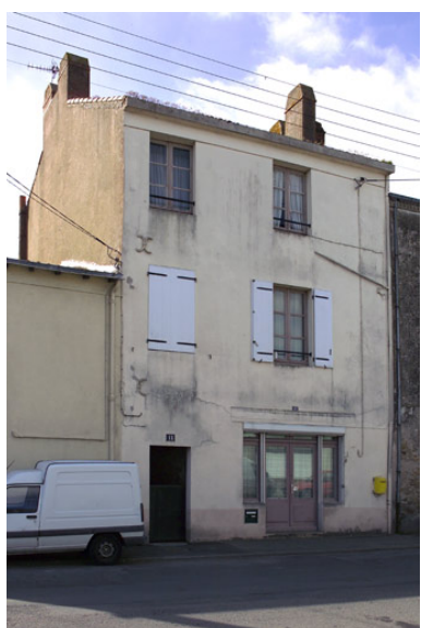
Vue de la façade antérieure depuis la rue Pitre-Chevalier.