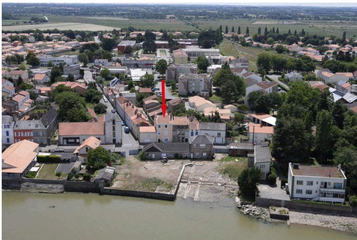
Situation sur la vue aérienne, 2010.