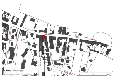
Situation sur données cadastrales 2008. IVR52_20094400566NUDA