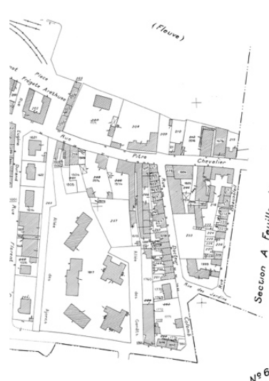
Plan cadastral, 1999, extrait. IVR52_20034400108NUCA