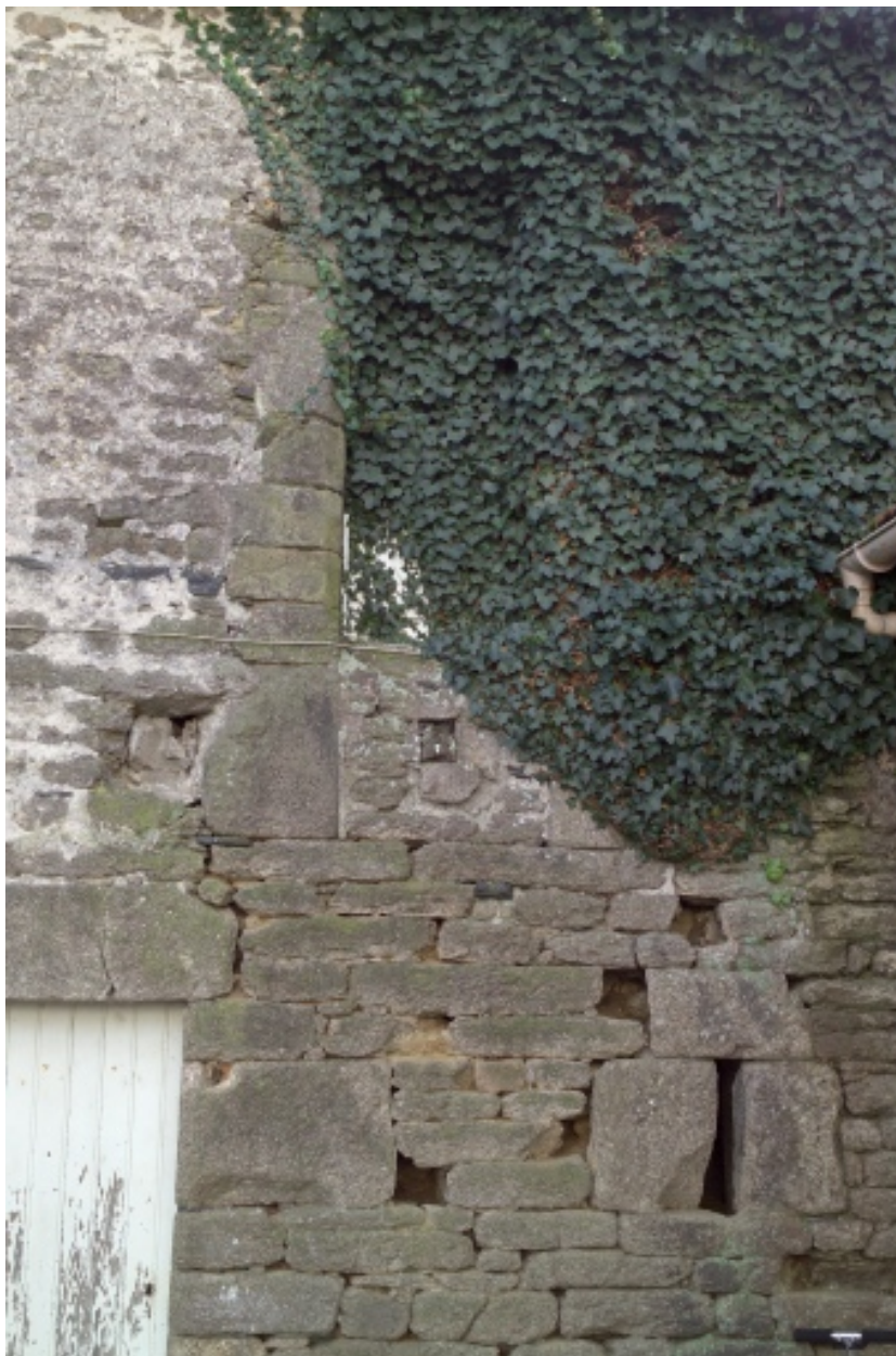
Tour quadrangulaire. Détail de la reprise de maçonnerie.