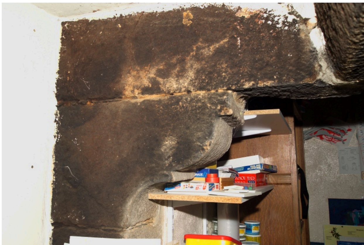
Bâtiment ouest. Cheminée nord. Détail de la console de droite.