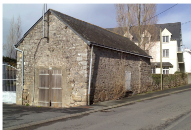
Bâtiment est. Vue depuis le sud. IVR52_20074400316NUCA