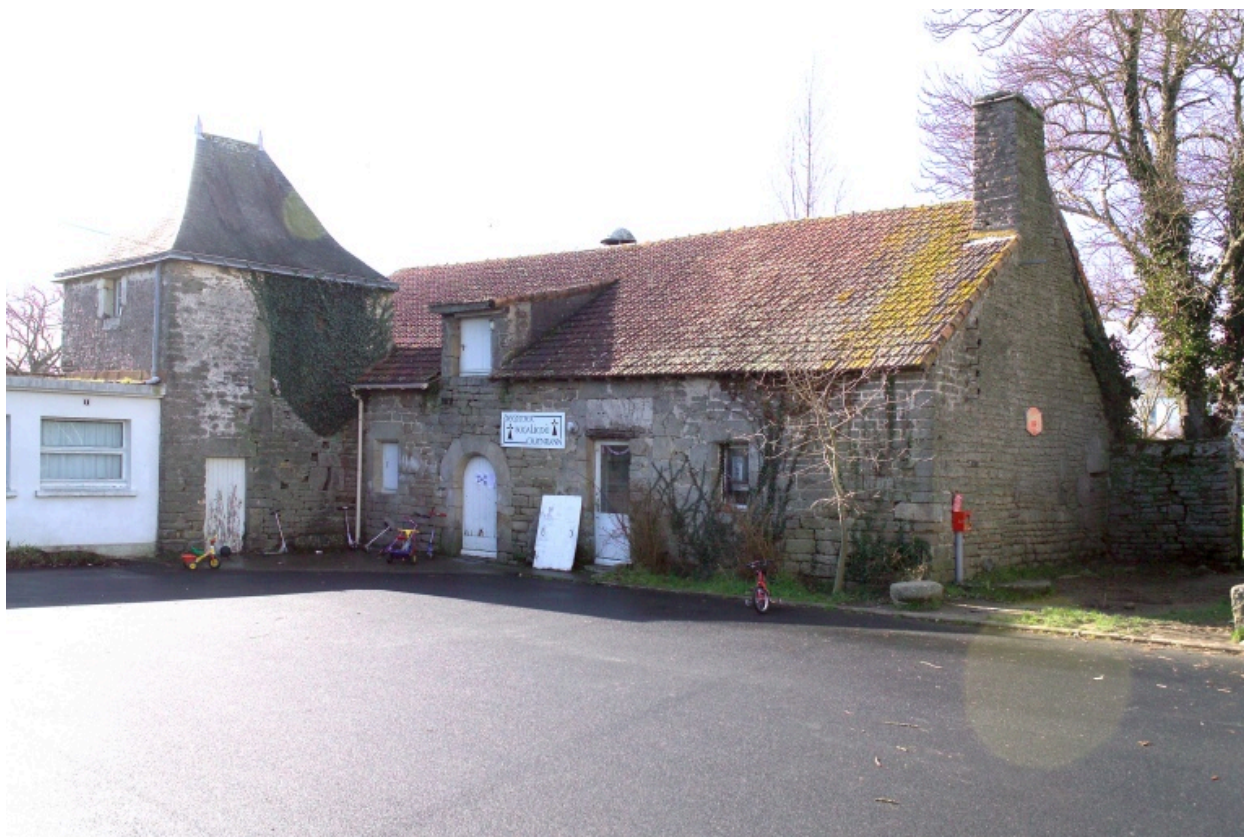
Bâtiment ouest et tour quadrangulaire. Vue depuis l'est.