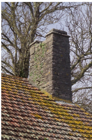
Bâtiment ouest. Vue de la souche de cheminée. IVR52_20074400322NUCA