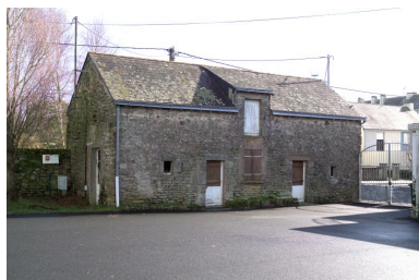
Bâtiment est. Vue de la façade ouest. IVR52_20074400310NUCA