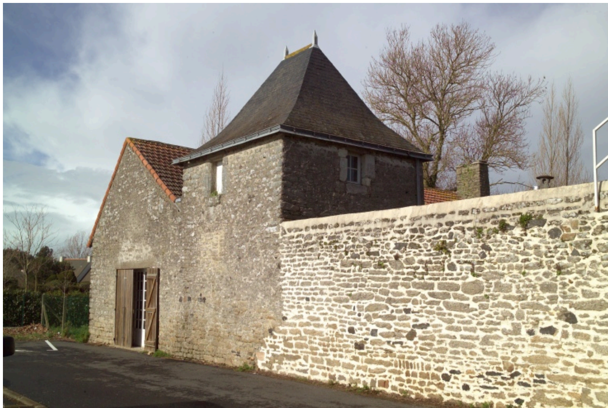
Bâtiment ouest. Vue depuis le sud.