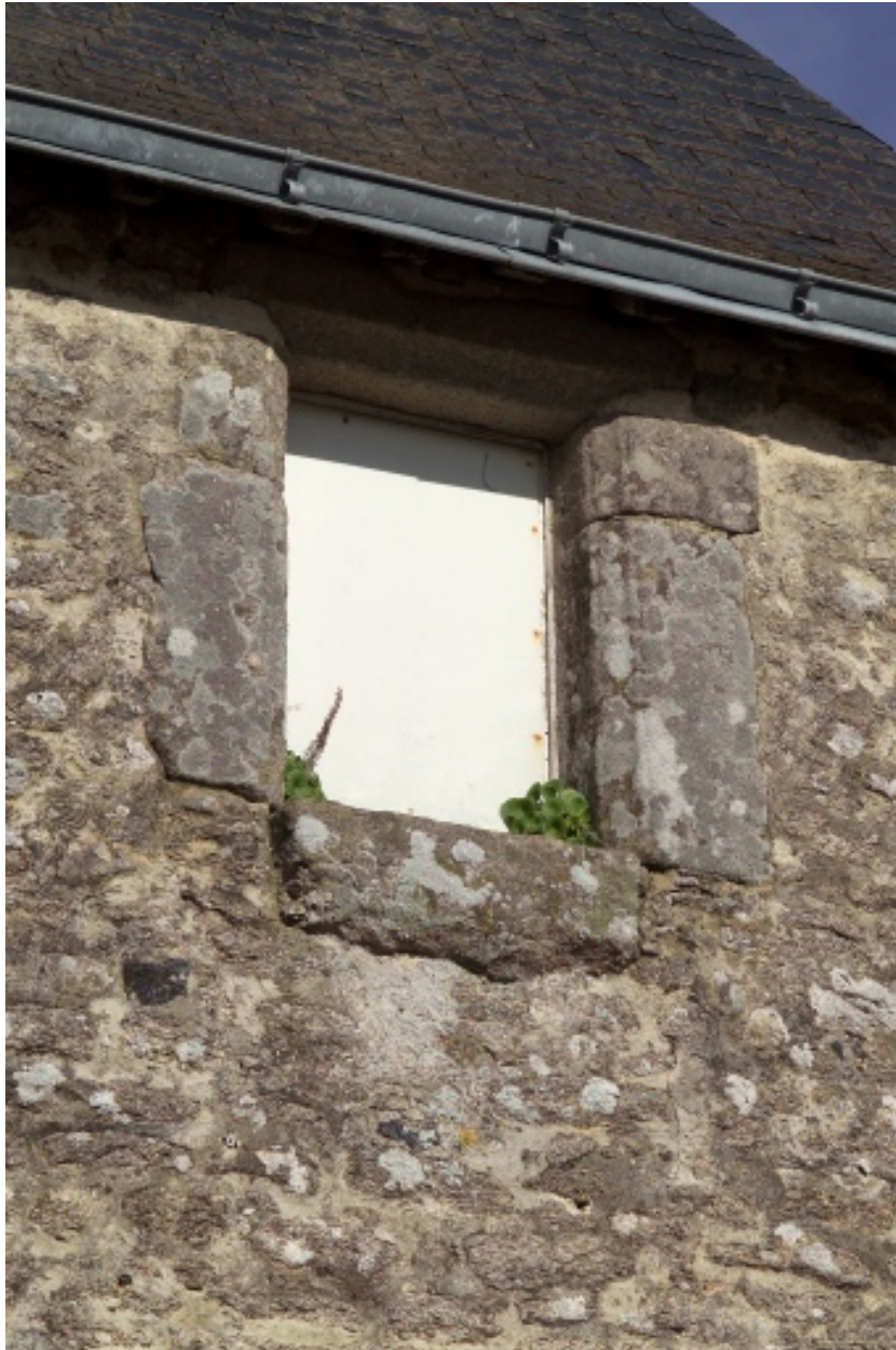
Tour quadrangulaire. Détail de la fenêtre sud.