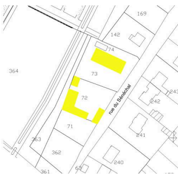
Extrait du cadastre de 2000, section AB, parcelles n° 72, 73. IVR52_20074405005NUCA