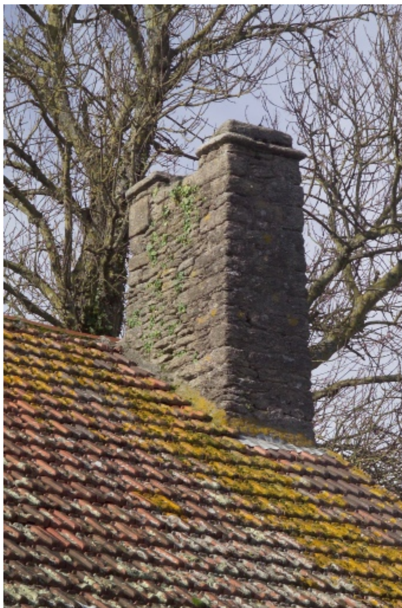
Bâtiment ouest. Vue de la souche de cheminée.