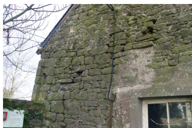
Bâtiment est. Détail de la reprise de construction sur le pignon du bâtiment nord. IVR52_20074400313NUCA