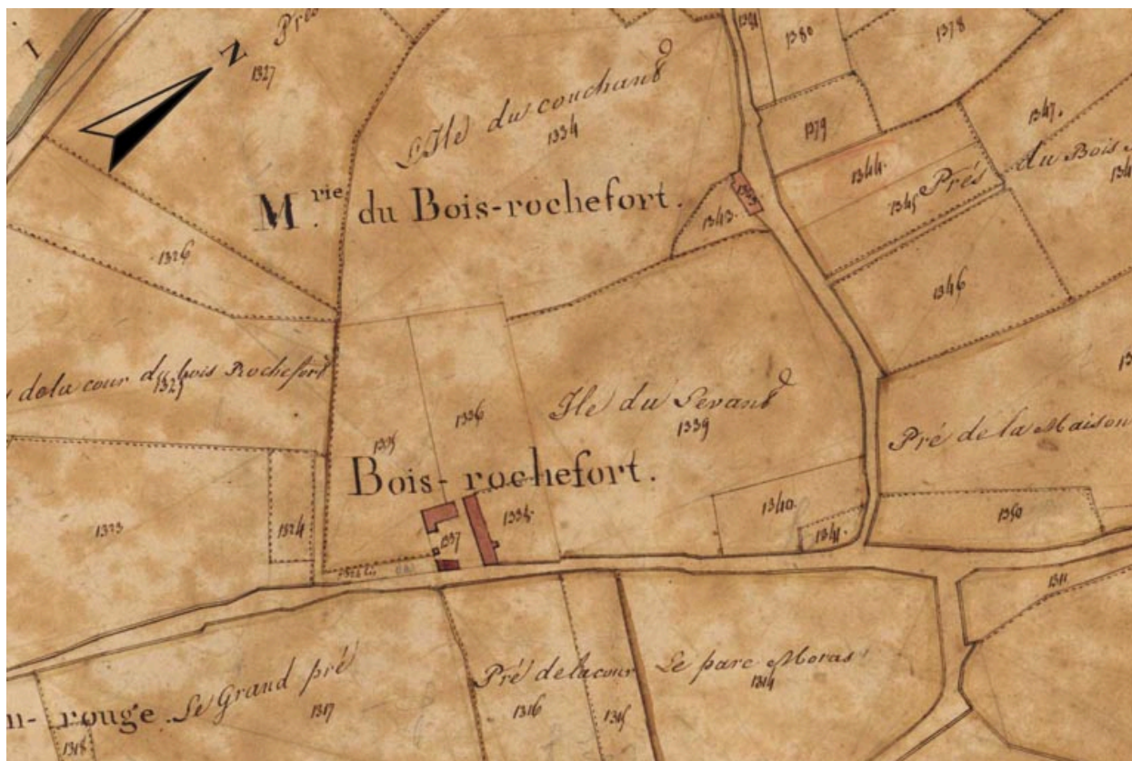
Extrait du plan cadastral de 1819, section B3, parcelle n° 1337.