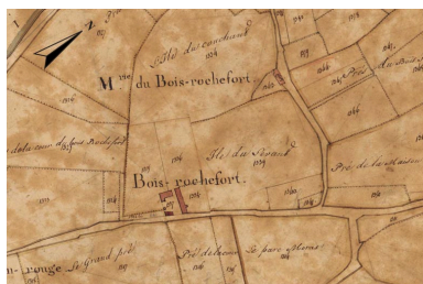
Extrait du plan cadastral de 1819, section B3, parcelle n° 1337. IVR52_20074405004NUCA