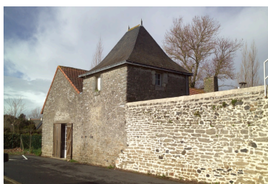
Bâtiment ouest. Vue depuis le sud. IVR52_20074400315NUCA