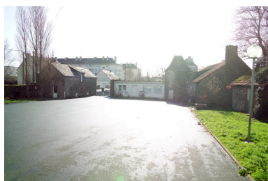
Vue d'ensemble depuis le nord. IVR52_20074400312NUCA