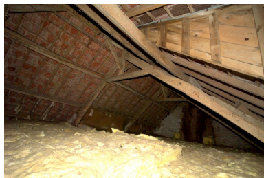
Bâtiment ouest. Vue de la charpente. IVR52_20074400325NUCA