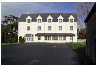
Vue du bâtiment nord. IVR52_20074400314NUCA