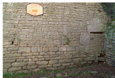
Bâtiment ouest. Détail du pignon nord.