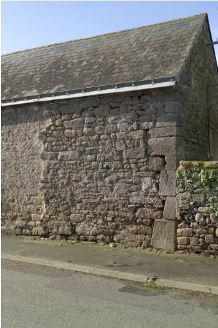
Bâtiment est. Détail du piédroit de l'ancien portail d'entrée.