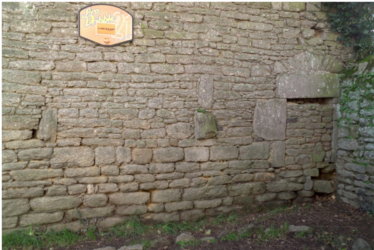
Bâtiment ouest. Détail du pignon nord.