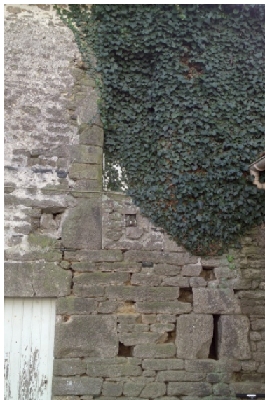
Tour quadrangulaire. Détail de la reprise de maçonnerie.