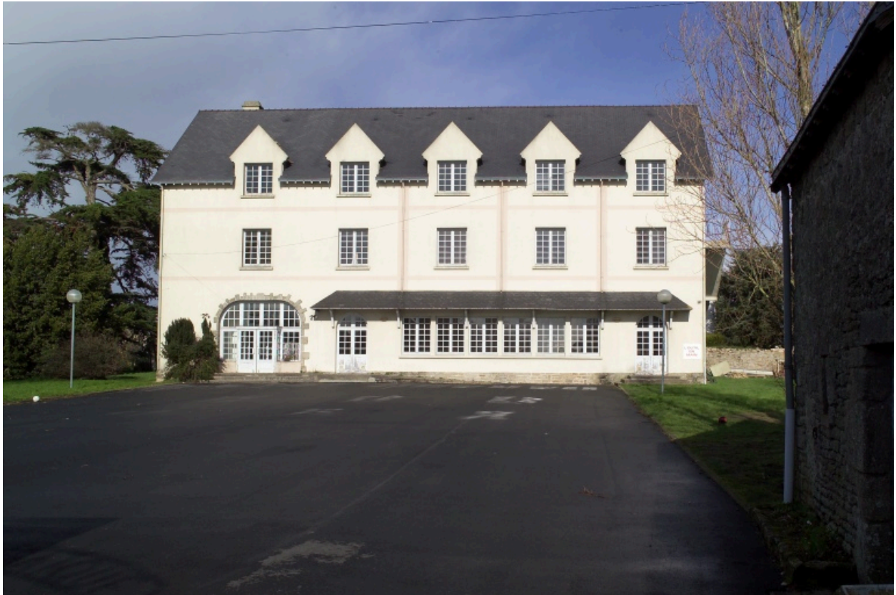
Vue du bâtiment nord.