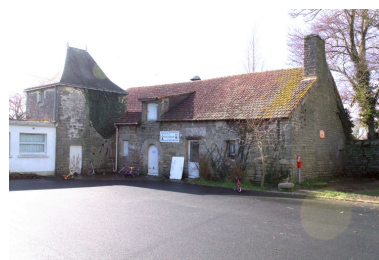
Bâtiment ouest et tour quadrangulaire. Vue depuis l'est.