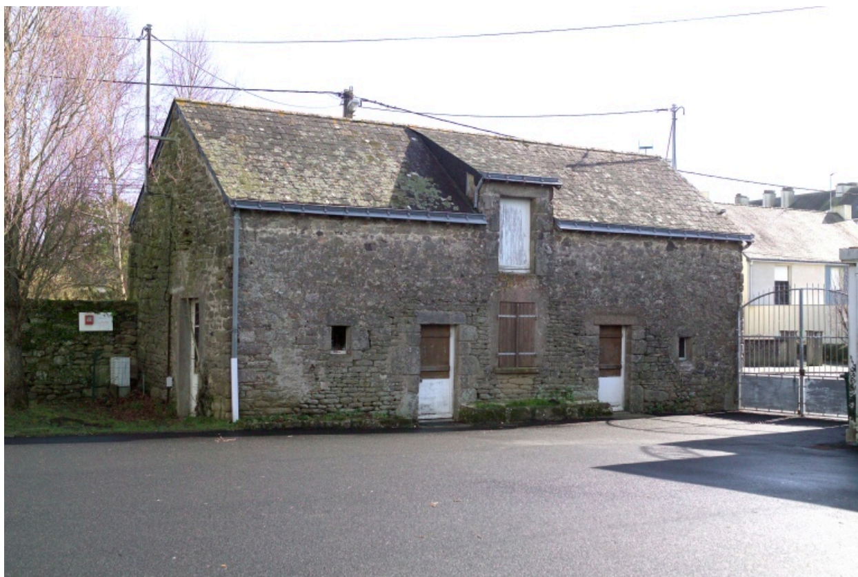
Bâtiment est. Vue de la façade ouest.