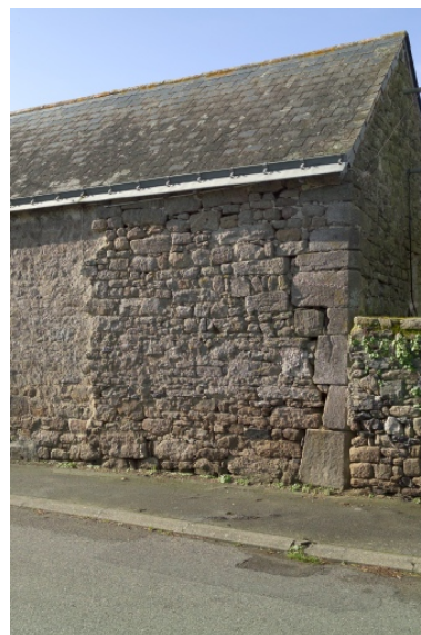
Bâtiment est. Détail du piédroit de l'ancien portail d'entrée.