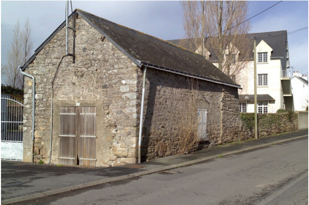
Bâtiment est. Vue depuis le sud.