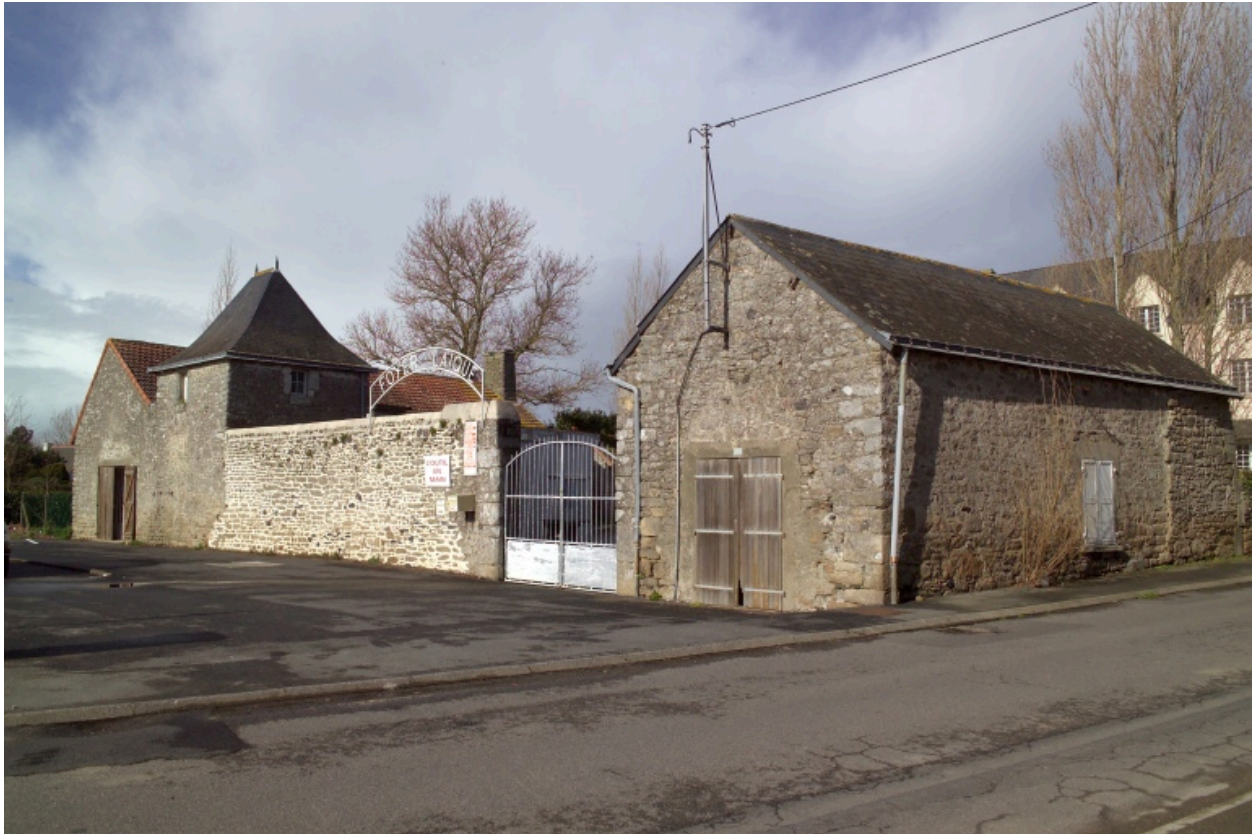
Vue d'ensemble depuis depuis le sud.