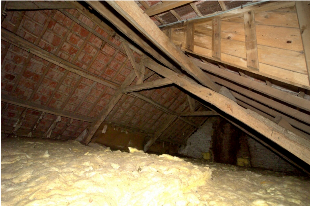
Bâtiment ouest. Vue de la charpente.