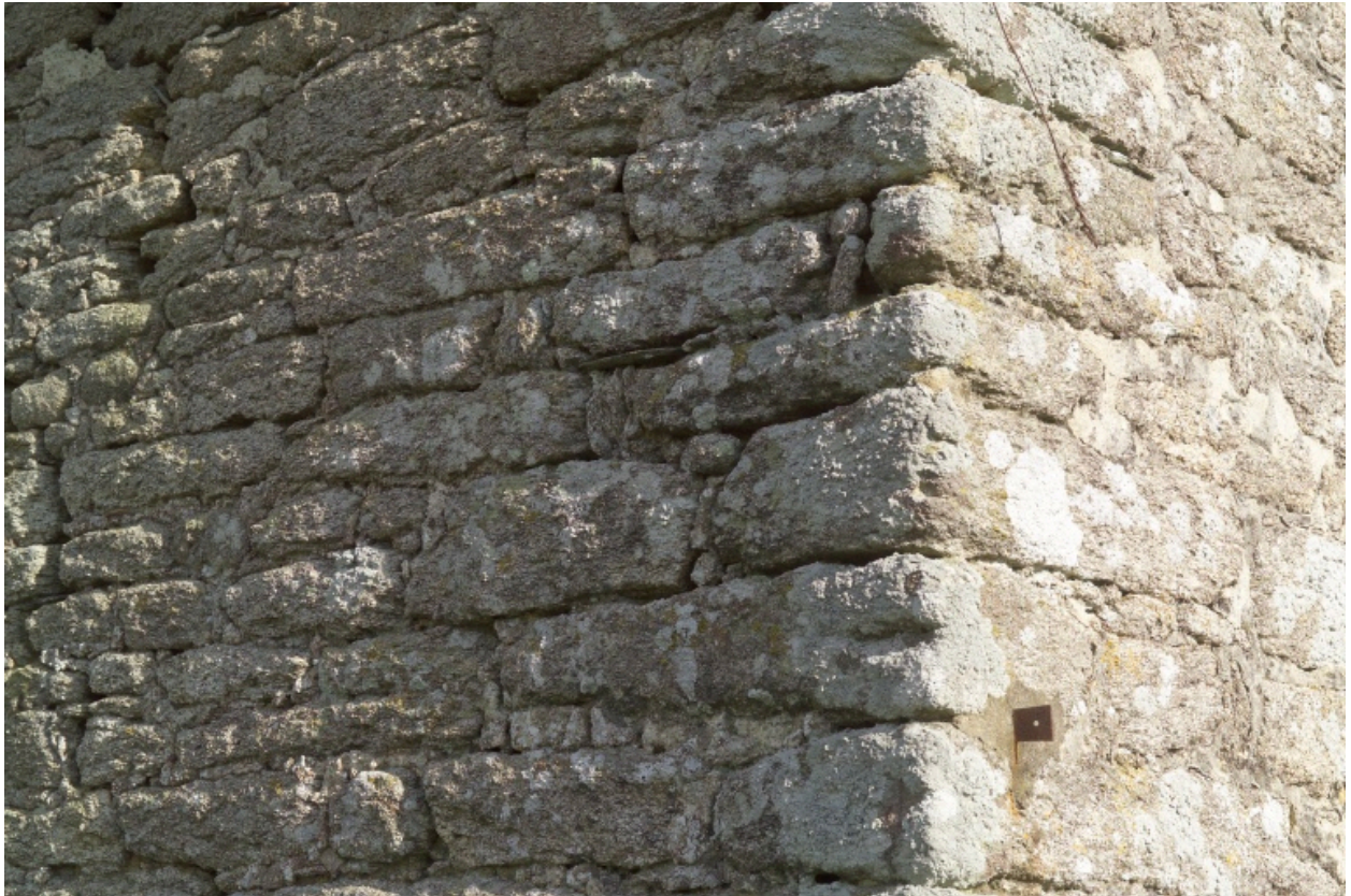
Bâtiment ouest. Détail du chaînage d'angle.