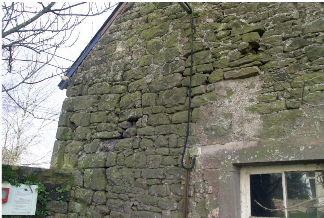
Bâtiment est. Détail de la reprise de construction sur le pignon du bâtiment nord.