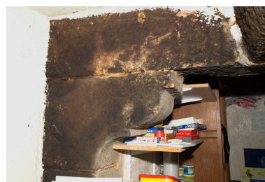
Bâtiment ouest. Cheminée nord. Détail de la console de droite.