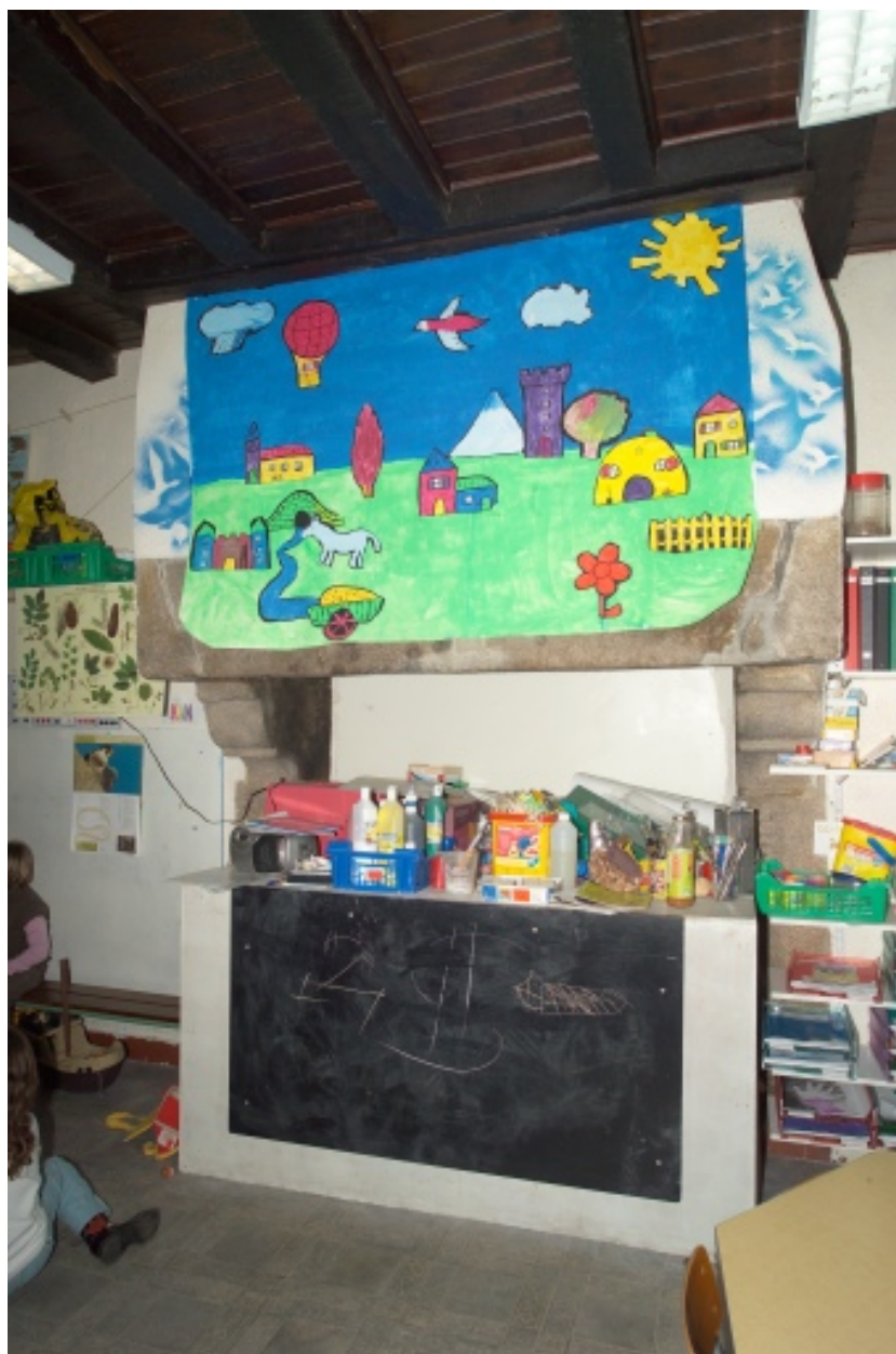
Bâtiment ouest. Vue de la cheminée sur le pignon nord.