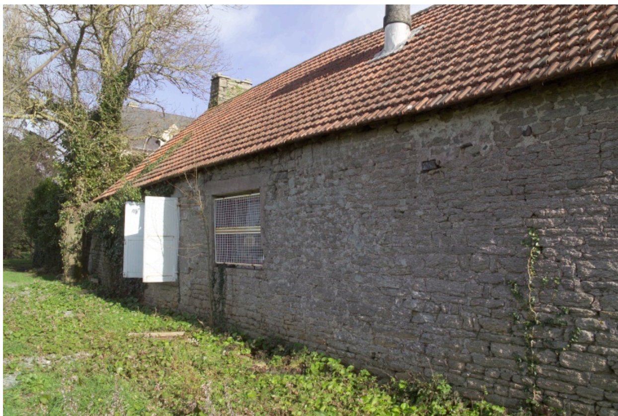
Bâtiment ouest. Vue du mur gouttereau ouest.