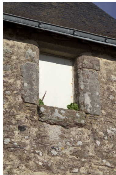
Tour quadrangulaire. Détail de la fenêtre sud.