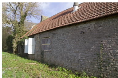
Bâtiment ouest. Vue du mur gouttereau ouest.