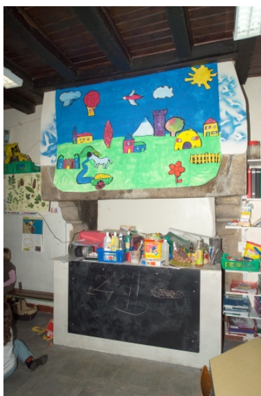
Bâtiment ouest. Vue de la cheminée sur le pignon nord. IVR52_20074400326NUCA