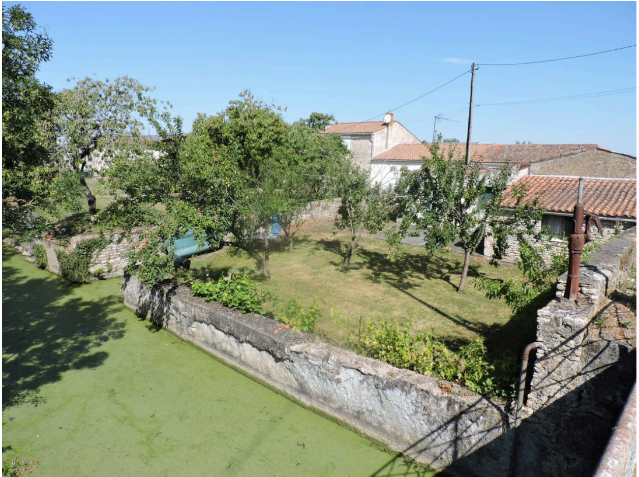
La pompe, à droite, au bord du Petit canal de la Société.