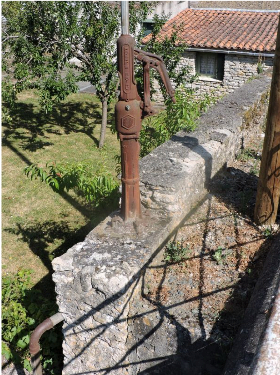
La pompe vue depuis le sud-est.