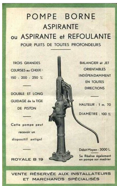
Pompe borne Briau, extrait du catalogue 1949 de la fabrique Briau et Compagnie de Tours. IVR52_20164000646NUCA