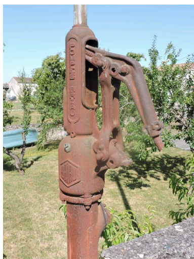
Détail.