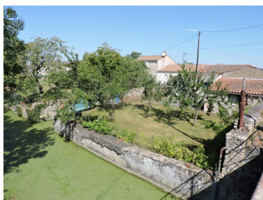
La pompe, à droite, au bord du Petit canal de la Société.