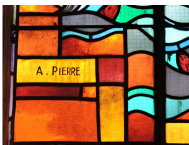
Verrière : signature en bas à gauche du vitrail.