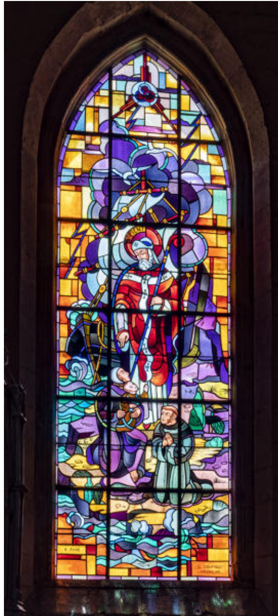
Verrière, vue d'ensemble.