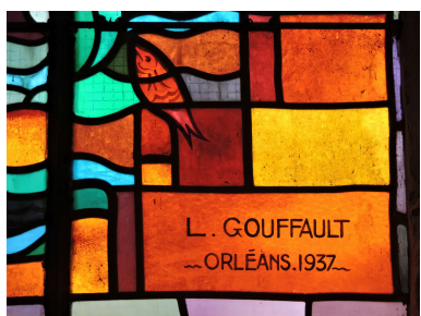
Verrière : signature, date et lieu d'exécution, en bas à droite du vitrail. IVR52_20218501862NUCA