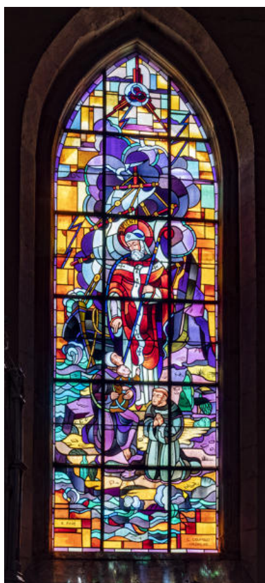
Verrière, vue d'ensemble.