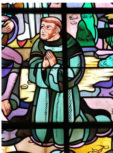
Verrière : le moine.