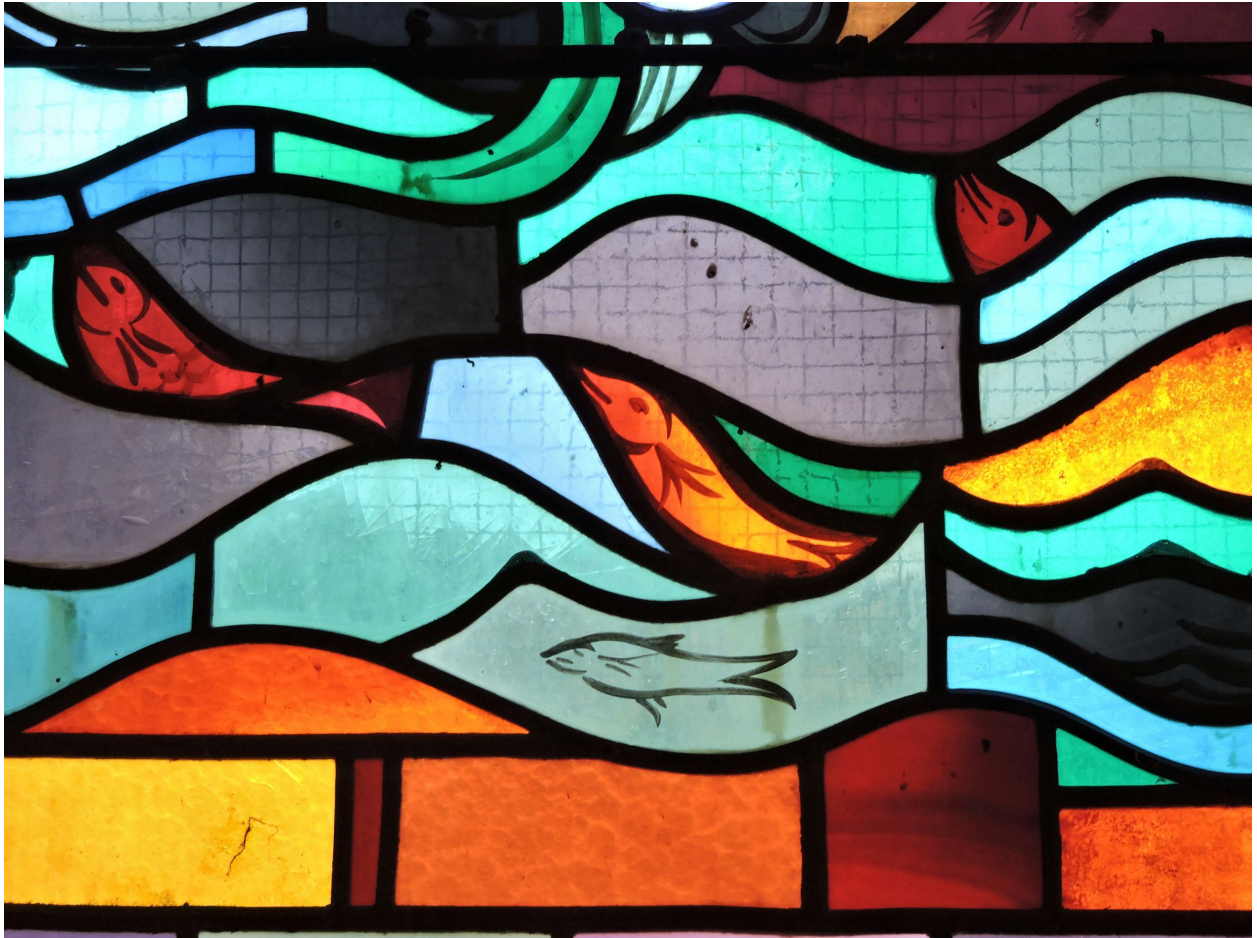
Verrière : poissons.