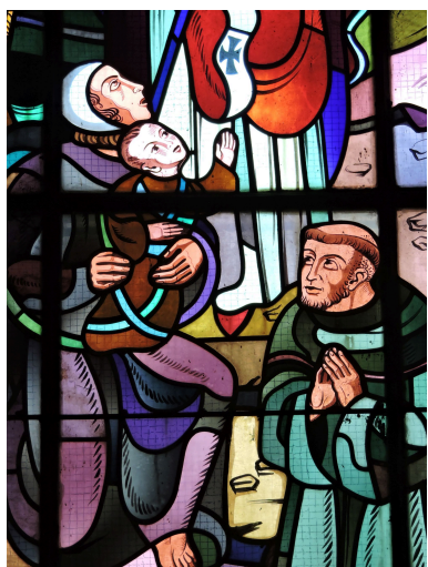
Verrière : la femme, l'enfant et le moine. IVR52_20218501858NUCA