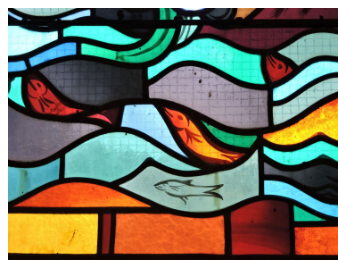
Verrière : poissons.