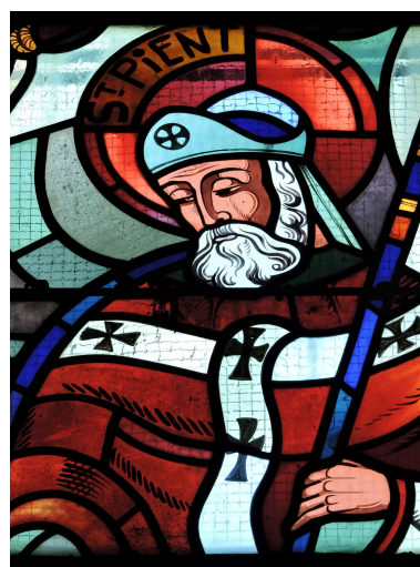
Verrière : Saint-Pient. IVR52_20218501864NUCA