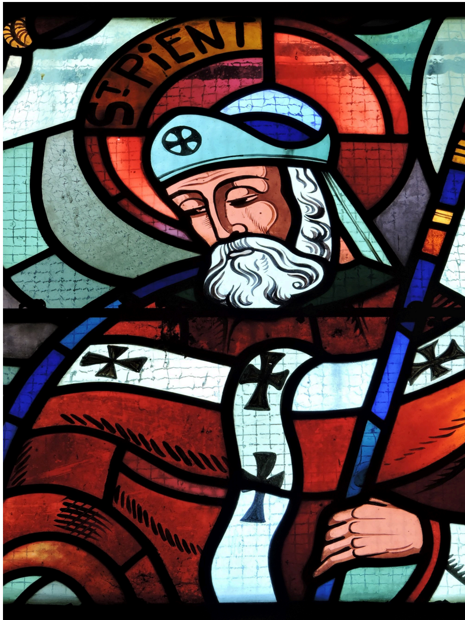
Verrière : Saint-Pient.