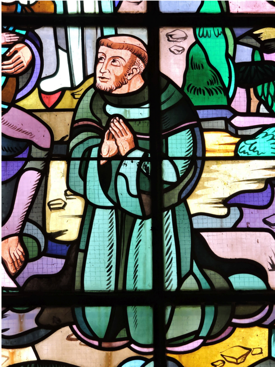
Verrière : le moine.