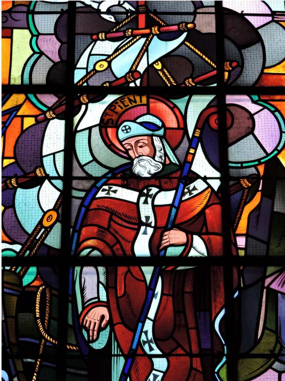
Verrière, détail : saint Pient.