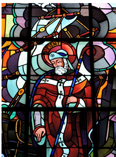
Verrière, détail : saint Pient.