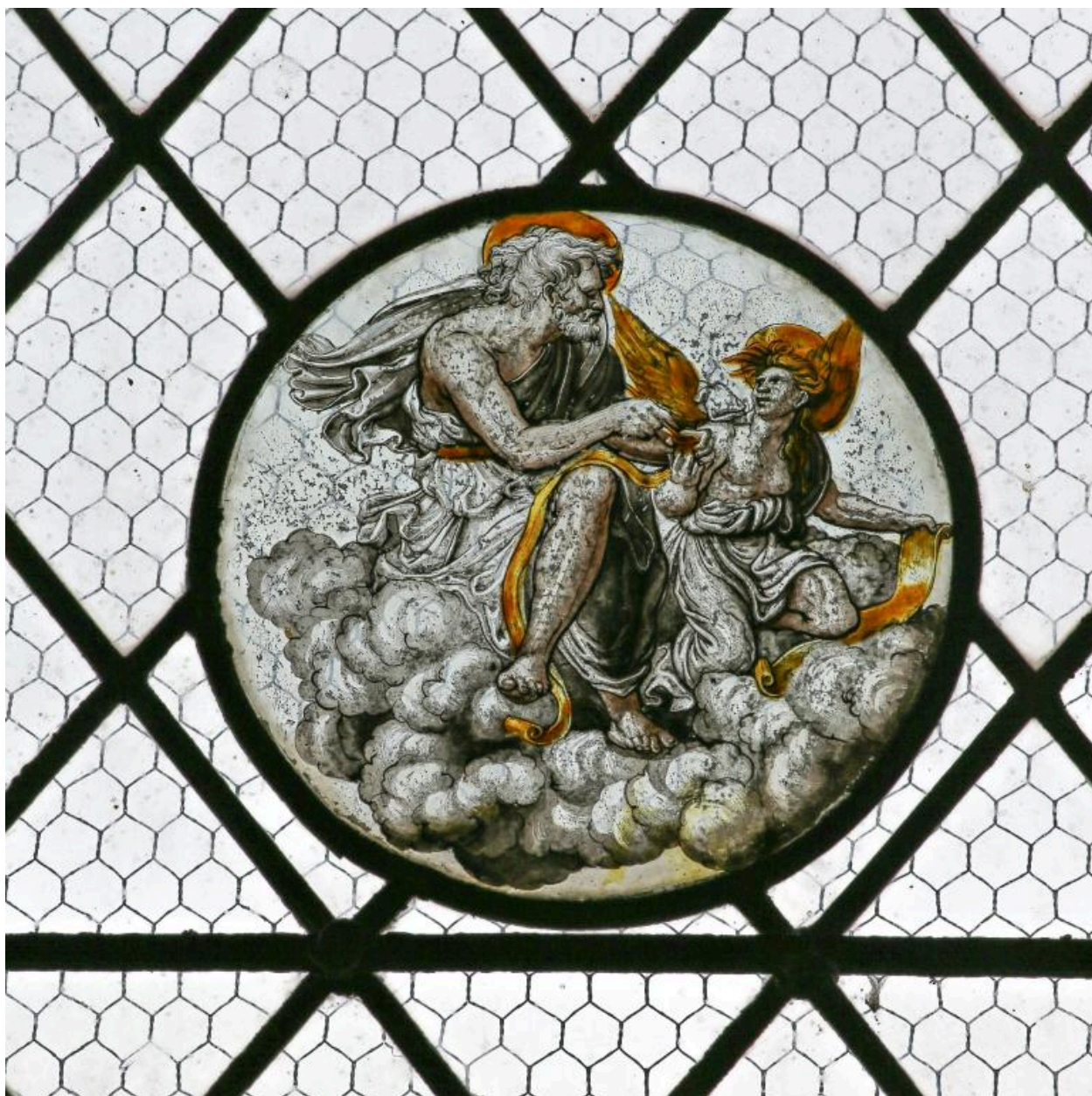
Verrière figurée (détail) : saint matthieu.