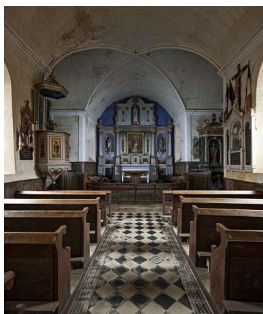
Nef et chœur. IVR52_20195300948NUCA