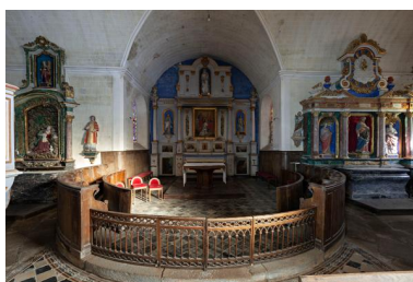
Chœur. IVR52_20195300908NUCA