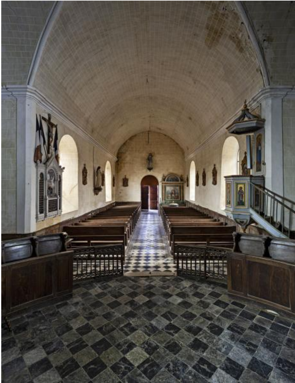
Vue de la nef, depuis le chœur.