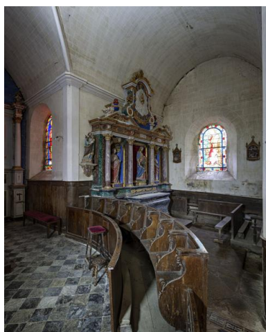
Bras sud du transept.