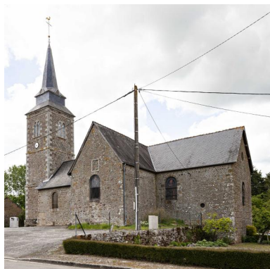
Flanc sud de l'église de Brétignolles-le-Moulin. IVR52_20215300643NUCA