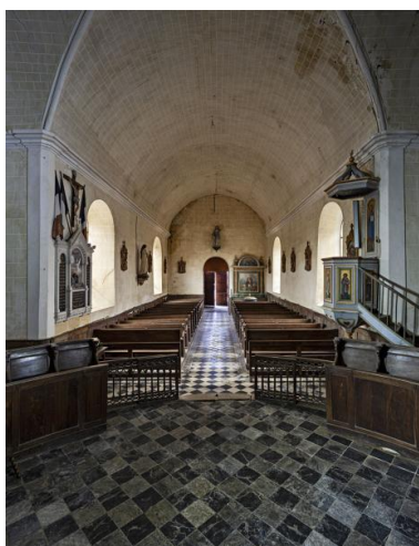
Vue de la nef, depuis le chœur.