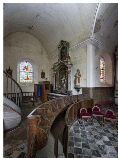
Bras nord du transept.