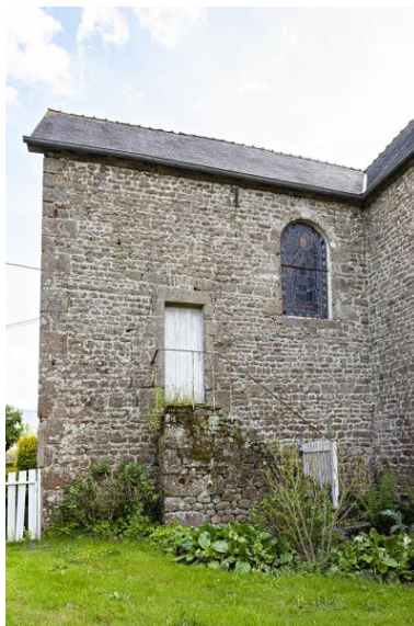
Bras gauche du transept, accès direct entre la sacristie et le jardin du presbytère.