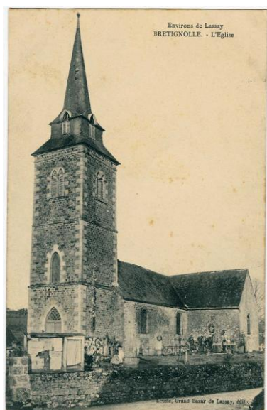
Carte postale de l'église de Brétignolles-le-Moulin.