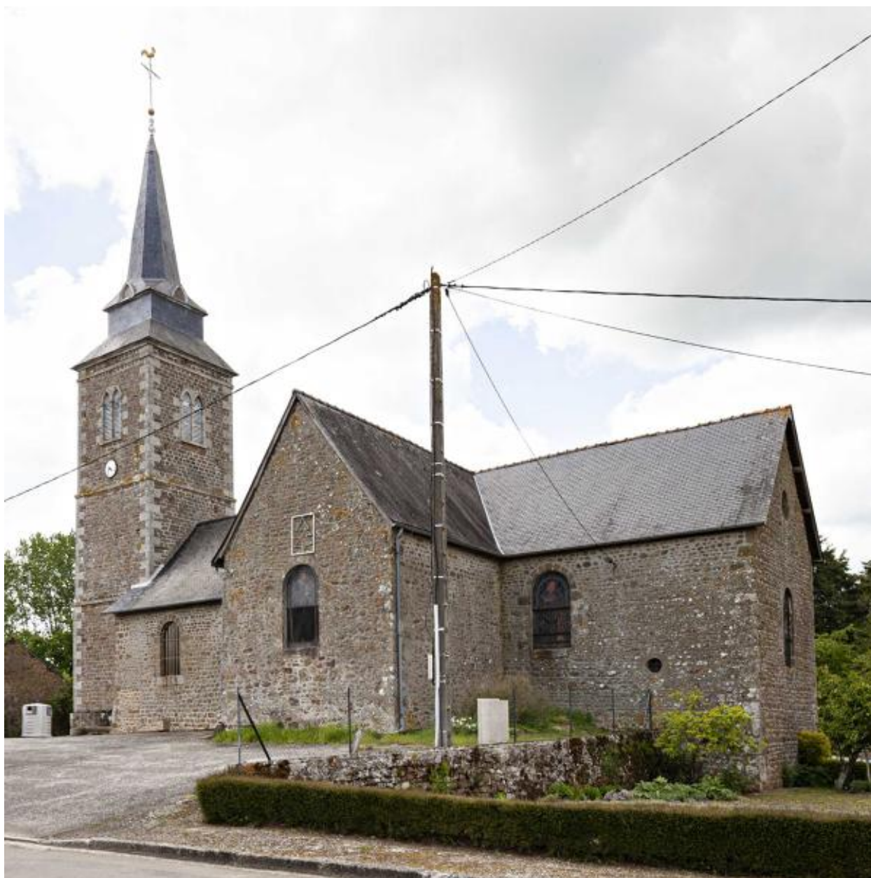
Flanc sud de l'église de Brétignolles-le-Moulin.