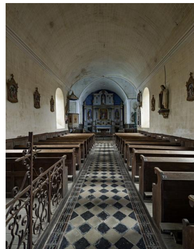
Nef et chœur. IVR52_20195300947NUCA