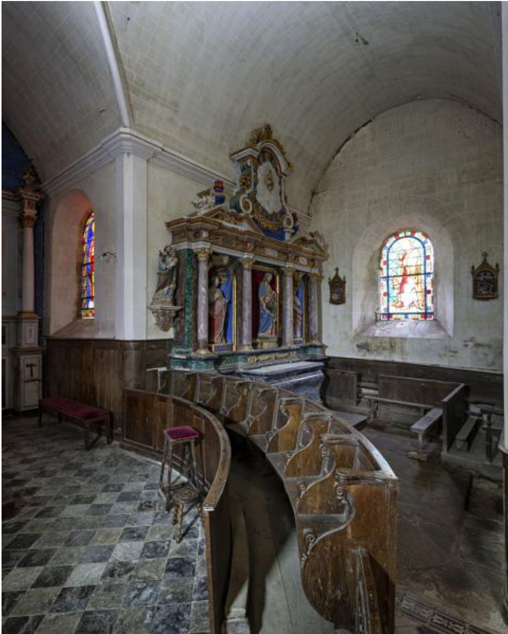
Bras sud du transept.