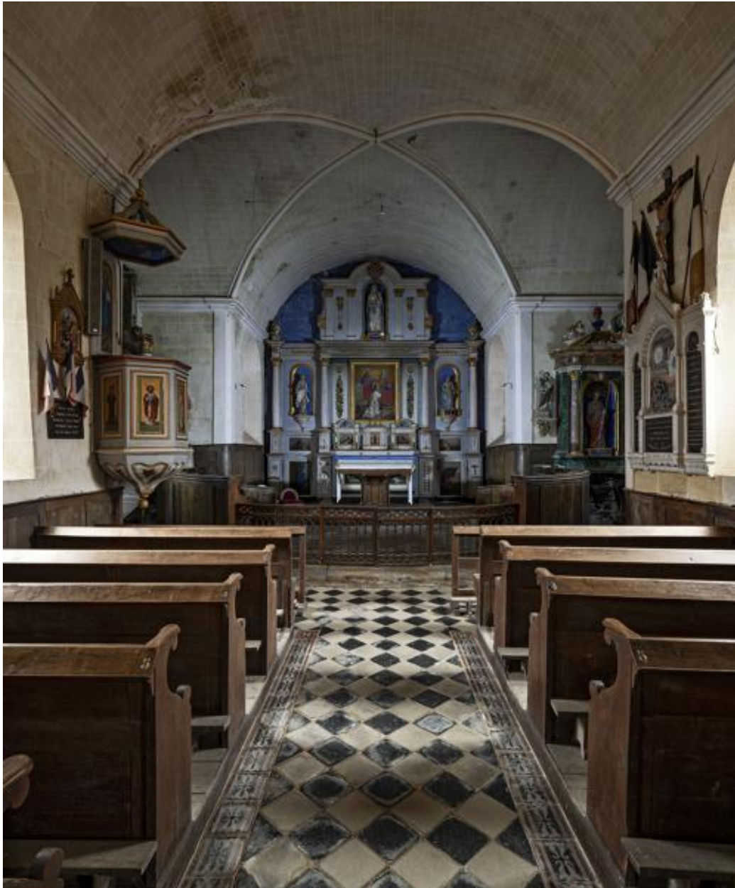
Nef et chœur.