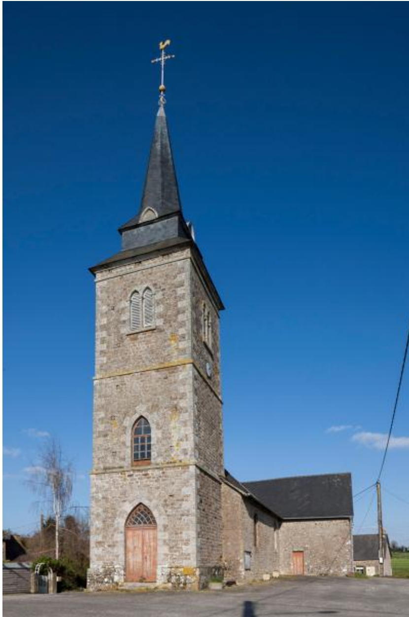
Façade occidentale de l'église de Brétignolles-le-Moulin.