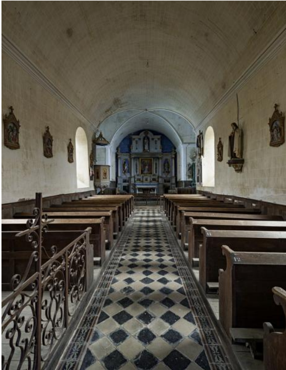
Nef et chœur.