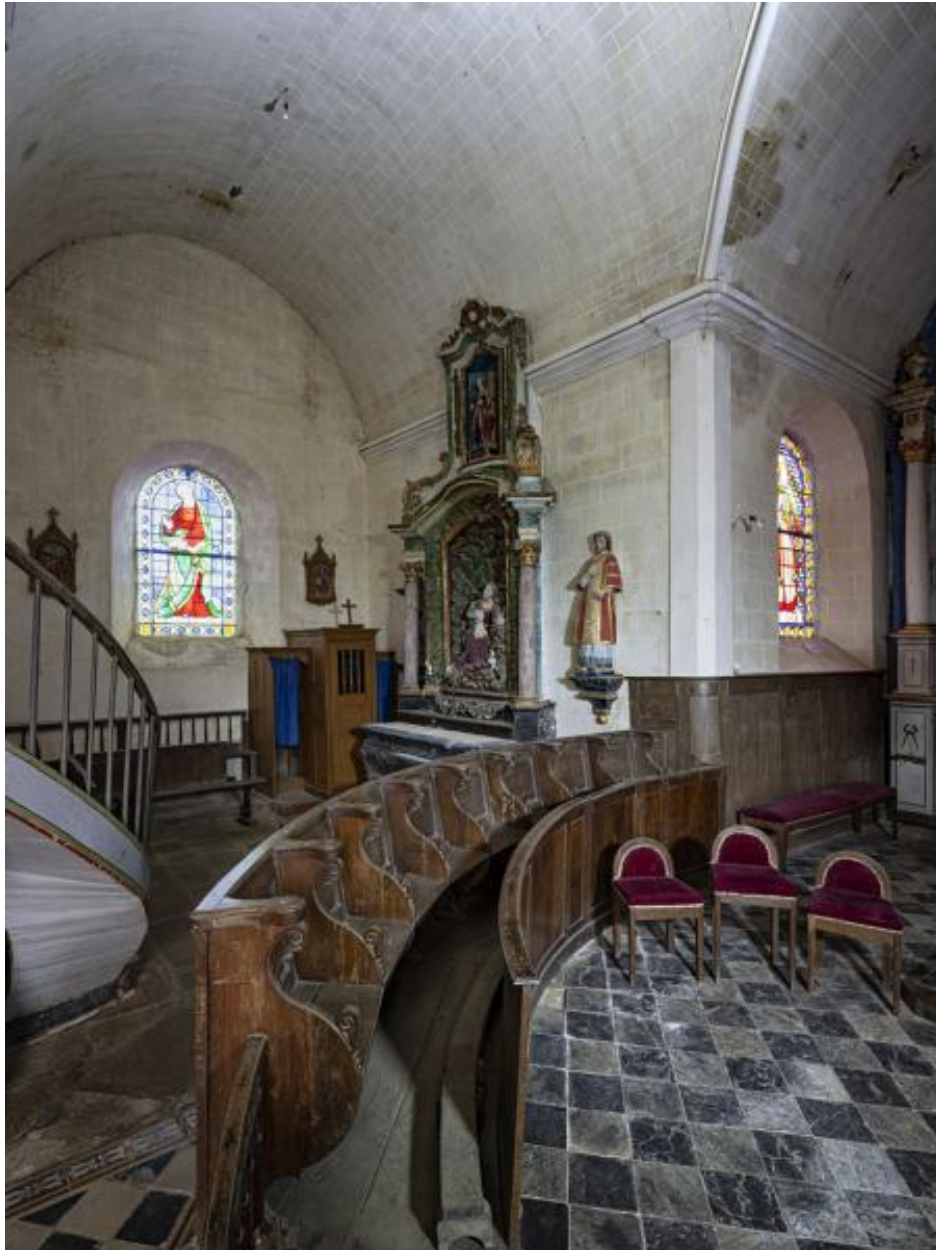
Bras nord du transept.