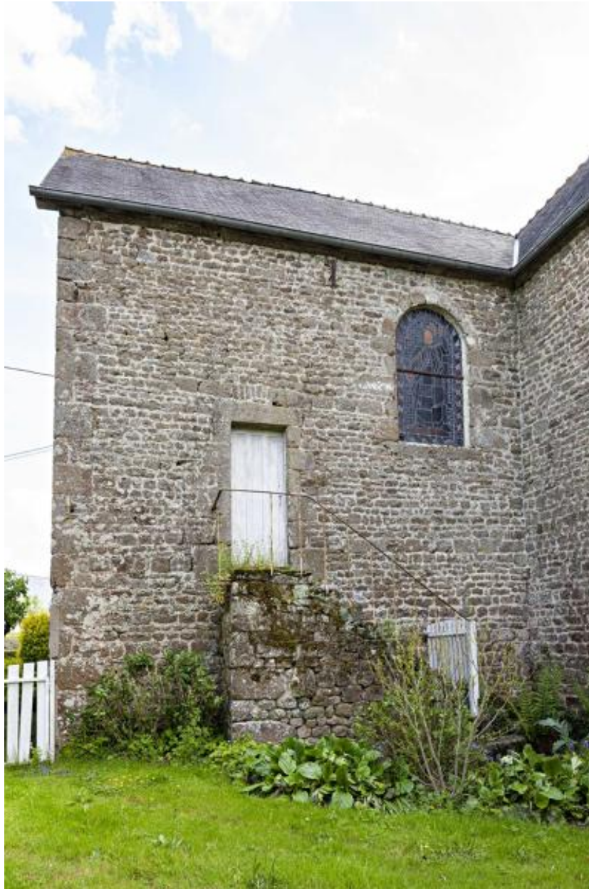
Bras gauche du transept, accès direct entre la sacristie et le jardin du presbytère.