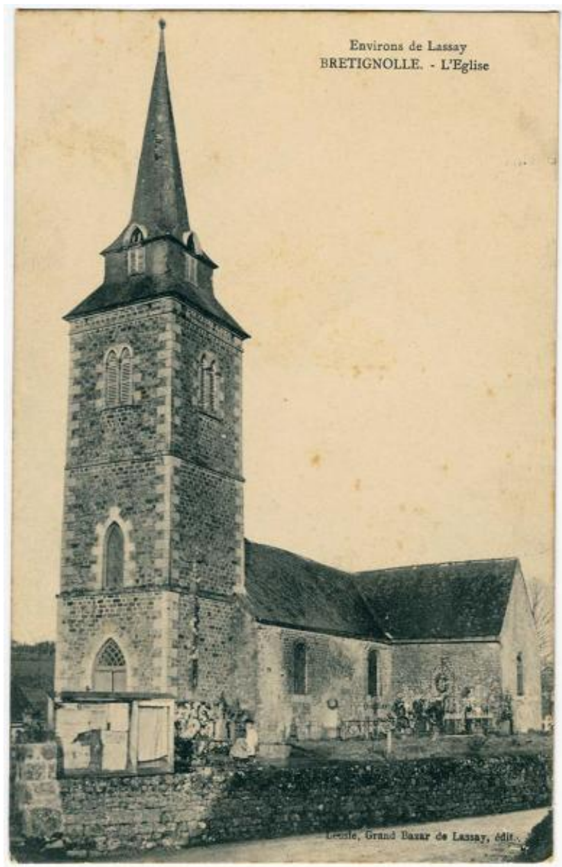
Carte postale de l'église de Brétignolles-le-Moulin.