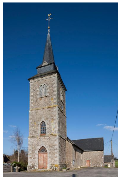
Façade occidentale de l'église de Brétignolles-le-Moulin.