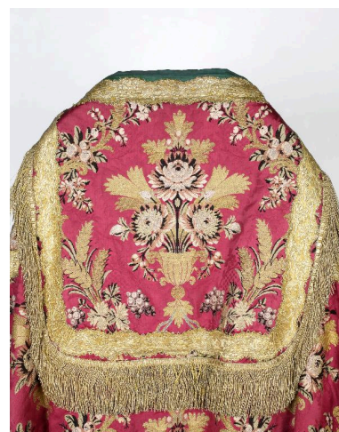
Détail du chaperon de l'une des chapes.