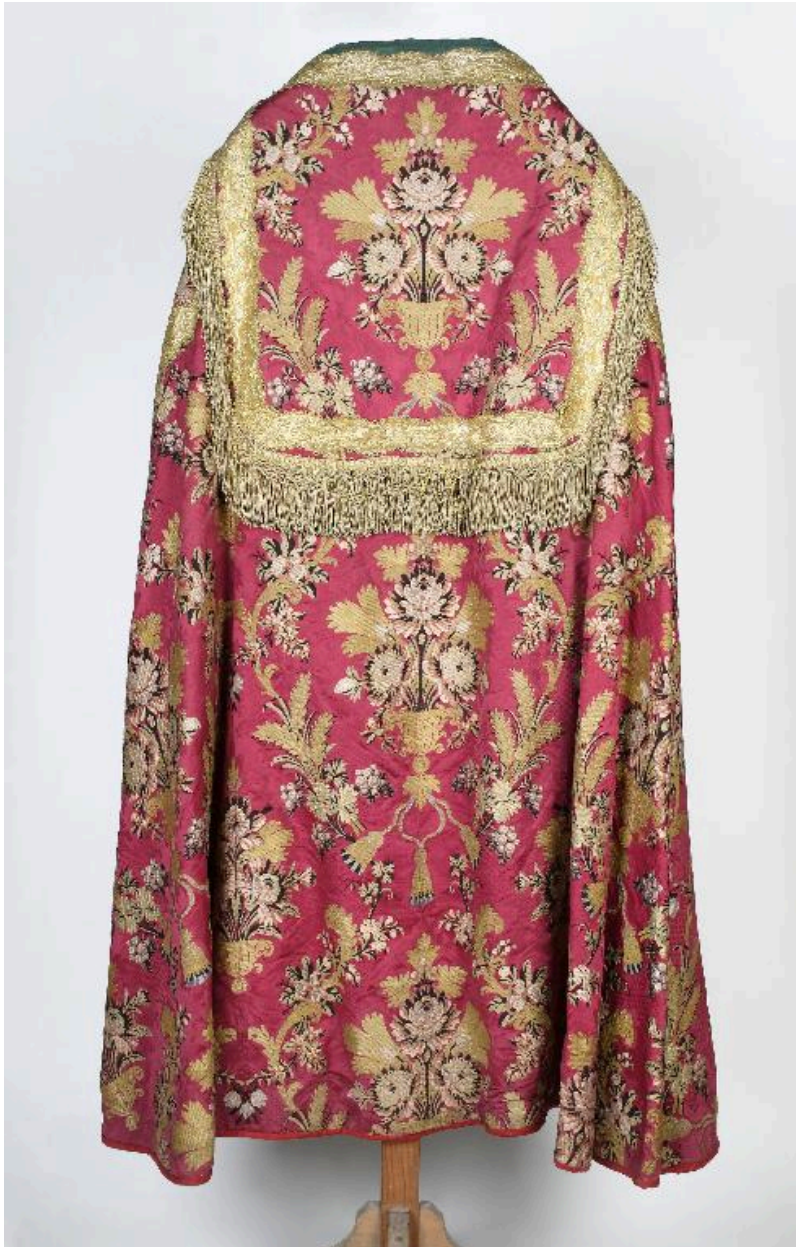
Vue de l'une des chapes, prise de dos.