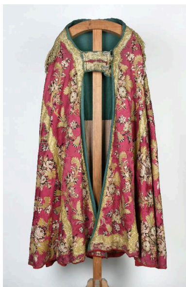
Vue de l'une des chapes, prise de face. Vue de l'une des chapes, prise de dos.