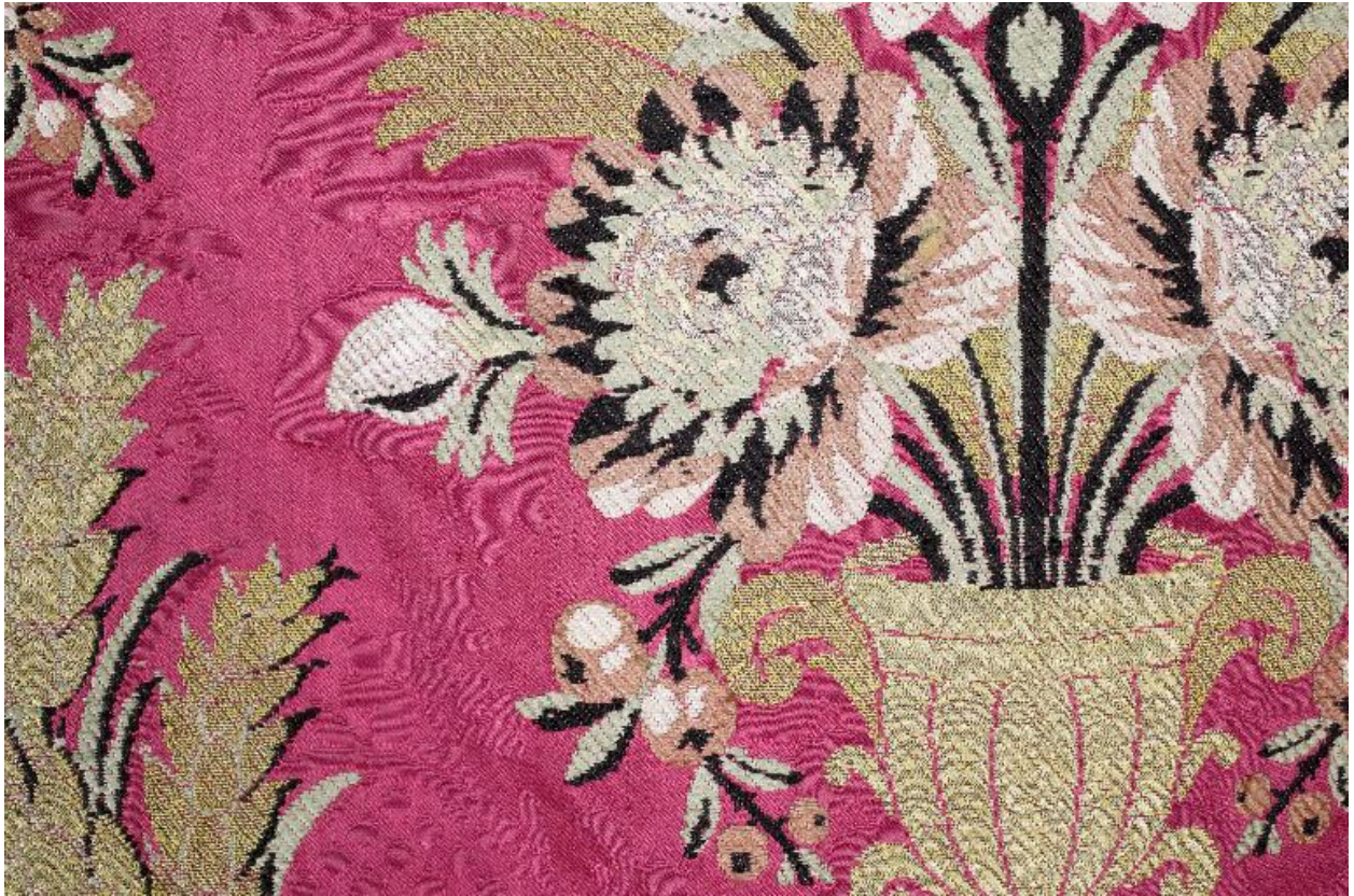
Détail du tissu.