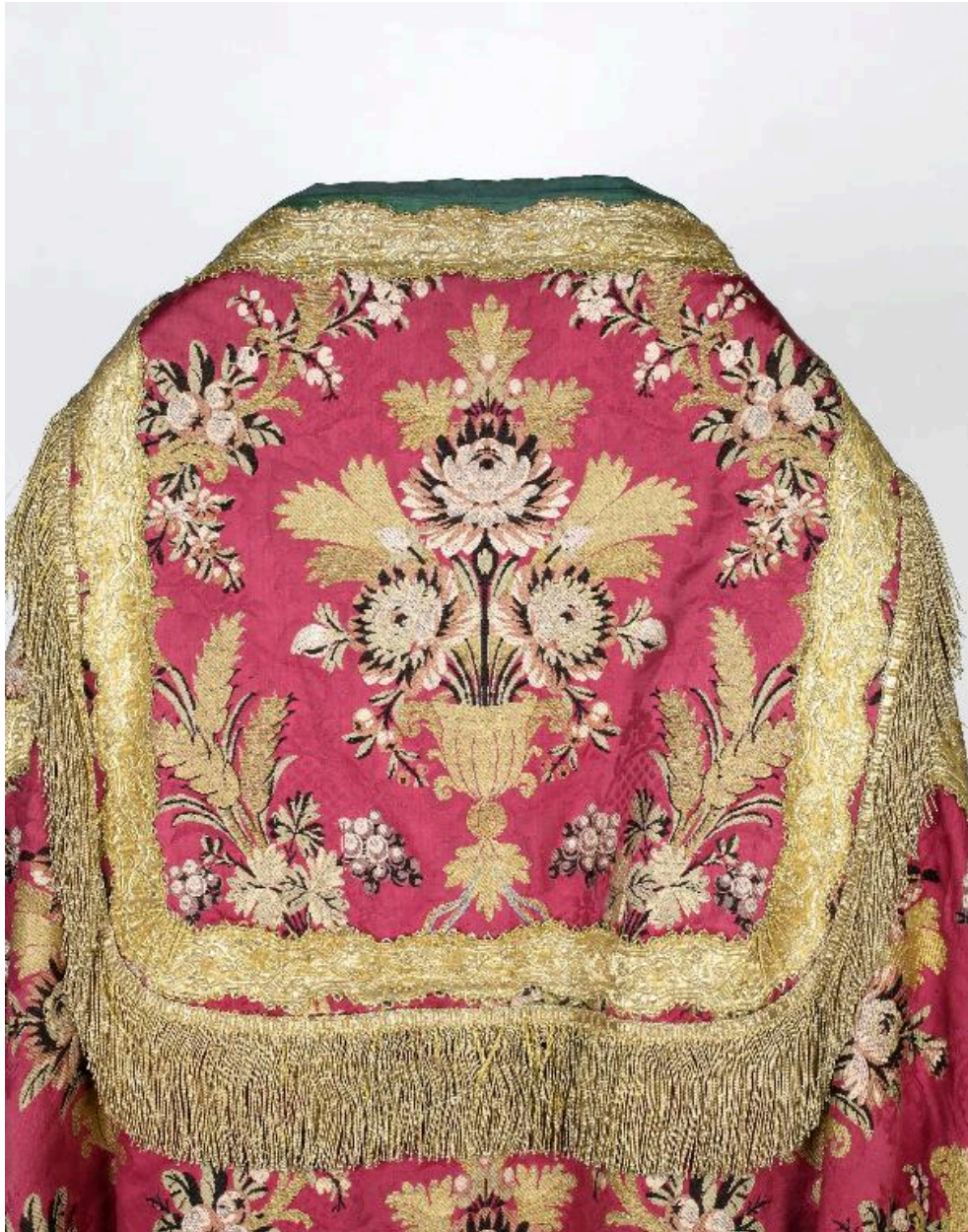
Détail du chaperon de l'une des chapes.