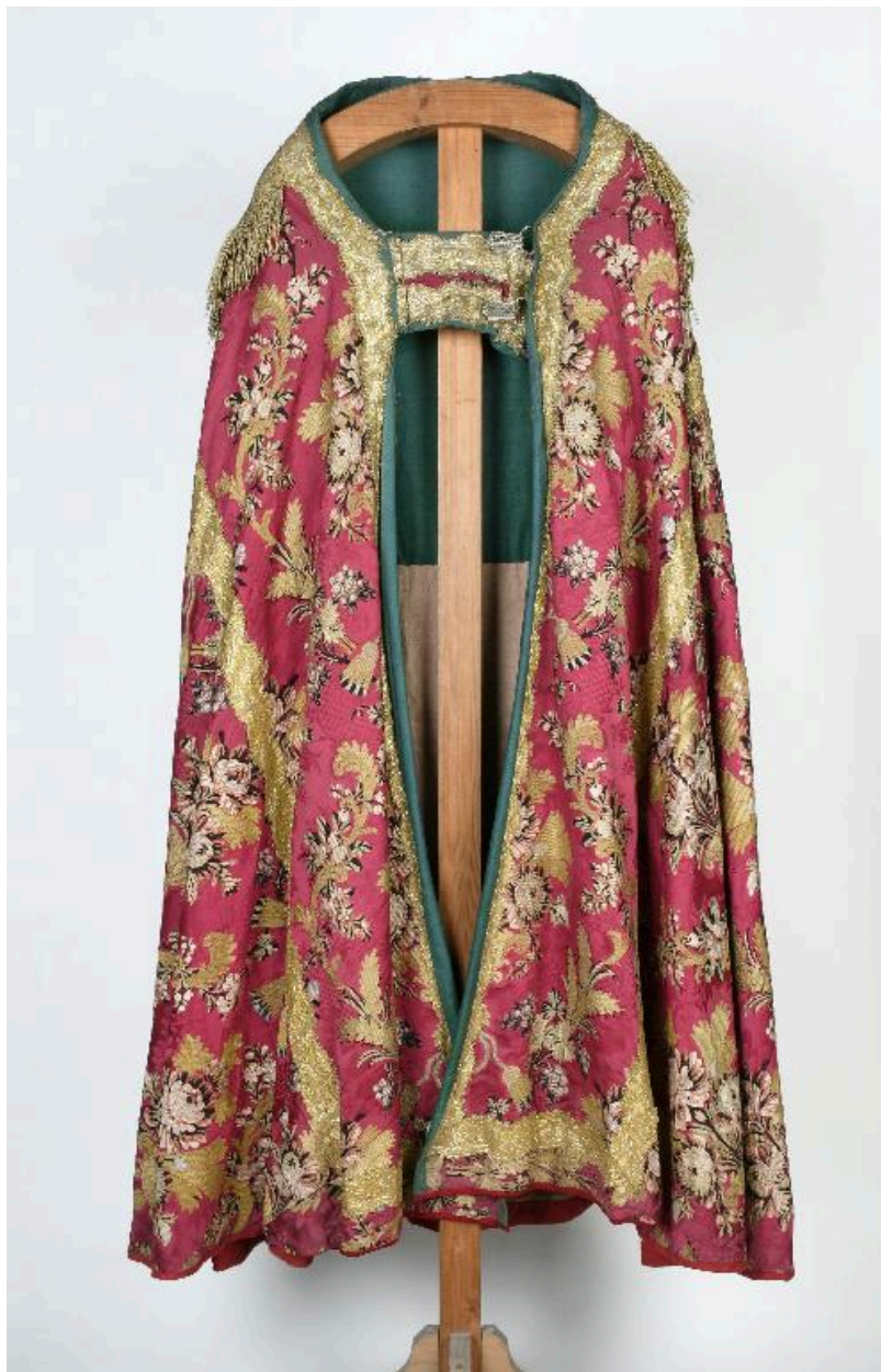
Vue de l'une des chapes, prise de face.