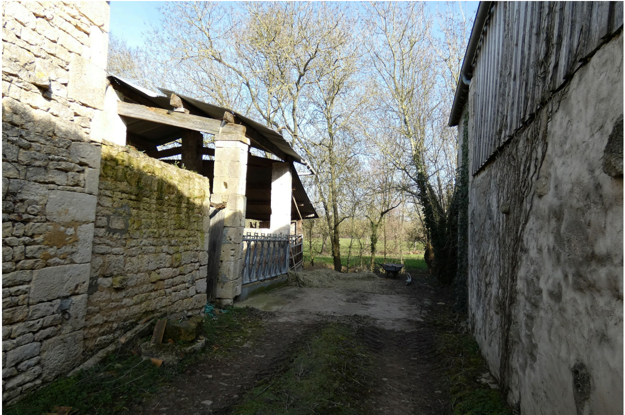
Le hangar à piliers en pierre et l'allée menant à la route d'eau.