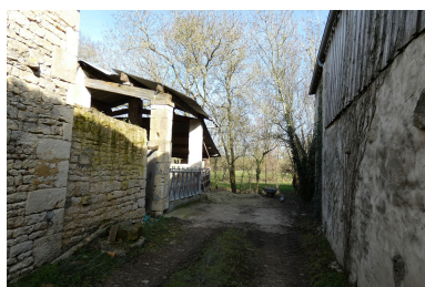
Le hangar à piliers en pierre et l'allée menant à la route d'eau. IVR52_20238500716NUCA