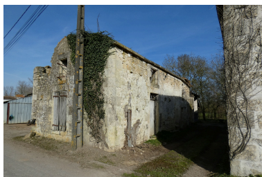
Les vestiges de la ferme vus depuis le sud-ouest.