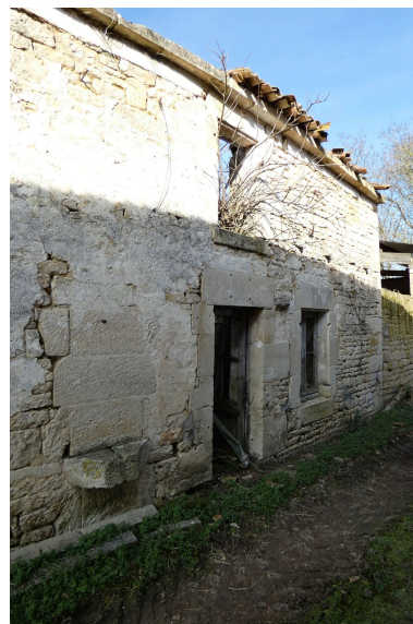
La partie est de la façade du logis avec la pierre d'évier.