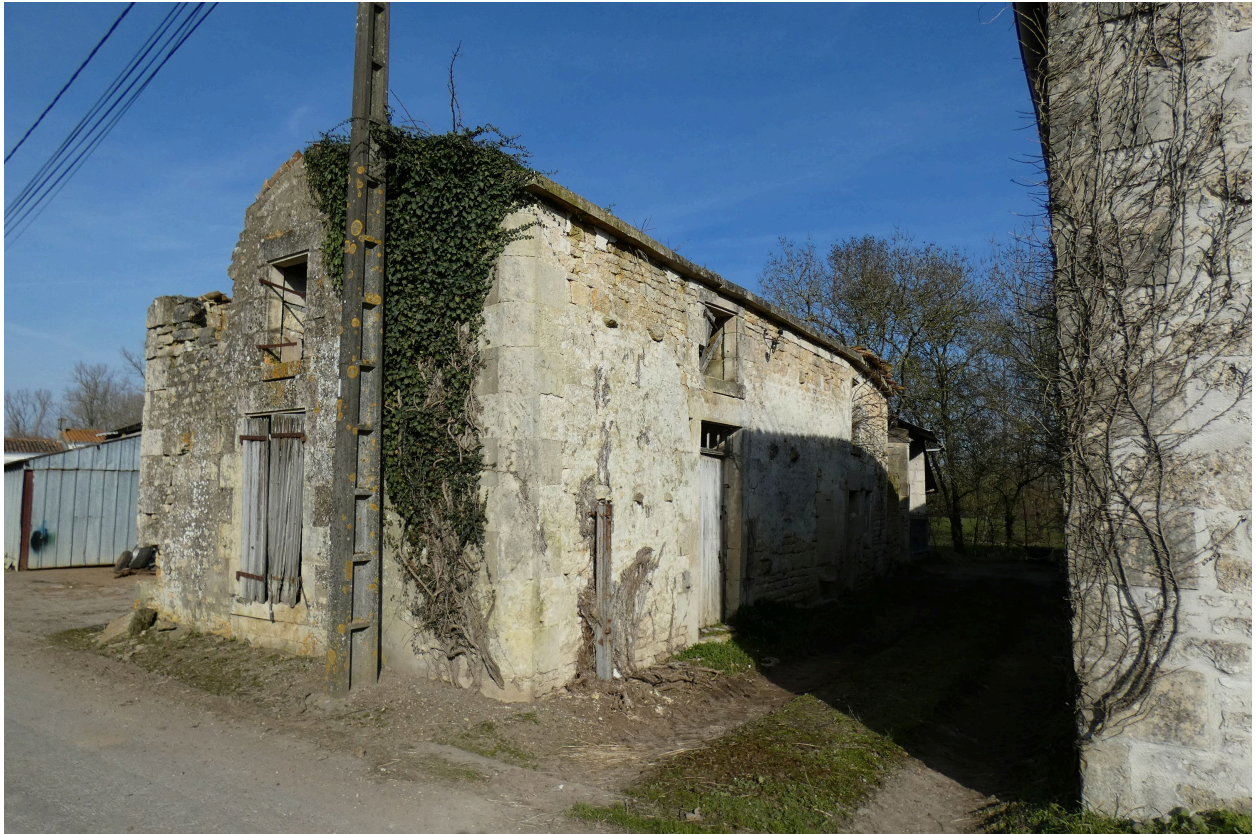
Les vestiges de la ferme vus depuis le sud-ouest.