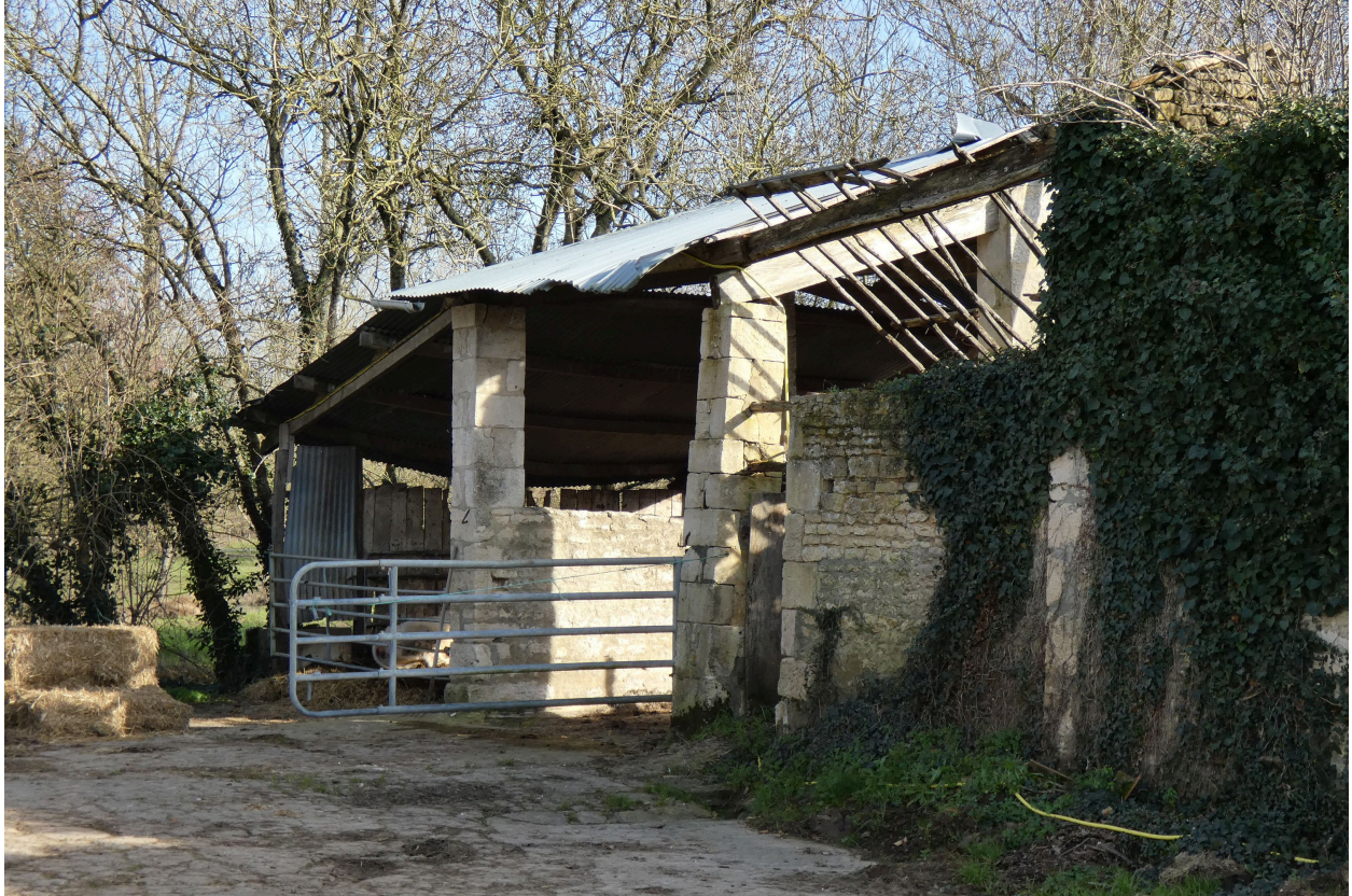
Le hangar à piliers en pierre vu depuis le nord-ouest.