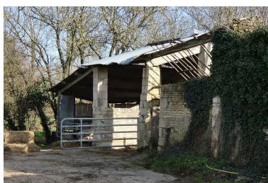
Le hangar à piliers en pierre vu depuis le nord-ouest. IVR52_20238500717NUCA