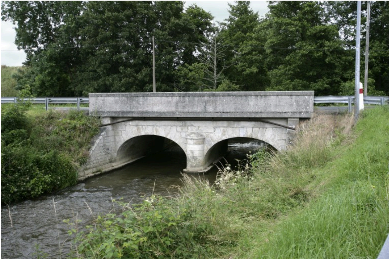
Vue d'aval depuis la rive gauche.