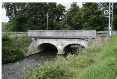
Vue d'aval depuis la rive gauche. IVR52_20075300381NUCA