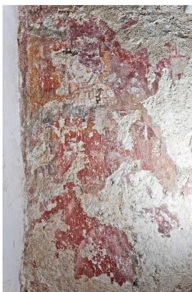
Bras sud du transept, mur nord, côté ouest. Couche picturale avec un soldat recouvrant le décor des années 1200. IVR52_20144900146NUCA