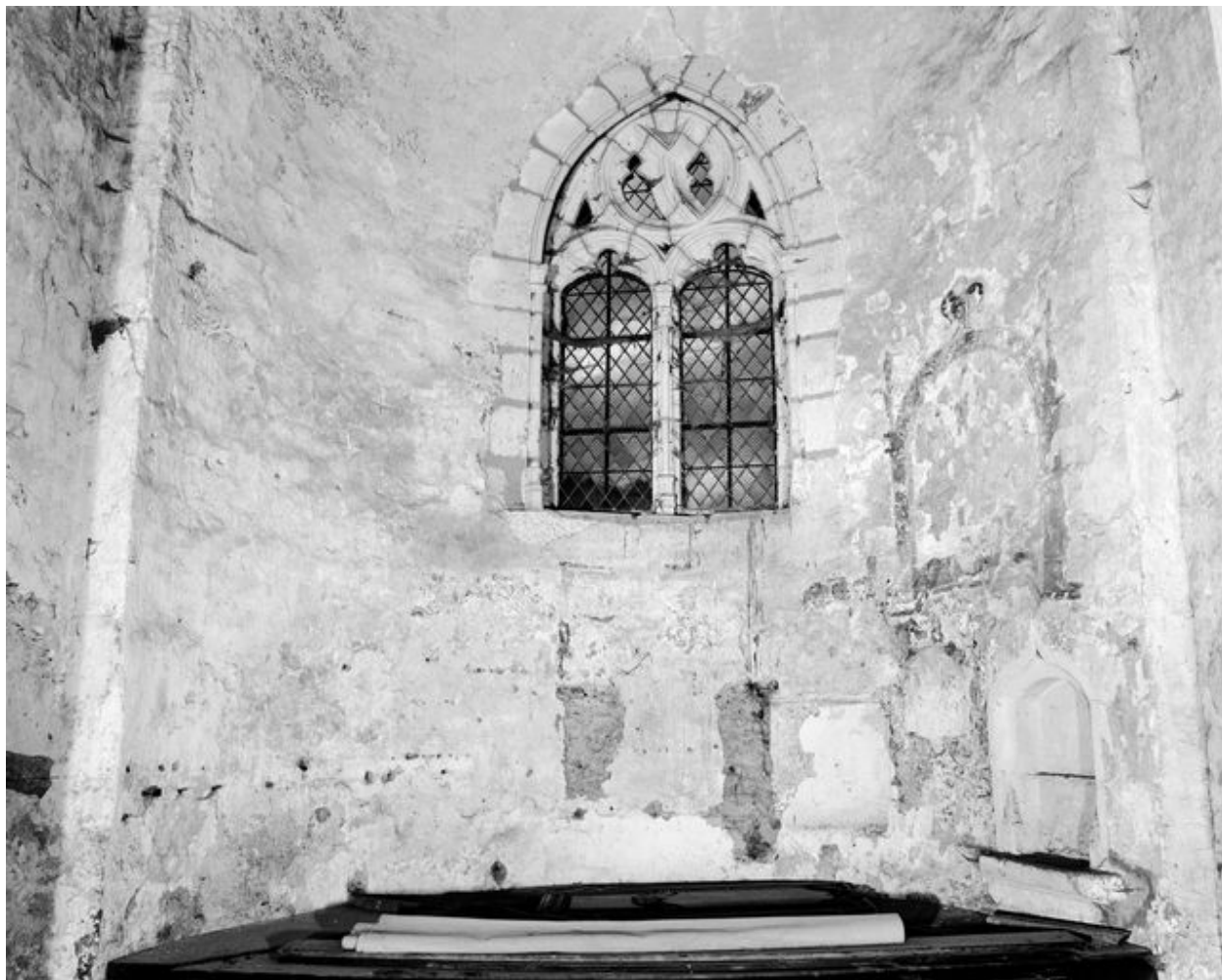
Abside du bras sud du transept. Vue d'ensemble des vestiges de décor peint.