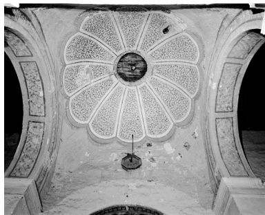
Croisée du transept, coupole : vue d'ensemble des sondages effectués à travers les peintures du XIIIe et du XIXe siècle.