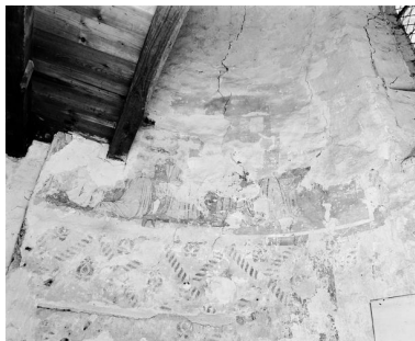
Abside nord du transept. Vierge à l'Enfant avec priants.