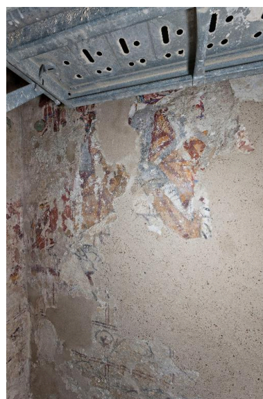
Bras nord du transept, mur est, côté nord. Couche picturale avec des cavaliers recouvrant le décor des années 1200.