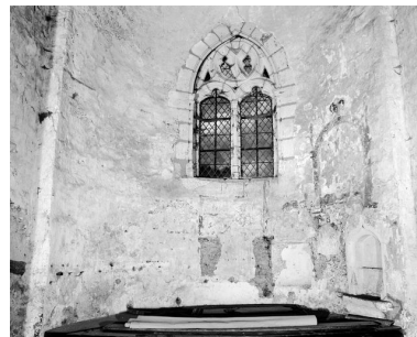
Abside du bras sud du transept. Vue d'ensemble des vestiges de décor peint. IVR52_19924900885X