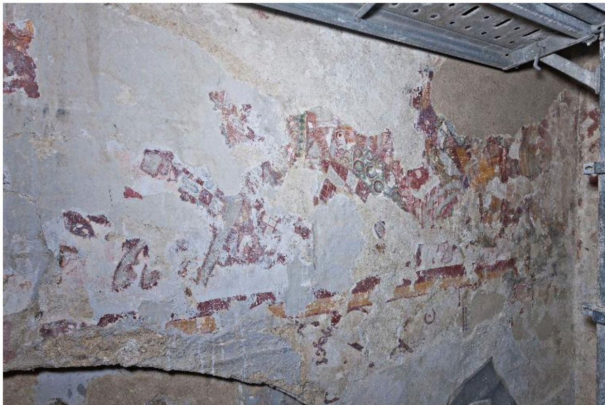
Bras nord du transept, mur est, parties centrale et droite. Couche picturale avec des cavaliers recouvrant le décor des années 1200.