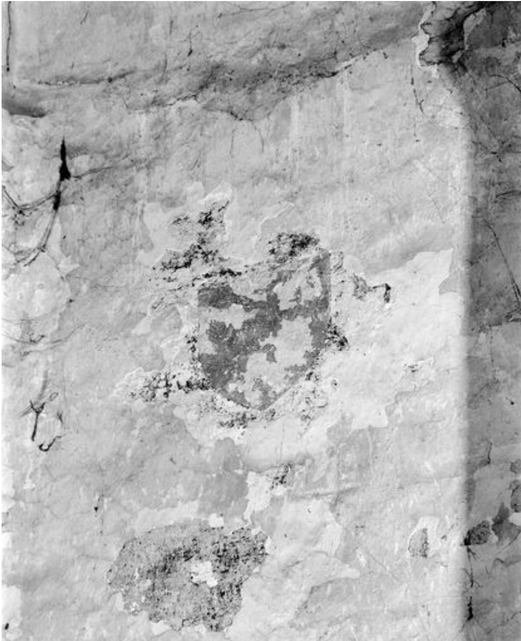
Abside du bras sud du transept. Armoirie.