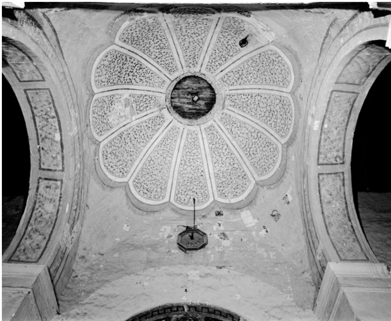
Croisée du transept, coupole : vue d'ensemble des sondages effectués à travers les peintures du XIIIe et du XIXe siècle.