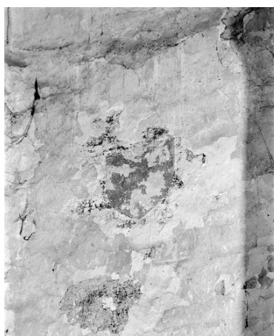
Abside du bras sud du transept. Armoirie.