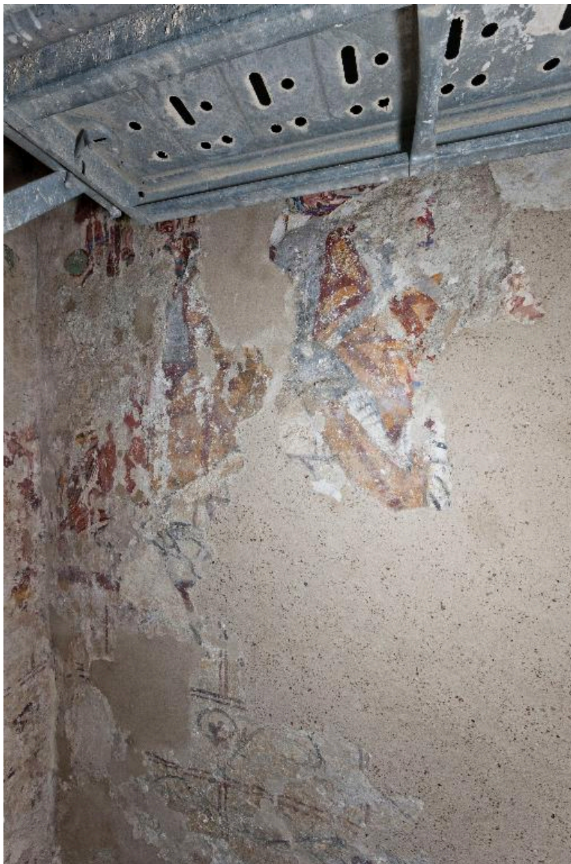
Bras nord du transept, mur est, côté nord. Couche picturale avec des cavaliers recouvrant le décor des années 1200.