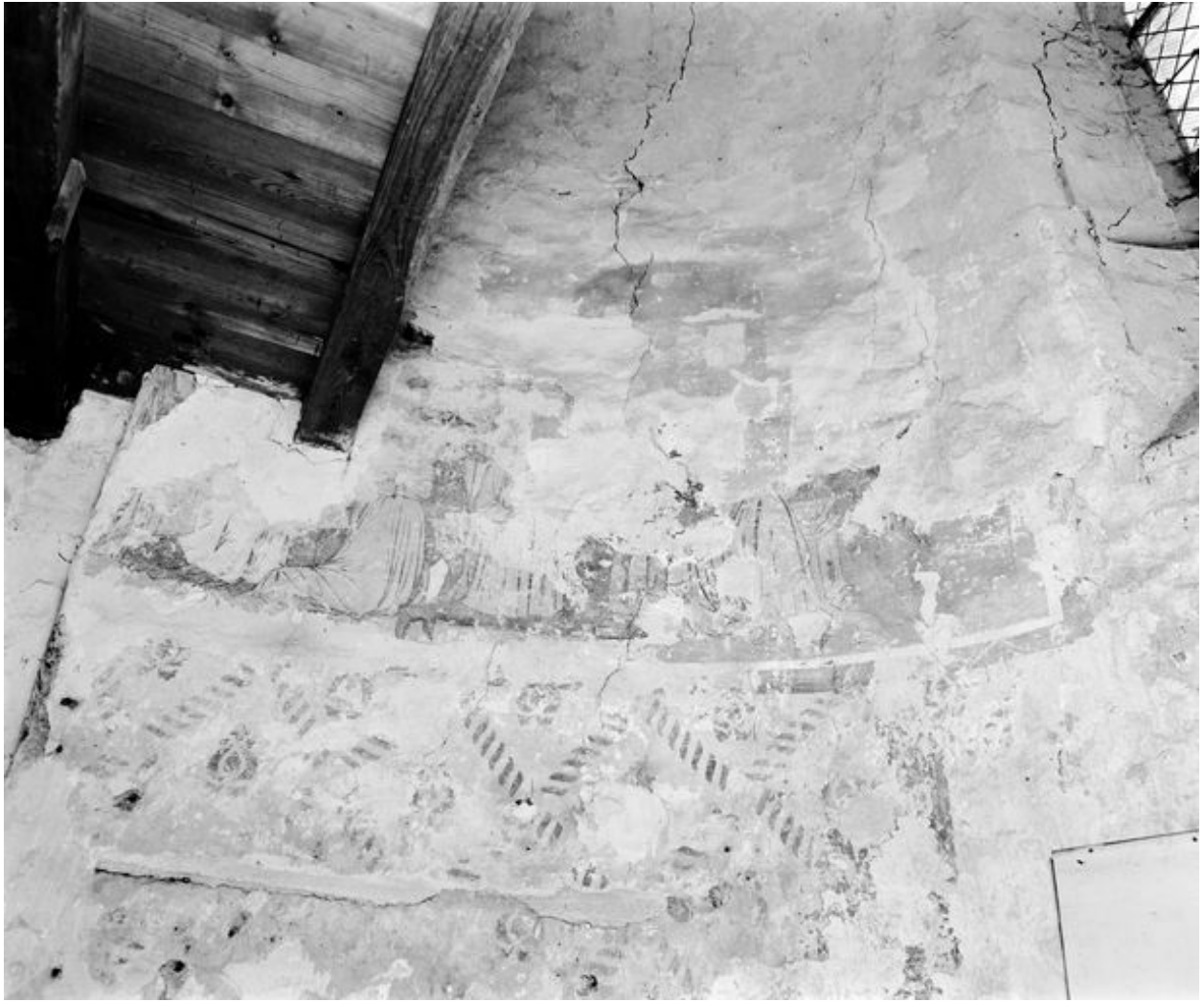
Abside nord du transept. Vierge à l'Enfant avec priants.