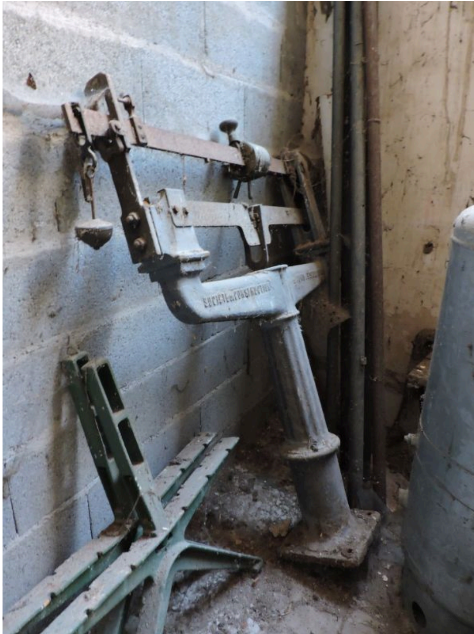
La colonne de la bascule, entreposée sous le marché couvert.