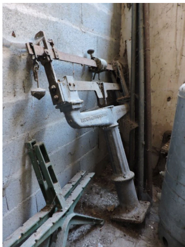
La colonne de la bascule, entreposée sous le marché couvert. IVR52_20198501369NUCA