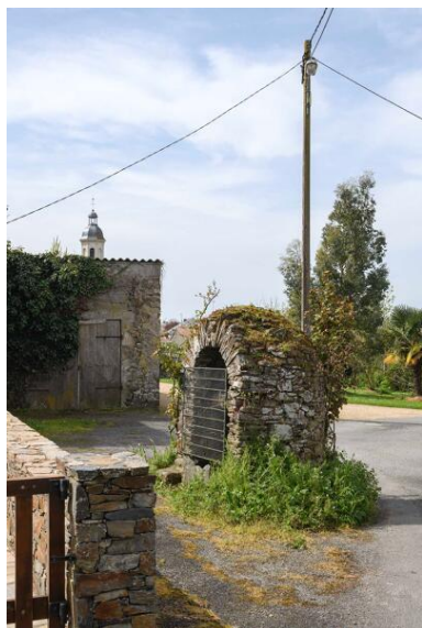
Le Haut-Cimetière. Détail d'un puits.