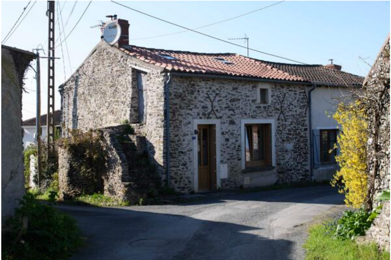
Ecart du Haut-Cimetière. Vue d'ensemble de la ferme n°1.