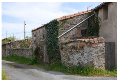
Ferme, 5 rue de la Peltrie. IVR52_20254900536NUCA