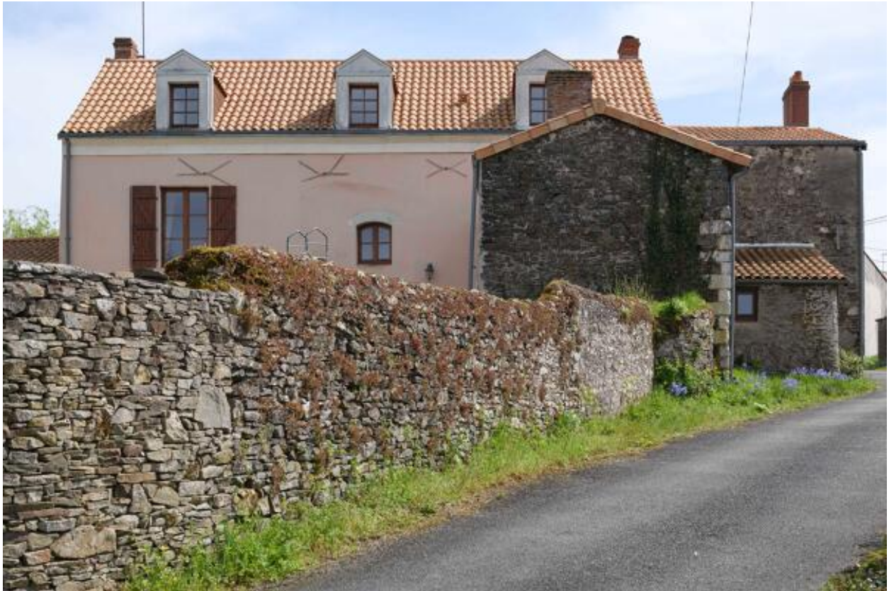
La Peltrie. Vue d'ensemble depuis le nord.