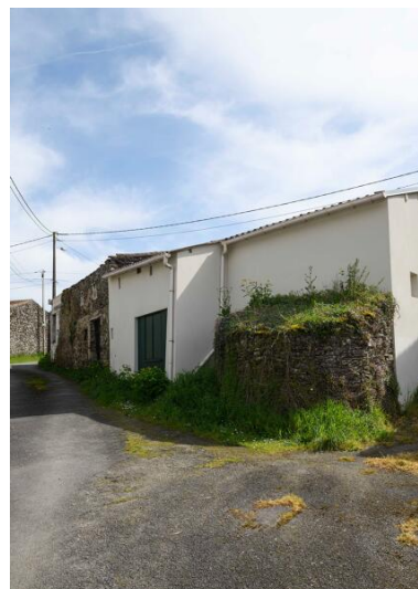
Ferme, rue de la Peltrie.