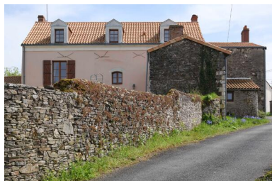
La Peltrie. Vue d'ensemble depuis le nord.