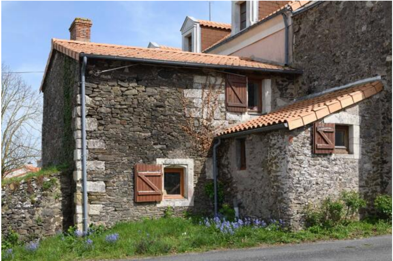
La Peltrie. Vue des bâtiments longeant la rue.