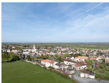
L'écart du Haut-Cimetière et le bourg du Mesnil au second plan. IVR52_20254900412NUCA