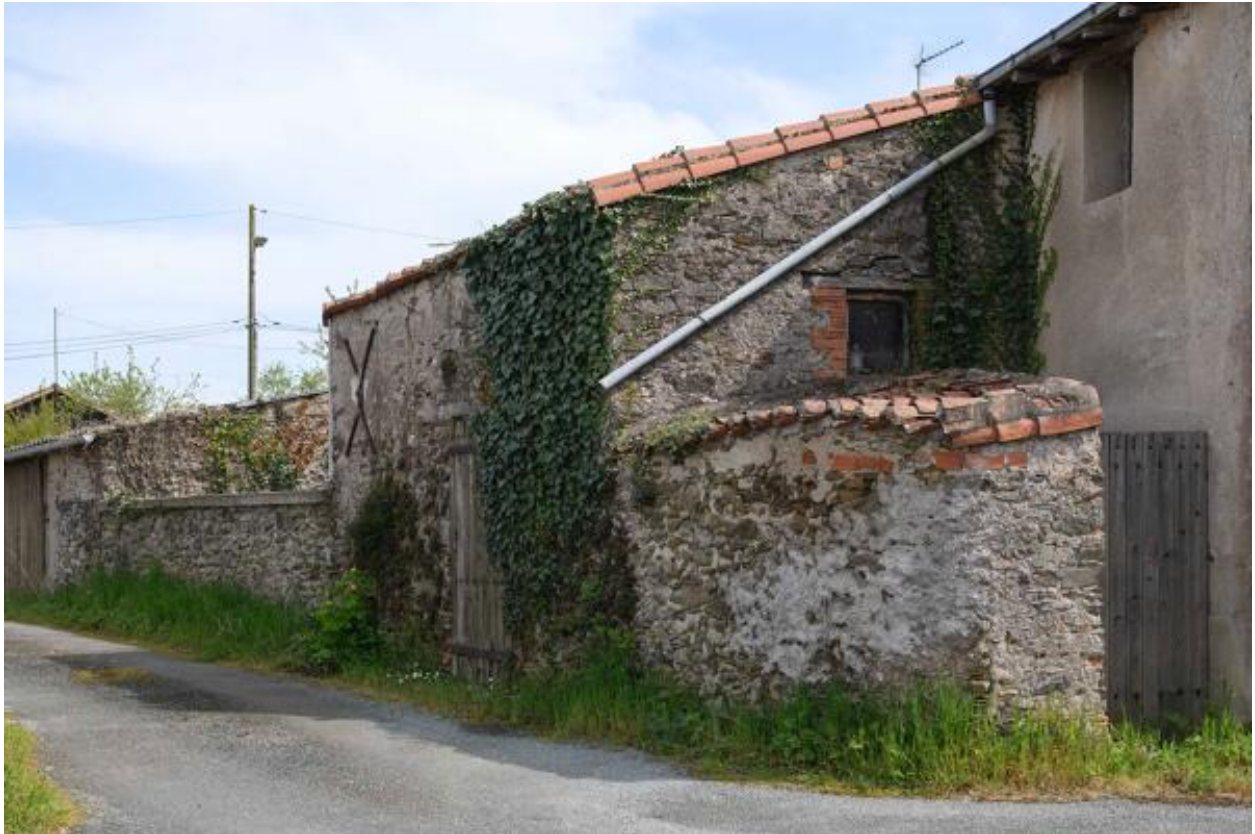
Ferme, 5 rue de la Peltrie.