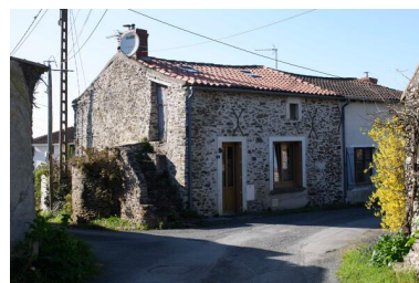
Ecart du Haut-Cimetière. Vue d'ensemble de la ferme n°1. IVR52_20254900400NUCA