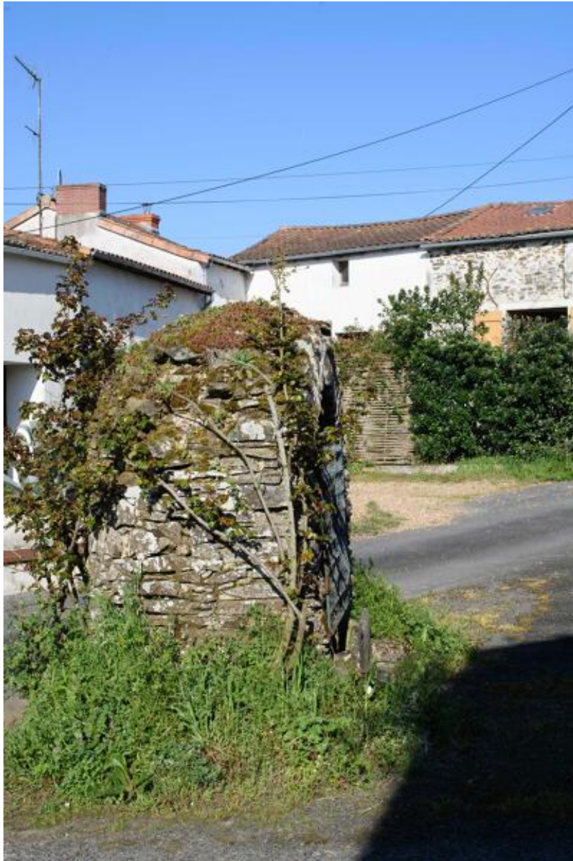
Ecart du Haut-Cimetière. Vue d'un puits commun.