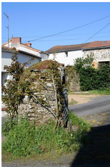
Ecart du Haut-Cimetière. Vue d'un puits commun. IVR52_20254900401NUCA