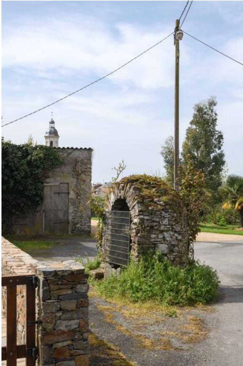
Le Haut-Cimetière. Détail d'un puits.