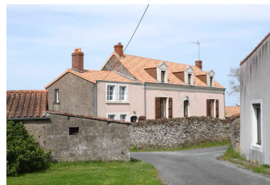
La Peltrie. Vue d'ensemble depuis le sud. IVR52_20254900535NUCA