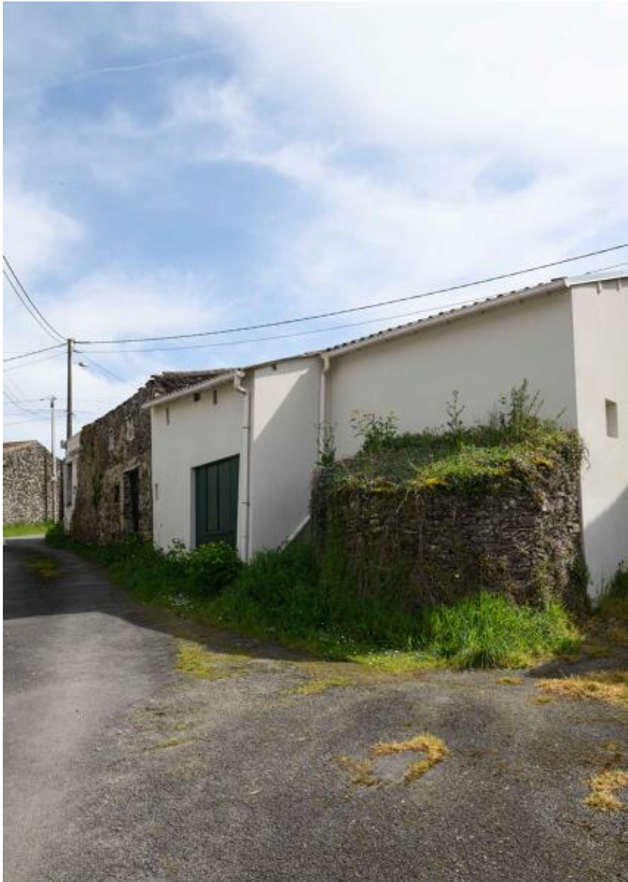
Ferme, rue de la Peltrie.