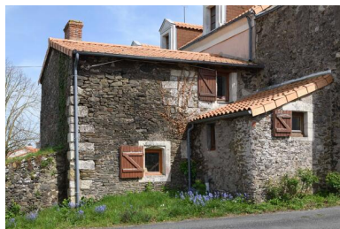
La Peltrie. Vue des bâtiments longeant la rue.