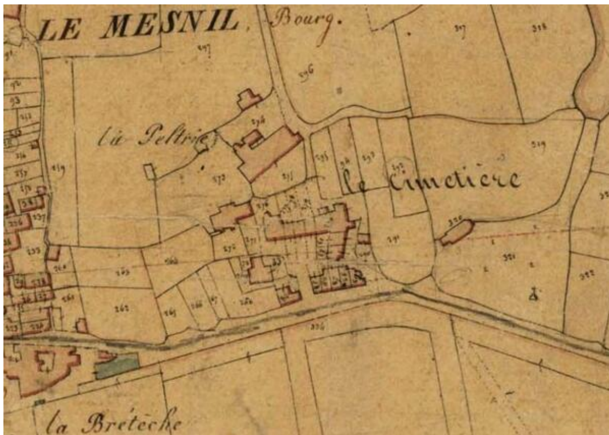
L'écart dit du Haut-Cimetière. Extrait du plan cadastral de 1827, section C (unique du bourg). (AD Maine-et-Loire ; 3 P 4/212/6).