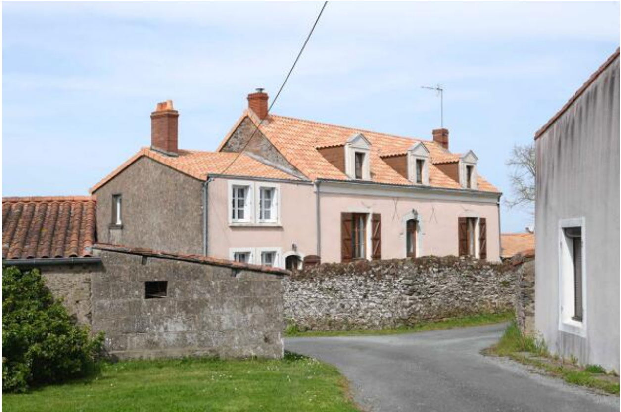
La Peltrie. Vue d'ensemble depuis le sud.