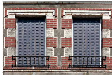
Maison, 1 rue de Lassay, détail des fenêtres de l'étage. IVR52_20195300448NUCA