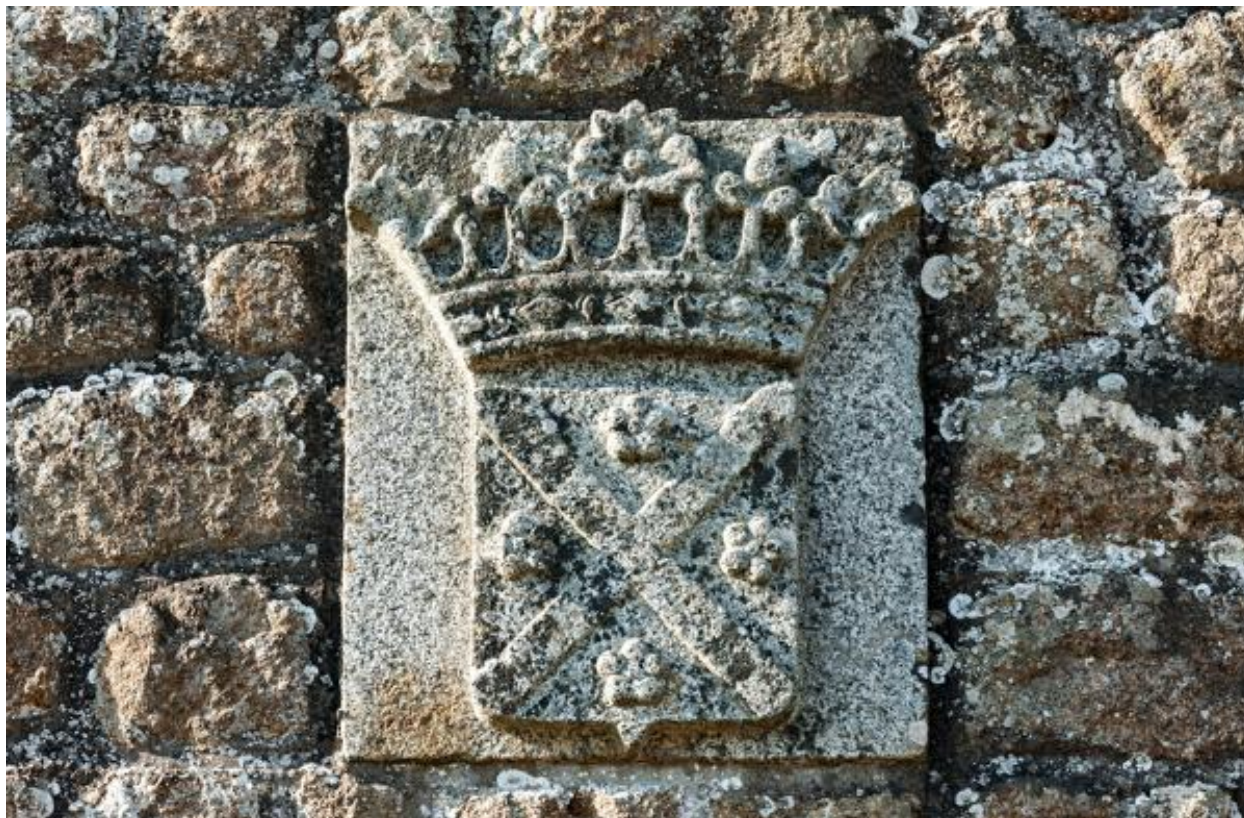
Armoiries incluses dans la maçonnerie de la chapelle funéraire.