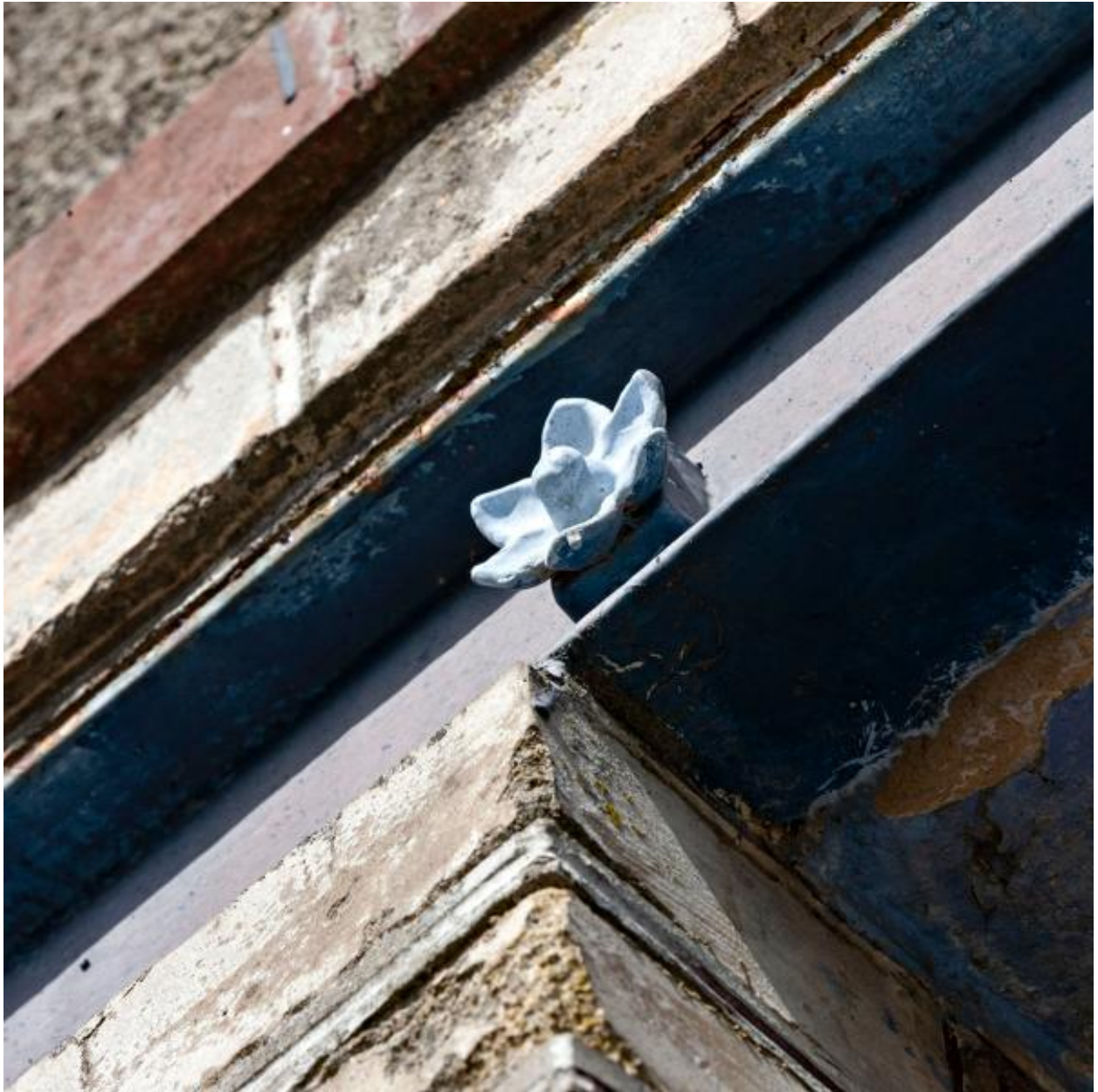
Maison, 1 rue de Lassay, détail du linteau de fenêtre.