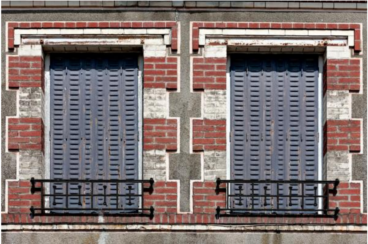
Maison, 1 rue de Lassay, détail des fenêtres de l'étage.