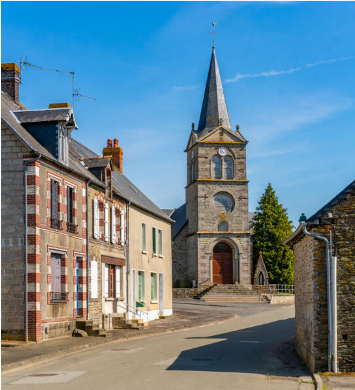
Perspective sur le clocher-porche de l'église à travers la rue de Lassay