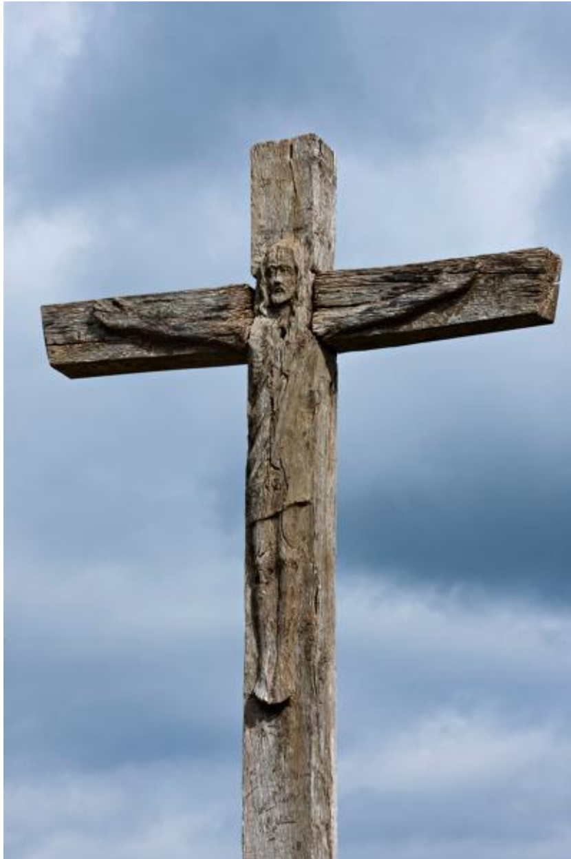
Croix de chemin, rue du château.