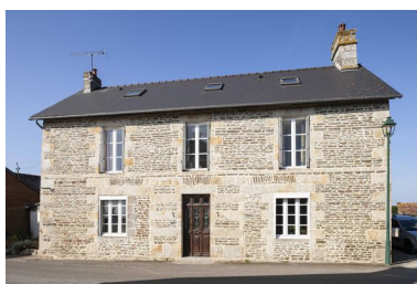
Maison, 8 rue de Lassay. IVR52_20215301561NUCA