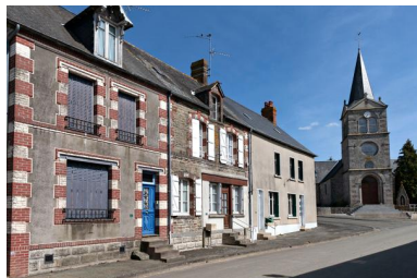
Maisons, rue de Lassay.