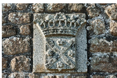
Armoiries incluses dans la maçonnerie de la chapelle funéraire.