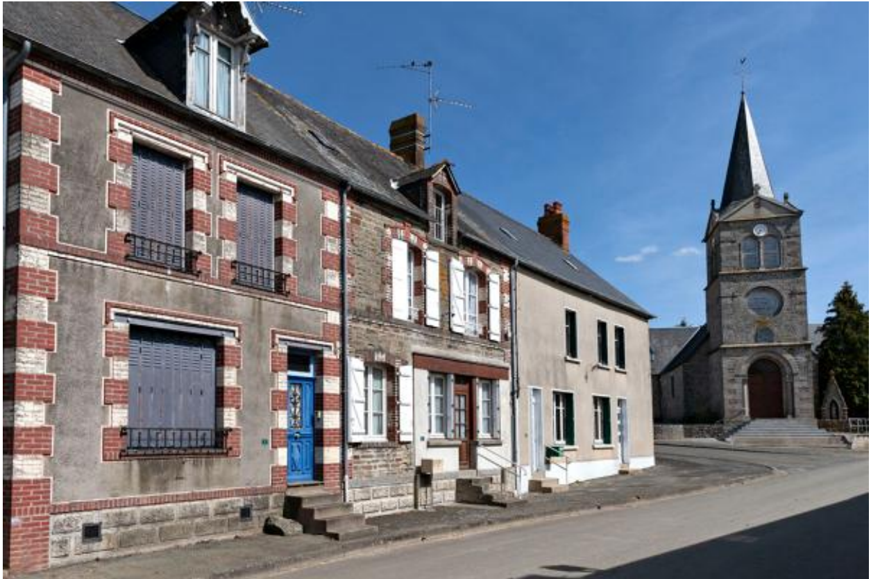
Maisons, rue de Lassay.