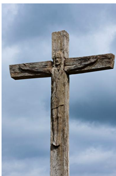
Croix de chemin, rue du château.