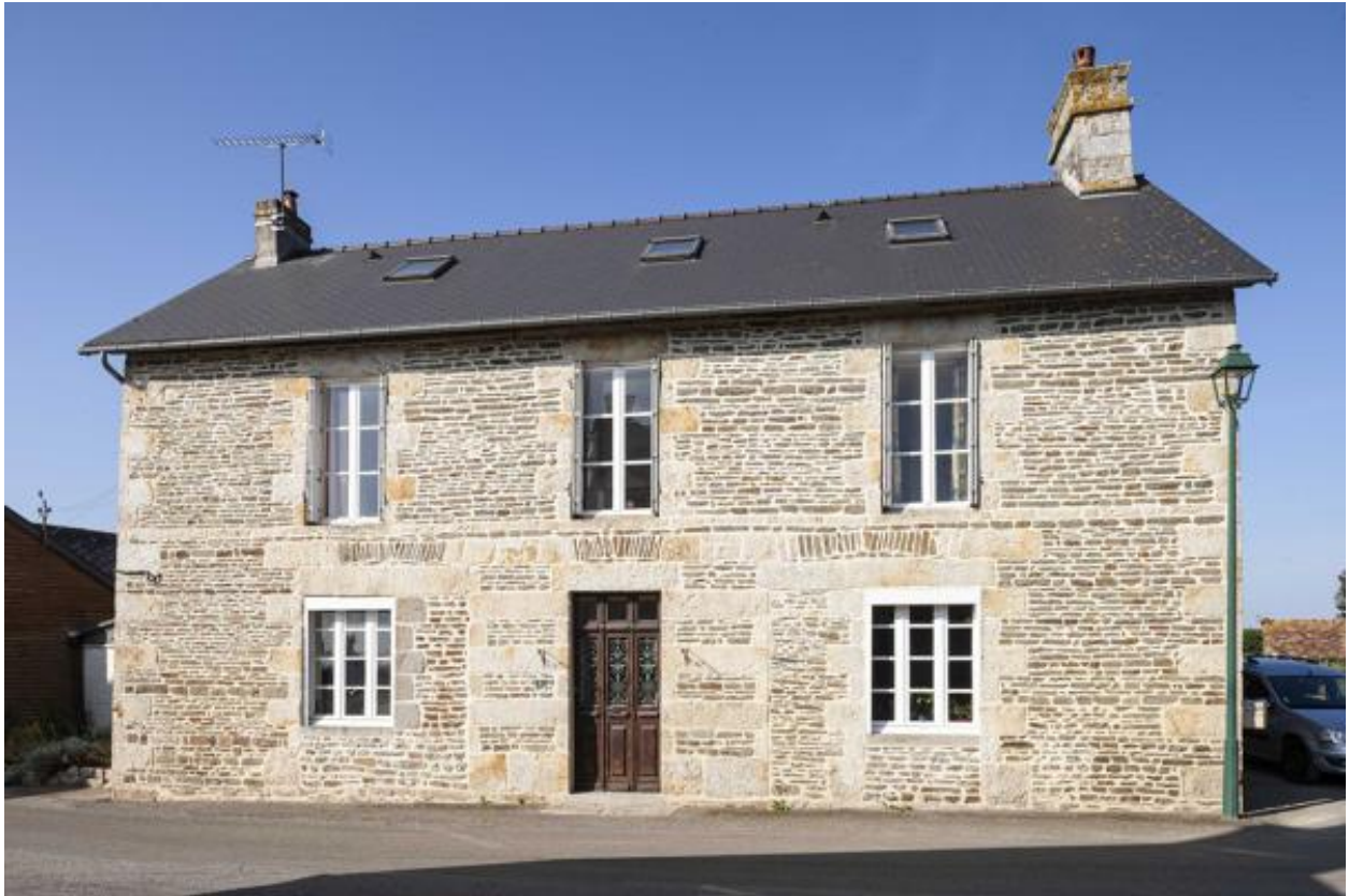
Maison, 8 rue de Lassay.