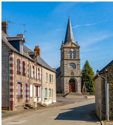
Perspective sur le clocher-porche de l'église à travers la rue de Lassay