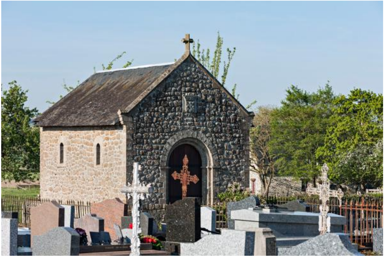
Cimetière de Thuboeuf, chapelle funéraire.