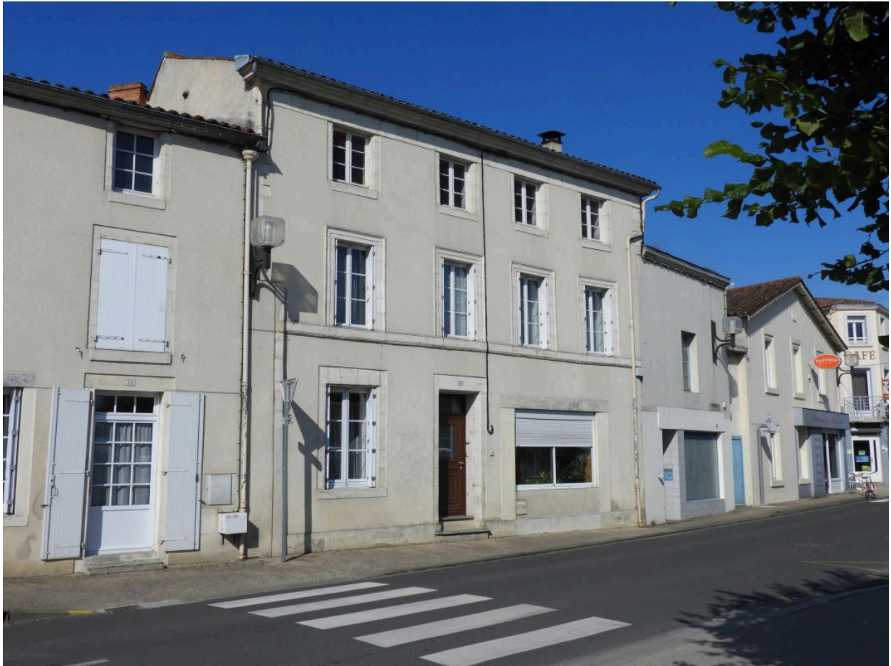
La maison vue depuis le nord-est.