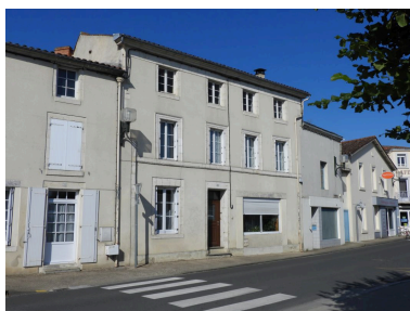
La maison vue depuis le nord-est.

IVR52_20198501639NUCA