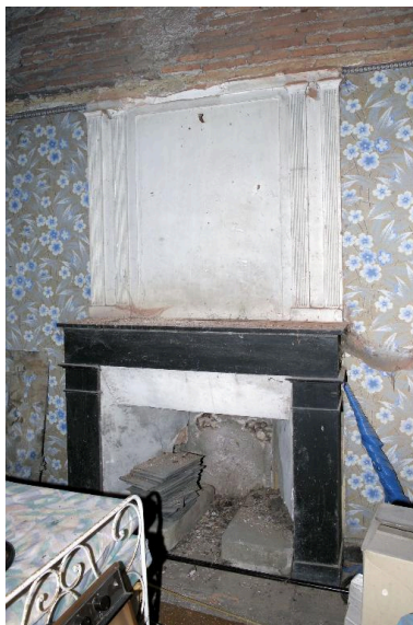
Vue du deuxième étage prise vers le pignon est, détail de la cheminée. IVR52_20034400436NUCA