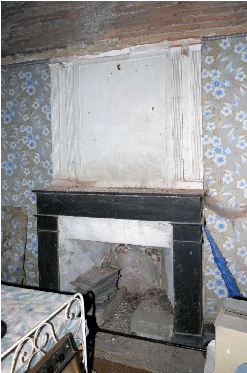
Vue du deuxième étage prise vers le pignon est, détail de la cheminée.