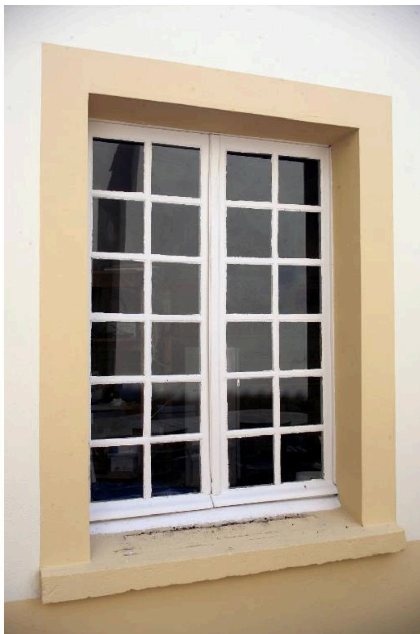
Le corps secondaire en appentis, la pièce située au nord : détail de la baie sud.