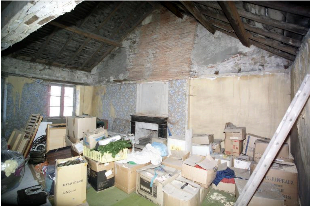
Vue du deuxième étage vers le pignon est.