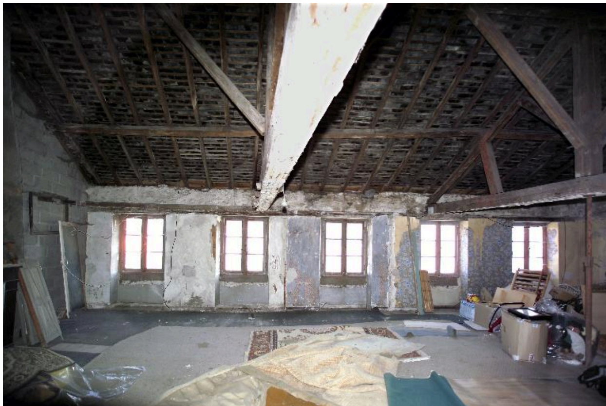
Vue du deuxième étage vers la rue.