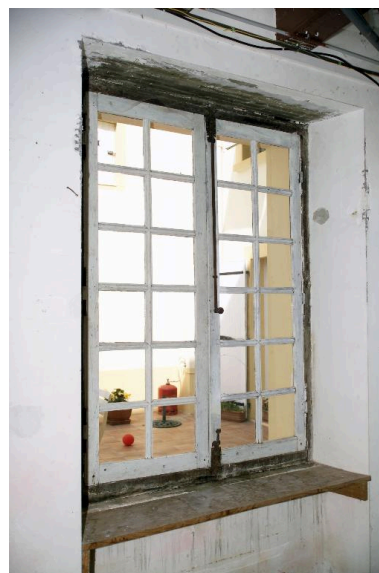
Le corps secondaire en appentis, la pièce située au nord : détail de la baie sud.