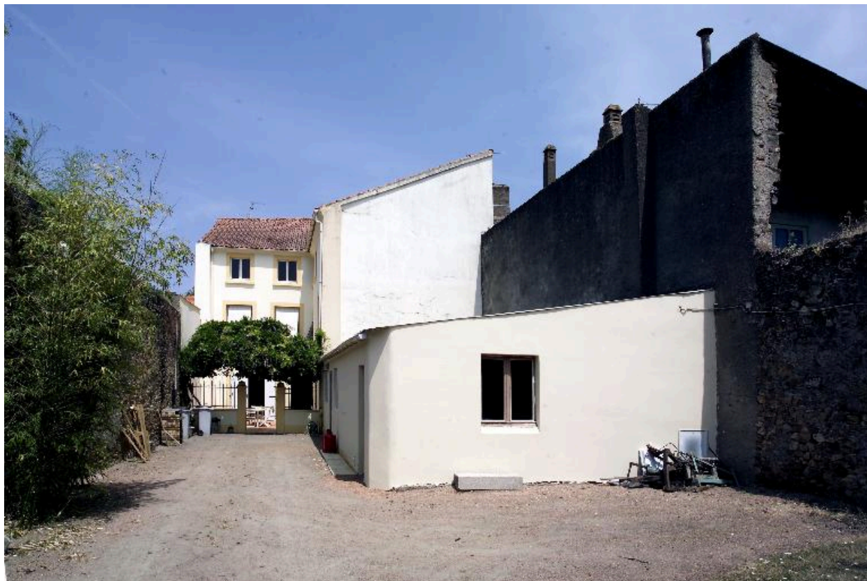
Vue d'ensemble depuis le jardin.