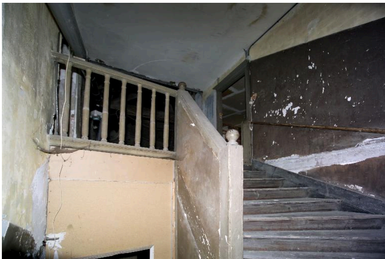
L'escalier, vue de la volée d'accès au deuxième étage.