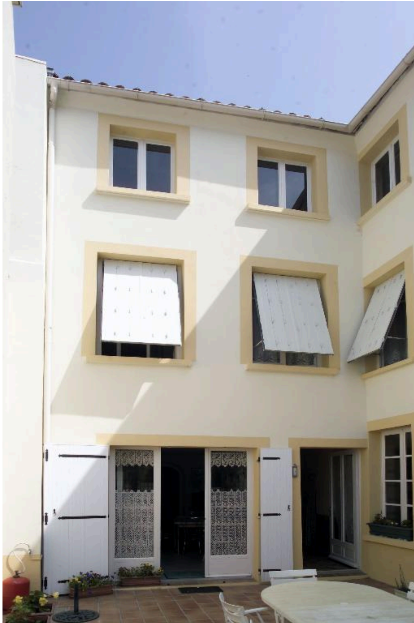
Vue partielle depuis la cour.