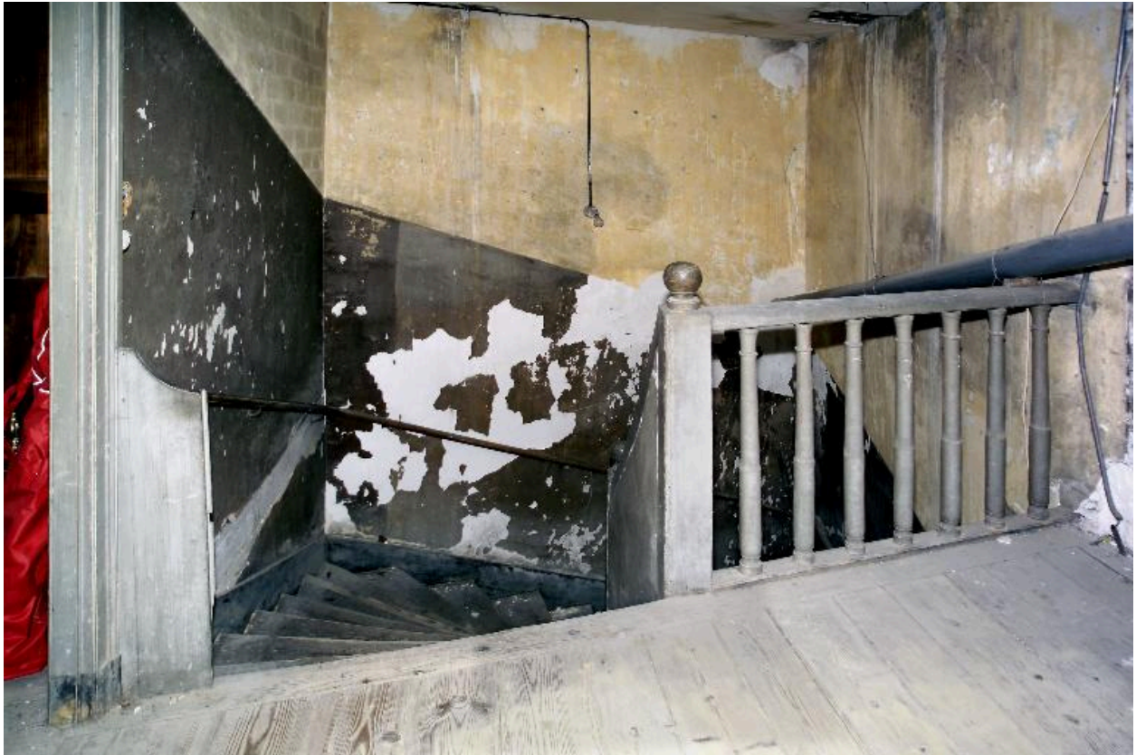
L'escalier, vue prise du palier du deuxième étage.