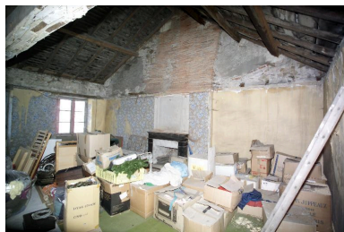
Vue du deuxième étage vers le pignon est.