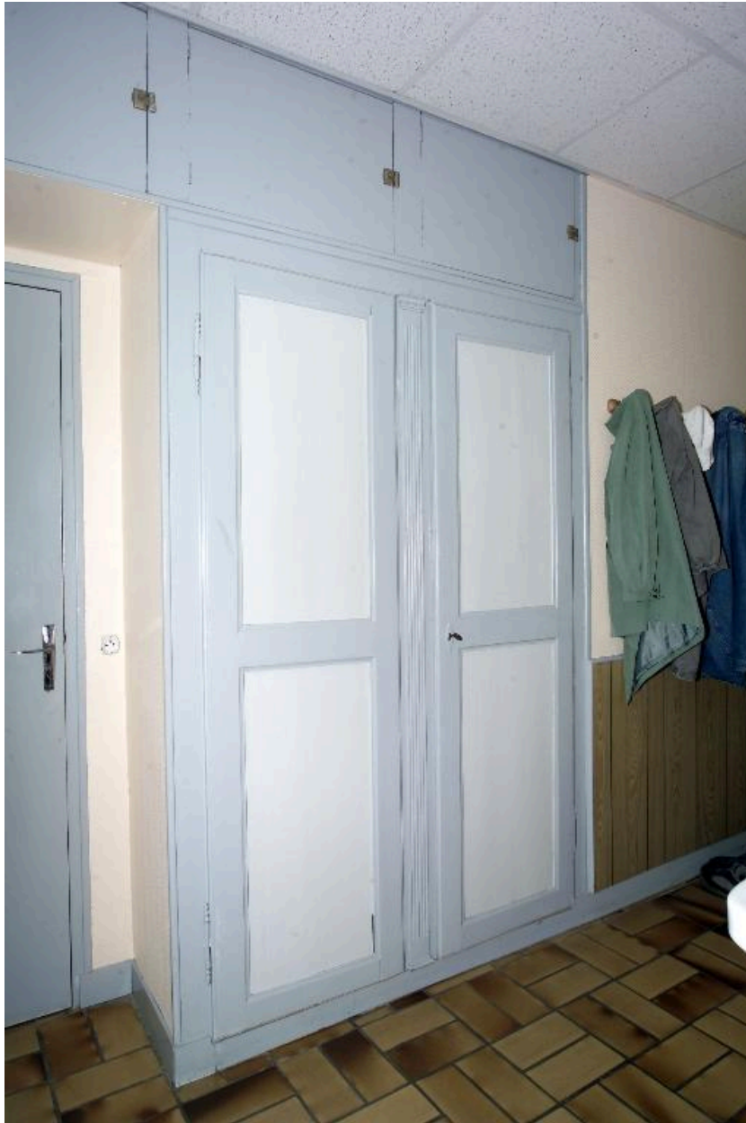
Les portes fermant actuellement la cage d'escalier de la première maison (escalier supprimé).