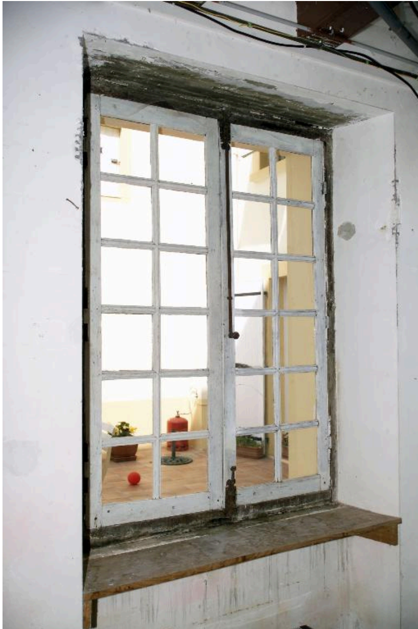
Le corps secondaire en appentis, la pièce située au nord : détail de la baie sud.