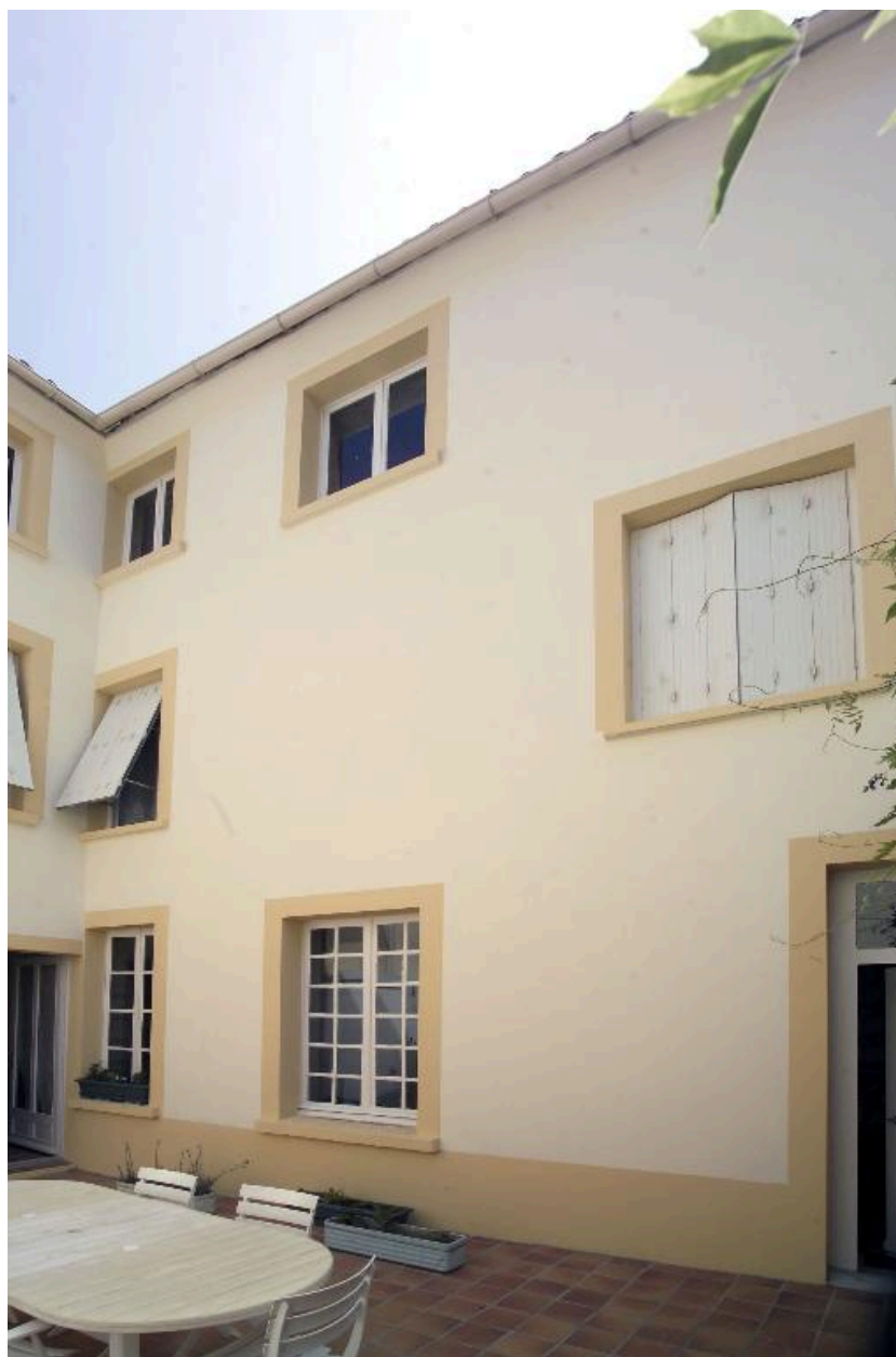
La façade du corps secondaire en retour sur la cour à l'est, vue partielle.