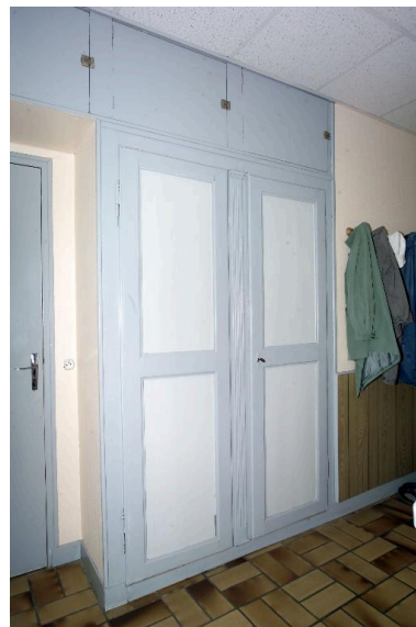
Les portes fermant actuellement la cage d'escalier de la première maison (escalier supprimé).