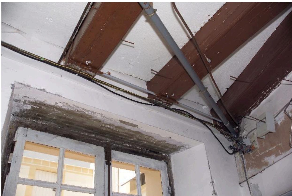
Le corps secondaire en appentis, la pièce située au nord : détail des solives.