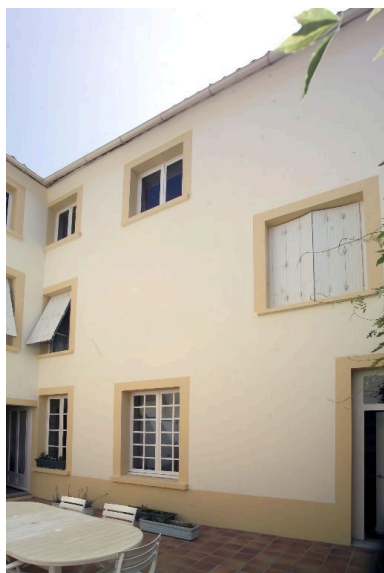
La façade du corps secondaire en retour sur la cour à l'est, vue partielle. IVR52_20034400444NUCA