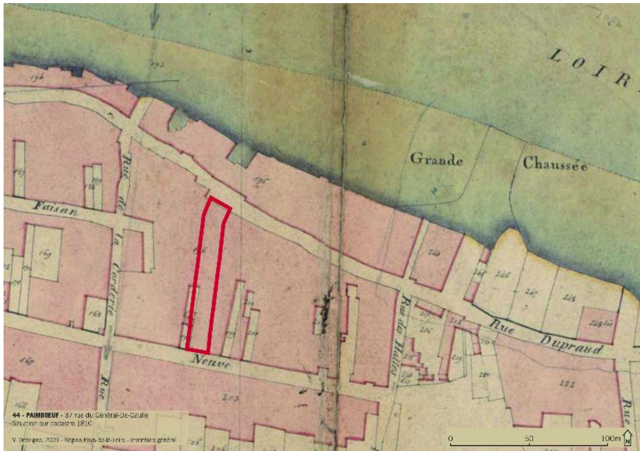
Situation sur cadastre 1810.