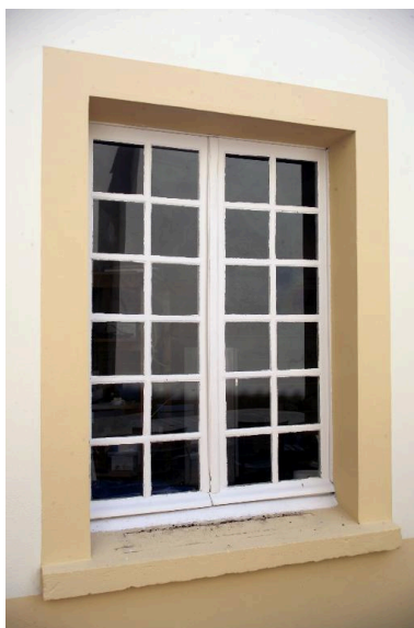
Le corps secondaire en appentis, la pièce située au nord : détail de la baie sud.