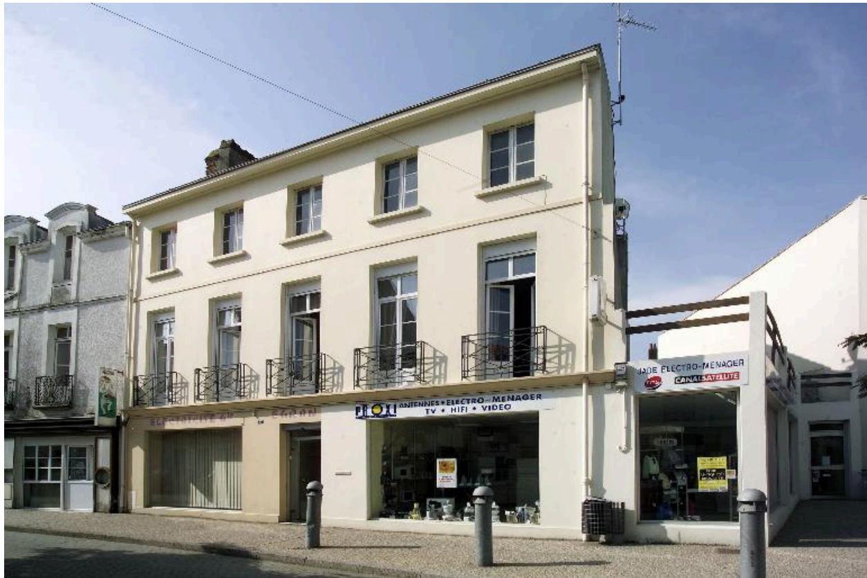
La façade sur la rue.