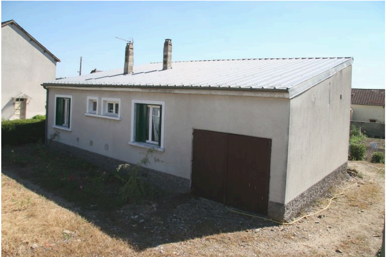
15, rue du 8 mai : façade postérieure sur rue.