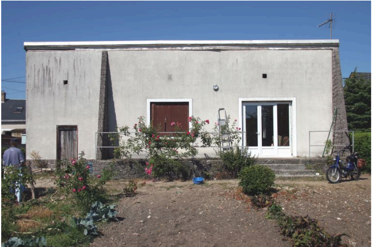
15, rue du 8 mai : façade antérieure sur le jardin.