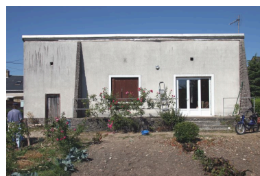
15, rue du 8 mai : façade antérieure sur le jardin. IVR52_20057203663NUCA