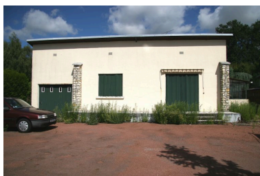
Impasse du Tertre : façade antérieure sur la cour. IVR52_20057203592NUCA