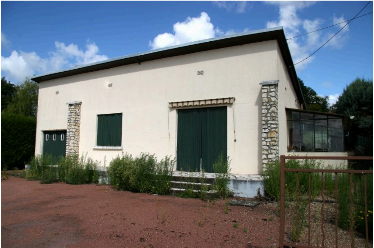
Impasse du Tertre : façade antérieure. Porte d'entrée protégée par une petite véranda.