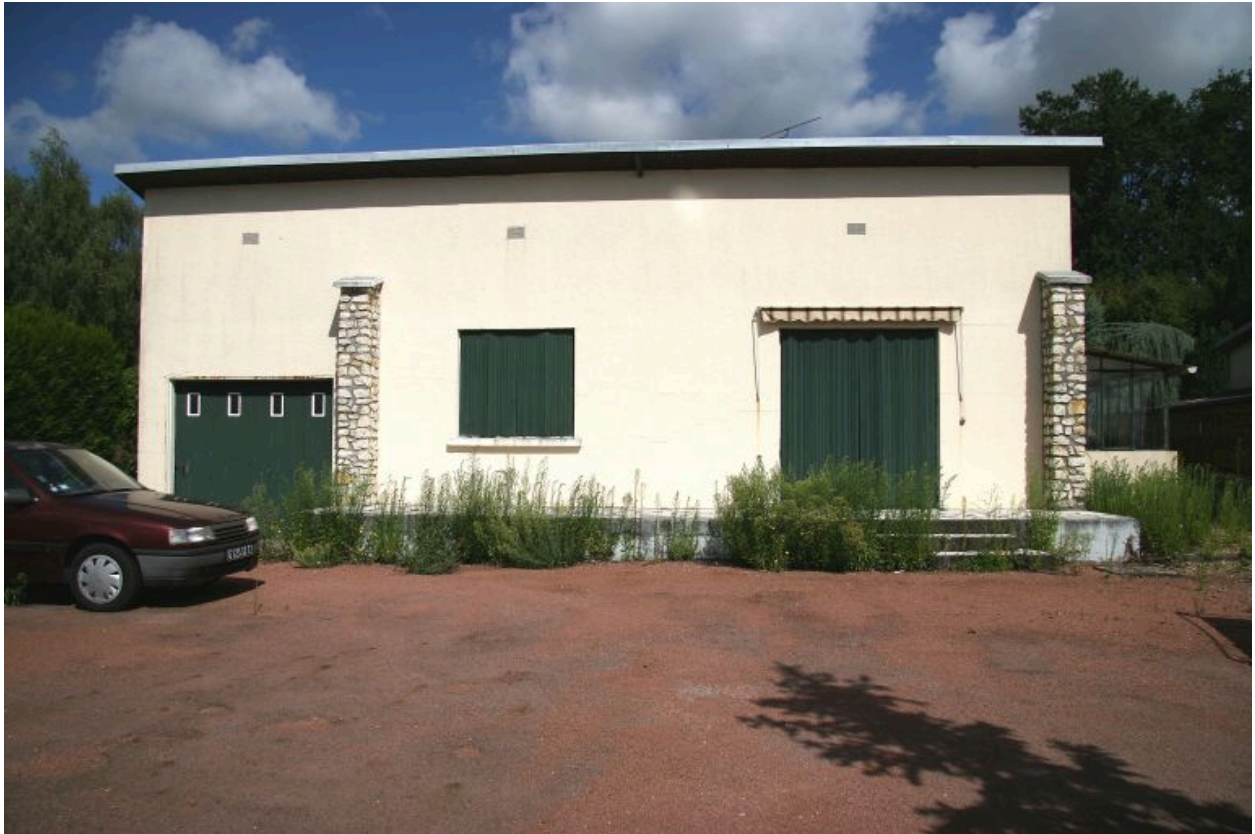
Impasse du Tertre : façade antérieure sur la cour.