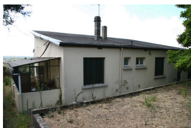
Impasse du Tertre : façade postérieure. IVR52_20057203589NUCA