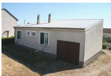
15, rue du 8 mai : façade postérieure sur rue. IVR52_20057203664NUCA