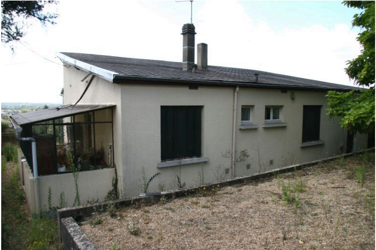
Impasse du Tertre : façade postérieure.