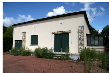
Impasse du Tertre : façade antérieure. Porte d'entrée protégée par une petite véranda. IVR52_20057203588NUCA