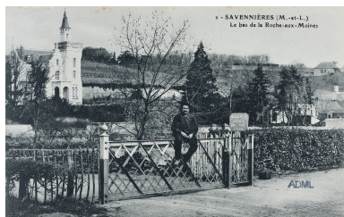
Belle-Vue. Le bas de la Roche-aux-Moines. Carte postale. 1er quart 20e siècle. IVR52_20174900657NUCA