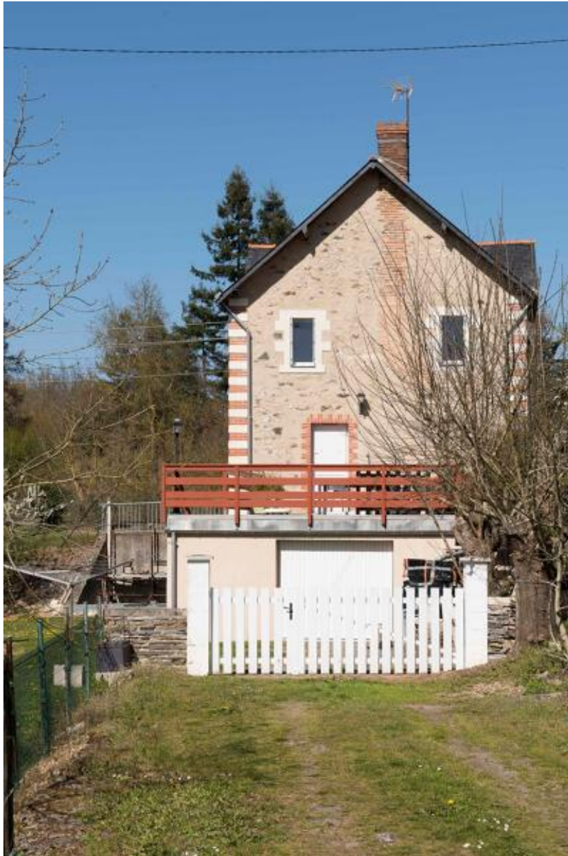
L'ancien café de la gare. Vue du pignon nord.