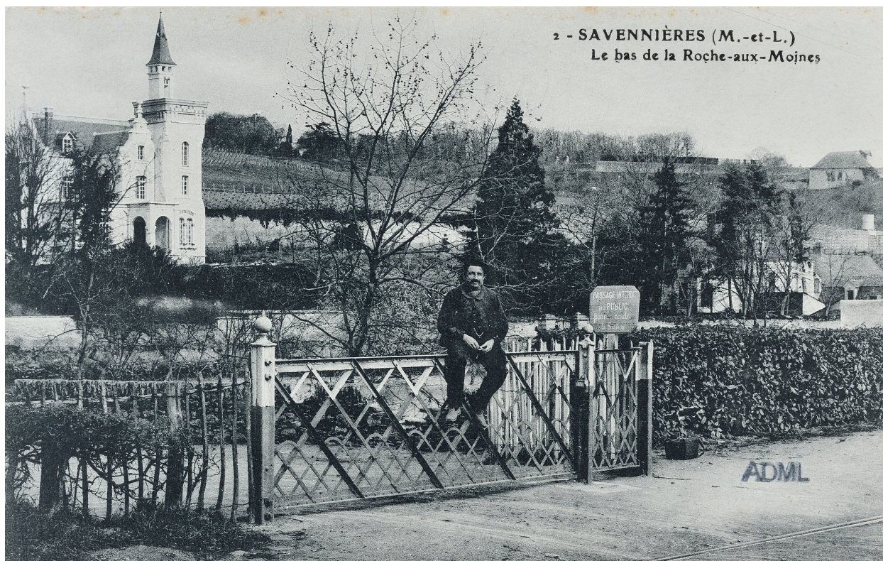
Belle-Vue. Le bas de la Roche-aux-Moines. Carte postale. 1er quart 20e siècle.