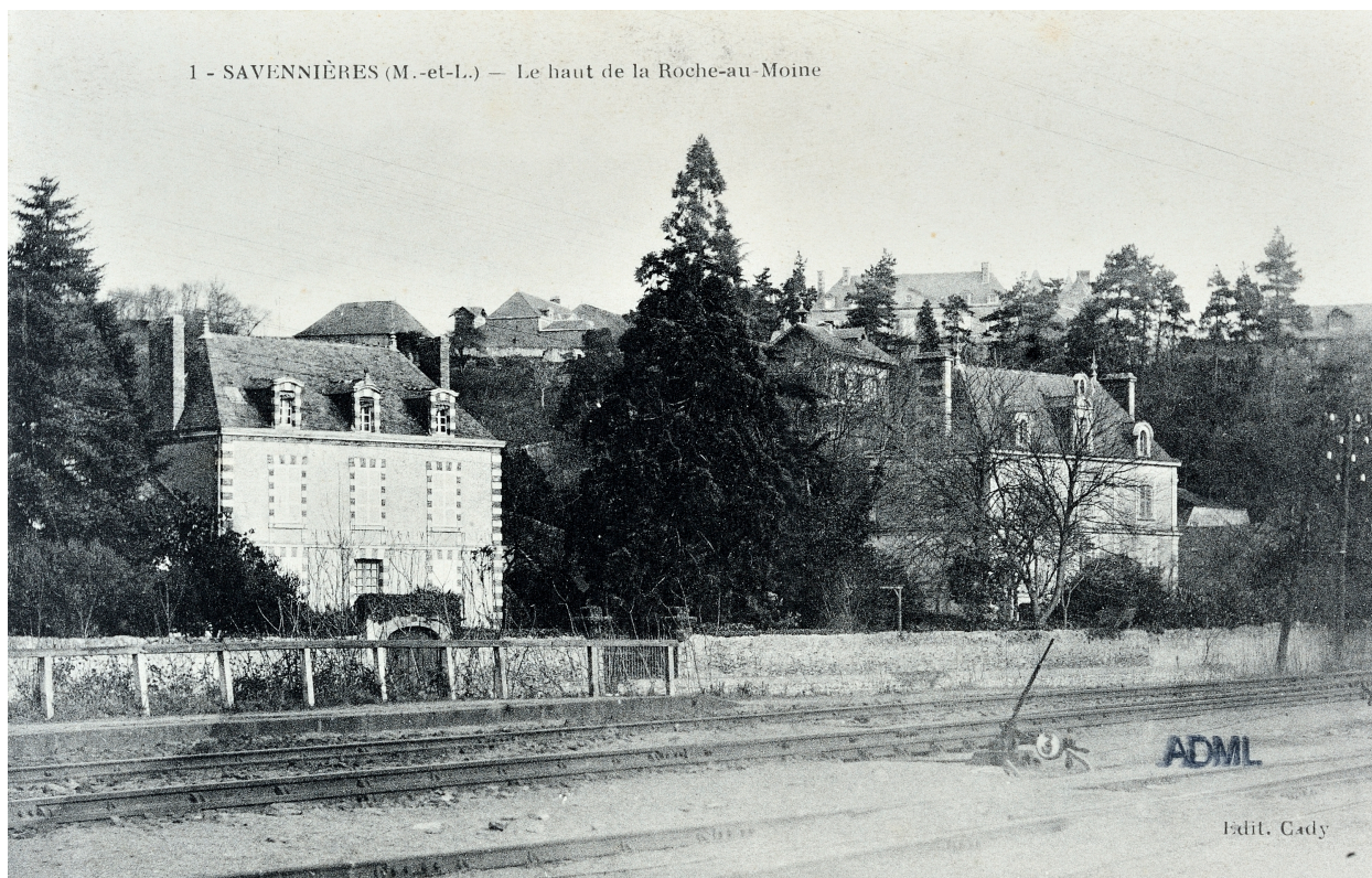
Savennières - Le haut de la Roche-au-Moine. Carte postale. 1er quart 20e siècle.