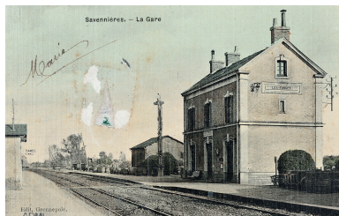
Vue d'ensemble de la gare depuis le sud. Carte postale. 1er quart 20e siècle. IVR52_20174900698NUCA