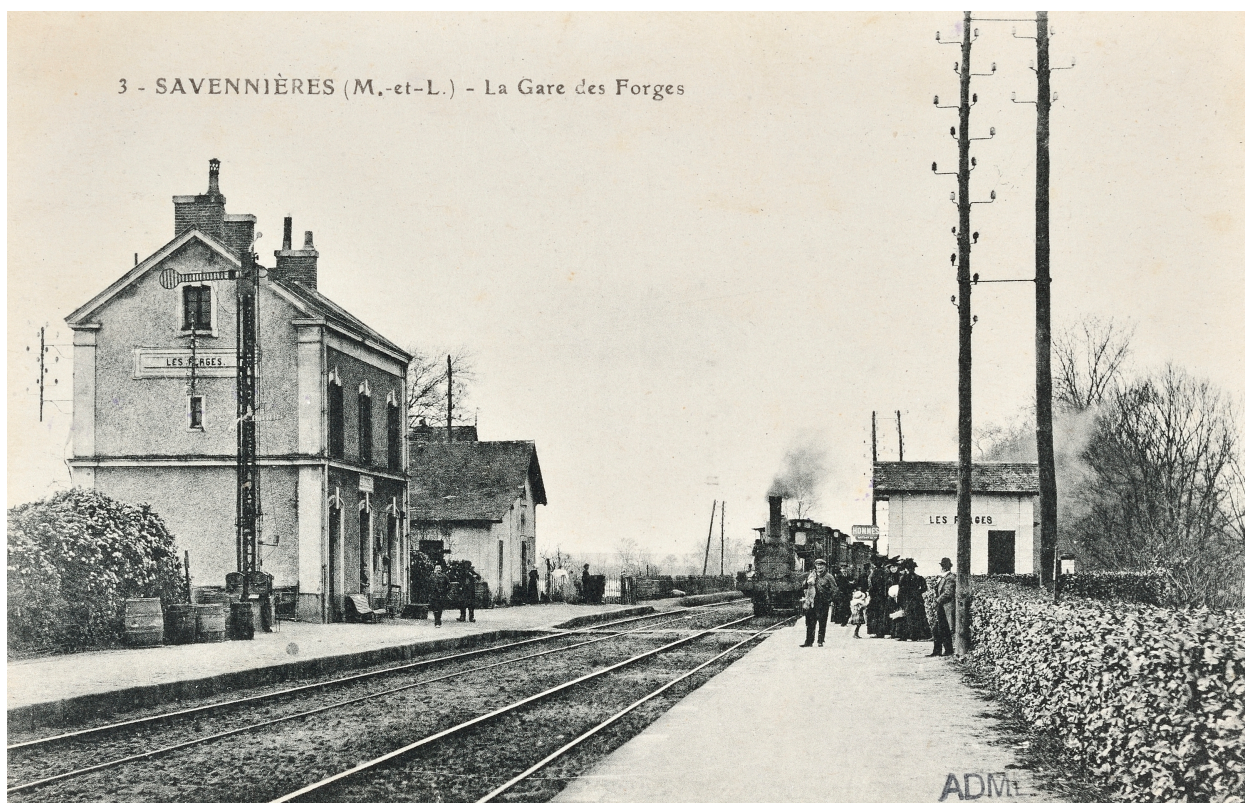
La gare des Forges. Carte postale. 1er quart 20e siècle.