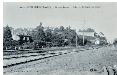
Savennières - Gare des Forges - Village de la Roche aux Moines. Carte postale. 1er quart 20e siècle. IVR52_20174900635NUCA