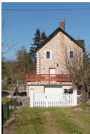
L'ancien café de la gare. Vue du pignon nord.