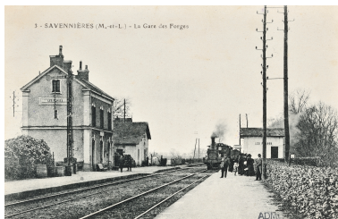
La gare des Forges. Carte postale. 1er quart 20e siècle.