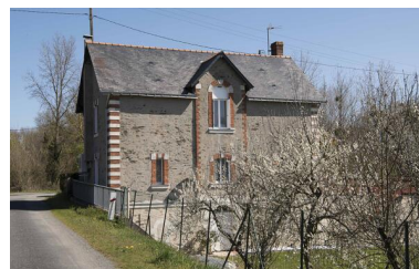
L'ancien café de la Gare. Vue depuis le sud. IVR52_20194900073NUCA