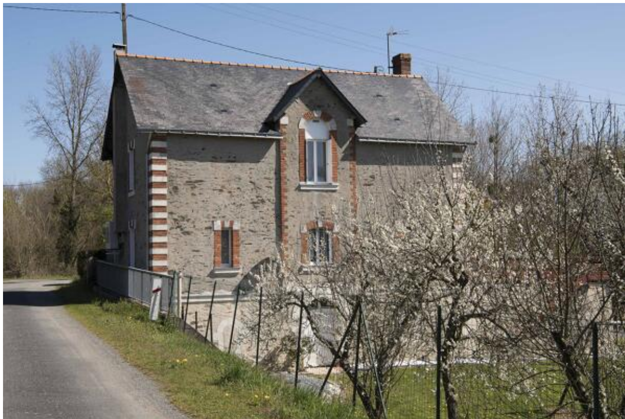
L'ancien café de la Gare. Vue depuis le sud.