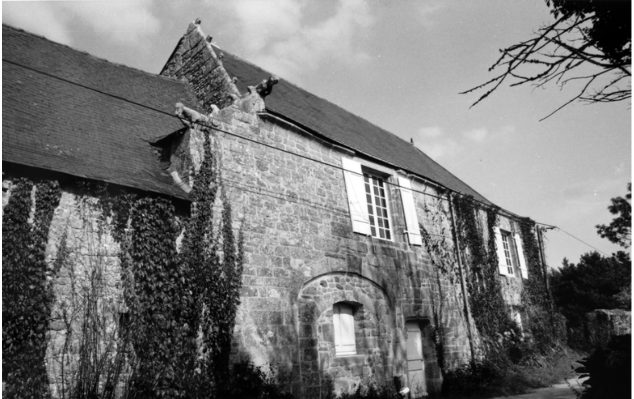
Logis. Façade sud. 1990.