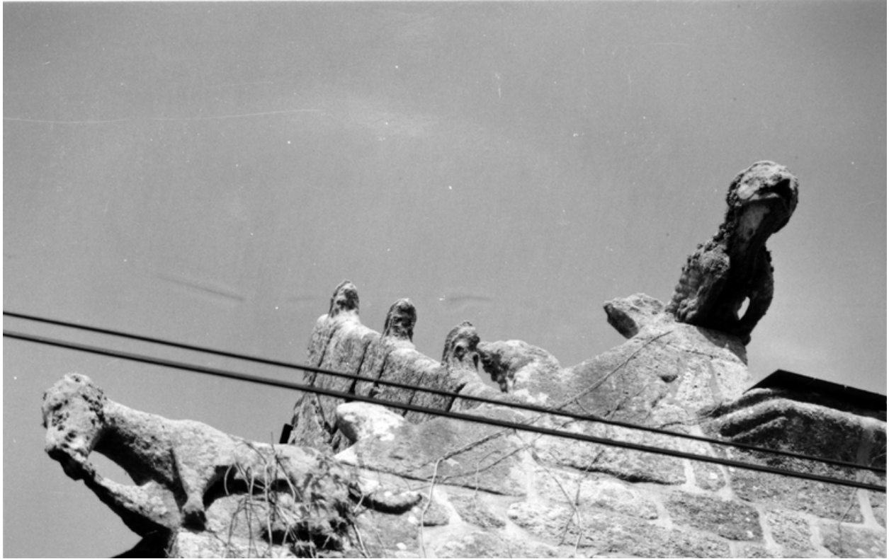
Logis. Détail des crossettes sculptées sur le pignon ouest. 1990.