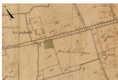
Extrait du plan cadastral de 1818, section Y2, parcelle n° 1029. IVR52_20094404131NUCA