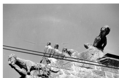
Logis. Détail des crosettes sculptées sur le pignon ouest. 1990. IVR52_20094401364NUC