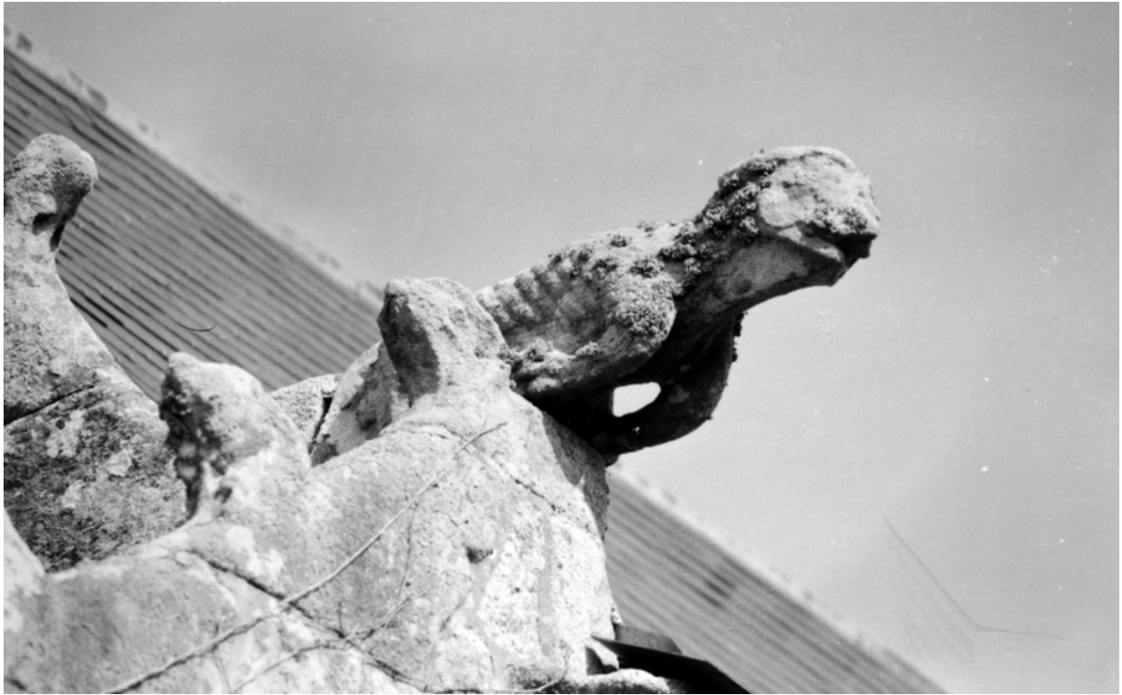
Détail d'une crossette sculptée sur le pignon ouest. 1990.