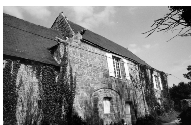
Logis. Façade sud. 1990. IVR52_20094401363NUC