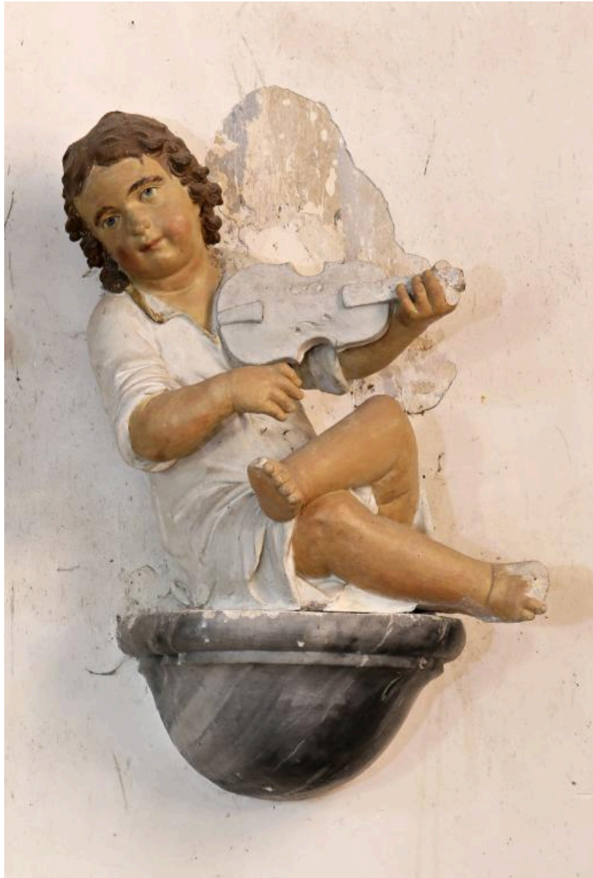
Ange jouant du violon.