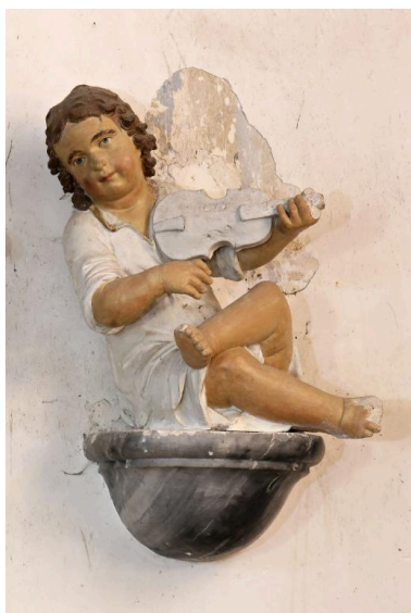
Ange jouant du violon.