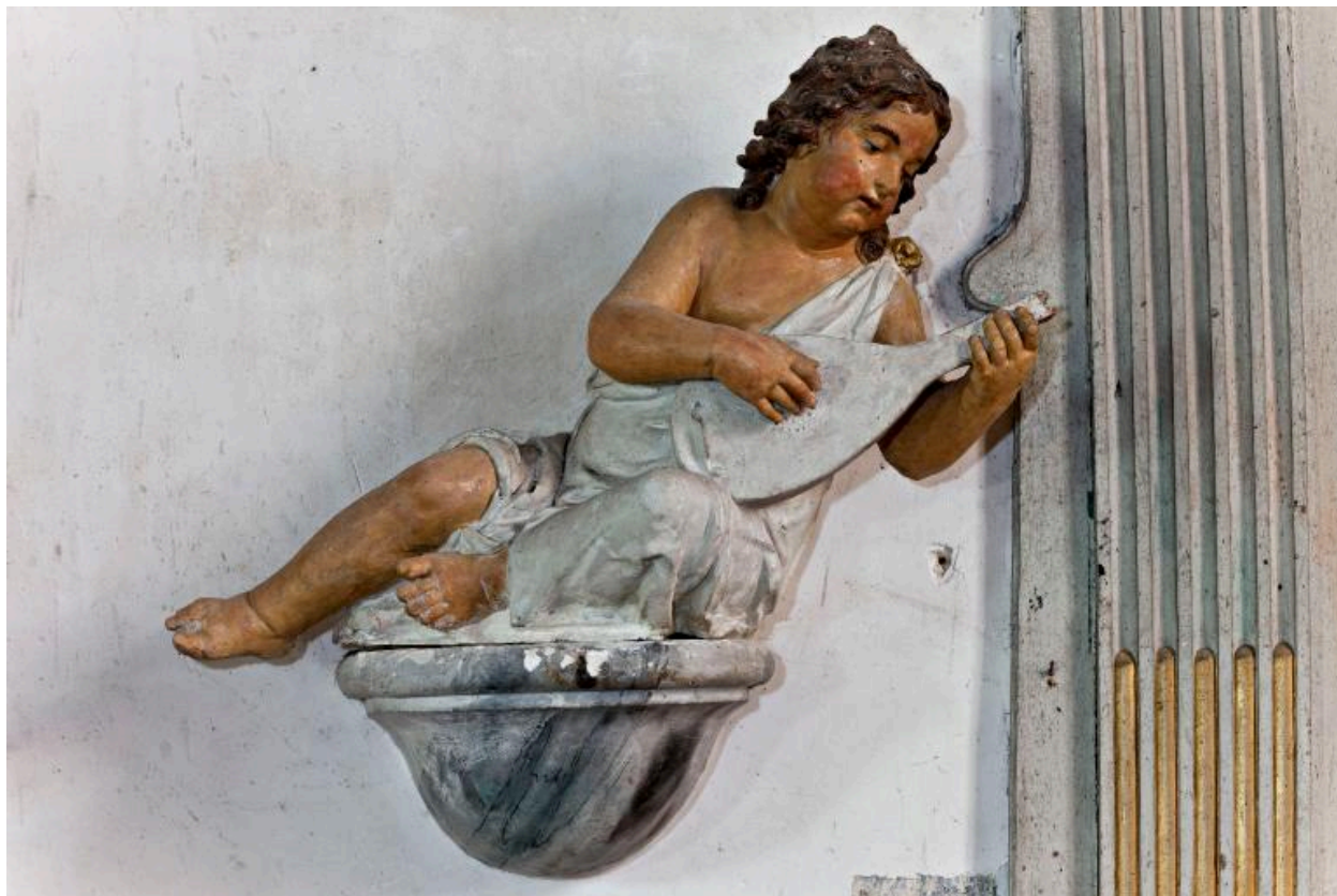
Ange jouant de la mandoline.