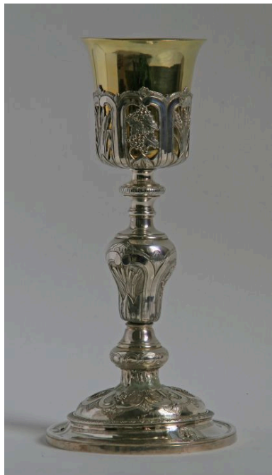
Vue générale IVR52_20097200815NUCAB