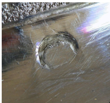
Reste du poinçon de titre à l'intérieur du pied