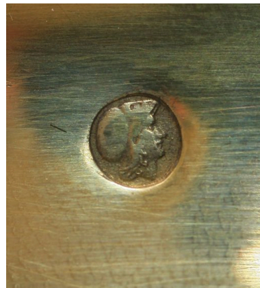
Poinçon de garantie sur le bord extérieur de la coupe IVR52_20097200872NUCAB