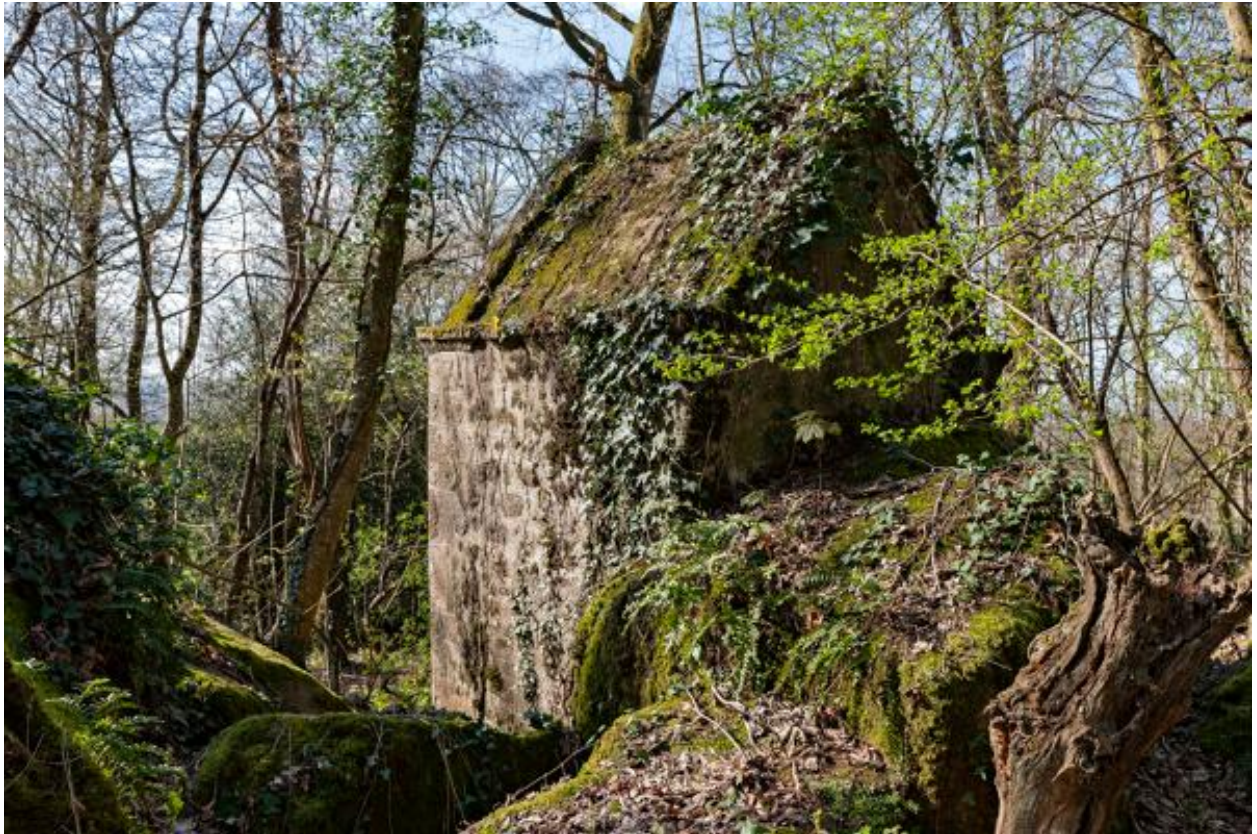
Oratoire de la Gaudinière.