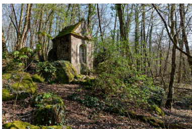
Oratoire de la Gaudinière.