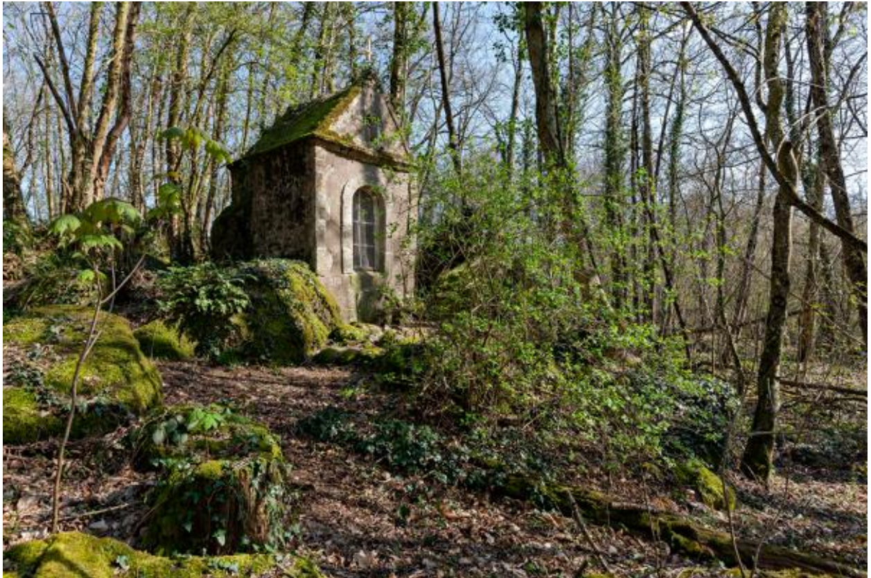
Oratoire de la Gaudinière.