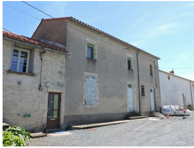
La maison du numéro 5, surélevée en 1960, vue depuis le nord.