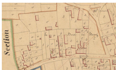
La propriété, en haut, sur le plan cadastral de 1836.