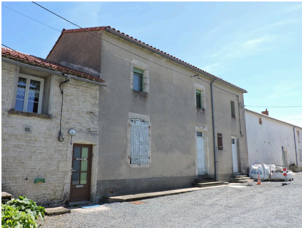
La maison du numéro 5, surélevée en 1960, vue depuis le nord.