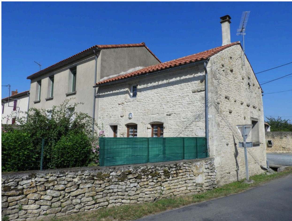
La maison du numéro 3 vue depuis l'est.