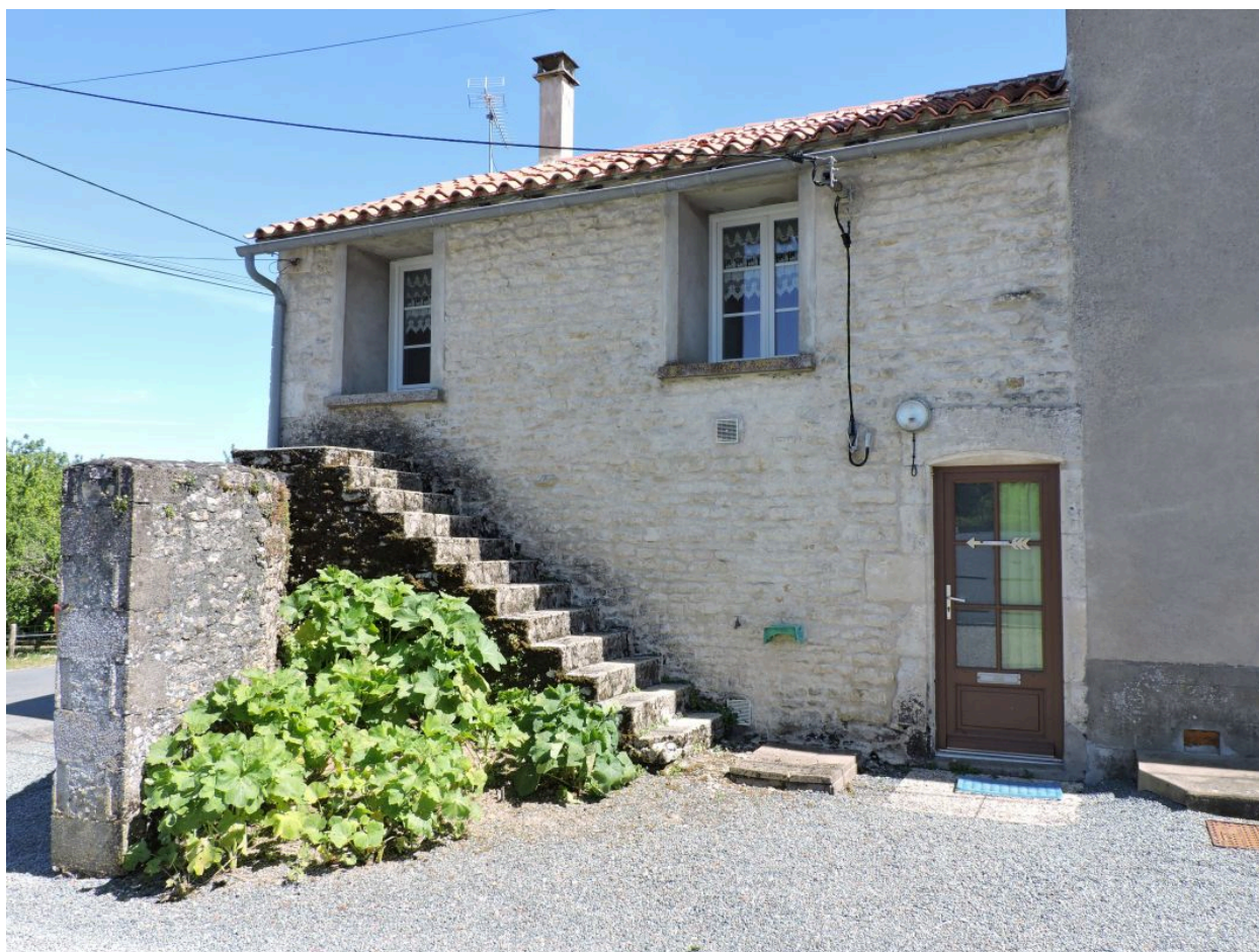
La maison du numéro 3 vue depuis le nord, avec l'escalier extérieur.