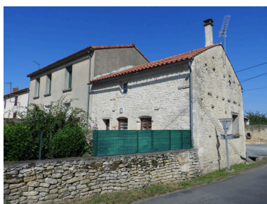
La maison du numéro 3 vue depuis l'est. IVR52_20198501710NUCA