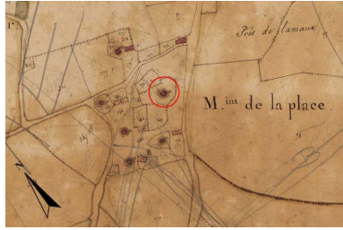
Plan masse et de situation. Extrait du plan cadastral de Guérande, année 1819, section M1, parcelle 294, échelle d'origine, 1/2500. IVR52_20084404021NUCA