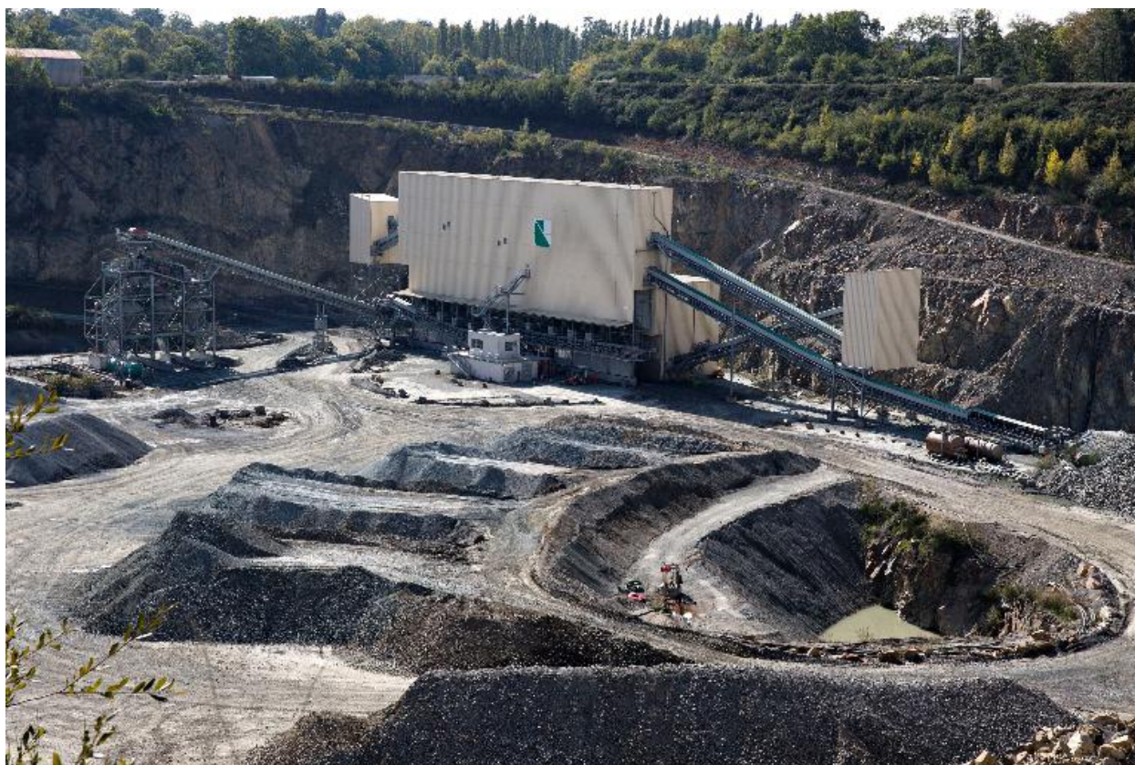
Concasseur, carrière de la Faubretière, la Haie-Fouassière