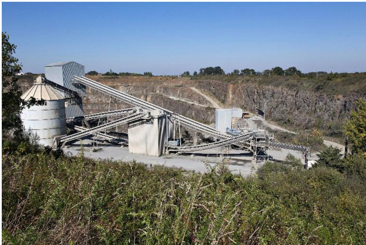
Concasseur, carrière de la Margerie, Gorges