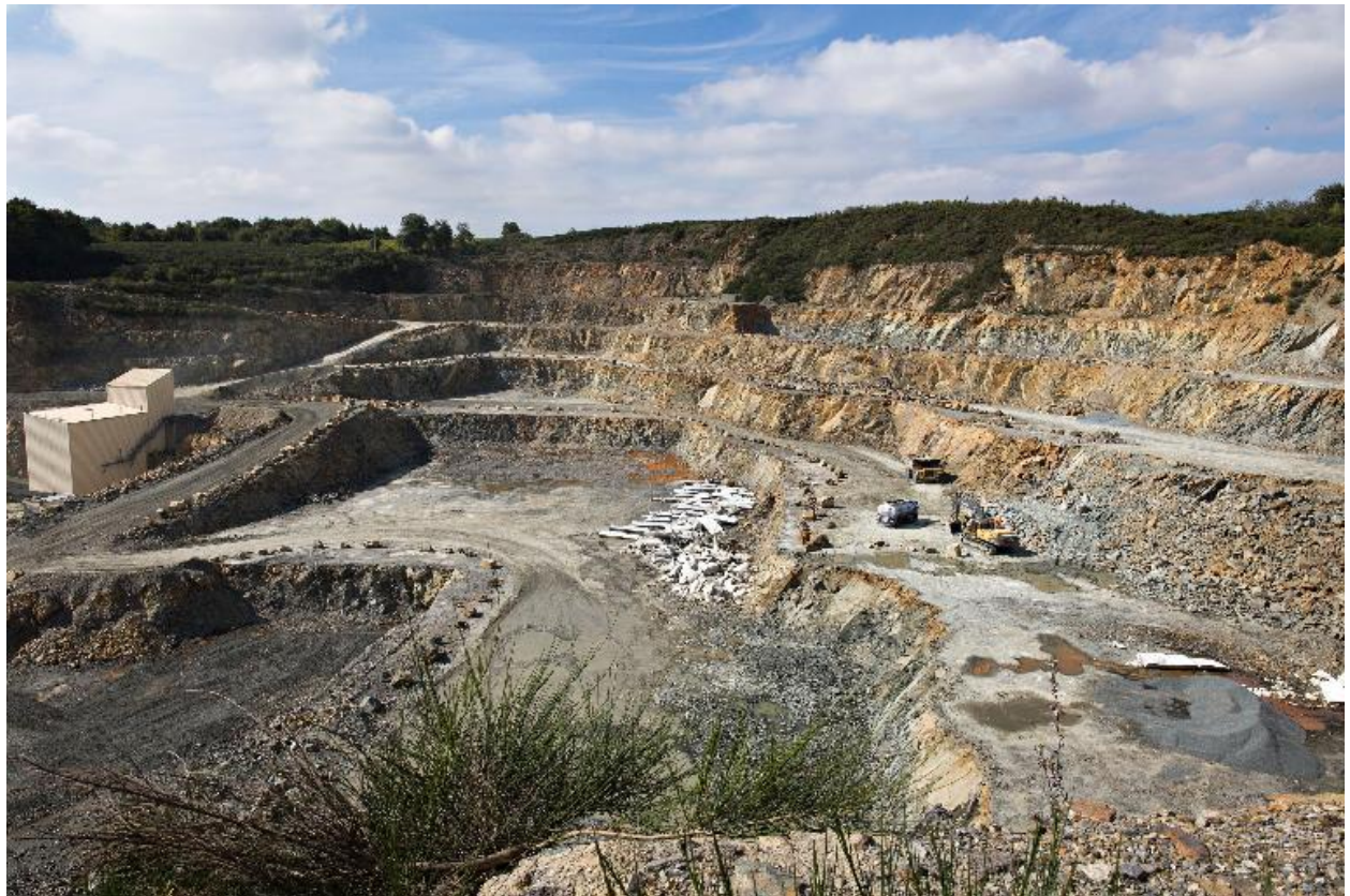
Carrière de la Faubretière, La Haie-Fouassière