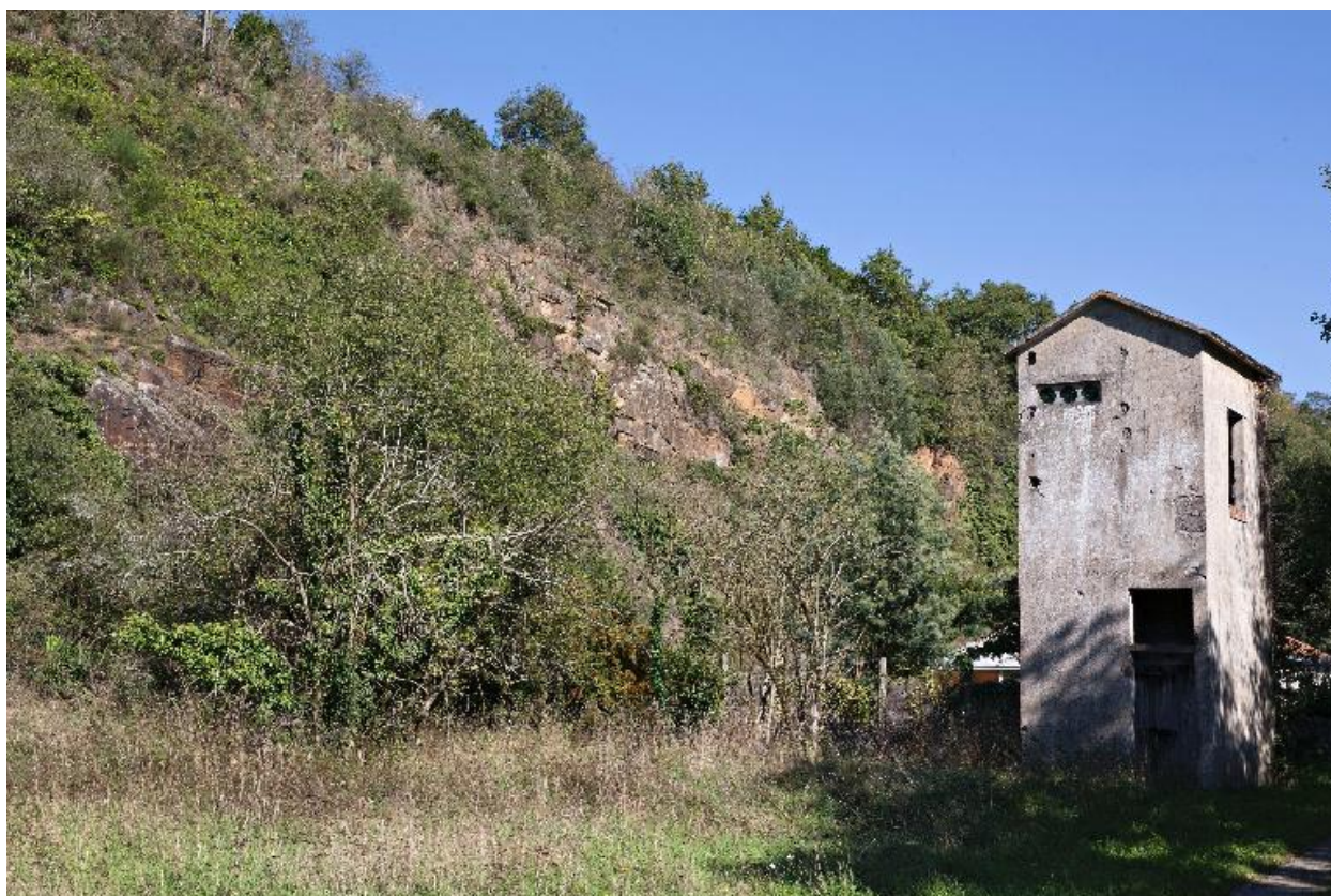
Carrière de la Rairie, La Haie-Fouassière