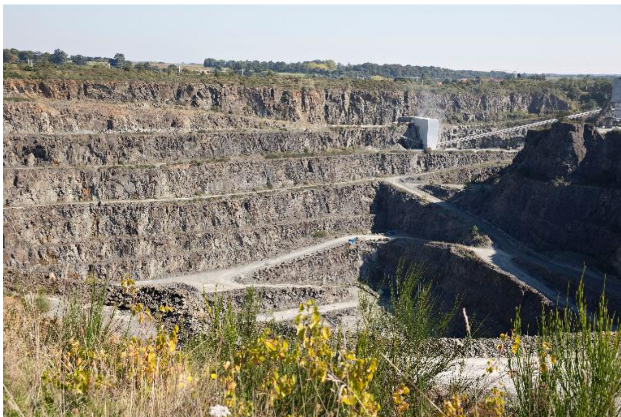
Carrière de la Margerie, Gorges