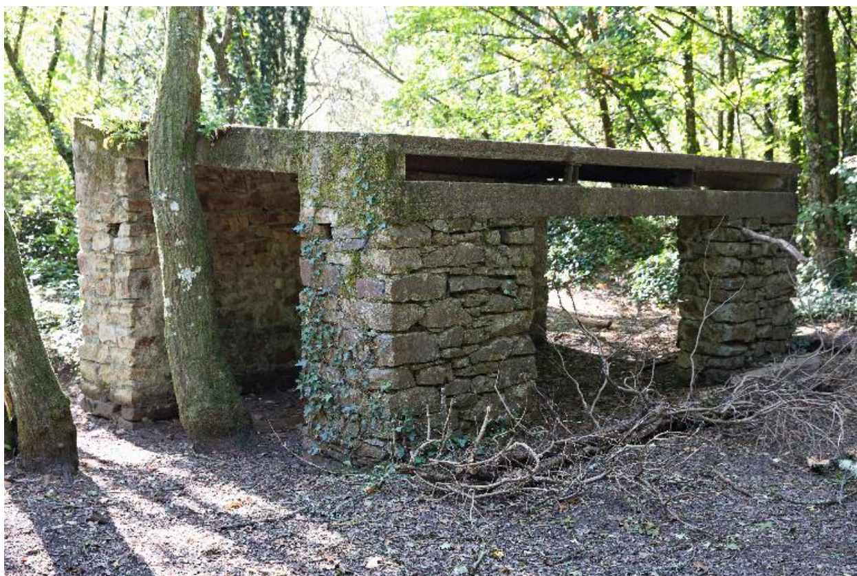
Abri pour le générateur, carrière de Pont-Caffino, Maisdon-la-Rivière