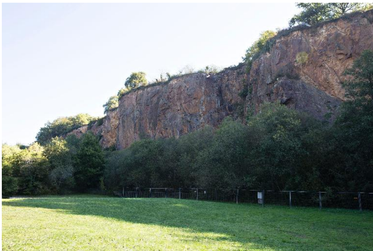
Carrière de Pont-Caffino, Maisdon-la-Rivière