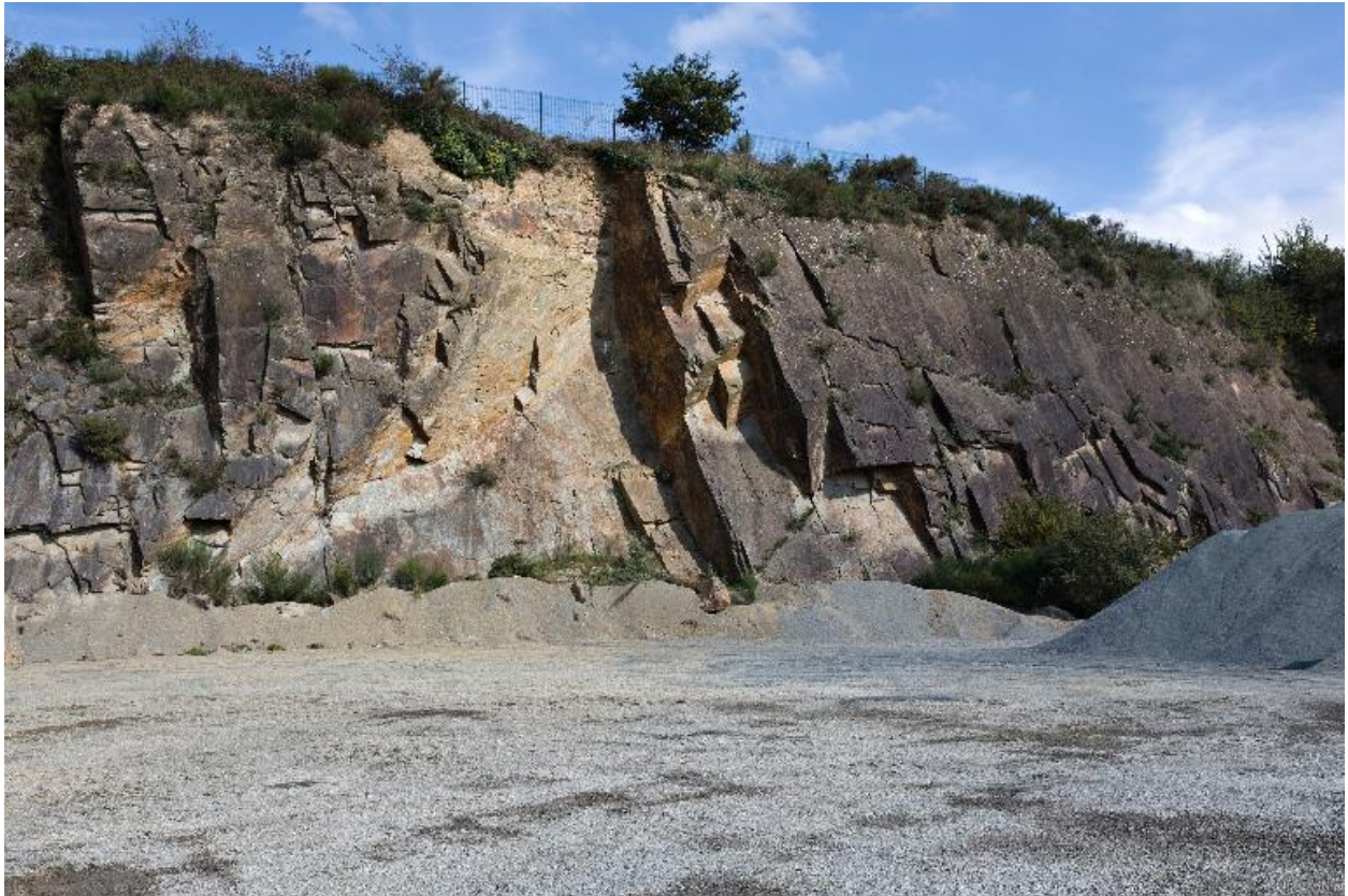
Front de taille des années 1930