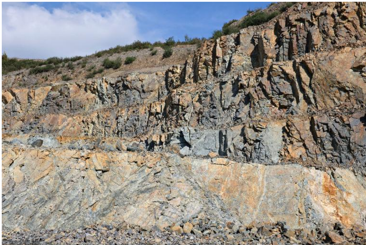
Front de taille des années 1980, Carrière de la Faubretière, La Haie-Fouassière