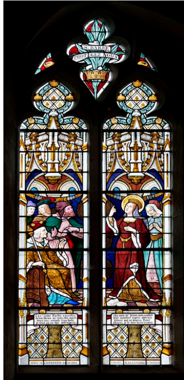
Vue d'ensemble de la verrière. IVR52_20125300123NUCA