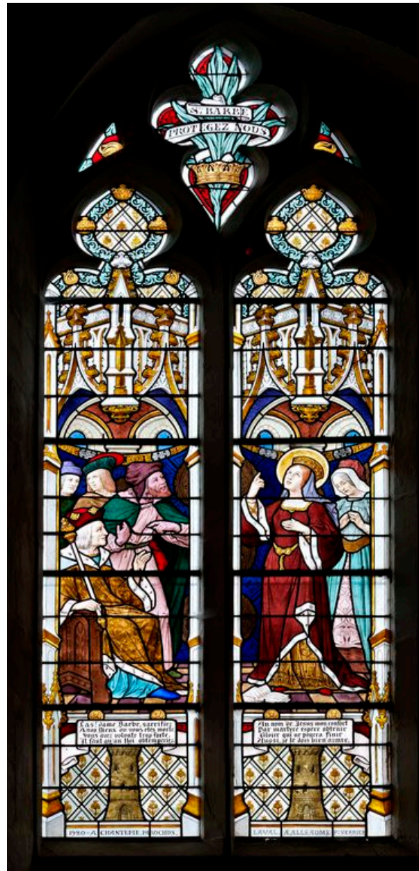
Vue d'ensemble de la verrière.