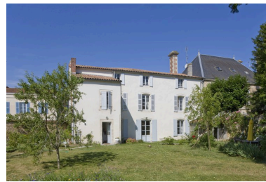
Façade est, donnant sur le jardin.