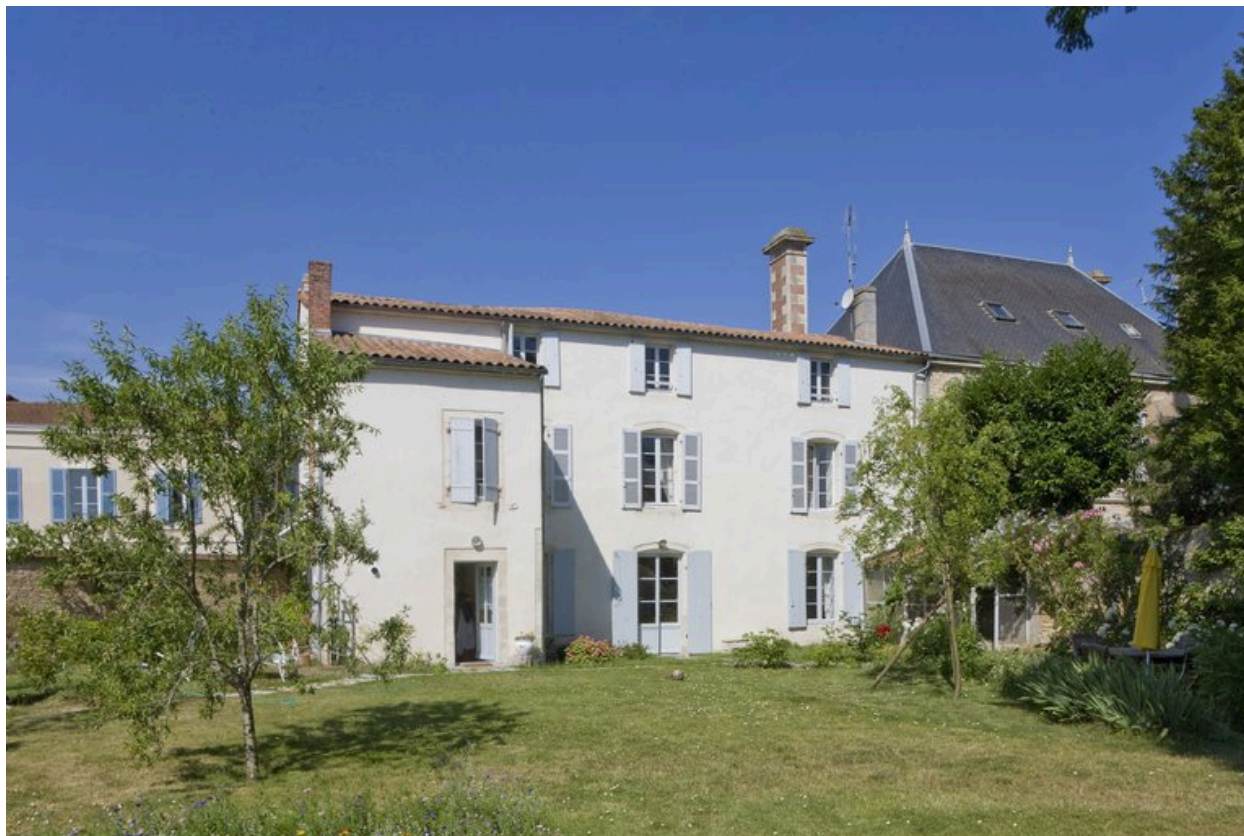
Façade est, donnant sur le jardin.