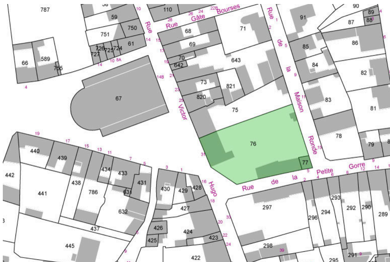
La maison sur le plan cadastral actuel.