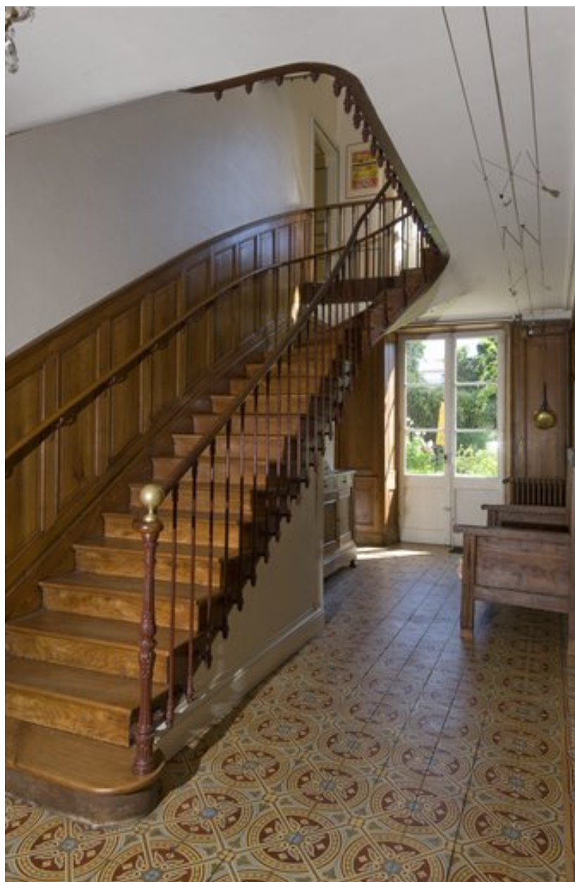
Vue de l'escalier.