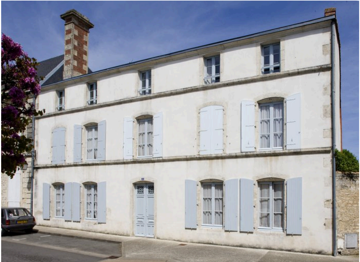
Vue de la façade sur rue.