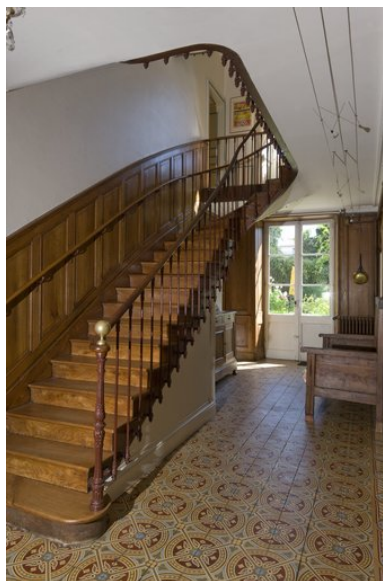
Vue de l'escalier.