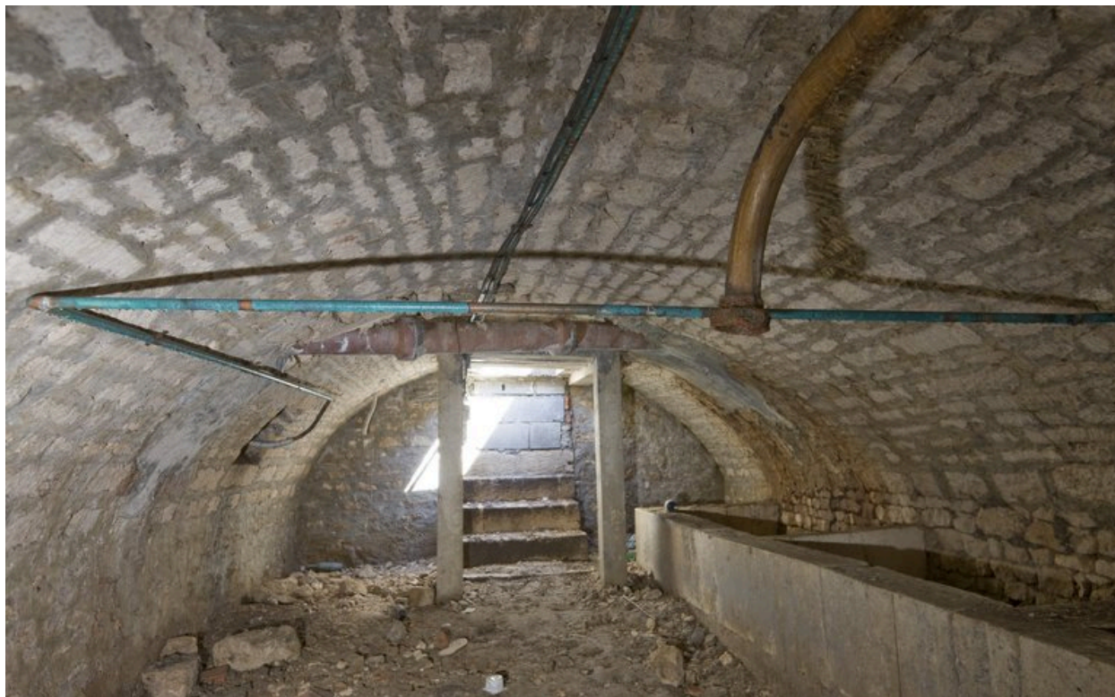
Vue du sous-sol (situé sous les communs détruits au XXe siècle), prise en direction de l'entrée.