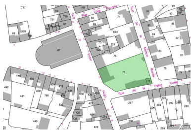
La maison sur le plan cadastral actuel.