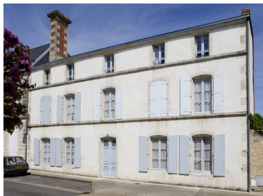
Vue de la façade sur rue. IVR52_20108500169NUCA