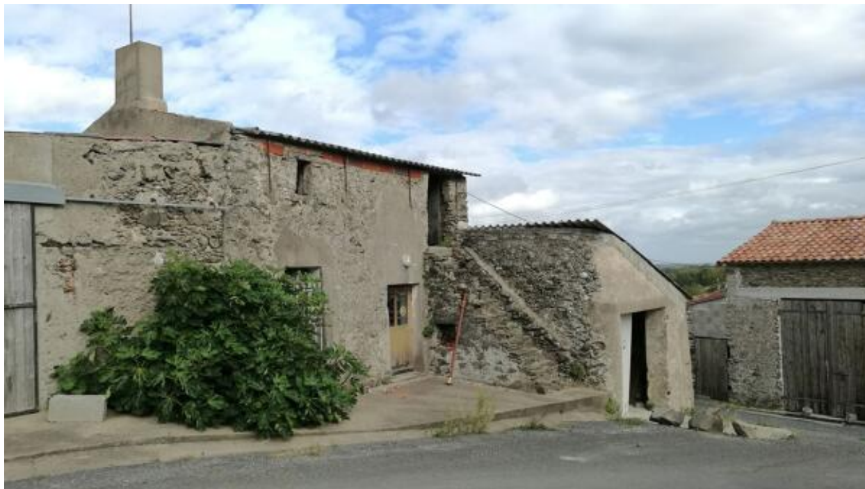
Le Haut-Puiset. Vue de la ferme n° 1.