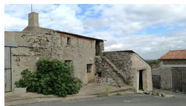
Le Haut-Puiset. Vue de la ferme n° 1.