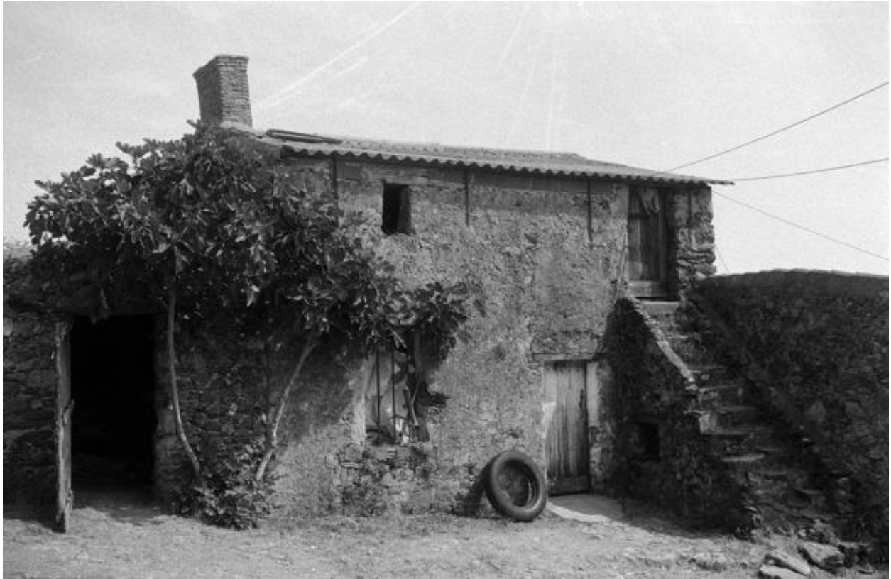
Le Haut-Puiset. Vue de la ferme en 1972.