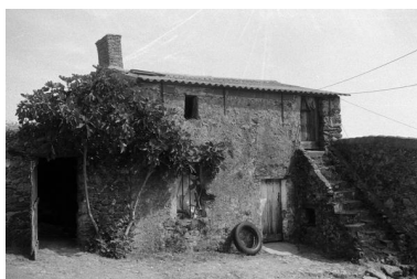
Le Haut-Puiset. Vue de la ferme en 1972. IVR52_19724900555Z