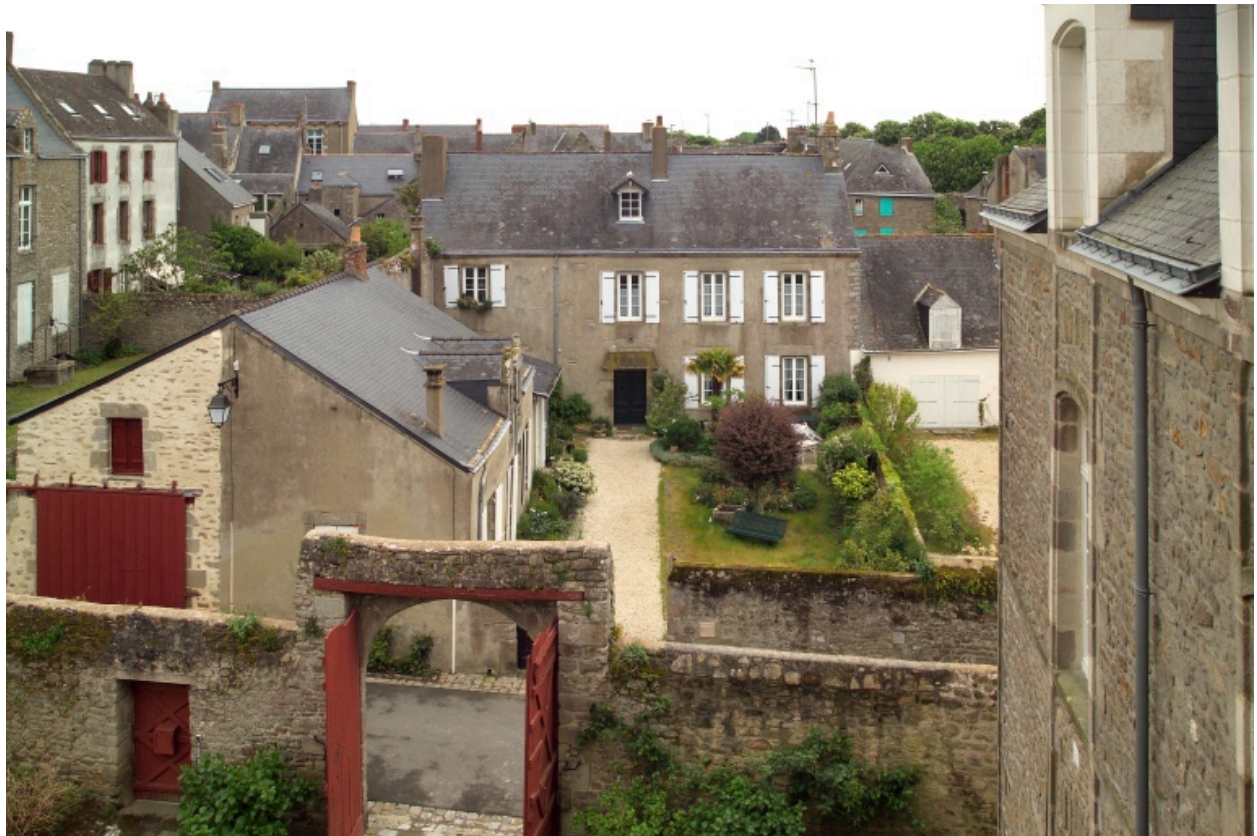
Vue de la partie nord.