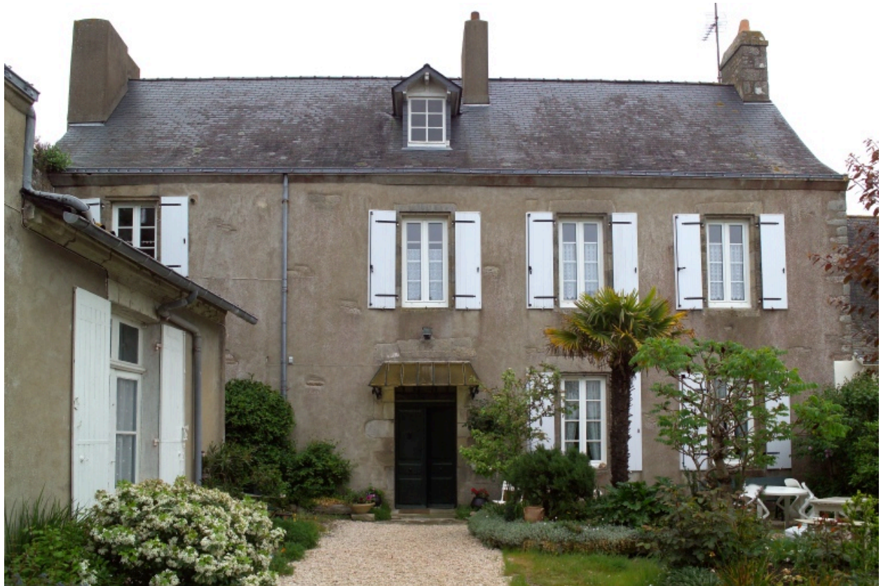
Vue de la façade sur rue de la partie nord.