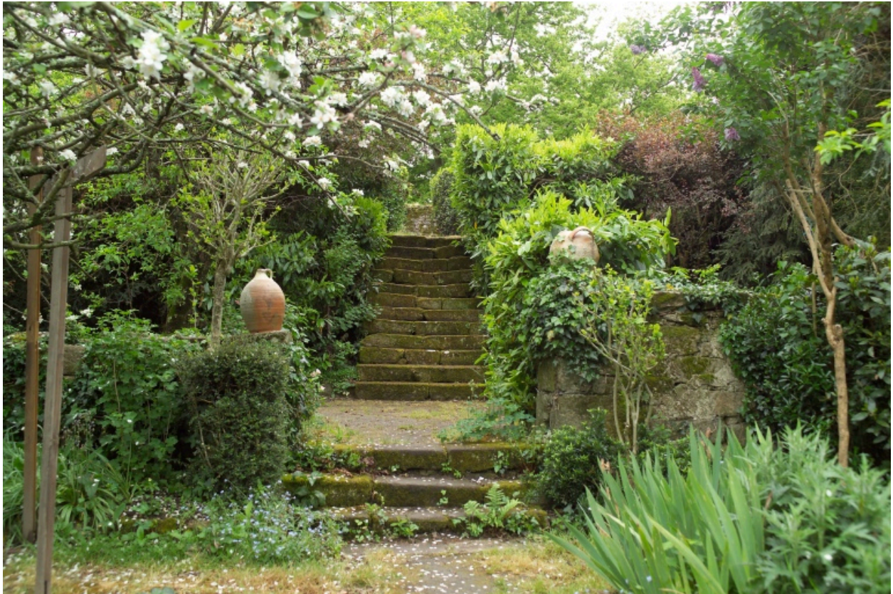
Vue de l'escalier conduisant au chemin de ronde de l'enceinte de ville.