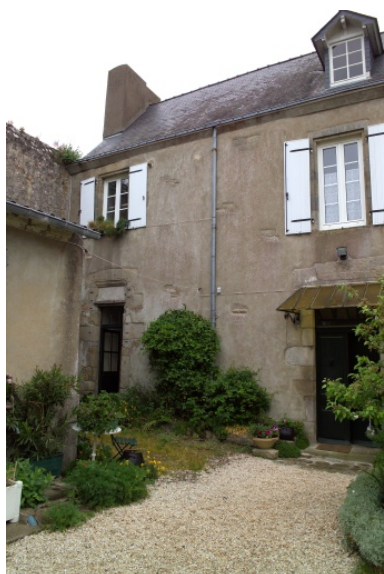
Détail de la façade de la partie nord. IVR52_20074400842NUCA