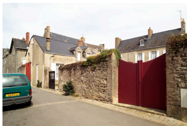
Vue générale depuis la rue du Tricot.