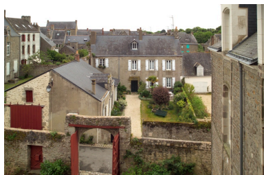
Vue de la partie nord.