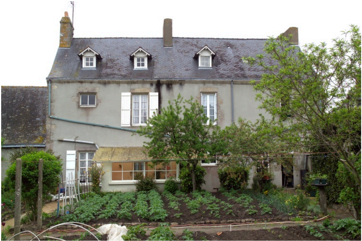
Vue de la façade arrière de la partie nord.