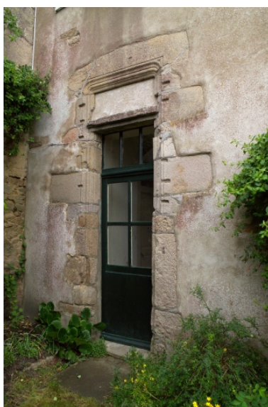
Détail d'une porte de la façade sur rue de la partie nord.