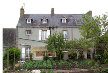
Vue de la façade arrière de la partie nord.