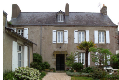
Vue de la façade sur rue de la partie nord. IVR52_20074400843NUCA