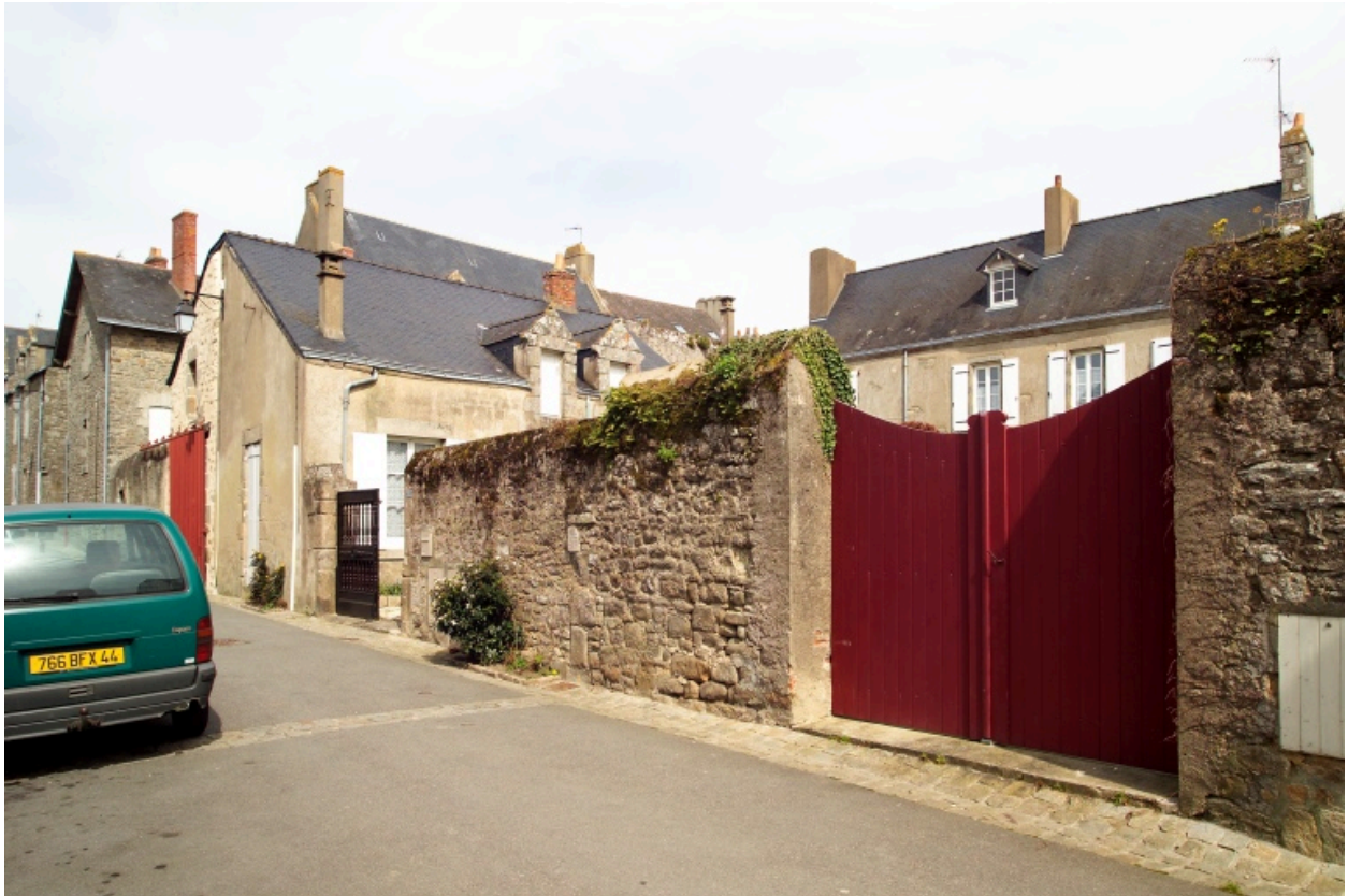
Vue générale depuis la rue du Tricot.