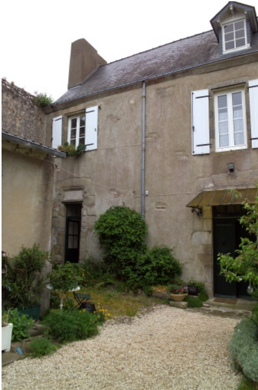
Détail de la façade de la partie nord.