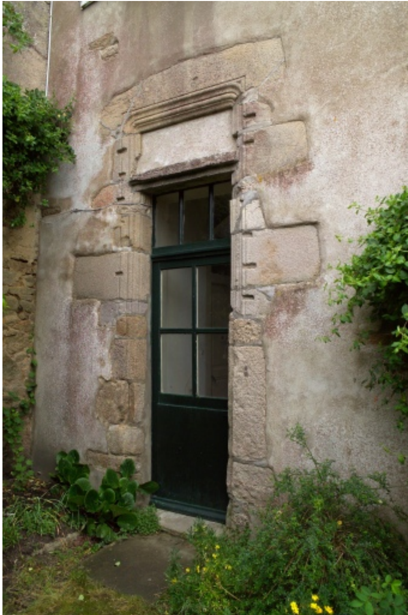
Détail d'une porte de la façade sur rue de la partie nord.