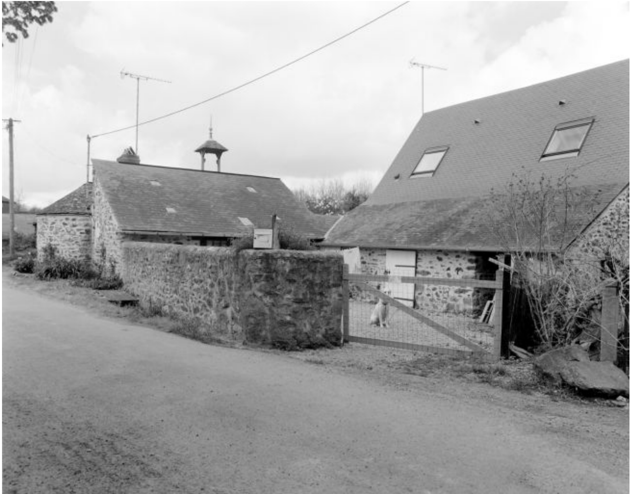
Les anciennes dépendances. Parties sud-ouest : le fournil et la porcherie.