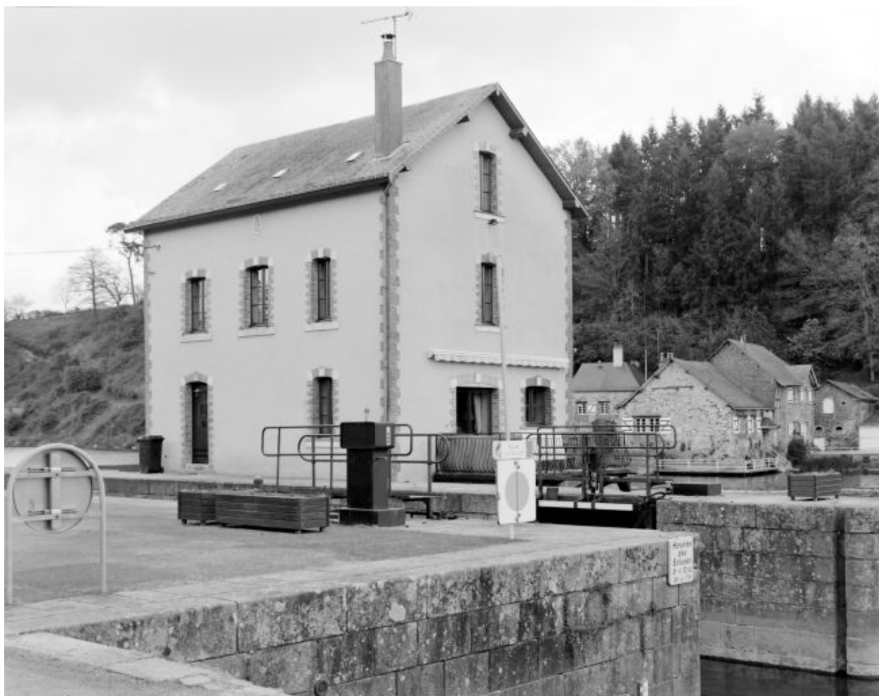
Les façades nord-ouest et sud-ouest (en aval).