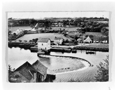
Vue d'ensemble du site du moulin depuis la rive gauche : moulin, écluse, maison éclusière, dépendances du moulin (four à pain, porcherie, étable, maison du meunier).

IVR52_20015300684X