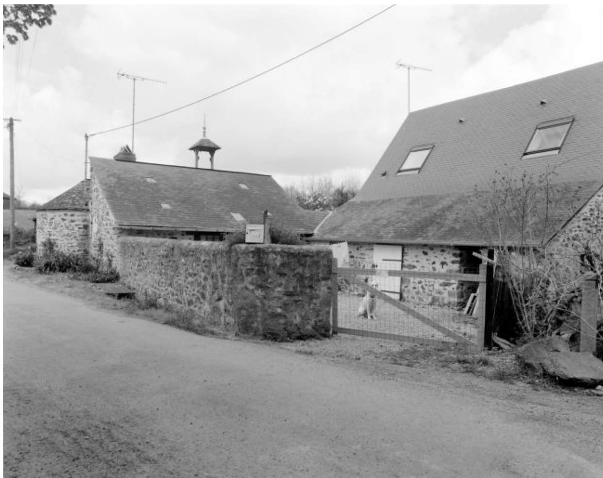
Les anciennes dépendances. Parties sud-ouest : le fournil et la porcherie.