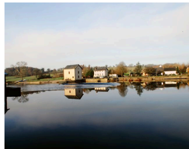
Vue d'ensemble du site du moulin depuis la rive gauche, en amont : barrage, pertuis, moulin, maison éclusière. A droite, les anciennes dépendances, transformées en gîte et en restaurant.