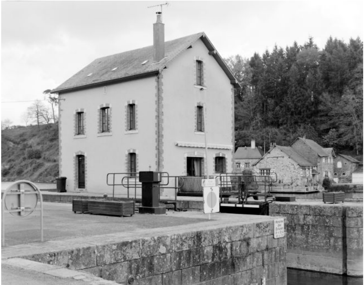
Les façades nord-ouest et sud-ouest (en aval).