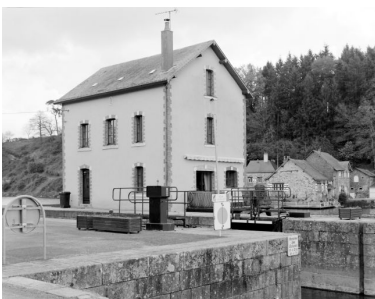
Les façades nord-ouest et sud-ouest (en aval).