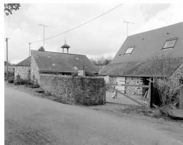
Les anciennes dépendances. Parties sud-ouest : le fournil et la porcherie.