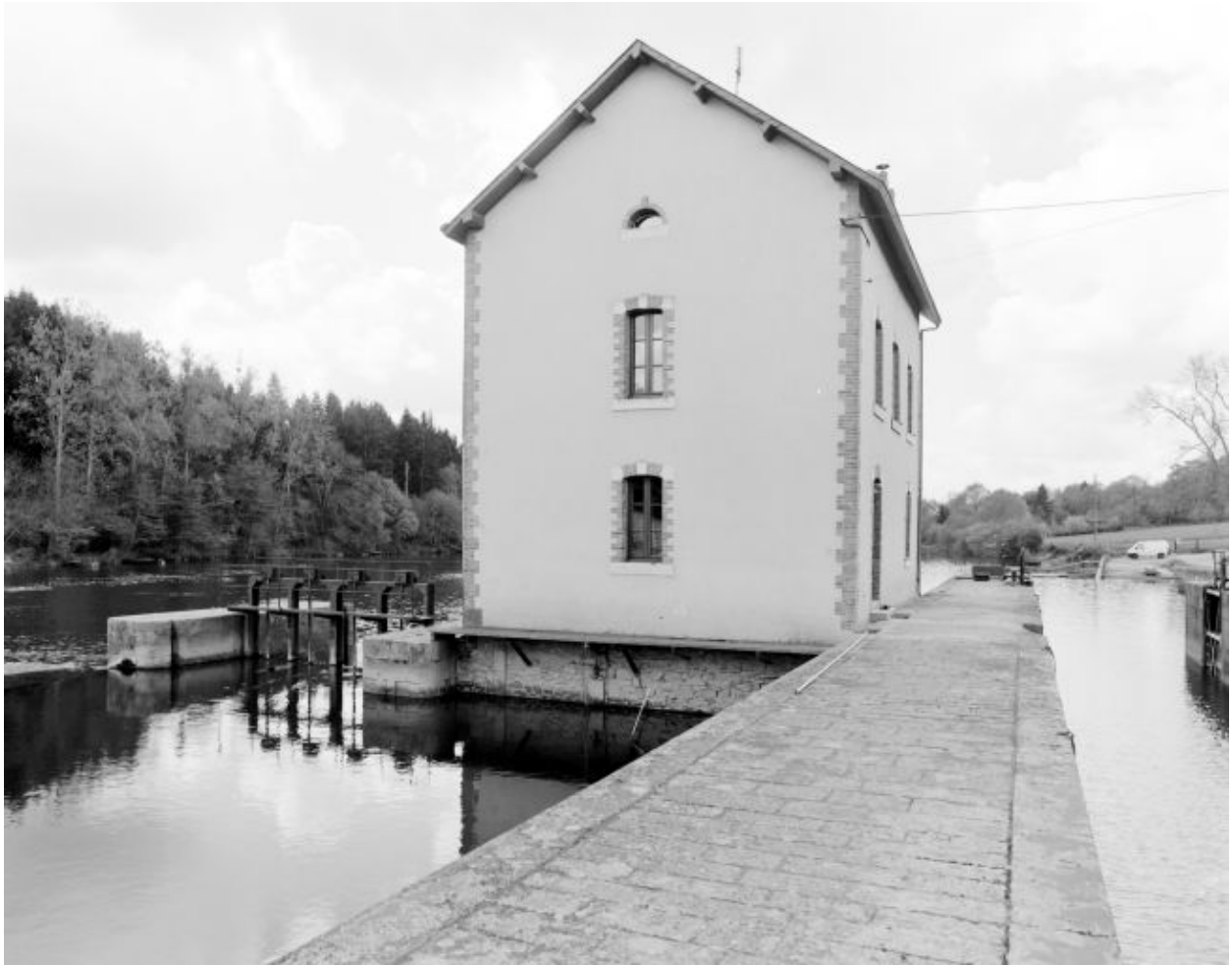
La façade nord-est, en amont. A gauche, le pertuis. A droite, l'écluse.