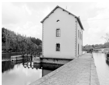
La façade nord-est, en amont. A gauche, le pertuis. A droite, l'écluse.