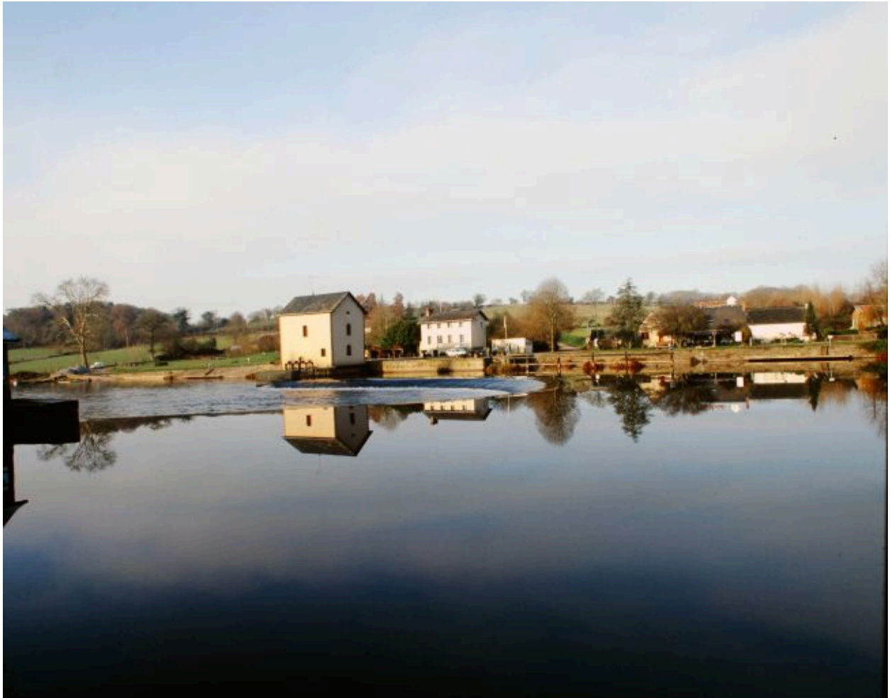
Vue d'ensemble du site du moulin depuis la rive gauche, en amont : barrage, pertuis, moulin, maison éclusière. A droite, les anciennes dépendances, transformées en gîte et en restaurant.